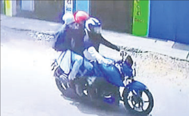
ବାଇକ୍‌ରେ ଡକାଯିବ ପରେ ୩ ଡକାଯିବ ପକାଇ ଯାଇଛନ୍ତି।