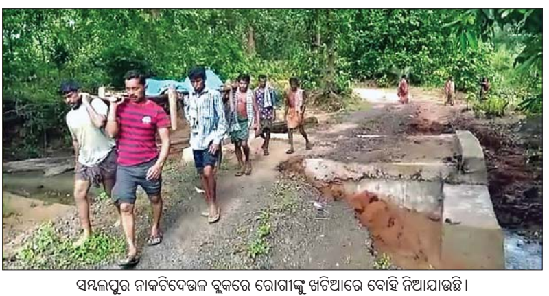
ସମ୍ବଳପୁର ନାକଟିଦେଉଳ ବ୍ଲକ୍‌ରେ ରୋଗୀଙ୍କୁ ଖଟିଆରେ ବୋହି ନିଆଯାଉଛି।

ସରକାର ଗ୍ରାମାଞ୍ଚଳର ବିକାଶକୁ ଗୁରୁତ୍ୱ ଦେଇ ବିଭିନ୍ନ ଯୋଜନା କାର୍ଯ୍ୟକାରୀ କରୁଛନ୍ତି। ଏଥିପାଇଁ ବିପୁଳ ଅର୍ଥ ବ୍ୟୟ ହେଉଛି। କିନ୍ତୁ ବାସ୍ତବ କ୍ଷେତ୍ରରେ ଭଲଭଲ ଯୋଜନାର ସୁଫଳ ଗ୍ରାମାଞ୍ଚଳରେ ପହଞ୍ଚି ପାରୁନାହିଁ। ରାଜନୈତିକ ଇଚ୍ଛାଶକ୍ତି ଏବଂ ପ୍ରଶାସନର ଆନ୍ତରିକତା ଅଭାବ ଯୋଗୁଁ ସାଧାରଣ ଦୀର୍ଘ ସାତ ଦଶନ୍ଧି ପରେ ବି ସମ୍ବଳପୁର ଜିଲ୍ଲା ନାକଟିଦେଉଳ ବ୍ଲକ୍‌ର କମଳାନାଳା ଏବଂ ବଡ଼ବିଲ ପରି ଦୁର୍ଗମ ଗ୍ରାମରେ ବିକାଶର ପୂର୍ଣ୍ଣ ଉର୍ଦ୍ଧ୍ୱ ପାରିନାହିଁ। ଆଜି ସୁଦ୍ଧା ଏହି ଦୁଇ ଗ୍ରାମର ଲୋକେ ବର୍ଷା ଦିନେ ଏକ ପ୍ରକାରର ଅଭିଶପ୍ତ ଜୀବନ ନେଇ ଜିଲ୍ ରହିବାକୁ ବାଧ୍ୟ ହେଉଛନ୍ତି।