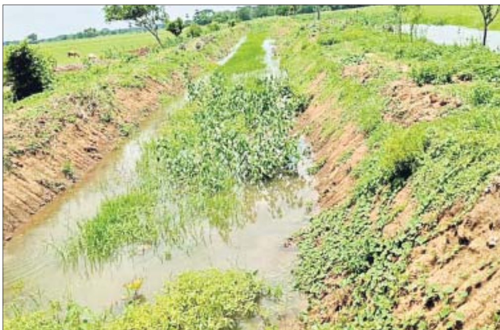
ପଟାମୁଣ୍ଡାଲ ଦେହ ନୟର (କ) କେନ୍ଦ୍ରାପଡ଼ା ଶୁଖିଲା ପଡ଼ିଛି।

ସରକାର କୃଷି ଓ କୃଷକର ଉନ୍ନତି ନିମନ୍ତେ ବିଭିନ୍ନ ଯୋଜନା କାର୍ଯ୍ୟକାରୀ କରୁଛନ୍ତି। ଏଥିନିମନ୍ତେ ସରକାର ଲକ୍ଷାଧିକ ଟଙ୍କାର ଅନୁଦାନ ଯୋଗାଇ ଦେଉଛନ୍ତି।