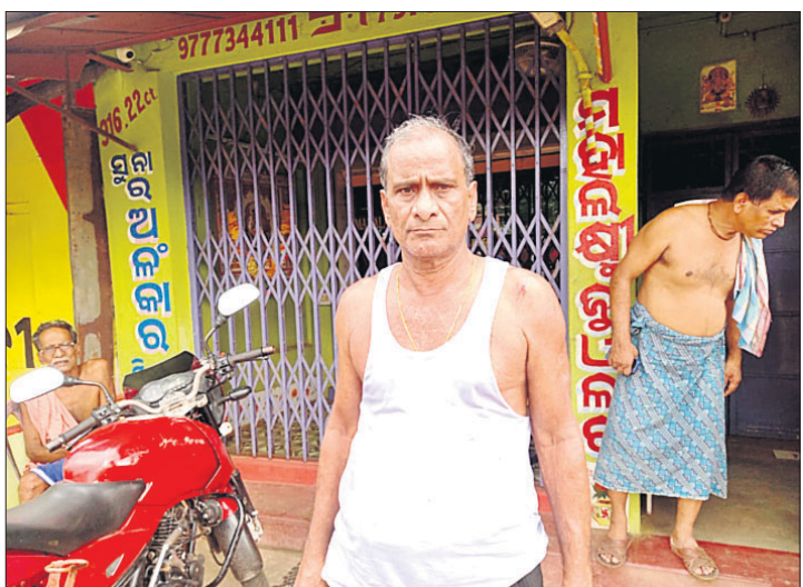
ଗୋଡ଼ିପଡ଼ା ମହାଲକ୍ଷ୍ମୀ କ୍ଲବ୍‌ଲେରି ଡକାଯିବ ହୋଇଛି।