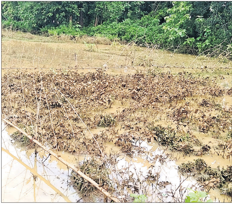
ଧାନ ଜମିରେ ବନ୍ୟା ପାଣି ମାଡିଯିବାରୁ ବାଲିଚର ହୋଇଯାଇଛି।