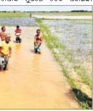
ଜଗତ୍ସିଂହପୁର ସହର ବଜାର ଛକରେ ରାସ୍ତାବନ୍ଦୀ କରାଯାଇଛି।

ଅବସରରେ ରୁଚିକା ଆତ୍ମହତ୍ୟା ପାଇଁ ଦାୟୀ ଅଭିଯୁକ୍ତମାନଙ୍କ ବିରୋଧରେ ସମର୍ଥନ କରି ସେମାନଙ୍କ ବ୍ୟବସାୟ ସଙ୍ଗଠନ ପକ୍ଷରୁ ଦାବି କରାଯାଇଛି।