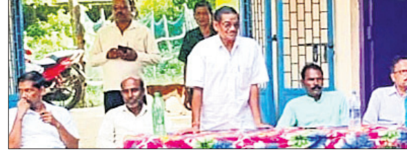
ବୈଠକରେ ଯୋଗଦେଇଥିବା ଅତିଥିମାନେ।

ଏରସମା, ୧୯୧୭ (ସ.ସ.): ଏରସମା ରୁକ୍ଷ ଅନ୍ତର୍ଗତ ପୋଖରିଆପଡ଼ା ପଞ୍ଚାୟତରାଜ ଉଚ୍ଚ ବିଦ୍ୟାଳୟ ପଞ୍ଚମ ପଠକ୍ରମ ସମୀକ୍ଷା କମିଟିର ୪-ତମ ବୈଠକ ଗଠନ କରାଯାଇଛି।