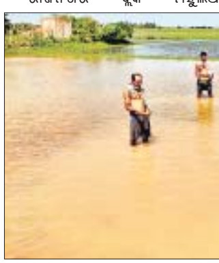
ରାଜନଗର ବ୍ଲକ୍ ମହୁଲିଆ ମୌଜାର ତଳି ଘେରାରେ ପାଣି ଜମି ରହିଛି।

କେନ୍ଦ୍ରାପଡ଼ା ଜିଲ୍ଲା ରାଜନଗର ବ୍ଲକ୍ ଅଞ୍ଚଳରେ ଗତ ୫ ଦିନ ହେଲା ଲାଗଣ ବର୍ଷା ଲାଗି ରହିଛି। ଚାଷୀ ବିଲରେ ହଳ କରି ଧାନ ବିହନ ବୁଣି ଥିଲେ।