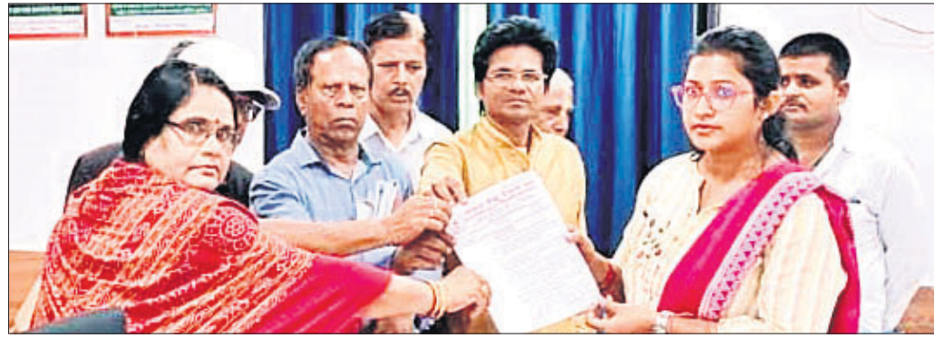
ମଞ୍ଚ ପକ୍ଷରୁ ସହକାରୀ ଜିଲାପାଳଙ୍କୁ ଦାବିପତ୍ର।

ବ୍ରହ୍ମପୁର ଅଫିସ୍, ୧୯୧୭ ବର୍ଷା ହେଲେ ବ୍ରହ୍ମପୁର ସହରର ପୁଖ୍ୟ ଛକରେ ଜପୁଛି ନର୍ଦ୍ଦମା ପାଣି। ଦୀର୍ଘ ସମୟ ଧରି ବର୍ଷା ଜଳ ନିଶ୍ଚାସନ ହୋଇ ନ ପାରିବାରୁ ମୁଖ୍ୟ ରାସ୍ତାରେ କୃତ୍ରିମ ବନ୍ୟା ଦେଖାଦେଉଛି।