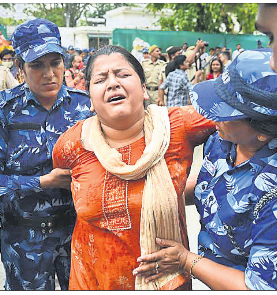
କେନ୍ଦ୍ର ସରକାରଙ୍କ ଦରବୁଜି, ବେକାରି ଓ ବକିତ ମୁଦ୍ରାଝାଡ଼ିକୁ ନେଇ ନ୍ୟୁସ୍‌ପେପରରେ ମଙ୍ଗଳବାର ଯୁବକଗ୍ରୋସ୍ ଦାଖଲ କରାଯାଇଥିବା ଦୃଶ୍ୟ