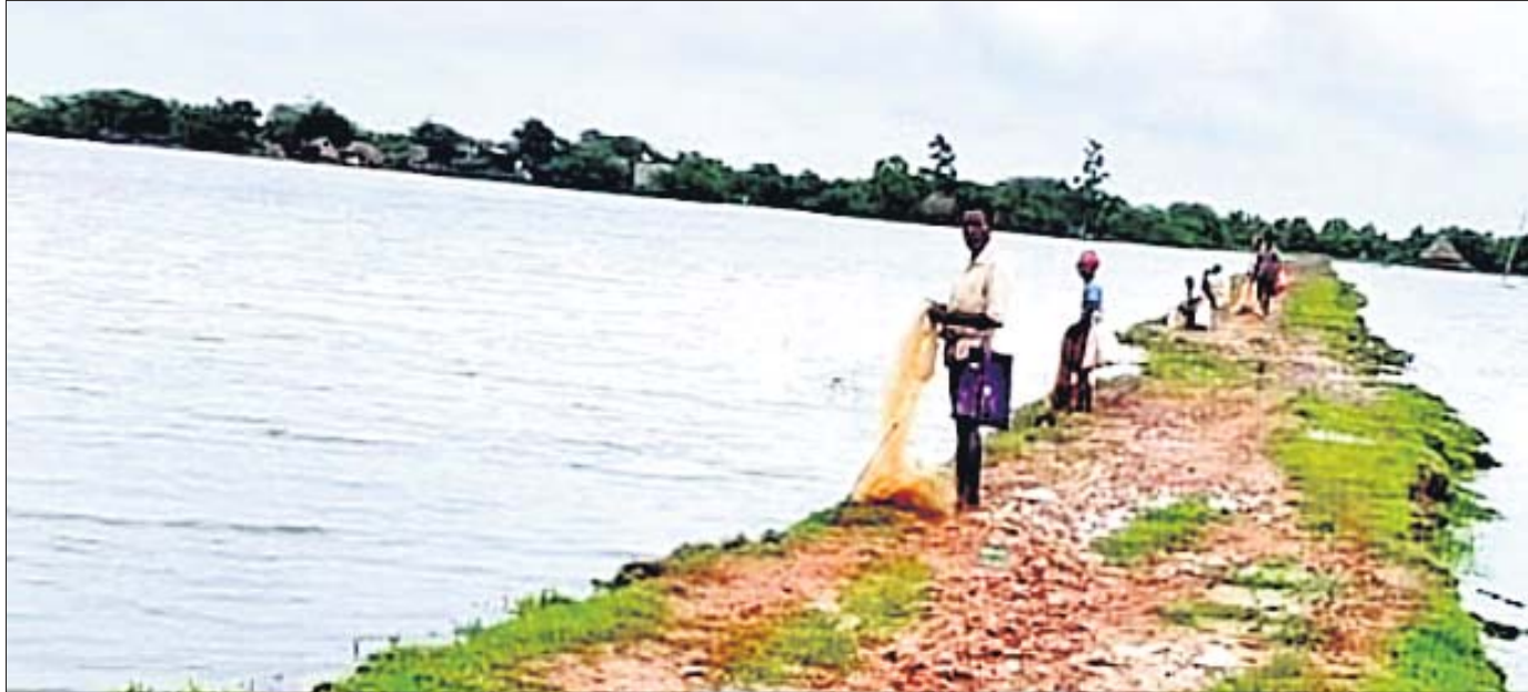
ମହାକାଳପଡ଼ା ବ୍ଲକ୍ ନିପାଣିଆ ଅଞ୍ଚଳ ଚାଷ ଜମିରେ ସମୁଦ୍ର ଜୁଆ ପାଣି ଲହଡ଼ି ମାରୁଛି। ଲୋକେ ମାଛ ଧରୁଛନ୍ତି।

ଚଳିତ ମୌସୁମୀ ବର୍ଷା କେନ୍ଦ୍ରାପଡ଼ା ଜିଲ୍ଲାକୁ ଆଖିବୁଜୁଥିବା ହୋଇନାହିଁ। ସାମୁଦ୍ରିକ ଝଡ଼ ମଧ୍ୟ ଏବେ ହୋଇନାହିଁ। ଏହାସତ୍ତ୍ୱେ ଜିଲ୍ଲାର ୫ ହଜାର ହେକ୍ଟର ଜମିରେ ଗତ ବୁଢ଼ୁବାର ସମୁଦ୍ର ଜୁଆର ପାଣି ମାଡ଼ି ଯାଇଛି।