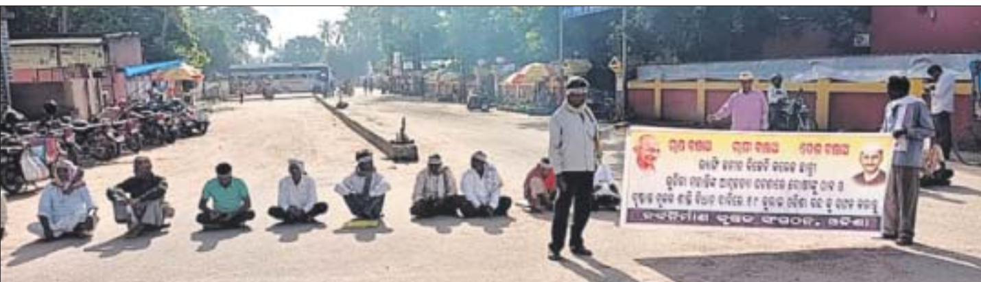
ସଙ୍ଗଠନ କର୍ମକର୍ତ୍ତା କାଟାୟ ରାଜପଥ ଅବରୋଧ କରିଛନ୍ତି ।