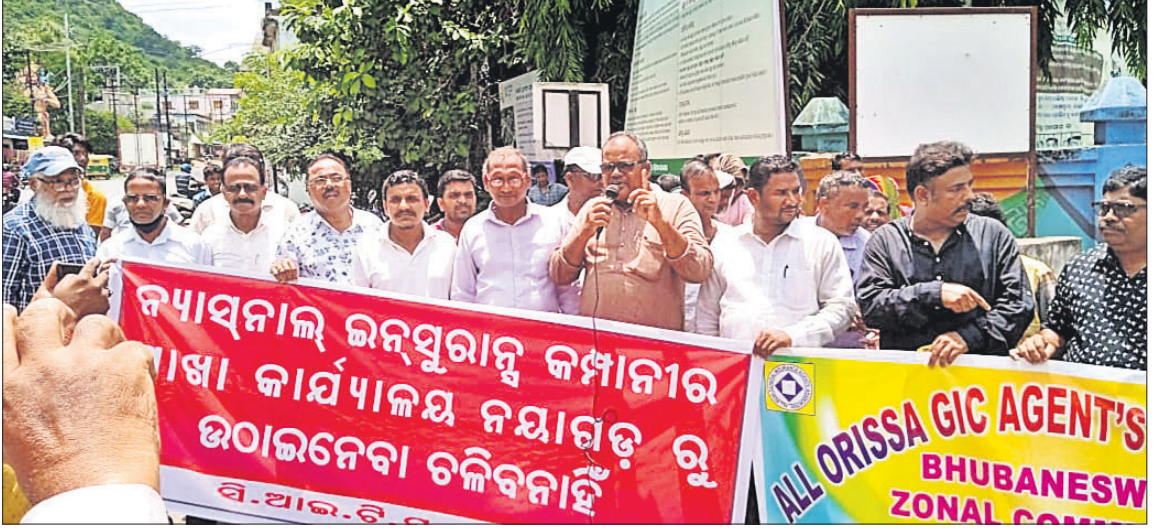
ନୟାଗଡ଼ରେ ବୀମା କମ୍ପାନୀର ଶାଖା ଉଠାଇ ନେବା ପ୍ରତିବାଦରେ କର୍ମଚାରୀ, ଏଜେଣ୍ଟଙ୍କ ପକ୍ଷରୁ ରଣବିକ୍ଷୋଭ କରାଯାଇଛି।

ନୟାଗଡ଼ ଅର୍ପିସ, ୧୯୩୭ କାର୍ତ୍ତାୟ ବୀମା କମ୍ପାନୀର ଶାଖାକୁ ଉଠାଇ ନେବାକୁ କମ୍ପାନୀ କର୍ତ୍ତୃପକ୍ଷଙ୍କ ବକ୍ସପୁର ପ୍ରତିବାଦରେ ମଙ୍ଗଳବାର ସିଆଇଟିରୁ ଆହ୍ୱାନରେ ନୟାଗଡ଼ଠାରେ ଧାରଣା ଓ ବିକ୍ଷୋଭ ଅନୁଷ୍ଠିତ ହୋଇଯାଇଛି। ସିଆଇଟିରୁ ଅଧ୍ୟକ୍ଷତାରେ କମ୍ପାନୀର ଶାଖା କାର୍ଯ୍ୟାଳୟ ସମ୍ମୁଖରେ ଧାରଣା ଓ ସଭା ହୋଇଯାଇଛି। ଏହି ଧାରଣାରେ ଶତାଧିକ ବୀମା କର୍ମଚାରୀ, ଏଜେଣ୍ଟ ଓ ବୀମାଧାରୀ ଯୋଗ ଦେଇଥିଲେ। ବୀମା କାର୍ଯ୍ୟାଳୟ ସ୍ଥାନାନ୍ତର ପ୍ରତିବାଦରେ ଆନ୍ଦୋଳନକୁ ଡାକ୍ତା କରିବାକୁ ବନ୍ଧ ପରିକର