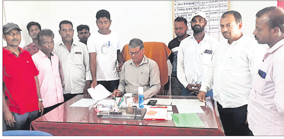
ପରିଚାଳନା କମିଟି ସଭ୍ୟ ଏ ଅଭିଭାବକମାନେ ବିଜ୍ଞତା ଦାବିପତ୍ର ଦେଉଛନ୍ତି।

ବାଲିଆ, ୧୯୧୭: ବିଭିନ୍ନ କ୍ରମ ଅନୁଗତ ନାଲିକୋ ସରକାରୀ ପ୍ରାଥମିକ ବିଦ୍ୟାଳୟରେ ଶିକ୍ଷକ ଅଭାବପୂର୍ଣ୍ଣ ଅଭିଭାବକଙ୍କ ମଧ୍ୟରେ ଅସନ୍ତୋଷ ପ୍ରକାଶ ପାଇଛି।