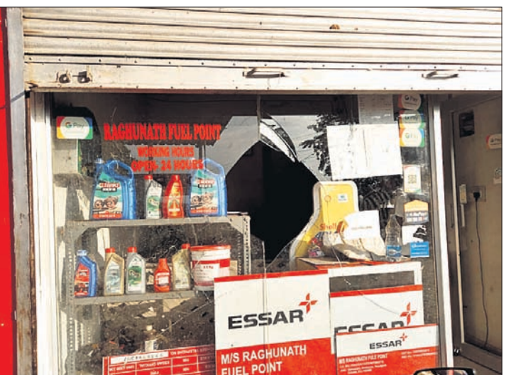
ଦର୍ମନାରାୟଣପୁର ଫାଉଁଡ଼ି ଅଞ୍ଚଳର ଏକ ପେଟ୍ରୋଲ ପମ୍ପରୁ ମଧ୍ୟ ଡକାଯିବ ହୋଇଛି।