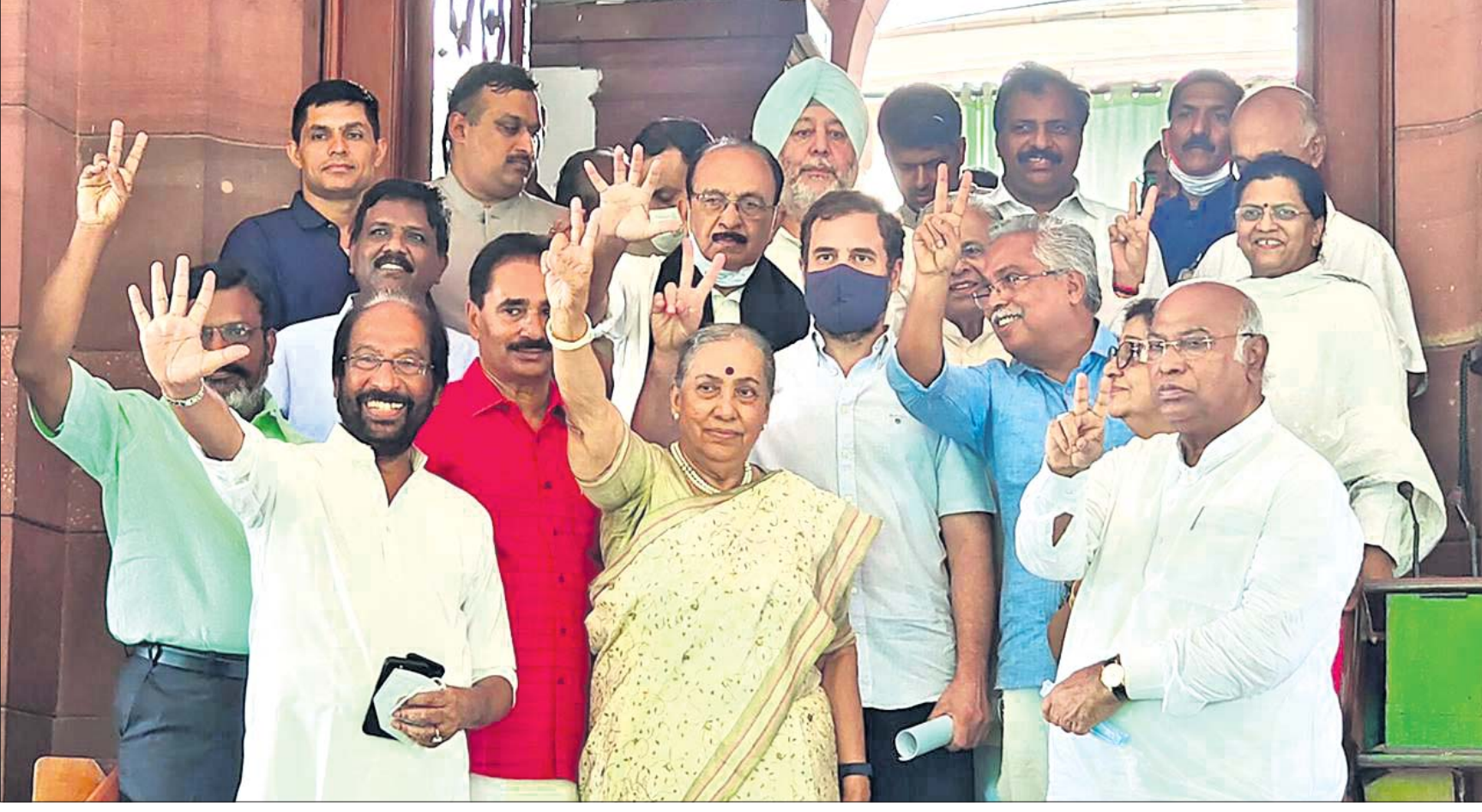
ମିଳିତ ବିରୋଧୀକ ଉପରାଷ୍ଟ୍ରପତି ପ୍ରାର୍ଥୀ ମାର୍ଗରେଟ୍ ଆଲଭାଙ୍କ ମଙ୍ଗଳବାର ପ୍ରାର୍ଥନାକ୍ରମେ କଂଗ୍ରେସ ନେତା ରାହୁଲ ଗାନ୍ଧୀ, ମଲିକାଙ୍କୁନ ଖାରୋଙ୍କ ସମେତ ଅନ୍ୟ ଦଳର ନେତୃବୃନ୍ଦ।