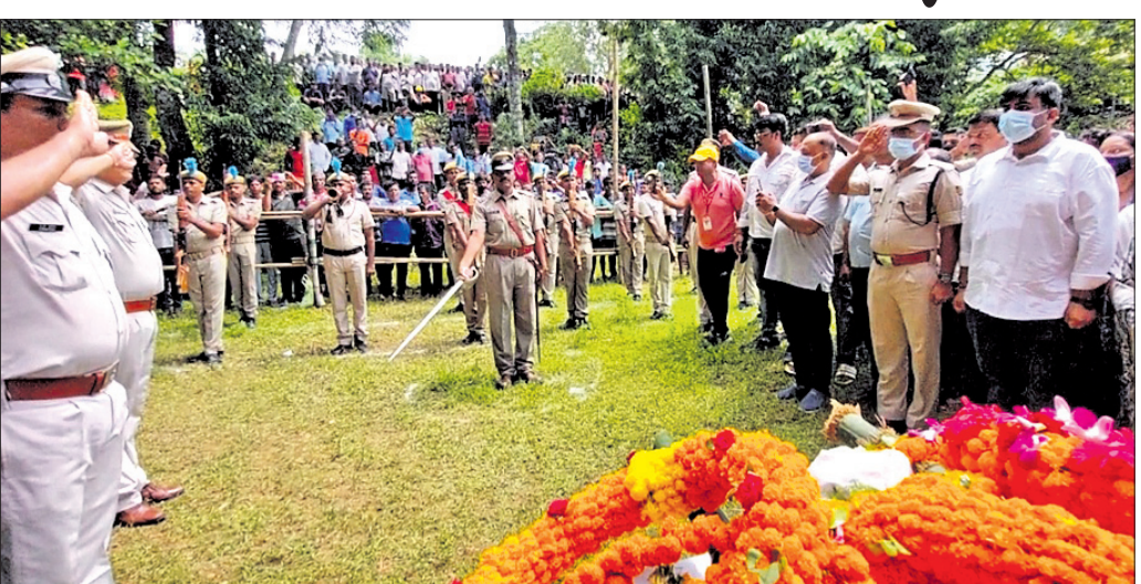
ଅଜୟ ପରିଡ଼ାଙ୍କୁ ରାଷ୍ଟ୍ରୀୟ ମର୍ଯ୍ୟାଦା ପ୍ରଦାନ କରାଯାଇଛି।

ଧର୍ମଶାଳା, ୨୦୧୭ (ବି.ଏନ୍.ଏ.) ଆସାମର ଗୁଆହାଟୀଠାରେ ହୃଦ୍‌ଘାତରେ ପ୍ରାଣ ହରାଇଥିବା ଜୀବବିଜ୍ଞାନ ପ୍ରତିଷ୍ଠାନ(ଆଇଏଲ୍‌ଏସ୍) ନିର୍ଦ୍ଦେଶକ ପଦ୍ମଶ୍ରୀ ଡକ୍ଟର ଅଜୟ କୁମାର ପରିଡ଼ାଙ୍କ ରୁଧିରା ଶେଷକୃତ୍ୟ ସମ୍ପନ୍ନ ହୋଇଛି।