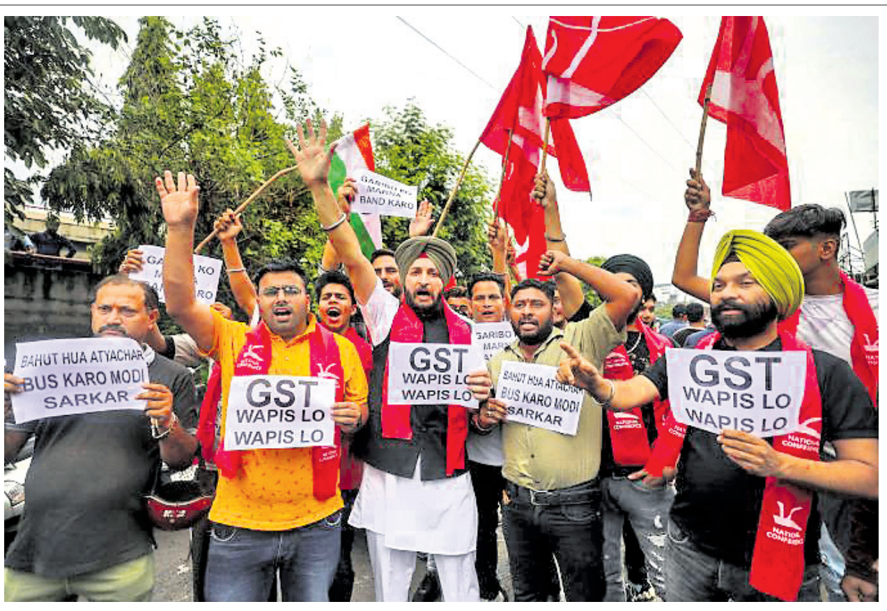
ଅତ୍ୟାଚାରୀଙ୍କ ଖାଦ୍ୟ ସାମଗ୍ରୀ ଉପରେ ଜିଏସ୍ଟି ଲାଗୁ ନେଇ ଜନ୍ମଠାରେ ବୁଧବାର ନ୍ୟାଶନାଲ କନଫରେନ୍ସ କର୍ମୀମାନେ ବିକ୍ଷୋଭ କରୁଛନ୍ତି ।