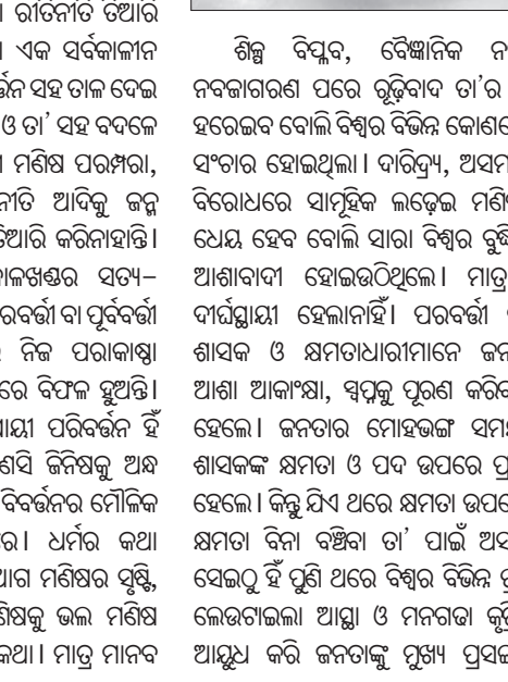
ଶିଶୁ ବିଦ୍ୟୁତ, ବୈଜ୍ଞାନିକ ନବୀଗାର ଓ ନବଜାଗରଣ ପରେ ରୂପିବାଦ ତା'ର ପ୍ରାସଙ୍ଗିକତା ହରାଇବ ବୋଲି ବିଶ୍ୱର ବିଜ୍ଞାନ କୋଶରେ ଆଶାଟିଏ ସଂଚାର ହୋଇଥିଲା ।

ଏକ ସାଧନ କରିବାର ପ୍ରକ୍ରିୟା । ଶାସକ ଜାଣିଥିଲେ ଯେ ଆତ୍ମା ଏମିତି ଏକ ଜିନିଷ ଯାହା ଠାରୁ ରୂପିବାଦକୁ ଅଲଗା କରିବା ସାଧ୍ୟ ନୁହେଁ ।