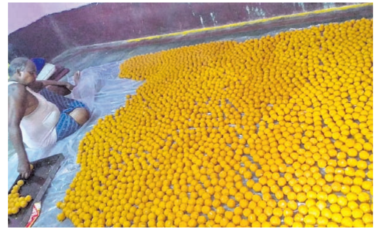
କଟଣ କାରିଗର ଲଟ୍ ତିଆରି କରୁଛନ୍ତି ।

■ ରାଷ୍ଟ୍ରପତି ନିର୍ବାଚନ ଫଳାଫଳ ଘୋଷଣାକୁ ଅପେକ୍ଷା ■ ବିଜୟ ଉତ୍ସବ ମନାଇବାକୁ ଚଳଚଞ୍ଚଳ ମୟୂରଭଞ୍ଜ