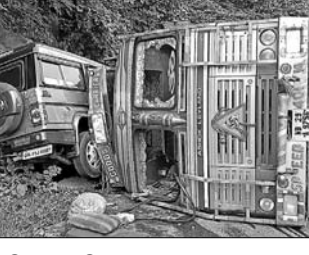
ଗାରିପଦା ଅଞ୍ଚଳ/ ବାଙ୍କିରିପୋଷି, ୨୦୧୭(ଡି.ଏ.ଏ.): ମୟୂରଭଞ୍ଜ ଜିଲ୍ଲା ବାଙ୍କିରିପୋଷିରେ ଟ୍ରାକର ଘଟଣା ଘଟିବେ ରୁଦ୍ଧବାର ସକାଳେ ଏକ ପିଆଜ ବୋଲେରୋ ଟ୍ରକ୍ ଭାଗସାମ୍ୟ ହରାଇ ବୋଲେରୋ ଉପରେ ଓଲଟି ପଡ଼ିବାକୁ ୬ଜଣ ଆହତ ହୋଇଛନ୍ତି। ସେମାନଙ୍କ ମଧ୍ୟରୁ ୪ ଜଣଙ୍କ ଅବସ୍ଥା ଗୁରୁତର ଥିବା ସୂଚନା ମିଳିଛି। ଏକ ଟ୍ରକ୍ ନାହିଁକି କୋଳକାଟୀ ଅଭିମୁଖେ ଯାଉଥିବା ବେଳେ ଭାଗସାମ୍ୟ ହରାଇ ବିପରୀତ ଦିଗକୁ ଘାଟି ରାସ୍ତାରେ ଉପରକୁ ଉଠୁଥିବା ଏକ ବୋଲେରୋ ଉପରେ ଓଲଟି ପଡ଼ିଥିଲା। ଫଳରେ ବୋଲେରୋରେ ଥିବା ୪ ଜଣଙ୍କ ସମେତ ଟ୍ରକ୍ ଡ୍ରାଇଭର ଓ ହେଲପର ଆହତ ହୋଇଥିଲେ। ଆହତମାନଙ୍କୁ ପ୍ରଥମେ ବାଙ୍କିରିପୋଷି ଗୋଷ୍ଠୀ ସ୍ୱାସ୍ଥ୍ୟକେନ୍ଦ୍ର ଓ ପରେ ବାରିପଦାସ୍ଥିତ ପିଆଜଏମ୍ ମେଡିକାଲରେ ଚିକିତ୍ସା ପାଇଁ ଭର୍ତ୍ତି କରାଯାଇଛି। ଆହତ ବୋଲେରୋ ସାମ୍ବାନୀମାନେ ବାଙ୍କିରିପୋଷି ଅଞ୍ଚଳର। ସେମାନେ କାମସମ୍ପନ୍ନ ଅଭିମୁଖେ ଯାଉଥିଲେ। ବାଙ୍କିରିପୋଷି ପୋଲିସ ପହଞ୍ଚି ତଦନ୍ତ ଜାରି ରଖିଛି।