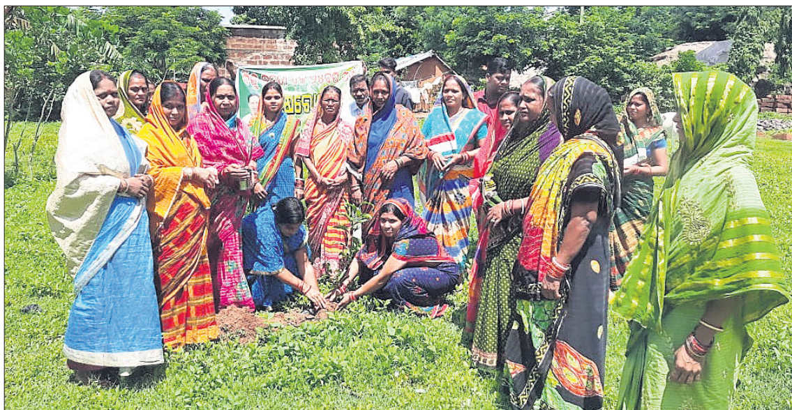
ଚାରା ରୋପଣ କାର୍ଯ୍ୟକ୍ରମରେ ସରପଞ୍ଚଙ୍କ ସମେତ ଅନ୍ୟମାନେ।

ଡେକାନାଲ ଜିଲ୍ଲା ଭୁବନେଶ୍ୱର ବାଲୁଆଁ (ଖ) ପଞ୍ଚାୟତ ମଠଖୋକ୍ତସାରେ ବିଭିନ୍ନ ପ୍ରକାରର ଚାରା ରୋପଣ କାର୍ଯ୍ୟକ୍ରମ ଅନୁଷ୍ଠାନ କରାଯାଇଛି।