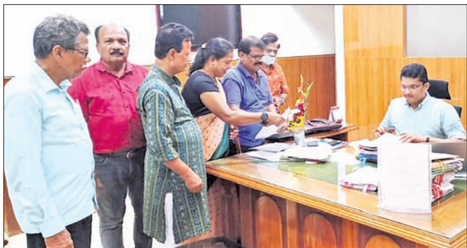
ଜିଲ୍ଲାପାଳଙ୍କୁ ଦାବିପତ୍ର ପ୍ରଦାନ କରାଯାଇଛି।

ପ୍ରକଳ୍ପକୁ ଆଗକୁ ନେବାରେ ସରପଞ୍ଚମାନଙ୍କ ଗୁରୁତ୍ୱପୂର୍ଣ୍ଣ ଭୂମିକା ରହିଛି। ବିଭିନ୍ନ ସମସ୍ୟାକୁ କାର୍ଯ୍ୟକାରୀ କରିବା ପାଇଁ ସରପଞ୍ଚମାନେ ସହଯୁକ୍ତ ଲୋକଙ୍କ ଆବେଦନକୁ ସମ୍ମାନ ଦେଇ, ଉପଯୋଗୀ ସମାଧାନ ପ୍ରଦାନ କରିବାକୁ ପ୍ରୋତ୍ସାହିତ ହୋଇଛନ୍ତି।