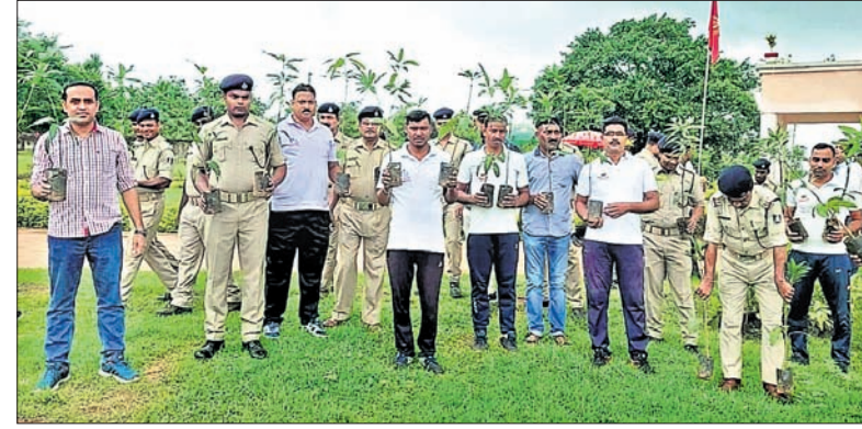
ଚାରା ରୋପଣ କାର୍ଯ୍ୟକ୍ରମରେ ବାଟାଲିୟନର ଅଧିକାରୀଙ୍କ ସମେତ ଅନ୍ୟମାନେ ।