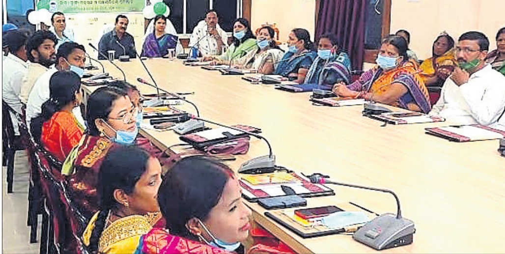
ବୈଠକରେ ଜିଲ୍ଲା ପରିଷଦ ସଭାସଭ୍ୟା, ଜିଲ୍ଲାପାଳଙ୍କ ସମେତ ବିଭିନ୍ନ ପଞ୍ଚାୟତର ସଭାପତିମାନେ।