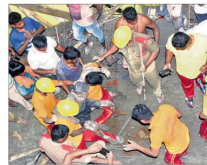
ଘଟଣାସ୍ଥଳରେ ଉଦ୍ଧାର କାର୍ଯ୍ୟ ଚାଲିଛି।