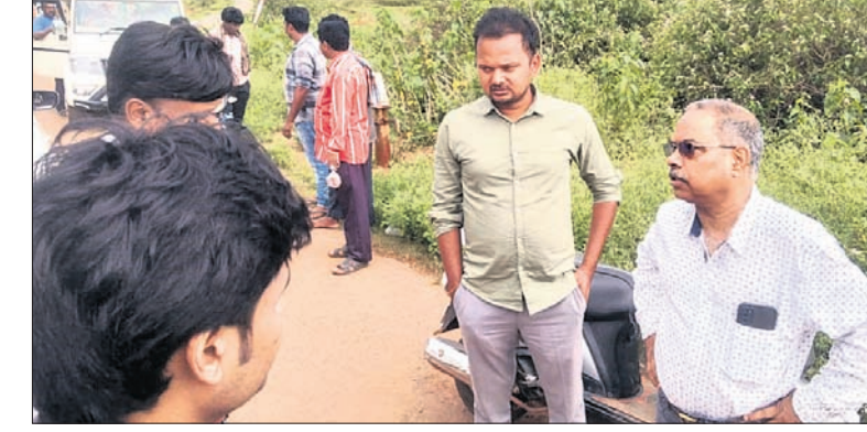
ଅଧିକାରୀମାନେ ସ୍ଥିତି ଅନୁଧ୍ୟାନ କରୁଛନ୍ତି