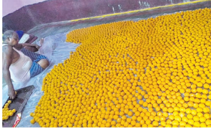
କିଲାର କାରିଗର ଲଓ ଟିଆରି କରୁଛନ୍ତି ।