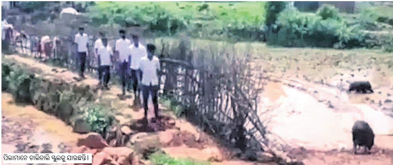
ପିଲାମାନେ ଚାଲିଚାଲି ସ୍କୁଲକୁ ଯାଉଛନ୍ତି