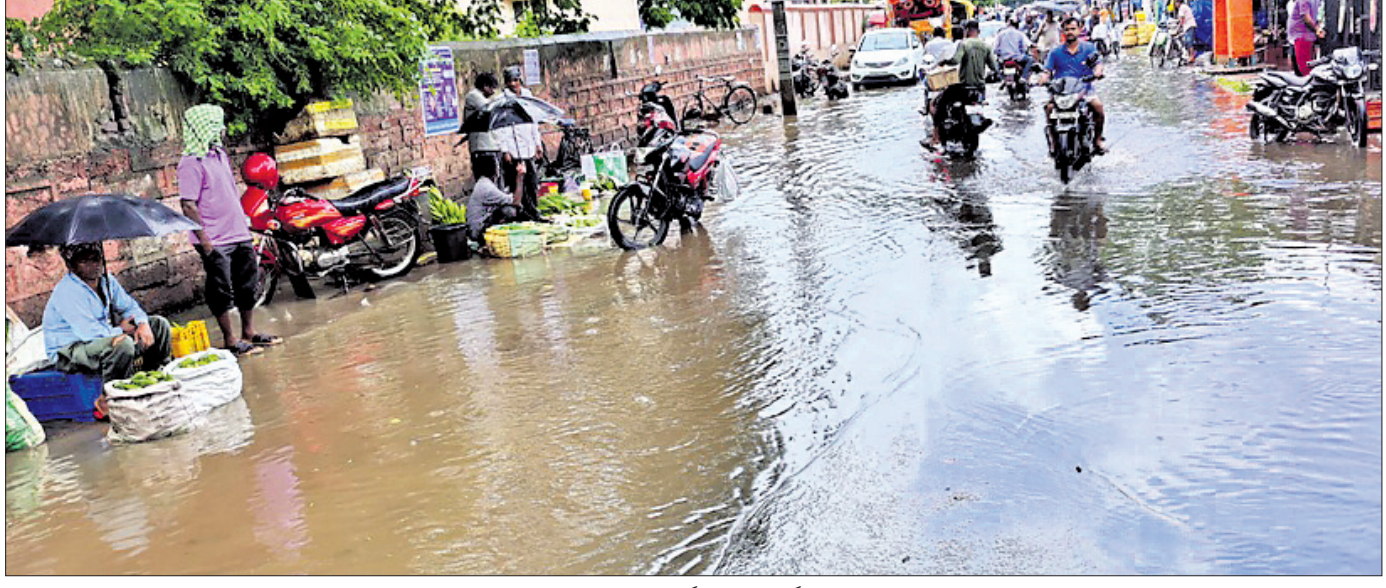
ବ୍ୟାସନଗର ସହରର ଗଣେଶ ବଜାରରେ ପଥପାର୍ଶ୍ୱ ବିକ୍ରେତା ବର୍ଷା ପାଣିରେ ବସି ବ୍ୟବସାୟ କରୁଛନ୍ତି।

ସହରର ଅର୍ଥନୈତିକ କ୍ଷେତ୍ରରେ ପଥପାର୍ଶ୍ୱ ବିକ୍ରେତାଙ୍କ ବହୁ ଗୁରୁତ୍ୱପୂର୍ଣ୍ଣ ଅବଦାନ ରହିଛି। ଏହି ପରିସ୍ଥିତିରେ ସେମାନଙ୍କ ଅର୍ଥନୈତିକ ଅଭିବୃଦ୍ଧି ଓ ସୁରକ୍ଷା ନିମନ୍ତେ ଏକାଧିକ ଯୋଜନା ପ୍ରଣୟନ କରାଯାଇ ଲକ୍ଷ୍ୟବଦ୍ଧ ଚକ୍ରା ଲାଗୁ କରାଯାଇଛି। ହେଲେ ଆଜି ବି ପଥପାର୍ଶ୍ୱ ବିକ୍ରେତା ଅସହାୟ ଅବସ୍ଥାରେ ପଡ଼ି ରହିଛନ୍ତି। ଏପରିକି ଖାଦ୍ୟ ସୁରକ୍ଷା ଓ ସ୍ୱଚ୍ଛତାକୁ ନେଇ ଆଖିବୁଜିଆ ପଦକ୍ଷେପ ଗ୍ରହଣ କରାଯାଇନାହିଁ। ରାଜ୍ୟର ବିଭିନ୍ନ ପୌର ପରିଷଦ ଏବଂ ବିଜ୍ଞାପିତ ପରିଷଦ ଅଞ୍ଚଳ କର୍ତ୍ତୃପକ୍ଷ ସେମାନଙ୍କଠାରୁ କେବଳ ଚିକିତ୍ସା ଆବେଦନରେ ପଦକ୍ଷେପ ଯାଚିବ ବୋଲି କହିଛନ୍ତି। କାତାୟ ସହରାଞ୍ଚଳ ଜାବିକା ମିଶନର ରାଜ୍ୟର ବିଭିନ୍ନ ସହରାଞ୍ଚଳରେ ଏଯାବତ୍ ୧୦୫,୨୩୨ ପଥପାର୍ଶ୍ୱ ବିକ୍ରେତା ଚିକିତ୍ସା ହୋଇଛି। ସୁରପାଥ, ପାର୍କ, ବସଷ୍ଟାଣ୍ଡ, ରେସିଡେନ୍ସିଆଲ ପ୍ରାନ୍ତସ୍ଥ ସ୍ଥାନରେ ଛୋଟବଡ଼ ବିକ୍ରେତାଙ୍କୁ ଏହି ପ୍ରକ୍ରିୟାରେ ସାମିଲ କରାଯାଇଛି। ପ୍ରଥମ ପର୍ଯ୍ୟାୟରେ