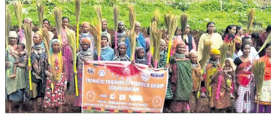
ତାଲିମଦାତାଙ୍କ ଗହଣରେ ବଣ୍ଡା ମହିଳାମାନେ।