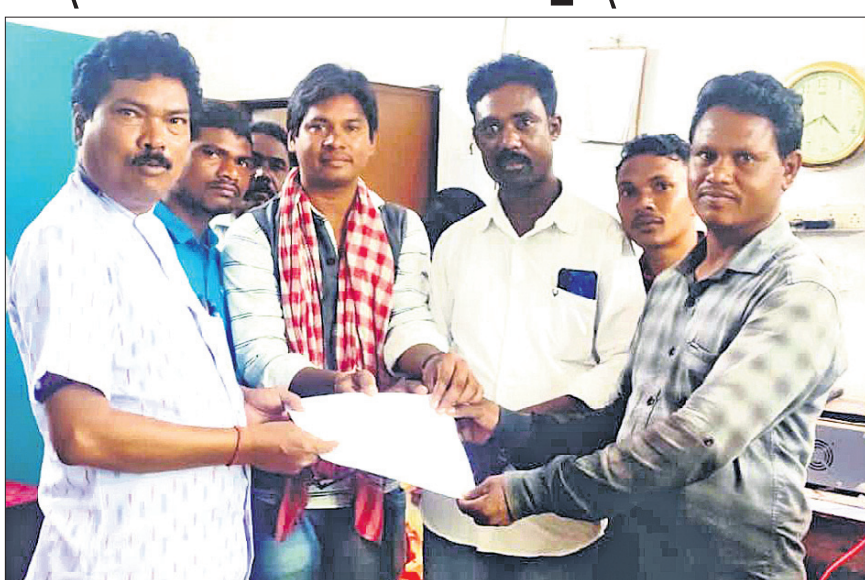
ବିଡିଓଙ୍କୁ ଦାରିପତ୍ର ଦେବାକୁ ଆସିଥିବା ଗ୍ରାମବାସୀ ଓ ସେବା ସେନା ସଦସ୍ୟ।