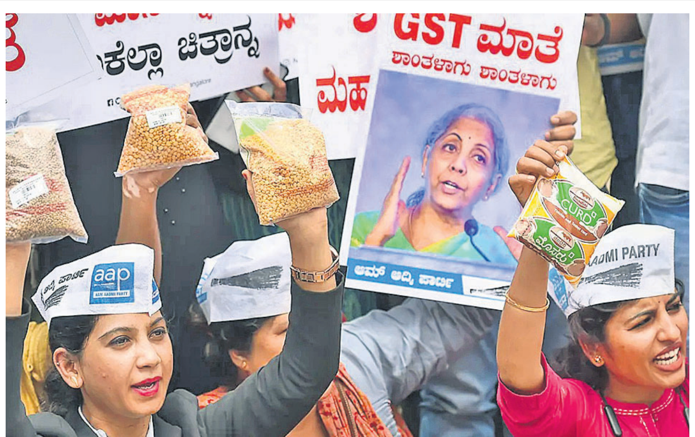
ଅତ୍ୟାବଶ୍ୟକ ସାମଗ୍ରୀ ଉପରେ ଜିଏସ୍‌ଟି ଲାଗୁକୁ ବିରୋଧ କରି ବୁଧବାର ବେଙ୍ଗାଳୁରୁରେ ବିକ୍ଷୋଭ ପ୍ରଦର୍ଶନ କରୁଛନ୍ତି ଏଏପି କର୍ମୀ।