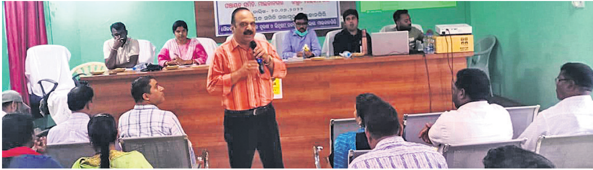
ସଚେତନତା କାର୍ଯ୍ୟକ୍ରମରେ ଉପସ୍ଥିତ ଅଧିକାରୀ ଓ ଲୋକ ପ୍ରତିନିଧିମାନେ ।

ମାଲକାନଗିରି, ୨୦୧୭(ଡି.ଏ.ଏ.ଏ.): ମାଲକାନଗିରି ଜିଲାର ୭ ବ୍ଲକର ନବ ନିର୍ବାଚିତ ପଞ୍ଚାୟତ ପ୍ରଧାନ କମିଟିମାନଙ୍କୁ ସେମାନଙ୍କ କାର୍ଯ୍ୟକ୍ରମ ଏବଂ କର୍ତ୍ତବ୍ୟ, ପଞ୍ଚାୟତରାଜ ନିୟମାବଳୀ ବିଷୟରେ ୭ ଦିନ ଧରି ତାଲିମ ଦିଆଯାଇଛି ।