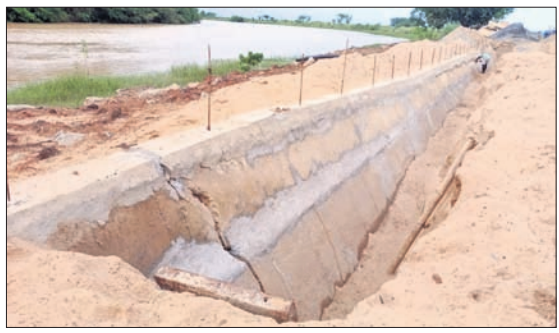
୨୦ ନଂ. କାଟାୟ ରାଜପଥରେ ନିର୍ମିତ ପ୍ରୋଟେକ୍ସନ୍ ଖାଲ।