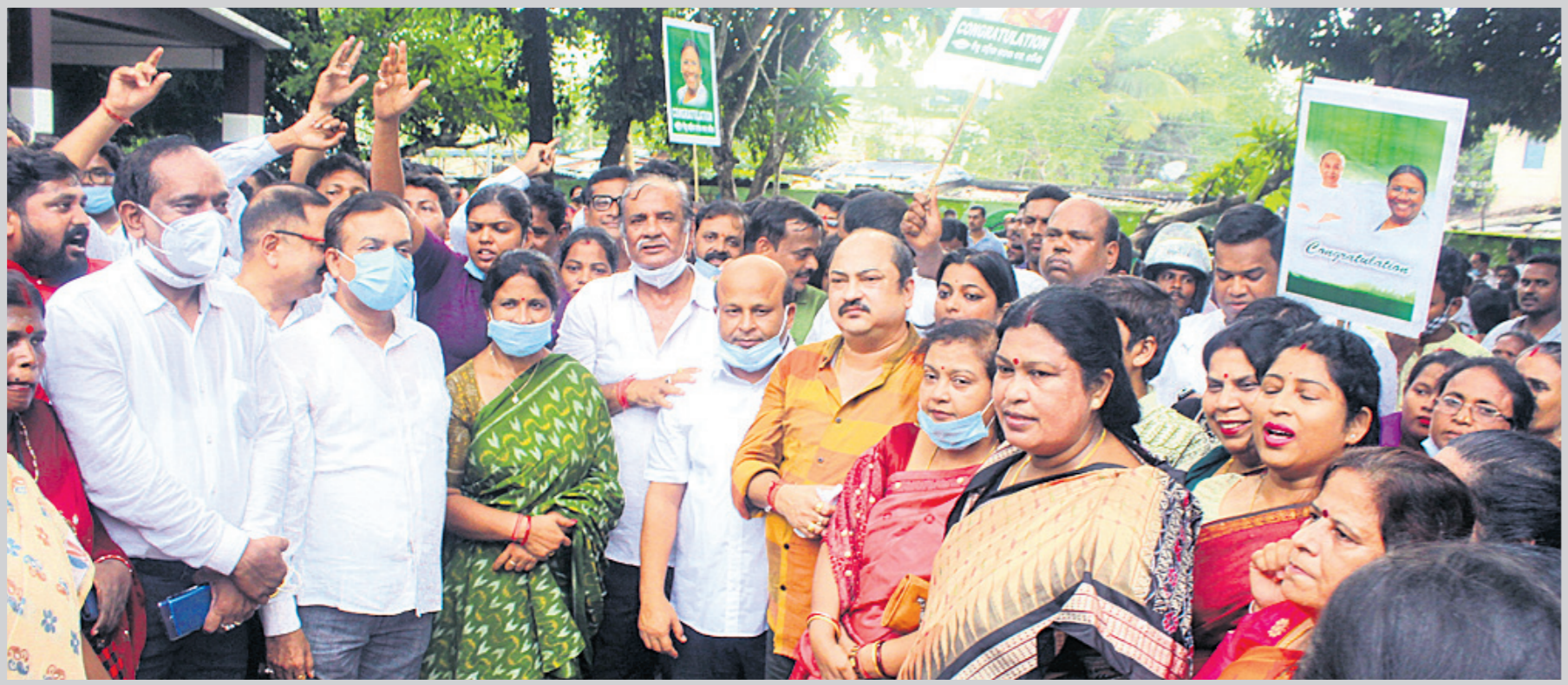
ବିଜେଡି ରାଜ୍ୟ କାର୍ଯ୍ୟାଳୟରେ ଦକାୟ ନେତା ଓ କର୍ମୀଙ୍କ ବିଜୟ ଉତ୍ସବ ପାଳନ ।