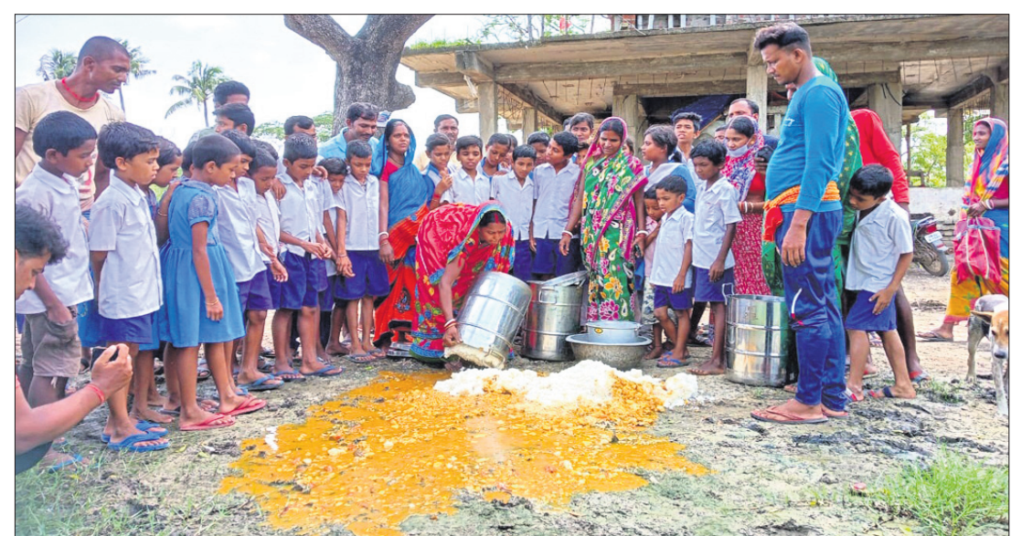
ଅଭିଭାବକମାନେ ଖାଦ୍ୟ ଫିଙ୍ଗିଛନ୍ତି।

ନିମ୍ନମାନର ଅଭିଯୋଗ ଠିକାସମ୍ପାଦକ ପହଞ୍ଚିଥିଲା। ଖାଦ୍ୟ ଖାଇ ମାନ ଠିକ୍ ନ ଥିବା ଦେଖି ଛାତ୍ରଛାତ୍ରୀ ଓ ଅଭିଭାବକ ବିରୋଧ କରିବା ସହ ବାହାରେ ଭାଙ୍ଗି ଦେଇଥିଲେ। ଏଥିସହ ସେମାନେ ବିଦ୍ୟାଳୟ ପରିସରରେ ହୋଇଛା କରିଥିଲେ।