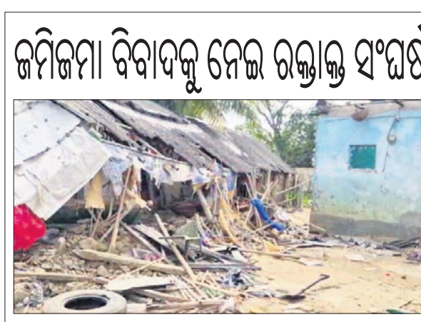
ଜମିଜମା ବିବାଦକୁ ନେଇ ରକ୍ତାକ୍ତ ସଂଘର୍ଷ