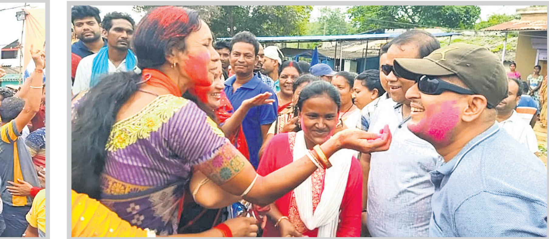
ରାଜରାଜ୍ୟପୁରରେ ଖୁସିରେ ମସୃଣୁ ଛୁଟେଇ ।