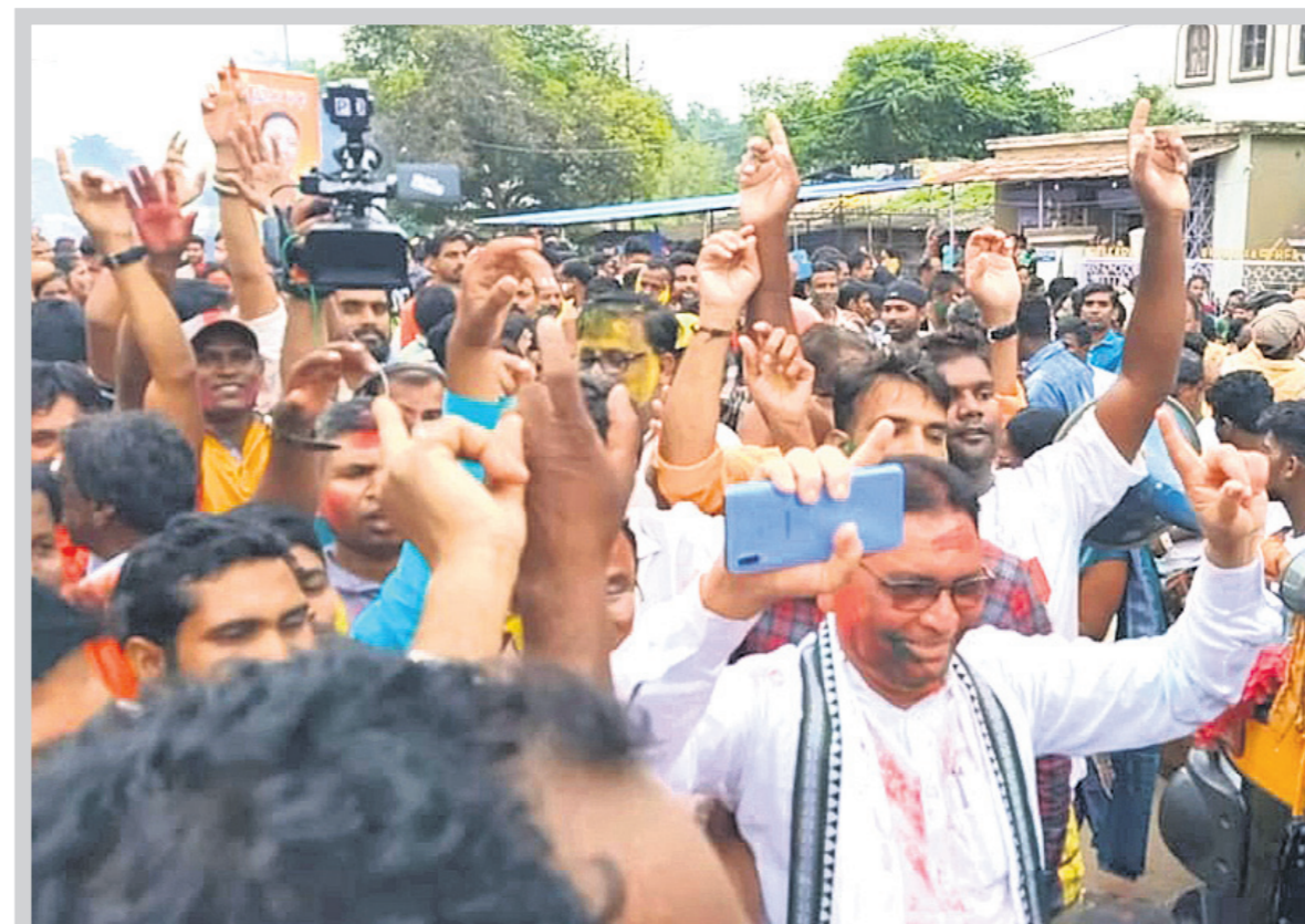
ରାଜରାଜ୍ୟପୁର ବିଧାନ ସଭା ନବ ଚରଣ ମାଝି ସମର୍ଥକଙ୍କ ସହ ଖୁସି ମନାଇଛନ୍ତି ।