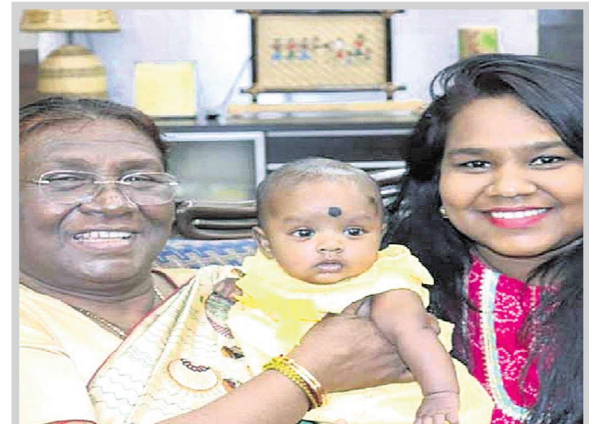
ଝିଅ ଓ ନାତୁଣୀଙ୍କ ସହ ଏକ ବିଶେଷ ପୂର୍ଣ୍ଣିମା ଡ୍ରୌପଦୀ ।