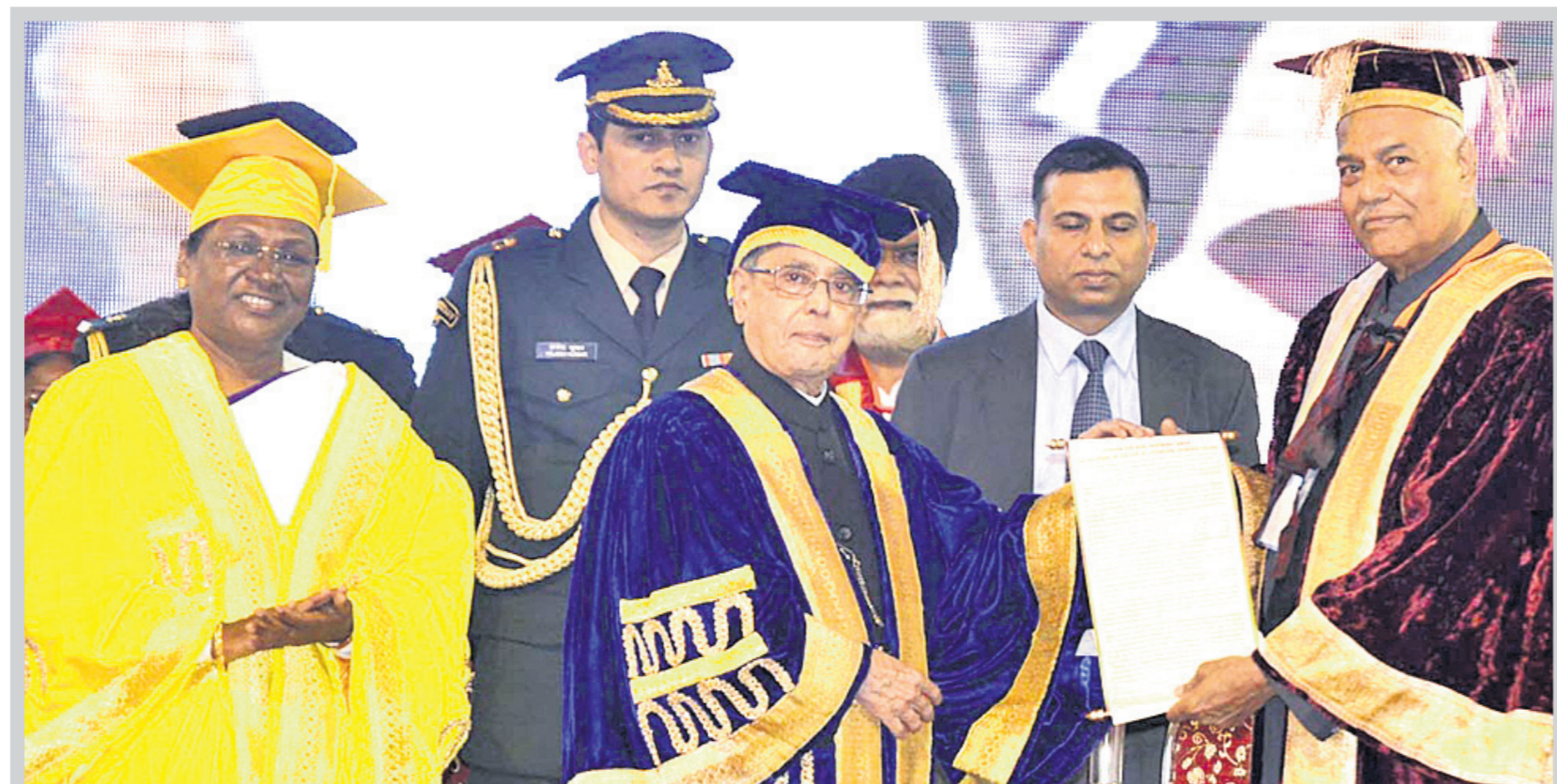
ଖାରବେଳ ଛକାଦିଲ୍ଲୀ ବିଶ୍ୱବିଦ୍ୟାଳୟର ଏକ ସମାବେଶରେ ତତ୍କାଳୀନ ରାଷ୍ଟ୍ରପତି ପ୍ରଣବ ମୁଖାର୍ଜୀ ପୂର୍ବତନ ଲେନ୍ଦ୍ରମନ୍ତ୍ରୀ ସଶଂଖ ସିହାଙ୍କୁ ଚକ୍ଷୁରେ ଉପାଧିରେ ସମ୍ମାନିତ କରୁଛନ୍ତି । ନିକଟରେ ଅଛି ତତ୍କାଳୀନ ଖାରବେଳ ରାଜ୍ୟପାଳ ଡ୍ରୌପଦୀ ପୁରୁ ।

ପଞ୍ଚଦଶ ରାଷ୍ଟ୍ରପତି ଭାବେ ନିର୍ବାଚିତ ହୋଇଛନ୍ତି ଡ୍ରୌପଦୀ ପୁରୁ । ବେଶର ସର୍ବୋଚ୍ଚ ସାମ୍ବିଧାନିକ ପଦରେ ଅଧିଷ୍ଠିତ ହେବାରେ ଡ୍ରୌପଦୀ ହେଉଛନ୍ତି ପ୍ରଥମ ଆଦିବାସୀ ମହିଳା । ସାରା ଦେଶରେ ଡ୍ରୌପଦୀଙ୍କୁ ଶୁଭେଚ୍ଛାର ପୁଅ କୁହୁଥିବାବେଳେ ଡ୍ରୌପଦୀ ମାଟିର ଝିଅ ହୋଇଥିବାରୁ ରାଜ୍ୟରେ ବେଶ୍ ଭସ୍ମବନ୍ଧୁଙ୍କର ପରିବେଶ ସୃଷ୍ଟି ହୋଇଛି । ଜନ୍ମମାଟିରେ ତାଙ୍କର ବିଜୟ ଭସ୍ମବନ୍ଧୁ ଘରେ ଘରେ ପାଳନ କରାଯାଇଥିବା ଦେଖିବାକୁ ମିଳିଛି । ପାରମ୍ପରିକ ନୃତ୍ୟ ପରିବେଶ କରି ମହିଳା, ପୁରୁଷ, ଛାତ୍ରାଛାତ୍ରୀମାନେ ଖୁସିରେ ମସୃଣୁ ଛୋଇଛନ୍ତି । ରାଜ୍ୟ ଭାଜପା ଏବଂ ବିଜେଡି କାର୍ଯ୍ୟାଳୟରେ ଦକାୟ ନେତା ଓ କର୍ମୀମାନେ ନାଚଗୀତ ଏବଂ ପରସ୍ପରକୁ ମିଠା ଖୁଆଇ ଖୁସି ମନାଇଛନ୍ତି ।