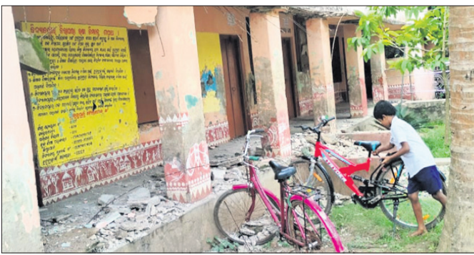
ଅଳ୍ପକେ ବଢ଼ିଲେ ଛାତ୍ରଛାତ୍ରୀ

ବିଦ୍ୟାଳୟ ସରକାର ବନ୍ଦ କରିଦେଇଥିବା ବେଳେ ଏହି ସ୍କୁଲର ଛାତ୍ରଛାତ୍ରୀ ଅଳ୍ପକେ ପଢ଼େଇ ପ୍ରାଥମିକ ବିଦ୍ୟାଳୟରେ ପଢ଼ୁଛନ୍ତି। ବିଦ୍ୟାଳୟ ବିପଦସମ୍ଭବ ଥିବାରୁ ବାରମ୍ବାର କର୍ମଚାରୀ ନୂତନ ଗୃହ ନିର୍ମାଣ କରାଯିବାକୁ ଦାବି କରିଥିଲେ ମଧ୍ୟ ଅବ୍ୟାୟିତା ତାହା କାର୍ଯ୍ୟକାରୀ କରାଯାଇ ନ ଥିବା ଅଭିଯୋଗ ହୋଇଛି।