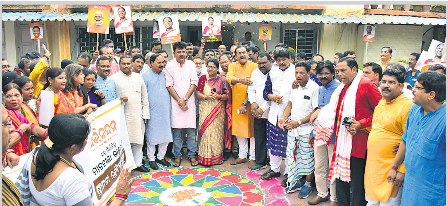
ରାଜ୍ୟ ରାଜ୍ୟ କାର୍ଯ୍ୟାଳୟରେ ଦକାୟ ନେତା ଓ କର୍ମୀମାନେ ଖୁସି ମନାଇଛନ୍ତି ।