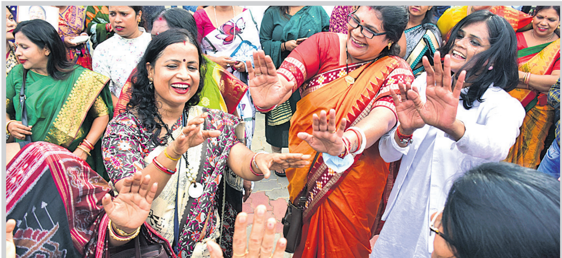
ରାଜ୍ୟ ଲେନ୍ଦ୍ରା ଓ କର୍ମୀମାନେ ରାଜ୍ୟ କାର୍ଯ୍ୟାଳୟରେ ଖୁସି ମନାଇଛନ୍ତି ।