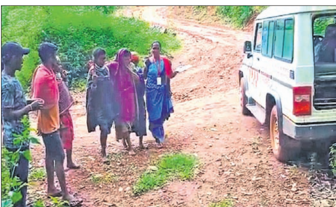
ଆୟୁର୍ବାଜ୍ଞ ନିକଟକୁ ଚାଲି ଯାଇଛନ୍ତି।

ପୁଣି ବେଷ୍ଟିକୁ ମିଳି ଗର୍ଭବତୀ ମହିଳାଙ୍କୁ ଜନନୀ ଯନ୍ତ୍ରଣା ଦିଆଯାଇଛି। ଏହା ପାଇଁ ସେମାନେ ଉତ୍ସାହୀ ହେବେ।