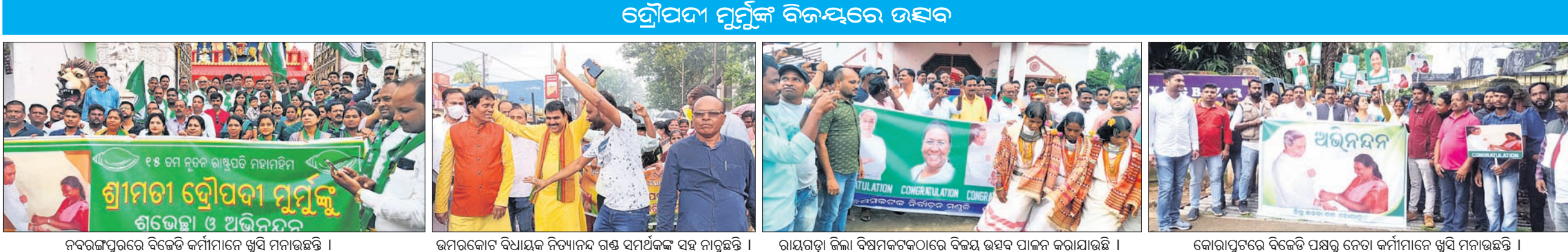
ନବରଙ୍ଗପୁରରେ ବିଜେତ କର୍ମୀମାନେ ଖୁସି ମନାଉଛନ୍ତି।

କରିବାକୁ ଗୁରୁତ୍ୱ ଦିଆଯାଇଛି। ଆୟୁର୍ବାଜ୍ଞଙ୍କୁ ଯୋଗାଣ କରାଯାଇଛି। ଏହା ପାଇଁ ସେମାନେ ଉତ୍ସାହୀ ହେବେ।