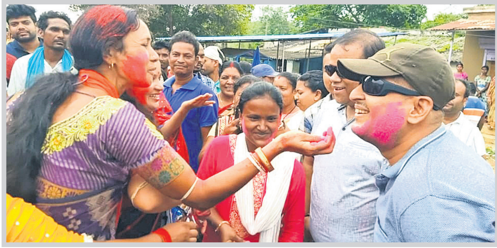
ରାଜରାଜ୍ୟପୁରରେ ଖୁସିରେ ମସୃଳ ଶୁଭେଚ୍ଛା ।