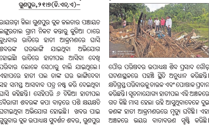
ଘର ନଷ୍ଟ ହେବାରୁ ଘର ନଷ୍ଟ ହୋଇଥିବା ଲୋକଙ୍କୁ ସମାଧାନ କରିବା ପାଇଁ ସରକାରଙ୍କୁ ନିମନ୍ତ୍ରଣ କରାଯାଇଛି।