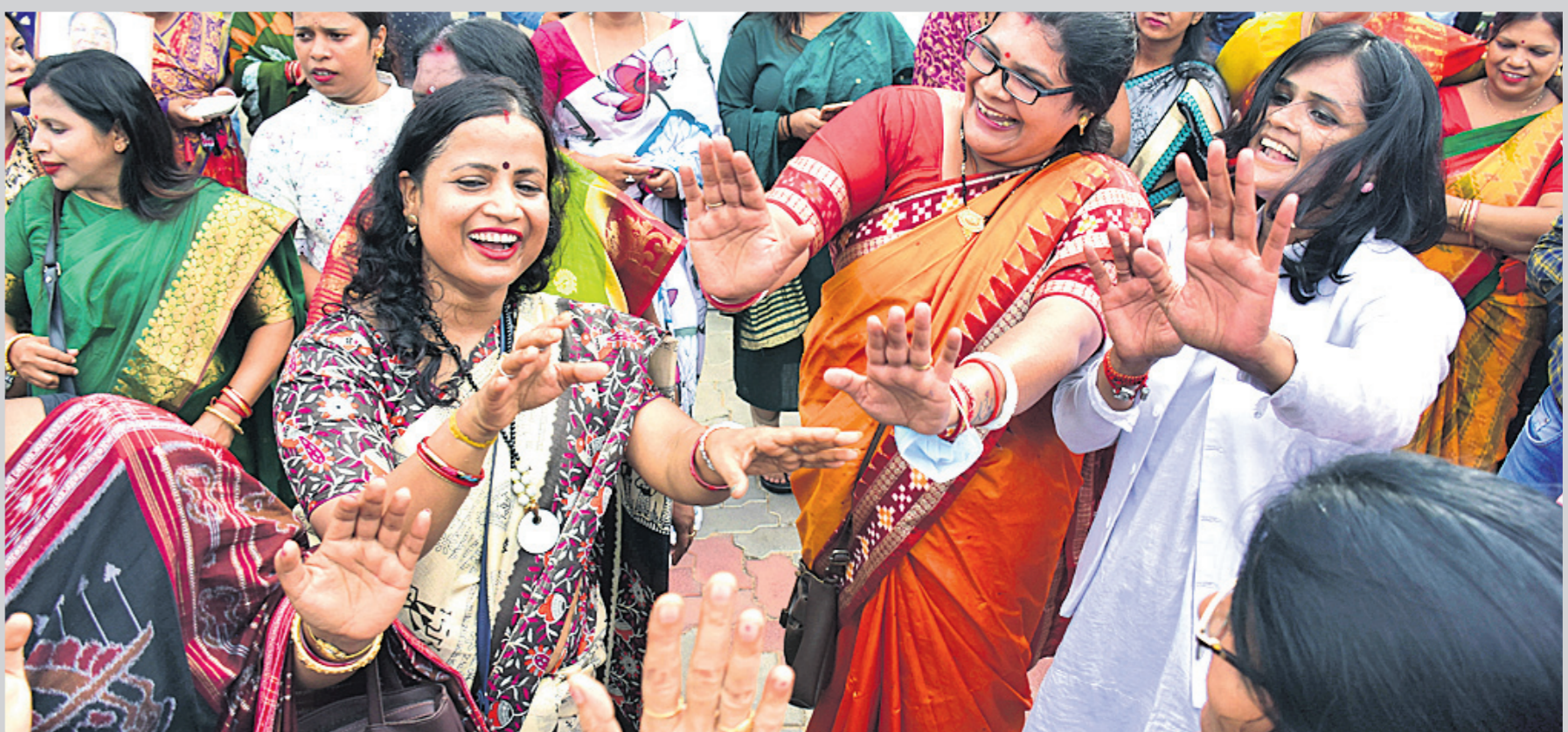
ରାଜ୍ୟ କେନ୍ଦ୍ର ଓ କର୍ମୀମାନେ ରାଜ୍ୟ କାର୍ଯ୍ୟାଳୟରେ ଖୁସି ମନାଇଛନ୍ତି ।