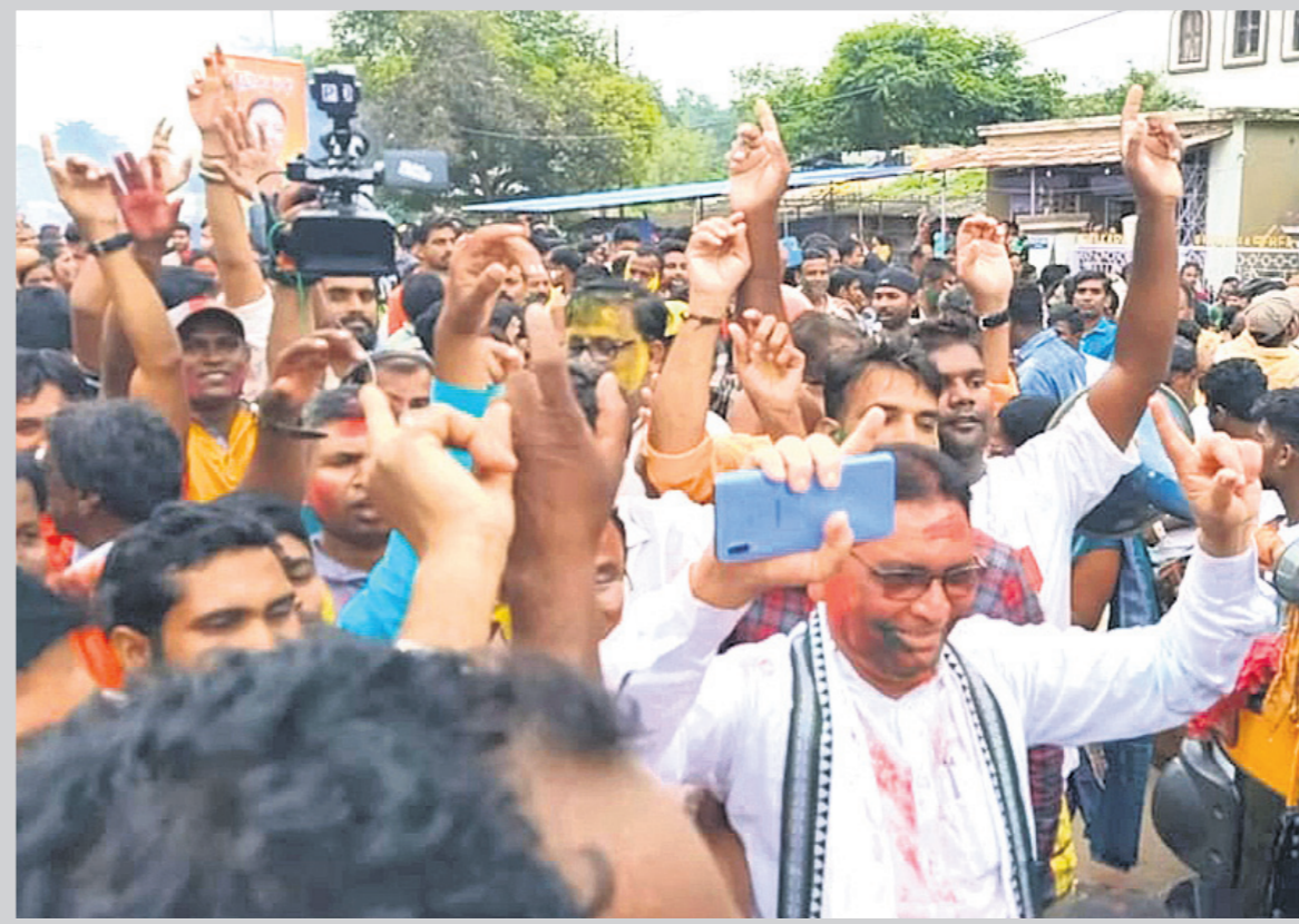
ରାଜରାଜ୍ୟପୁର ବିଧାନ ସଭା ନବ ଚରଣ ମାଝି ସମର୍ଥକଙ୍କ ସହ ଖୁସି ମନାଇଛନ୍ତି ।