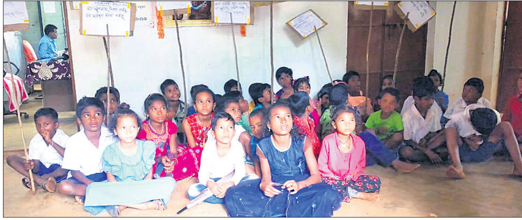
ଧାରଣାରେ ବସିଥିବା ଛାତ୍ରାଛାତ୍ରୀ ଏବଂ ଅଭିଭାବକ।

କୋରାପୁଟ ଜିଲ୍ଲା ଲମତାପୁଟ ବ୍ଲକ୍ ପାଇଁ ଏବଂ ଏକ ପ୍ରାଥମିକ ବିଦ୍ୟାଳୟର ଛାତ୍ରାଛାତ୍ରୀ ଓ ଅଭିଭାବକମାନେ ବିରୋଧ କରିଛନ୍ତି।