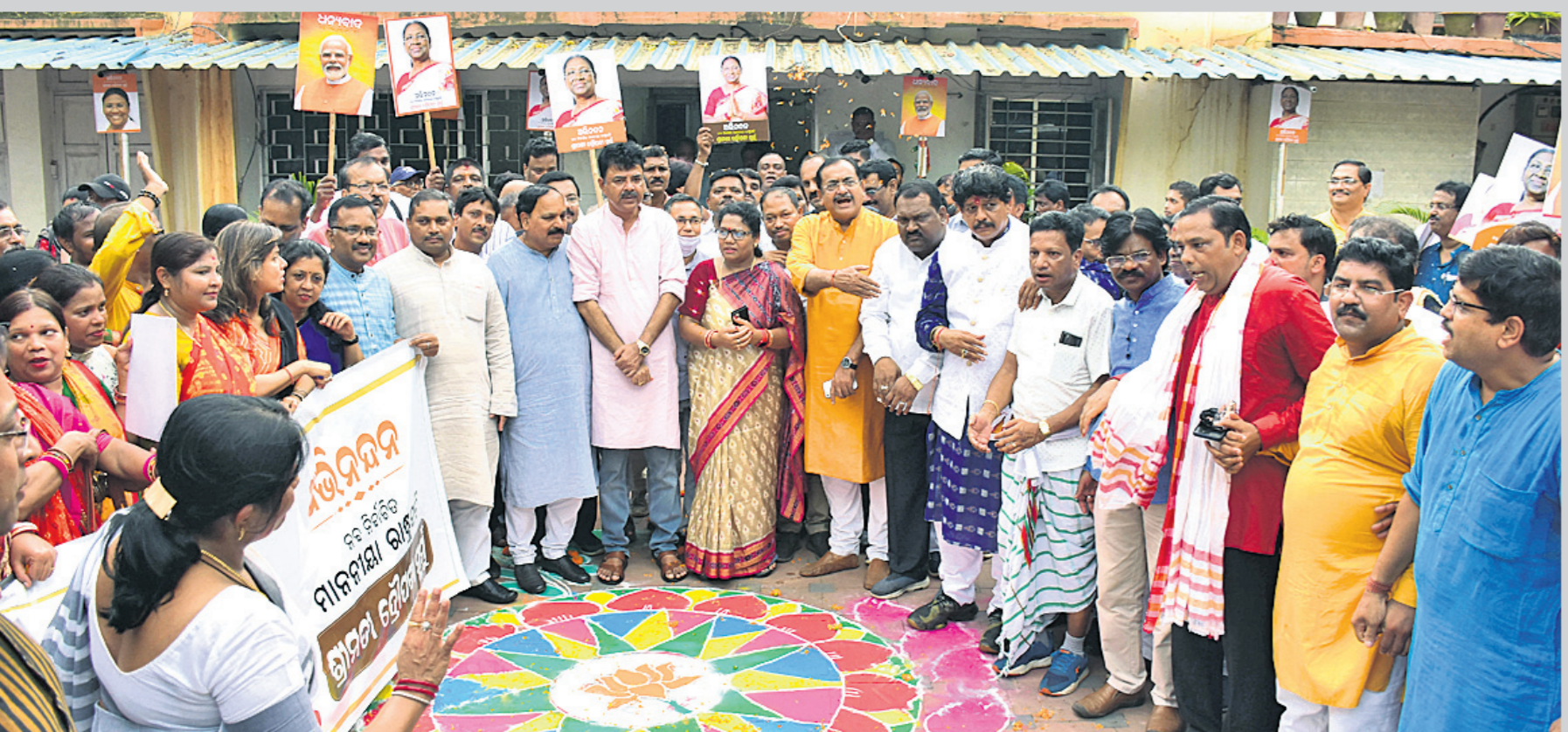
ରାଜ୍ୟ ରାଜ୍ୟ କାର୍ଯ୍ୟାଳୟରେ ଦକାୟ ନେତା ଓ କର୍ମୀମାନେ ଖୁସି ମନାଇଛନ୍ତି ।