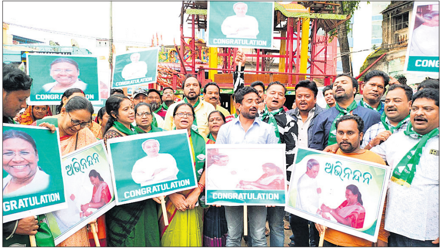
ରାଷ୍ଟ୍ରପତି ରୂପେ ଶ୍ରୋତାମାନଙ୍କୁ ବିଜୟ ପରେ ଗୁରୁବାର ଜୟପୁର ଓ ମାଲକାନଗିରିରେ ବିଜେତ ନେତା ଓ କର୍ମୀମାନେ ଖୁସି ମନାଉଛନ୍ତି।

ସେମାନେ ଖଞ୍ଜିଆ ଖାବରା ହେଉଛନ୍ତି। ଗ୍ରାମ ପାଖରେ ଥିବା ବିଦ୍ୟାଳୟକୁ ପୁଣ୍ୟ ଖୋଲିବା ପାଇଁ ପୂର୍ବରୁ ସେମାନେ ବିଳାପାଳଙ୍କୁ ଦାବୀ କରିଥିଲେ।