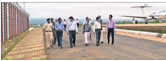
ଡିଜିସିଏ ଟିମ୍ ଜୟପୁର ଏୟାରପୋର୍ଟ ବୁଲି ଦେଖୁଛନ୍ତି।