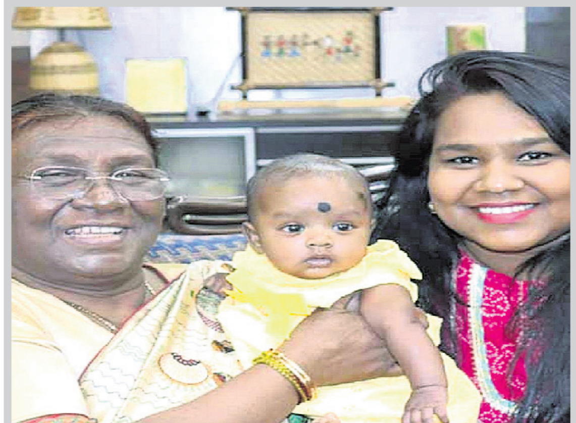
ଝିଅ ଓ ନାତୁଣୀଙ୍କ ସହ ଏକ ବିଶେଷ ପୂର୍ଣ୍ଣିମା ଡ୍ରୌପଦୀ ।