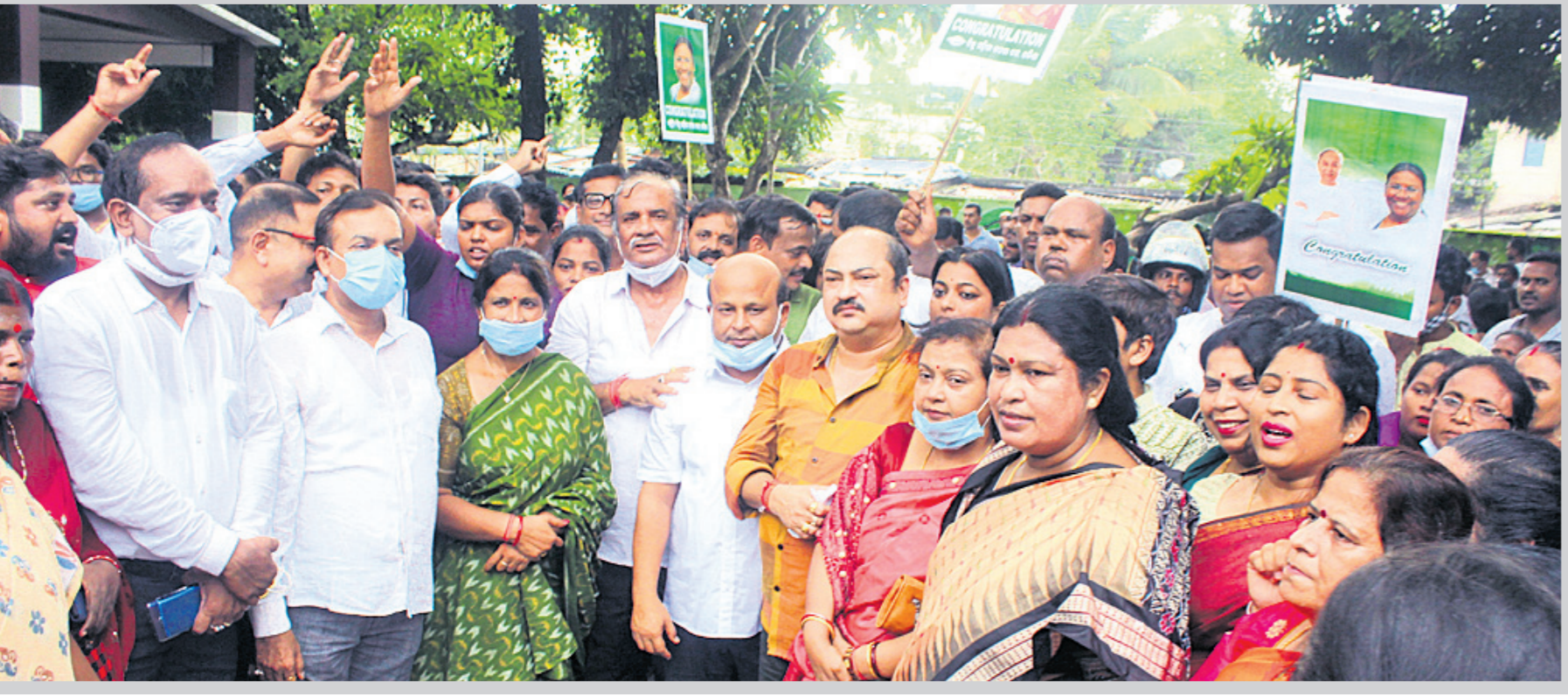
ବିଜେଡି ରାଜ୍ୟ କାର୍ଯ୍ୟାଳୟରେ ଦକାୟ ନେତା ଓ କର୍ମୀଙ୍କ ବିଜୟ ଉତ୍ସବ ପାଳନ ।