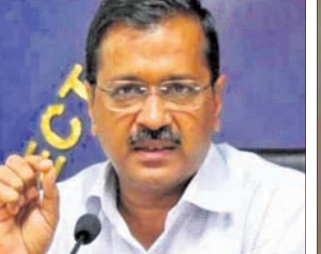
ତଦନ୍ତ କରାଯିବାରୁ ସୁପାରିସ କରିଛନ୍ତି। ଅବକାରୀ ନିଜ ପାଖରେ ଅବକାରୀ