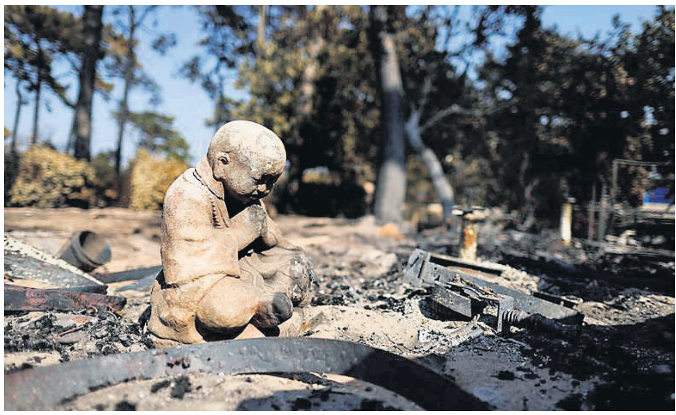
ପ୍ରାନ୍ତର ବିରୋଧ ଅଞ୍ଚଳ ଗ୍ରୀତ ଲା ଚେଷ୍ଟେ-ଡି-ବୁର୍ କଙ୍ଗଲରେ ନିଆଁ ଲାଗିବା ଫଳରେ ଲେସ୍ ଫ୍ଲୋରୁ ବ୍ଲେୟାସ୍ ହୋଟେଲ ଜଳିଯାଇ ଛାଉଣୀର ହୋଇଯାଇଛି। ସେଠାରେ ଏକ ଦଣ୍ଡ ମୂର୍ତ୍ତି ପଡ଼ିରହିଛି।