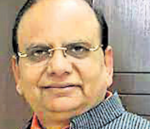
ବିଭାଗ ରଖିଥିବା ଉପମୁଖ୍ୟମନ୍ତ୍ରୀ ମନାସ ସିଂହାପୁରୀଙ୍କୁ ଉପରାଜ୍ୟପାଳ ସକ୍ରେଟାରି ସିଂହାପୁରୀଙ୍କୁ ଉପରାଜ୍ୟପାଳ ସକ୍ରେଟାରି

କେନ୍ଦ୍ରୀୟ ମୁଖ୍ୟମନ୍ତ୍ରୀ ଅବିନି କେନ୍ଦ୍ରୀୟ ଏଲ୍‌ଜି ଅଭିଯୋଗକୁ ଖଣ୍ଡନ କରିଛନ୍ତି। କେନ୍ଦ୍ରୀୟ ଏଲ୍‌ଜି କହିଛନ୍ତି, ସେ ୨୨ ବର୍ଷ ହେଲା ସିଂହାପୁରୀଙ୍କୁ ଜାଣିଛନ୍ତି। ଏହା ଏକ ଫେକ୍ଟ ସିଂହାପୁରୀଙ୍କୁ ଫାୟାଲ ରିପୋର୍ଟ କରିବା ପାଇଁ ଏଲ୍‌ଜି ଏପରି ଅଭିଯୋଗ ଆଣିଛନ୍ତି। ସ୍ୱାସ୍ଥ୍ୟମନ୍ତ୍ରୀ ସତ୍ୟେନ୍ଦ୍ର ଜେନିଙ୍କ ପରେ ସିଂହାପୁରୀଙ୍କୁ ରିପୋର୍ଟ କରିବା ଲାଗି ଭାବି ନେତୃତ୍ୱାଧୀନ କେନ୍ଦ୍ର ସରକାର ଚକ୍ରାନ୍ତ କରିଥିବା କେନ୍ଦ୍ରୀୟ ଏକ ଖବରଦାତା ସମ୍ପର୍କରେ ଅଭିଯୋଗ ଆଣିଛନ୍ତି। ବିଭାଗ ରଖିଥିବା ଉପମୁଖ୍ୟମନ୍ତ୍ରୀ ମନାସ ସିଂହାପୁରୀଙ୍କୁ ଉପରାଜ୍ୟପାଳ ସକ୍ରେଟାରି ସିଂହାପୁରୀଙ୍କୁ ଉପରାଜ୍ୟପାଳ ସକ୍ରେଟାରି