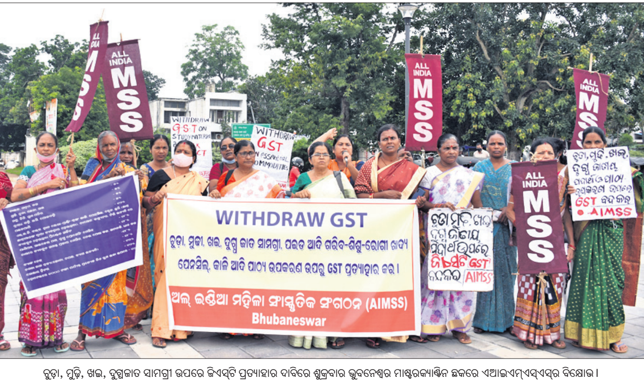
ରୁଡ଼ା, ମୁଡ଼ି, ଖଇ, ବୁଝାକାତ ସାମଗ୍ରୀ ଉପରେ ଜିଏସ୍‌ଟି ପ୍ରତ୍ୟାହାର ଦାବିରେ ଶୁକ୍ରବାର ଭୁବନେଶ୍ୱର ମାଷ୍ଟରକ୍ୟାଣ୍ଟନ ଛକରେ ଏଆଇଏମ୍‌ଏସ୍‌ଏସ୍ ବିଶୋଭ ।