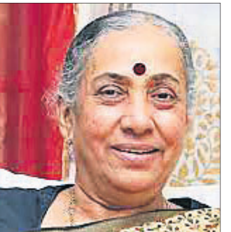
ସମୟ। ସାହସର ପ୍ରତୀକ ମମତା ବିରୋଧୀଙ୍କ ସହ ଛିଡ଼ାହେବେ ବୋଲି ଅଲଭା ଆଶାବାଦୀ ଥିବା ରୁଜ୍ଜ କରିଛନ୍ତି।

ମମତାଙ୍କ ଉଦ୍ଦେଶ୍ୟରେ ମାର୍ଗରେ ଅଲଭାଙ୍କ ଗୁରୁତ୍ୱ