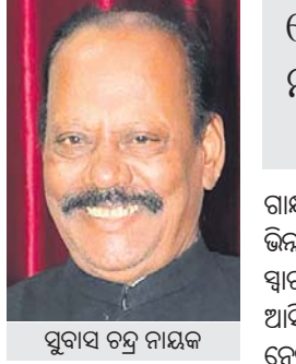
ଶୋକ ପ୍ରକାଶ କଲେ ମୁଖ୍ୟମନ୍ତ୍ରୀ, ବିରୋଧୀ ଦଳ ନେତା