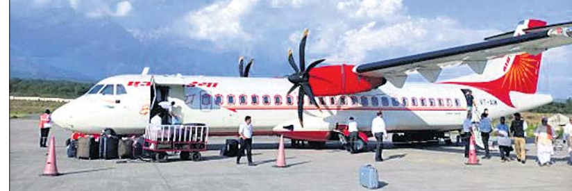
ଝାରସୁଗୁଡ଼ା ଅଫିସ, ୨୪।୭