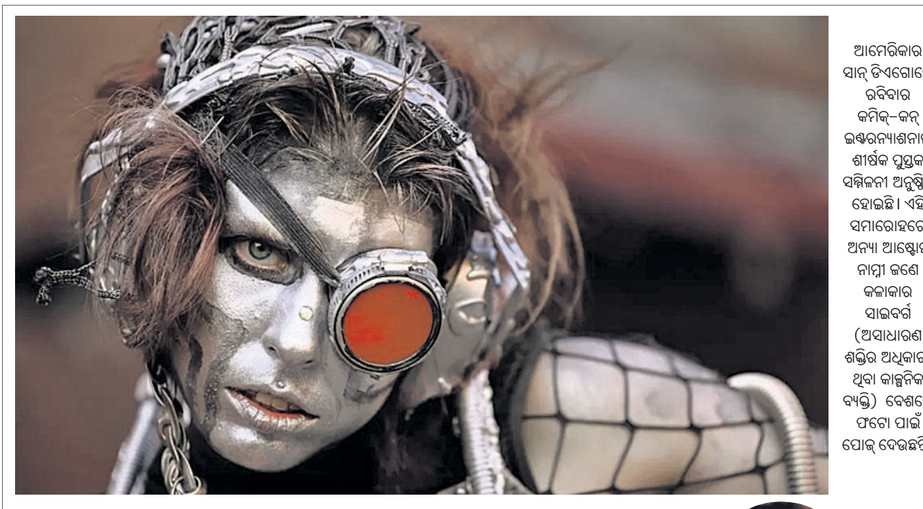
ଆମେରିକାର ସାନ୍ ଡିଏଗୋରେ ରବିବାର କମିକ୍-କର୍ମ ଲକ୍ଷ୍ମଣନାଶନାଲ ଶୀର୍ଷକ ପୁସ୍ତକ ସମ୍ମିଳନୀ ଅନୁଷ୍ଠିତ ହୋଇଛି। ଏହି ସମାରୋହରେ ଅନ୍ୟ ଆସ୍ତ୍ରୋଲ୍ ନାମୀ ଜଣେ କଳାକାର ସାଇବର୍ଣ୍ଣ (ଅସାଧାରଣ ଶକ୍ତିର ଅଧିକାରୀ ଥିବା କାଳ୍ପନିକ ବ୍ୟକ୍ତି) ବେଶରେ ଫଟୋ ପାଇଁ ପୋସ୍ ଦେଉଛନ୍ତି।