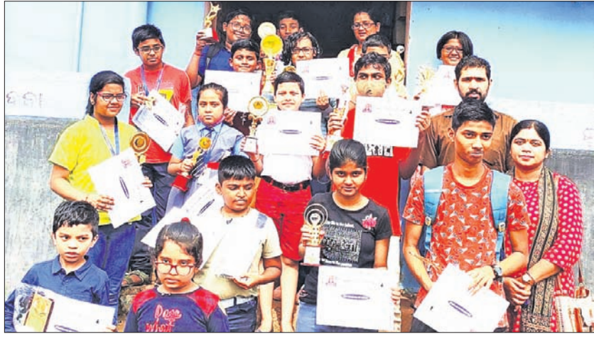
ରାଜ୍ୟ ସ୍କୁଲ୍ ଓପନ ଚେସ୍ କୃତୀ ପ୍ରତିଯୋଗୀମାନେ ପୁରସ୍କାର ସହ ଅତିଥିକ୍ ଗହଣରେ ।