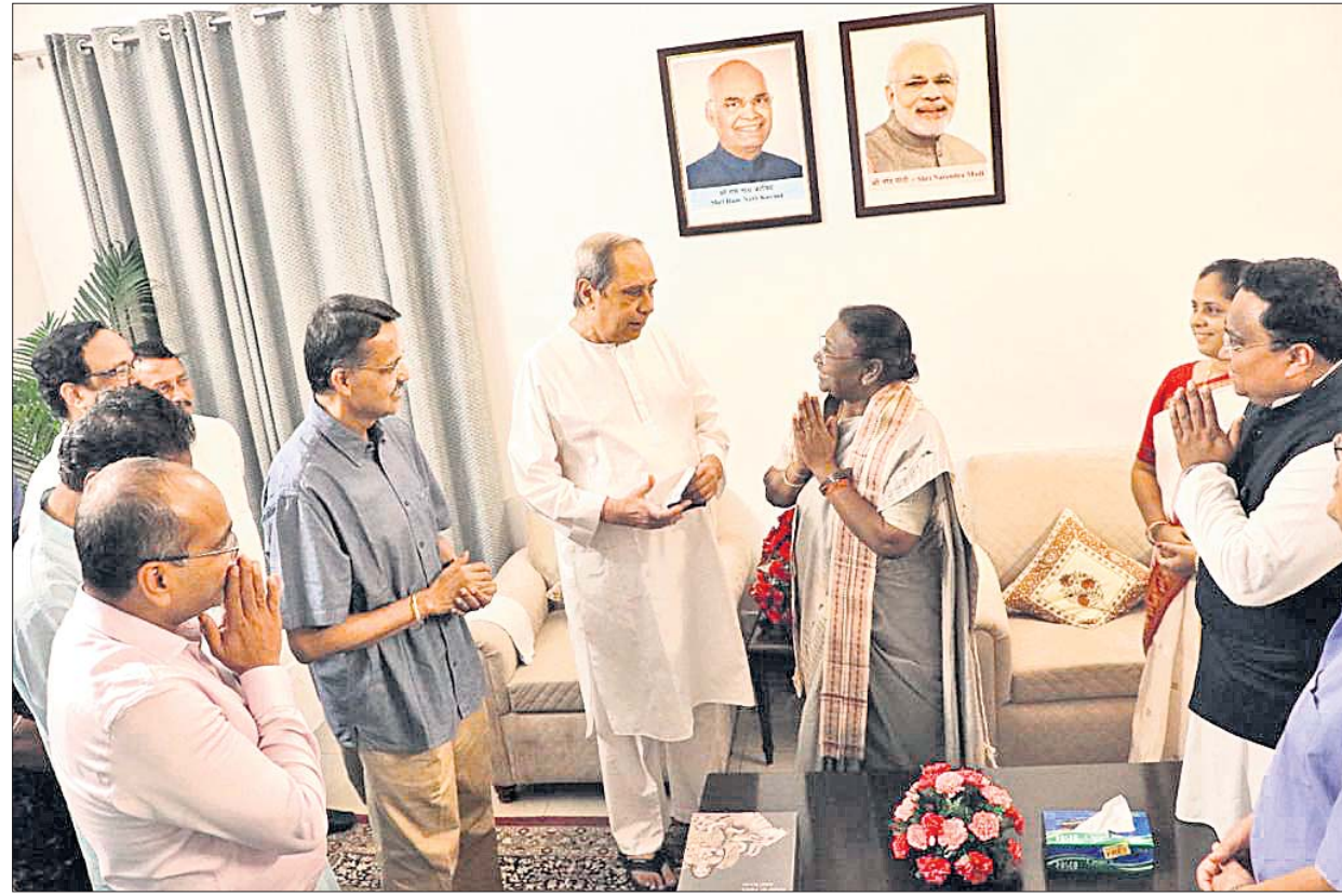
ମୁଖ୍ୟମନ୍ତ୍ରୀ ନବୀନ ପଟ୍ଟନାୟକ ରବିବାର ନୂଆଦିଲ୍ଲୀରେ ନିଜ ଦଳର ଏମ୍ପିମାନଙ୍କ ସହ ନବନିର୍ବାଚିତ ରାଷ୍ଟ୍ରପତି ଦ୍ରୌପଦୀ ମୁର୍ମୁଙ୍କୁ ଭେଟି ଶୁଭେଚ୍ଛା ଜଣାଇଛନ୍ତି (ବାମ)। ଦ୍ରୌପଦୀ ମୁର୍ମୁଙ୍କୁ ଭେଟି ଶୁଭେଚ୍ଛା ଜଣାଇଥିବା ମୟୂରଭଞ୍ଜ ଜିଲ୍ଲା ଭାଜପାର ବିଧାୟକମାନେ।