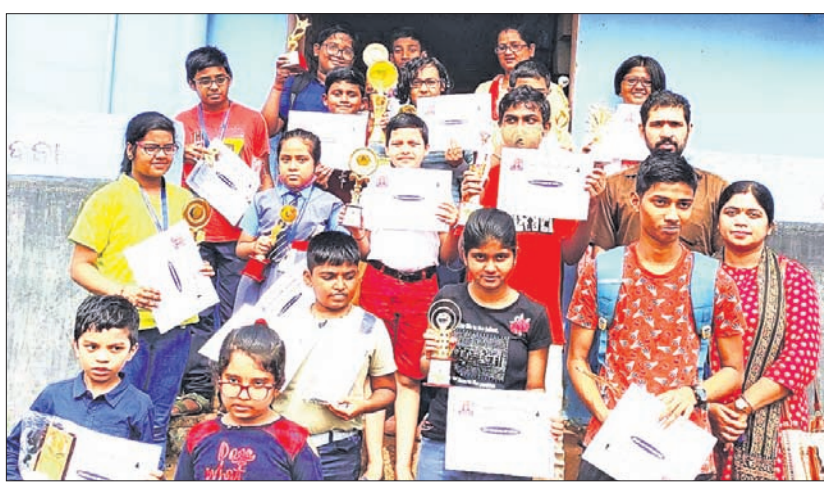
ରାଜ୍ୟ ସ୍କୁଲ୍ ଓପନ ଚେସ୍ କୃତୀ ପ୍ରତିଯୋଗିତାରେ ପୁରସ୍କାର ସହ ଅତିଥିଙ୍କ ଗହଣରେ।

ନହିଲା ଫିଫା ବିଶ୍ୱକପ୍ ମ୍ୟାଚ ହେବା। ଭାରତୀୟ ୨୦ ବର୍ଷରୁ କମ୍ ଦଳର ମୁଖ୍ୟ କୋର୍ଟ ଶର୍ମିଷ୍ଠା ଲେଖକ ଓ ତିନିଦିନ ବିକାଶ ଯୁଗନାମା କଳିଙ୍ଗରେ ୨୩ ଜଣ ଆଶା ଖେଳାଳି ଚାଳିକା ଯୋଗଣା କରିଛନ୍ତି। “ଦକ୍ଷିଣ ଏସିଆରେ ଭାରତ ଏକ ଶକ୍ତିଶାଳୀ ଦଳ ହୋଇଥିବାରୁ ଆଶା ଆକାଂକ୍ଷା ବହୁ ଉପରେ ରହିଛି। ଏହି ପ୍ରତିଯୋଗିତା ଆମ ପାଇଁ ବହୁ ଗୁରୁତ୍ୱପୂର୍ଣ୍ଣ। କାରଣ ମହାମାରୀ ପରେ ପ୍ରଥମଥର ପାଇଁ ଆମ ଖେଳାଳିମାନେ ଅର୍ଚ୍ଚନାତମ ପ୍ରଭୁର ଏକ ପ୍ରତିଯୋଗିତା ଖେଳିବାକୁ ଯାଉଛନ୍ତି” ବୋଲି ଲେଖକ ଗୋଟାସମ କହିଛନ୍ତି। ଗତ ୨ ଦିନରେ ଘରୋଇ ପ୍ରଭୁର ଭାରତୀୟ ଖେଳାଳିମାନେ ଆଇ-ଲିଗ୍ ଏବଂ ଆଇଏସ୍ପିଏ ସିଲ୍ ଚାଲିଥିବା ବେଳେ ଲେଖକ ଗୋଟାସମ ଯୁଗନାମା ଖେଳିବାକୁ ଅଧିକାଂକ୍ଷା କରିଛନ୍ତି। ଭାରତୀୟ ଖେଳାଳିମାନେ ଆଇ-ଲିଗ୍ ଏବଂ ଆଇଏସ୍ପିଏ ସିଲ୍ ଚାଲିଥିବା ବେଳେ ଲେଖକ ଗୋଟାସମ ଯୁଗନାମା ଖେଳିବାକୁ ଅଧିକାଂକ୍ଷା କରିଛନ୍ତି। ଭାରତୀୟ ଖେଳାଳିମାନେ ଆଇ-ଲିଗ୍ ଏବଂ ଆଇଏସ୍ପିଏ ସିଲ୍ ଚାଲିଥିବା ବେଳେ ଲେଖକ ଗୋଟାସମ ଯୁଗନାମା ଖେଳିବାକୁ ଅଧିକାଂକ୍ଷା କରିଛନ୍ତି। ଭାରତୀୟ ଖେଳାଳିମାନେ ଆଇ-ଲିଗ୍ ଏବଂ ଆଇଏସ୍ପିଏ ସିଲ୍ ଚାଲିଥିବା ବେଳେ ଲେଖକ ଗୋଟାସମ ଯୁଗନାମା ଖେଳିବାକୁ ଅଧିକାଂକ୍ଷା କରିଛନ୍ତି।