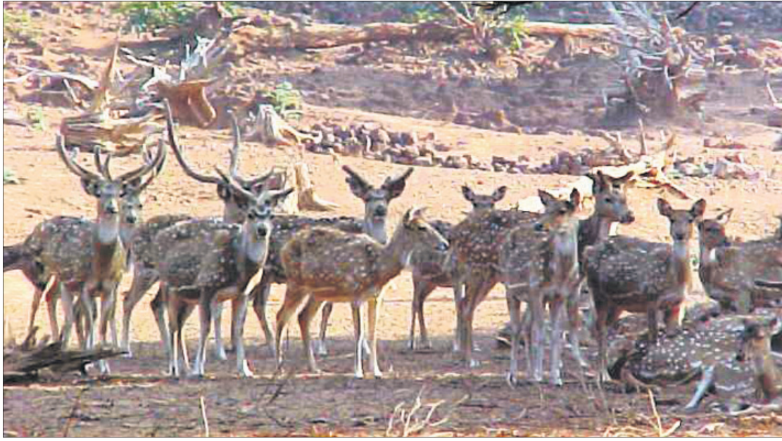
ପ୍ରାଣୀଜଗତରେ ହାନି ହେଉଛି।

କରିବା ପାଇଁ ଗୁଆ ଜୀବକଳ୍ପକୁ ଆଣିବା ଲାଗି ଯୋଜନା ରହିଛି। ହେଲେ ଜୀବକଳ୍ପକୁ ଆଣି ଯୋଗାଇ ଦେବା ପାଇଁ ଏକ ଗୁଆ ପ୍ରାଣୀ ଚିକିତ୍ସା କେନ୍ଦ୍ର ଖୋଲିବା ପାଇଁ ଯେଉଁକି ଚିକିତ୍ସା ପ୍ରକାଶ ପାଇବା କଥା, ତାହା ଦେଖିବାକୁ ମିଳୁନାହିଁ। ଏତେ ବନ୍ୟପ୍ରାଣୀଙ୍କ ସ୍ୱାସ୍ଥ୍ୟାବସ୍ଥା ଦେଖିବା କରାଯାଇ ପାଇଁ ବନ ବିଭାଗ ପକ୍ଷରୁ ମାତ୍ର ଜଣେ ବିଶେଷଜ୍ଞ ଏବଂ ଅନ୍ୟ ଜଣେ କର୍ମଚାରୀଙ୍କୁ ନିୟୋଜିତ କରାଯାଇଛି, ତାହା ମଧ୍ୟ ଠିକାରେ କିଛି ଚିକିତ୍ସା ପାଇଁ ଆବଶ୍ୟକ ସରଞ୍ଜାମ ଅଭାବ