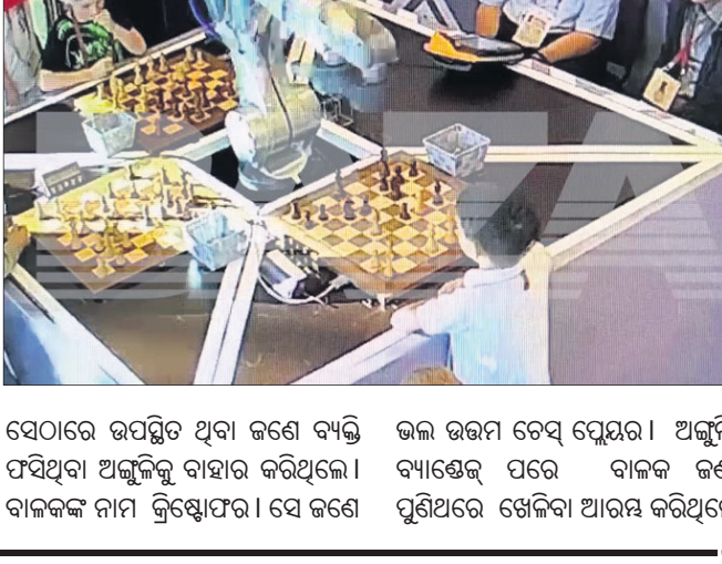
ସେଠାରେ ଉପସ୍ଥିତ ଥିବା ଜଣେ ବ୍ୟକ୍ତି ଭଲ ଉତ୍ତମ ଚେସ୍ ଯେଉଁର। ଅଙ୍ଗୁଳି ପସନ୍ଦିଆ ଅଙ୍ଗୁଳିକୁ ବାହାର କରିଥିଲେ।

ମସ୍କୋ: ରୁଷିଆର ମସ୍କୋରେ ଅନୁଷ୍ଠିତ ଏକ ଚେସ୍ ପ୍ରତିଯୋଗିତାରେ ଏକ ରୋବୋ ଚେସ୍ ଖେଳୁଥିବା ଜଣେ ନାବାଳକ ପ୍ରତିଯୋଗୀଙ୍କ ଅଙ୍ଗୁଳି ଭାଙ୍ଗିଦେଇଥିବାର ଖବର ସାମ୍ନାକୁ ଆସିଛି।