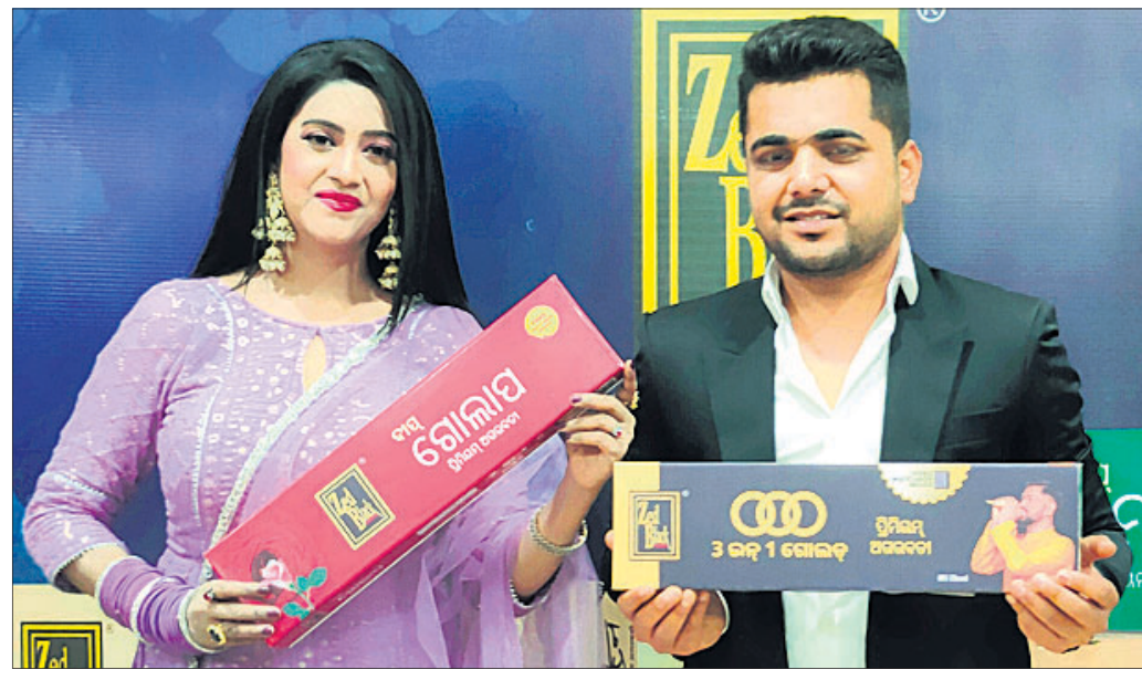
'କେଡ୍ ଲୁକ୍' ଓ 'ସିଆନ୍' ପ୍ରୋଡକ୍ଟର ଉତ୍ପାଦକ କମ୍ପାନୀ ଉଦ୍ଦେଶ୍ୟ ଓ ଗ୍ରାହକ ଚାହାଣୀର ସମ୍ବନ୍ଧରେ ସମୀକ୍ଷା କରୁଥିବା ସମୟରେ ଛବି ଗ୍ରହଣ କରୁଥିଲେ କେ. ଅଶୃଲ୍ ଅଗ୍ରୱାଲ