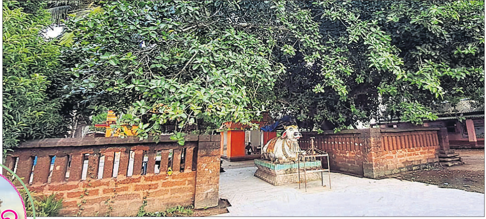
କୋଠଦେଶ ପ୍ରଗଣାର ବଜେଶ୍ୱର ଖମାରର କେନ୍ଦ୍ରରେ ଶ୍ରୀବଜେଶ୍ୱର ମହାଦେବଙ୍କ ମନ୍ଦିରର ପ୍ରବେଶ ପଥ। ସାଉଁଳ ଯୋଗାଇ ନିକଟ ଏହି ଖମାର ଦାରିପତେ ଏବେ ଗଢି ଉଠିଛି ବଣିଆ ସାହି।

ଆମେ ଆଲୋଚନା କରିସାରିଛେ ମନ୍ଦିର ନିର୍ମାଣ ପାଇଁ ଆବଶ୍ୟକ ଦରବ କେଉଁମାନେ ଦେଇଥିଲେ। କେଉଁମାନେ ଚାରୋଟିଆଳ ଶିଳ୍ପା ଶିବିର ଓ ପାଇଟିଆଳଙ୍କ ଖାଦ୍ୟ ବ୍ୟବସ୍ଥା ସହିତ ଜଡ଼ିତ ଥିଲେ। ଆଶ୍ଚର୍ଯ୍ୟ ଲାଗେ ଥରେ ଅଧିକ ଖାଦ୍ୟ ପାଇଁ ଆବଶ୍ୟକ ସାମଗ୍ରୀ ଦେଇଥିଲେ, କିନ୍ତୁ ପ୍ରତିବର୍ଷ ମନ୍ଦିର ନିର୍ମାଣ ଶେଷ ପର୍ଯ୍ୟନ୍ତ ଖାଦ୍ୟ ସାମଗ୍ରୀ ଦେବାର ଉଦାହରଣ ଦି ମିଳେ। ଆଉଟିଆଳର ଶ୍ରୀ ପରବର ପଟ୍ଟନାୟକ କେଉଁଠୁ କେଉଁଠୁ ଖାଦ୍ୟଦ୍ରବ୍ୟ ଯୋଗାଇ ଦେଇଥିଲେ ତାହା ତଦାରଖ କରିଥିଲେ। ତଦାରଖ ପରେ କଣାପଡ଼ିଲା— ରାହାଙ୍ଗ ଦକ୍ଷିଣ ରାଡ଼ସ ପକ୍ଷରୁ ୧,୦୩୪ ଭରଣ ଧାନ ଓ ୨୩୪ ଓଲିଆ ବିରି ପ୍ରତିବର୍ଷ କୋଣାର୍କ ଭଣ୍ଡାରକୁ ଆଣୁଥିଲା। ସେହିପରି କୃତ୍ତିବାସ ଦଣ୍ଡପାଟରୁ ୨,୪୮୭ ଭରଣ ଧାନ ଓ ବିରି, କୋଠଦେଶର ବଜେଶ୍ୱର ଖମାରରୁ ୩,୧୪୦ ଭରଣ ଧାନ (ଭରଣକ ୮୦ ଗଣ୍ଡା), ଚାରିସେଡିଆରେ ସେତେବେଳେ ହିସାବ ହେଉଥିଲା) ୨୦୦ ଛେଳା ନଡ଼ିଆ (ଛେଳାକ ୯୮୩, ପଶକ ୨୦ ଗଣ୍ଡା) ୨୩୪ ଭରଣ ବିରି, ୩୩ ନିର୍ଦ୍ଦେଶକ ଏସ୍.ଏମ୍. ଏକାଡ଼ ଅହମ୍ମଦ ଭରଣ ତମାଧାନ ପ୍ରତିବର୍ଷ ଆଣୁଥିଲା। ବର୍ଷକୁ ଆଣୁଥିବା ଚାଉଳକୁ ଛାଡ଼ି