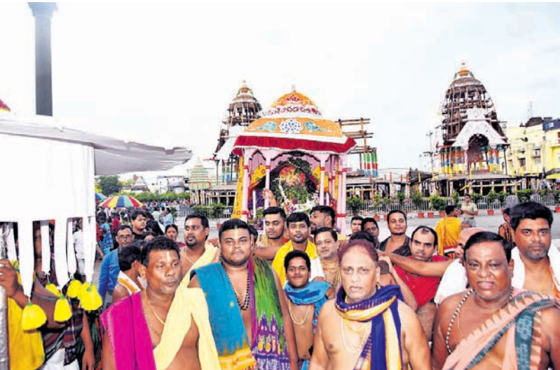
ଚକ୍ରବର୍ତ୍ତୀ ଏକାଦଶୀ ନାତି ସମ୍ପନ୍ନ ଅବସରରେ ଉଦ୍ଧାର ଶ୍ରୀମନ୍ଦିରକୁ ଚକ୍ର ନାରାୟଣଙ୍କୁ ଶ୍ରୀମହେଶ୍ୱର ଚାରି ଆଶ୍ରମ ପରିକ୍ରମା ନିମନ୍ତେ ଶୋଭାଯାତ୍ରାରେ ଦିଆଯାଇଛି।