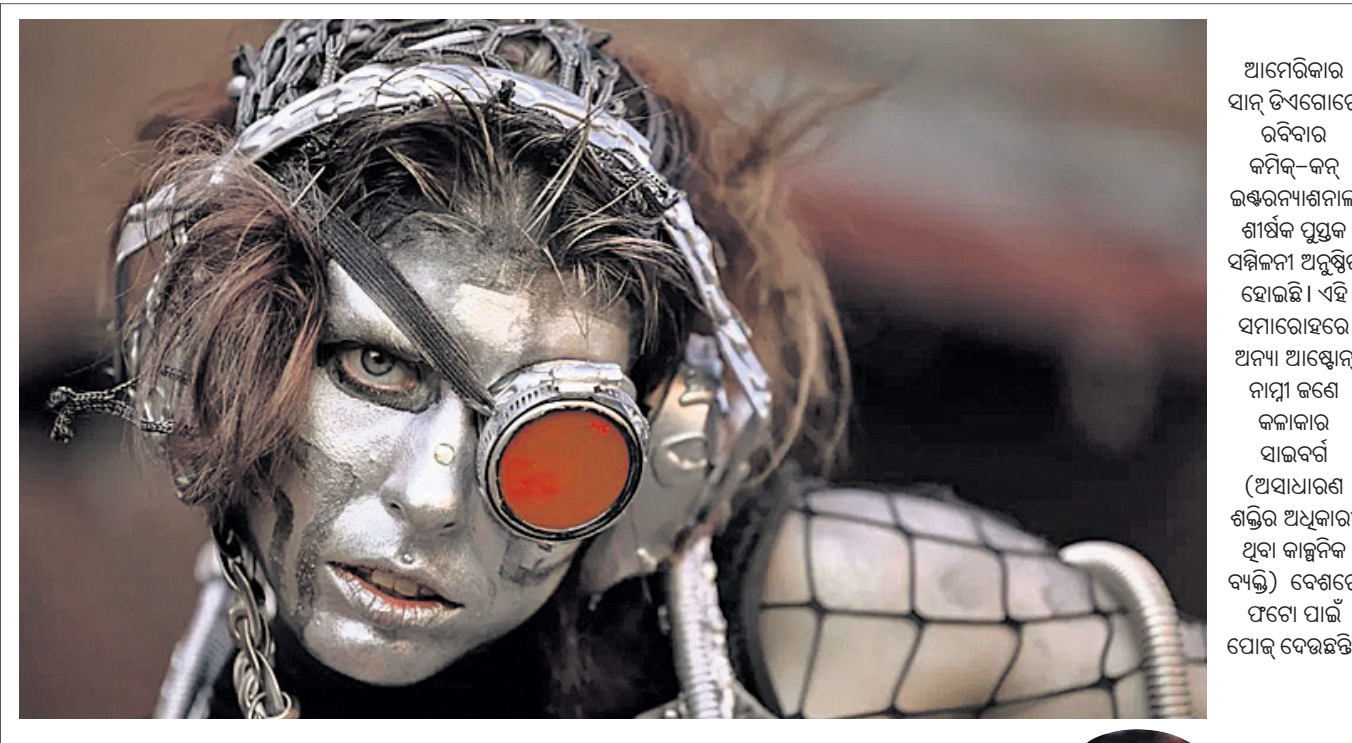
ଆମେରିକାର ସାନ୍ ଡିଏଗୋରେ ରବିବାର କମିକ୍-କନ୍ ଇଣ୍ଡରନିଆଶନାଲ ଶୀର୍ଷକ ପୁସ୍ତକ ସମ୍ମିଳନୀ ଅନୁଷ୍ଠିତ ହୋଇଛି। ଏହି ସମାରୋହରେ ଅନ୍ୟ ଆଷ୍ଟ୍ରିଆନ୍ ନାମୀ ଜଣେ କଳାକାର ସାଇବର୍ଣ୍ଣ (ଅସାଧାରଣ ଶକ୍ତିର ଅଧିକାରୀ ଥିବା କାଳ୍ପନିକ ବ୍ୟକ୍ତି) ବେଶରେ ଫଟୋ ପାଇଁ ପୋସ୍ ଦେଉଛନ୍ତି।