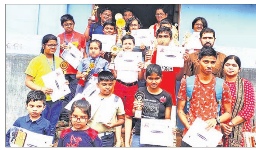
ରାଜ୍ୟ ସ୍କୁଲ ଓପନ ଚେସ୍ କୃତୀ ପ୍ରତିଯୋଗୀମାନେ ପୁରସ୍କାର ସହ ଅତିଥିକ ଗହଣରେ ।