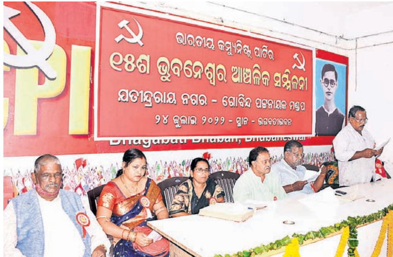
ଭୁବନେଶ୍ୱର ଭଗବତୀ ଭବନରେ ଉଦ୍ଧାର ଅଧ୍ୟକ୍ଷିତ ସିପିଆଇର ୧୫ଶ ଭୁବନେଶ୍ୱର ଆଞ୍ଚଳିକ ସମ୍ମିଳନୀରେ ଉପସ୍ଥିତ ଅଧିବ୍ୟାପକ।