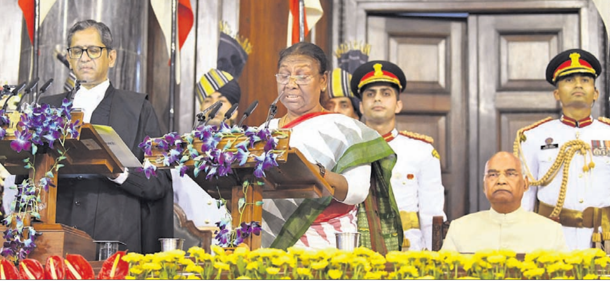
ନୂଆଦିଲ୍ଲୀ, ୨୫।୭ ମୋ ଜୀବନ ପଛେ ନକେ ପଡ଼ିଥାଉ, ଜଗତ ଉଦ୍ଧାର ହେଉ। ଓଡ଼ିଶାର ମହାନ ସମ୍ଭବତା ଭାଗଭୋଜକ ଏହି ବାଣୀ ପାଇଁମେଣ୍ଡର ସେଣ୍ଟାଲ ହଲରେ ଗୁଞ୍ଜରିତ ହୋଇଛି। ସୁଯୋଗ୍ୟା ଓଡ଼ିଆ ସମ୍ଭାନ ଦ୍ରୌପଦୀ ମୁର୍ମୁ ସୋମବାର ଭାରତର ୧୫ତମ ରାଷ୍ଟ୍ରପତି ଭାବେ ଶପଥ ନେବା ପରେ ଦେଇଥିବା ଅଭିଭାଷଣରେ ଭାଗଭୋଜକ ଏହି ମର୍ମସର୍ତ୍ତା ଉକ୍ତିକୁ ଉଦ୍ଧାରଣ କରି ଓଡ଼ିଶାକୁ ଗର୍ବିତ କରିଛନ୍ତି। ଦେଶର ପ୍ରଥମ ଆଦିବାସୀ ଏବଂ ଦ୍ୱିତୀୟ ମହିଳା ରାଷ୍ଟ୍ରପତି ଗୌରବ ଅର୍ଜନ କରିଛନ୍ତି ଦ୍ରୌପଦୀ। ଆଜିର ଦିନ ପ୍ରମାଣିତ କରୁଛି ଯେ, ଦେଶର ଜଣେ ଗରିବ ସମ୍ପଦ ସେହି ତାହାକୁ ପୂରଣ କରିପାରେ ବୋଲି ସେ ଅଭିଭାଷଣରେ କହିଛନ୍ତି।

୧୫ତମ ରାଷ୍ଟ୍ରପତି ଭାବେ ଶପଥ ନେଲେ ଦ୍ରୌପଦୀ ମୁର୍ମୁ