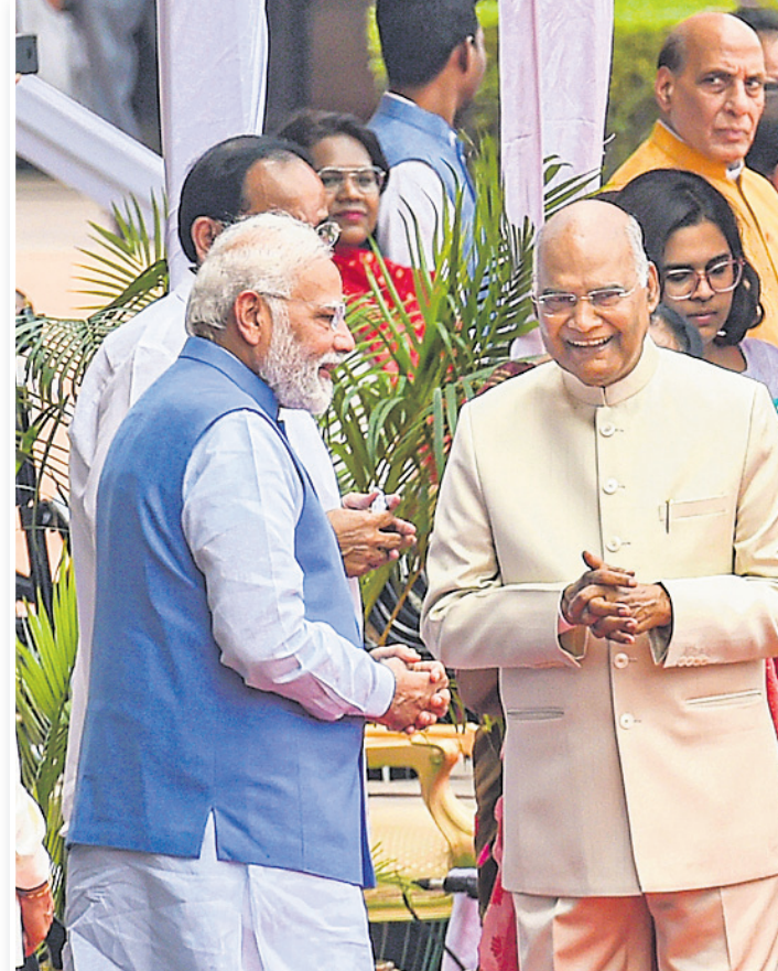
ରାଷ୍ଟ୍ରପତି ଭବନରେ ବିଦାୟ ରାଷ୍ଟ୍ରପତି ରାମନାଥ କୋବିନ୍ଦ, ରାଷ୍ଟ୍ରପତି ଡ୍ରୌପଦୀ ମୂର୍ତ୍ତୀ ଓ ପ୍ରଧାନମନ୍ତ୍ରୀ ନରେନ୍ଦ୍ର ମୋଦି।