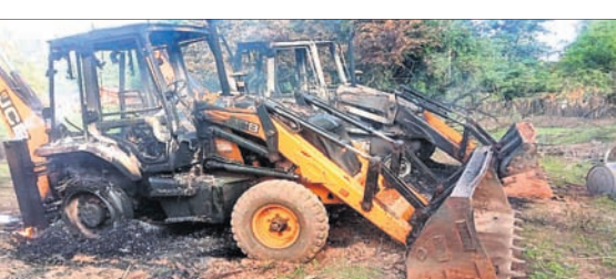
ମାଓବାଦୀମାନେ ଯୋଡ଼ି ଦେଇଥିବା ଜେସିବି ।

ମାଲକାନଗିରି, ୨୫.୭ (ଡି.ଏନ୍.ଏ.): ମାଲକାନଗିରି ଜିଲା ସାମାଜିକ ଛତିଶଗଡ଼ ବିକାସ ପୁଣି ମାଓବାଦୀ ହିଂସା ଦେଖିବାକୁ ମିଳିଛି । ସୋମବାର ସଂଧ୍ୟା ୫ଟାରେ ପଦୋଡ଼ା ଗ୍ରାମରେ ଜିଓ ଟାୟାର ବସାଇବା ପାଇଁ ନିୟୋଜିତ ଥିବା ୩ଟି ଜେସିବି ଗାଡ଼ିରେ ମାଓବାଦୀମାନେ ନିର୍ଦ୍ଦା ଲଗାଇ ଦେଇଥିଲେ । ଏଥିସହ ଏଠାରେ କାମ କରୁଥିବା କର୍ମଚାରୀଙ୍କୁ ମାଡ଼ ମାରିଥିଲେ । ମାଓବାଦୀଙ୍କ ଏପରି କାର୍ଯ୍ୟକଳାପ ନେଇ ଅଞ୍ଚଳରେ ଭୟର ବାତାବରଣ ଖେଳିଯାଇଛି ।