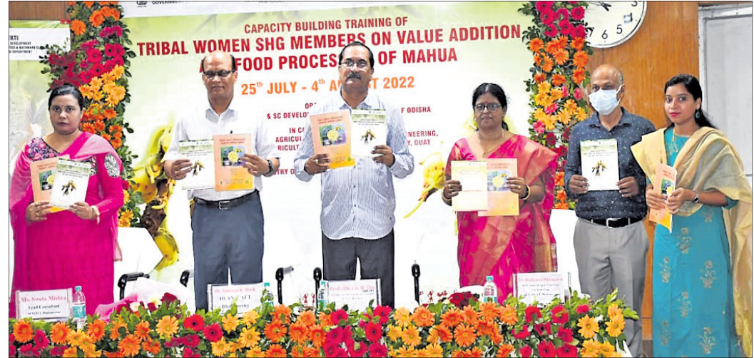
ଉଦ୍‌ଘାଟନା ଉତ୍ସବରେ ଯୋଗଦେଇଥିବା ଅତିଥିମାନେ ।

ମହୁଲର ମୂଲ୍ୟମୁକ୍ତ ଖାଦ୍ୟ ପ୍ରକ୍ରିୟାକରଣ ସଂକ୍ରାନ୍ତରେ ଜନଜାତି ମହିଳା ସ୍ୱୟଂ ସହାୟକ ଗୋଷ୍ଠୀ (ଏସ୍‌ଏଚ୍‌ଜି) ସଦସ୍ୟାଙ୍କ ଦକ୍ଷତା ବୃଦ୍ଧି ପାଇଁ ସୋମବାରରୁ ତାଲିମ କାର୍ଯ୍ୟକ୍ରମ ଆରମ୍ଭ ହୋଇଛି । ରାଜ୍ୟ ସରକାରଙ୍କ ଅନୁସୂଚିତ ଜନଜାତି ଓ ଅନୁସୂଚିତ ଜାତି ଉନ୍ନୟନ ବିଭାଗ ଅଧୀନ ଅନୁସୂଚିତ ଜାତି ଓ ଅନୁସୂଚିତ ଜନଜାତି ଗବେଷଣା ଓ ପ୍ରଶିକ୍ଷଣ ପ୍ରତିଷ୍ଠାନ (ଏସ୍‌ଏସ୍‌ପିଆର୍‌ଟିଆଇ), ଓଡ଼ିଶାରେ କୃଷି ପ୍ରକ୍ରିୟାକରଣ ଓ ଖାଦ୍ୟ ପ୍ରଯୁକ୍ତି ବିଜ୍ଞାନ ବିଭାଗ ଏବଂ ଭାରତ ସରକାରଙ୍କ ଜନଜାତି ବ୍ୟାପାର ମନ୍ତ୍ରାଳୟ ପକ୍ଷରୁ ଏହି ଶିବିର ଆୟୋଜନ କରାଯାଇଛି । ଜନଜାତି ସର୍ବୋତ୍ତମ ସଦସ୍ୟା ତଥା ମହୁଲ ଫୁଲ ସଂଗ୍ରହକାରୀଙ୍କୁ ଉଦ୍ୟୋଗୀ କରି ସେମାନଙ୍କ ଅର୍ଥନୀତିକୁ ଆଗକୁ ନେବା ଲକ୍ଷ୍ୟରେ ଅଗଷ୍ଟ ୪ ପର୍ଯ୍ୟନ୍ତ ଏହି ତାଲିମ ଦିଆଯିବ । ୩ଟି ପର୍ଯ୍ୟାୟରେ ପ୍ରାୟ ୧୦୦ ଜନଜାତି ମହିଳାଙ୍କୁ ତାଲିମ ପ୍ରଦାନ କରାଯିବ ଓ ପ୍ରତ୍ୟେକ ପର୍ଯ୍ୟାୟରେ ଅଧିକ ୩ ଦିନ ରହିବ । ପ୍ରଥମ ପର୍ଯ୍ୟାୟ ୨୫.୭.୨୨, ଦ୍ୱିତୀୟ ୨୮.୭.୨୨ ଓ ତୃତୀୟ ପର୍ଯ୍ୟାୟ ୨୯.୭.୨୨ ଅଗଷ୍ଟ ୪ ପର୍ଯ୍ୟନ୍ତ ଚାଲି ଯିବ । ଆକାଶି କା ଅପୂର୍ବ