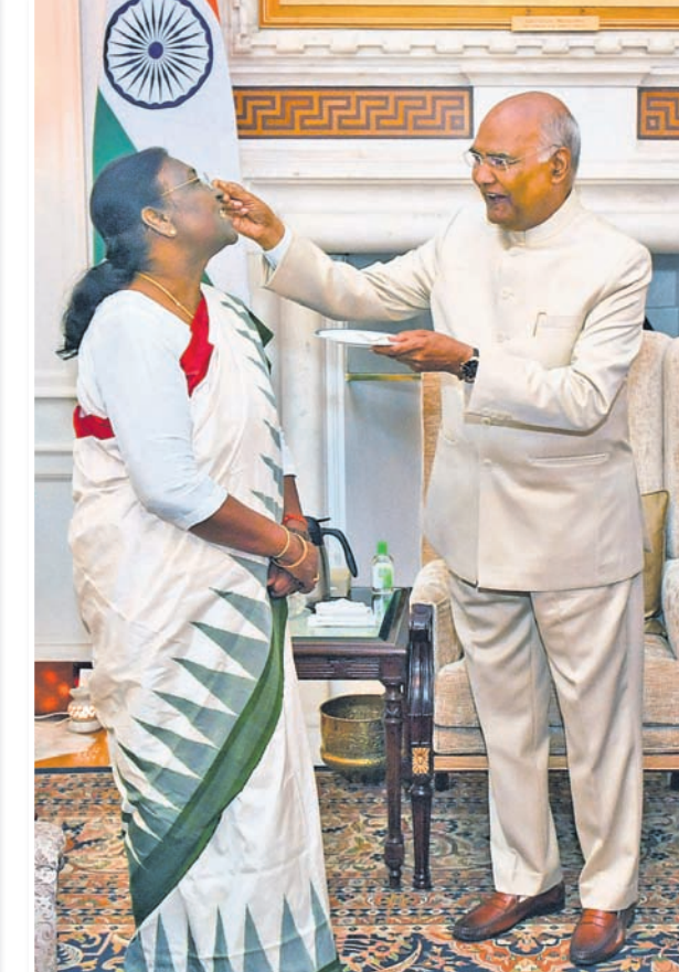
ଶପଥଗ୍ରହଣ ଉପର ପୂର୍ବରୁ ରାଷ୍ଟ୍ରପତି ଭବନରେ ଡ୍ରୌପଦୀଙ୍କୁ ନିଠା ଖୁଆଇଛନ୍ତି ପୂର୍ବତନ ରାଷ୍ଟ୍ରପତି ରାମନାଥ କୋବିନ୍ଦ।