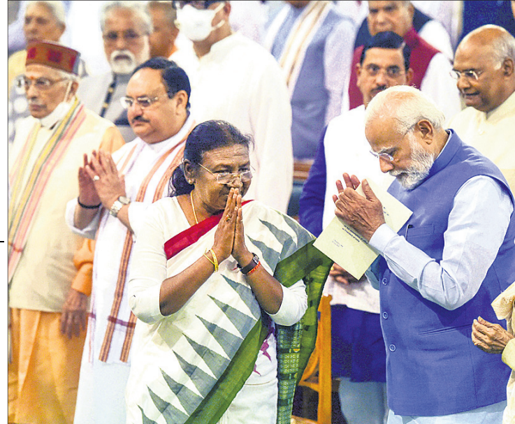
ପାଲିମେଣ୍ଟର ସେଣ୍ଟ୍ରାଲ ହଲରେ ଶପଥଗ୍ରହଣ ଉପର ଅବସରରେ ରାଷ୍ଟ୍ରପତିଙ୍କୁ ଶୁଭେଚ୍ଛା ଜଣାଇଛନ୍ତି ପ୍ରଧାନମନ୍ତ୍ରୀ ନରେନ୍ଦ୍ର ମୋଦି। ନିକଟରେ ଅଛନ୍ତି ପୂର୍ବତନ ରାଷ୍ଟ୍ରପତି ରାମନାଥ କୋବିନ୍ଦ ଓ ଅନ୍ୟ ବରିଷ୍ଠ ଅତିଥି।