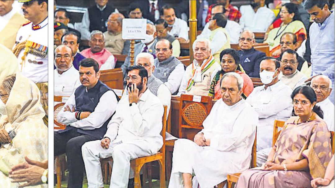
ପାଲିମେଣ୍ଟ ସେଣ୍ଟ୍ରାଲ ହଲରେ ଅନୁଷ୍ଠିତ ଶପଥଗ୍ରହଣ ଉପର ଅବସରରେ ଓଡ଼ିଶା ମୁଖ୍ୟମନ୍ତ୍ରୀ ନବୀନ ପଟ୍ଟନାୟକ, ମହାରାଷ୍ଟ୍ର ମୁଖ୍ୟମନ୍ତ୍ରୀ ଏକନାଥ ଶିନ୍ଦେ, ମଣିଷ୍ଟର ମୁଖ୍ୟମନ୍ତ୍ରୀ ଏନ୍. ବାରେନ୍ଦ୍ର ସିଂ ଓ ଅନ୍ୟ ଅତିଥିସହ।