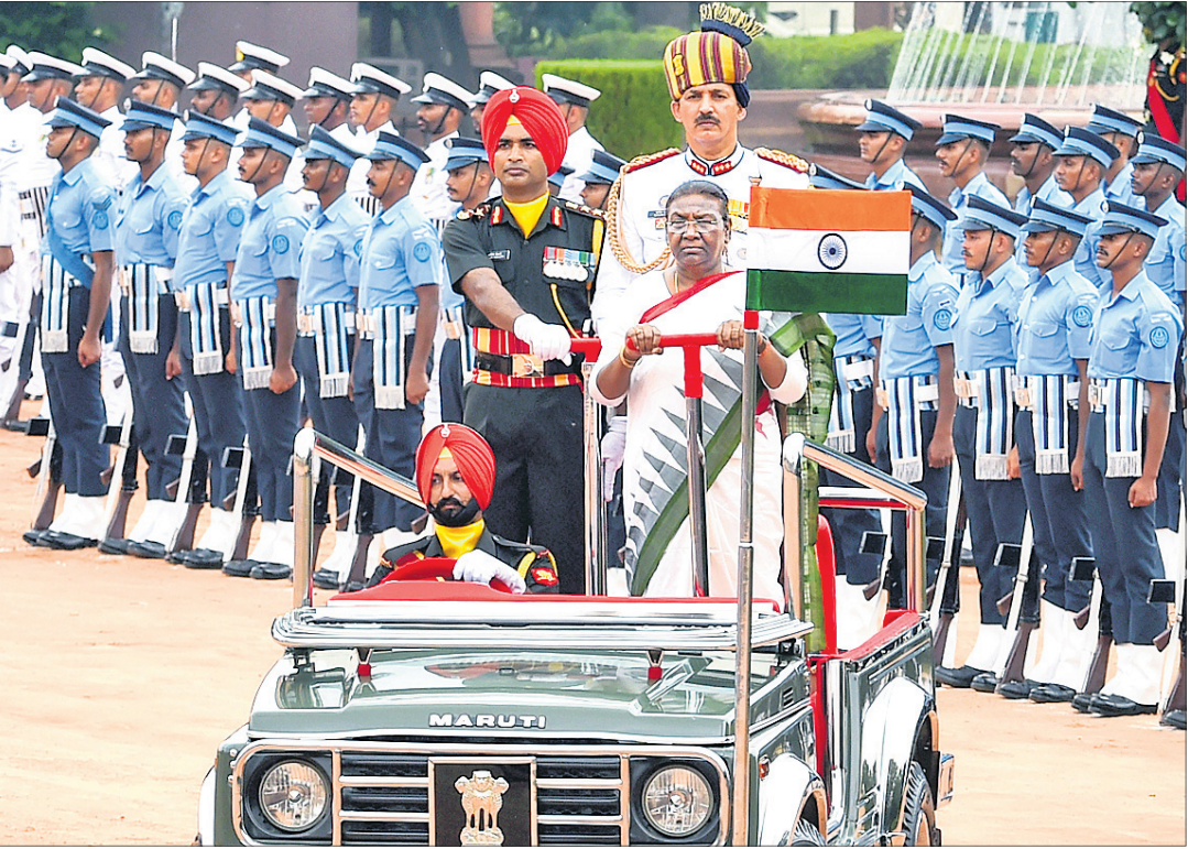
ରାଷ୍ଟ୍ରପତି ଭବନର ତିନିଦିନାର ଗାର୍ଡ ଅଫ ଅନରକୁ ରାଷ୍ଟ୍ରପତି ଡ୍ରୌପଦୀ ମୂର୍ତ୍ତୀ ନିରୀକ୍ଷଣ କରୁଛନ୍ତି। ସରକାରଙ୍କ ଦାୟିତ୍ଵ ନେଇପାରିବେ। ମୁକ୍ତ ଭାଗରେ ସୁରକ୍ଷା ବ୍ୟବସ୍ଥା ପ୍ରତି ବିପଦ ସ୍ଥିତି ଅନିୟନ୍ତ୍ରିତ ହୋଇଗଲେ ରାଷ୍ଟ୍ରପତି ଭଳି ପରିସ୍ଥିତିରେ, ଦେଶ କିମ୍ବା କୌଣସି ଅଞ୍ଚଳରେ କିମ୍ବା ବିଦ୍ରୋହ କାରଣରୁ କରୁଥିବା ନିୟନ୍ତ୍ରଣ ପ୍ରତି ଯୋଷଣା କରିପାରିବେ।

ଅଧିକାରୀ କେନ୍ଦ୍ର କ୍ୟାବିନେଟର ପରାମର୍ଶ କ୍ରମେ ସେ ଆବଶ୍ୟକତାକୁ ଦେଖି କରୁଛନ୍ତି ଯୋଷଣା କରିପାରିବେ। ସାମ୍ବାଦିକ ପୁଷ୍ପ ଭାବେ ସେ ହେଉଛନ୍ତି ସମ୍ବିଧାନର ସଂରକ୍ଷକ। ପାଲିମେଣ୍ଟର ଅଧିକାରୀ ତକାଲିକା କ୍ଷମତା ରାଷ୍ଟ୍ରପତିଙ୍କ ନିକଟରେ ରହିଛି। ସମସ୍ତ ସେନାର ସେ ହେଉଛନ୍ତି ସୁପ୍ରିମ କମାଣ୍ଡର। କେନ୍ଦ୍ର କାର୍ଯ୍ୟକାରୀ ଶକ୍ତି ରାଷ୍ଟ୍ରପତିଙ୍କଠାରେ ନିହିତ। ଡ୍ରୌପଦୀ ମୂର୍ତ୍ତୀ ତାହାକୁ ସିଧାସଳଖ କିମ୍ବା ସମ୍ବିଧାନ ଅନୁସାରେ ଅଧିକାରୀଙ୍କ ମାଧ୍ୟମରେ ପ୍ରୟୋଗ କରିପାରିବେ। କେନ୍ଦ୍ର କ୍ୟାବିନେଟର ନିଷ୍ପତ୍ତିକ୍ରମେ ସେ ଲୋକ ସଭାକୁ ଭଙ୍ଗ କରିପାରିବେ। ପାଲିମେଣ୍ଟ ଅଧିକାରୀ ଚାଲି ନ ଥିବାବେଳେ ରାଷ୍ଟ୍ରପତି ସେ କୌଣସି ସମୟରେ ଅଧିକାରୀ ଆଣିପାରିବେ। ସେ ବିଭାଜନ ଏବଂ ଆର୍ଥିକ ବିଲ୍ ଆଣିବା ପାଇଁ ସୁପାରିସ କରିବା ସହ ବିଧାନସଭାକୁ ସ୍ଵୀକୃତି ଦେଇପାରିବେ। କେତେକ କ୍ଷେତ୍ରରେ ଦଣ୍ଡ ପାଇଥିବା କୌଣସି ବ୍ୟକ୍ତିଙ୍କୁ ଦଣ୍ଡବିଧାନ କୋହଳ କରିବା, କ୍ଷମା ପ୍ରଦାନ କରିବା କିମ୍ବା ଦଣ୍ଡକୁ ଖାରଜ କରିବା ଭଳି କ୍ଷମତା ଡ୍ରୌପଦୀ ମୂର୍ତ୍ତୀଙ୍କ ପାଖରେ ରହିବ। କୌଣସି ରାଜ୍ୟରେ ସାମ୍ବାଦିକ ସଙ୍ଗତ ଦେଖାଦେଲେ ରାଷ୍ଟ୍ରପତି ନିଜ ସେବାକାରୀ