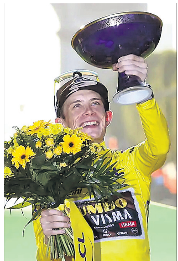
ଡ୍ରପି ସହ ଜୋନାସ ଭିଜେଗାର୍ଡ଼।

ପ୍ୟାରିସ, ୨୫୭ ଡେନମାର୍କର ଜୋନାସ ଭିଜେଗାର୍ଡ଼ ପ୍ରଥମ ଥର ପାଇଁ ଡି' ଫ୍ରାନ୍ସ ସାଇକେଲ ରେସ୍ ଜିତିଛନ୍ତି। ଫଳରେ ଗତ ଦୁଇବର୍ଷ ହେଲା ଏହି ରେସ୍ ଜିତିଆସୁଥିବା ଚାଉଟଳ ପୋଡ଼ାକାରଙ୍କ ଆଧିପତ୍ୟର ଅନ୍ତ ଘଟିଛି। ୩,୩୫୦ କିଲୋମିଟର ଦୂରତା ବିଶିଷ୍ଟ ଏହି କଷ୍ଟସାଧ ରେସ୍ ସମ୍ପାଦନ କରି ଚାଲିଥିଲା। ବେଲଜିୟମର କାନ୍ସର ଫିଲିପ୍ସେନ୍ ଫାଇନାଲ ଷ୍ଟେଜର ଶ୍ରେଣୀ ଜିତିଥିଲେ। ଜେନେରାଲ କ୍ଲାସିଫିକେସନରେ ଭିଜେଗାର୍ଡ଼ ଗତବର୍ଷ ଚାମ୍ପିୟନ ଚାଉଟଳ