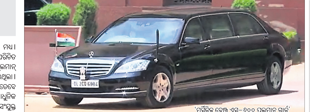
ଏହାର ଆକାଶଚାରୀ ତିକାଜନ ସ୍ଵତନ୍ତ୍ର ପ୍ରକାରର। ଏଥିରେ ଅକ୍ସିଜେନ୍ ବ୍ୟବସ୍ଥା, ଅଟୋମେଟେଡ୍ ଲାଇଟ୍ କଣ୍ଟ୍ରୋଲ୍, କରୁଥିବା ଆକାଶ ସମେତ ଅନ୍ୟାନ୍ୟ ସୁବିଧା ରହିଛି। ମୁହାଁମୁହାଁ ଭାବେ ଏଥିରେ ୪ଜଣ ବସିପାରିବେ। ଗାଡ଼ିରେ ଯେଉଁ ଅକ୍ସିଜେନ୍ ସୁବିଧା ଉପଲବ୍ଧ, ତାହା ପଛରେ ଏକ ଗୁରୁତ୍ଵପୂର୍ଣ୍ଣ କାରଣ ରହିଛି। ଯଦି କୌଣସି ସମୟରେ ଗାଡ଼ି ଦୁର୍ଘଟଣାର ସମ୍ମୁଖୀନ ହୁଏ କିମ୍ବା ରାସ୍ତାରେ କିମ୍ବା ପ୍ରୟୋଗ କରାଯାଏ, ତେବେ ଏହା କାମରେ ଆସିବ। ଏହି ବ୍ୟବସ୍ଥା ସ୍ଵୟଂଚାଳିତ ଭାବେ ଦୀର୍ଘ ସମୟ ଯାଏ ନିରନ୍ତର ଅକ୍ସିଜେନ୍ ଯୋଗାଇ କରି ଜୀବନ ରକ୍ଷାରେ ସହାୟକ ହେବ। କରୁଥିବା ପରିସ୍ଥିତି ଉପରେ ଗାଡ଼ିର ଗୁରୁତ୍ଵପୂର୍ଣ୍ଣ ସ୍ଥାନକୁ ଆପେଆପେ ସଙ୍କେତ ଚାଲିଯାଏ। ଏହା ଭିତରେ ଦୁଇଟି ଦୁର୍ଘଟଣା ପ୍ରତିରୋଧୀ ଏୟାର ବ୍ୟାଗ୍ ଲଗାଯାଇଛି। ସେହିପରି ପଛପାଖରେ ସ୍ଵତନ୍ତ୍ର ଭାବେ ଔଷଧାବ୍ୟାଗ୍ ଖଞ୍ଜାଯାଇଛି। ତେବେ ସୁରକ୍ଷା ଦୃଷ୍ଟିରୁ ରାଷ୍ଟ୍ରପତିଙ୍କ ଏହି ବାହନ ସମ୍ପୂର୍ଣ୍ଣ ସୁରକ୍ଷା ସୁତରାପୀ ବ୍ୟବସ୍ଥା କରାଯାଇଛି।

ନୂଆଦିଲ୍ଲୀ, ୨୫୭ ରାଷ୍ଟ୍ରପତି ଭାବେ ଶପଥ ନେଇଛନ୍ତି ଡ୍ରୌପଦୀ ମୂର୍ତ୍ତୀ। ଦେଶର ପ୍ରଥମ ନାରୀ ଭାବେ ତାଙ୍କୁ ନିଜ ପଦାର୍ପଣାଦା। ସୁରକ୍ଷା ଏବଂ ସମ୍ମାନ ଦୃଷ୍ଟିକୋଣରୁ ଯୋଗାଇ ଦିଆଯିବ ସର୍ବୋଚ୍ଚ ମୁକ୍ତି। ଯାତାଯାତୀରେ ଆରମ୍ଭ କରି ଖାଦ୍ୟପେୟ ଯାଏ ରଖାଯିବ ସ୍ଵତନ୍ତ୍ର ଧାନ। ଏସବୁ ଭିତରେ ପୁଣି ଅଧିକ ଚଳାଣି ଆଣି ରାଷ୍ଟ୍ରପତି ଚଳୁଥିବା ବିଳାସପଥ ଗାଡ଼ି 'ମର୍ସିଡିଜ୍ ବେଞ୍ଜ୍ ଏସ୍-୬୦୦ ପୁଲମାନ୍ ଗାର୍ଡ'। ଏହା ଭାରତର ସର୍ବୋଚ୍ଚ ସୁରକ୍ଷିତ ବାହନଗୁଡ଼ିକ ମଧ୍ୟରୁ ଅନ୍ୟତମ। ବିଦାୟ ରାଷ୍ଟ୍ରପତି ରାମନାଥ କୋବିନ୍ଦଙ୍କୁ ସେବାଯୋଗାଇ ଆସୁଥିଲା 'ମର୍ସିଡିଜ୍ ବେଞ୍ଜ୍ ଏସ୍-୬୦୦ ପୁଲମାନ୍ ଗାର୍ଡ'। ଏବେ ନୂତନ ରାଷ୍ଟ୍ରପତି ମୂର୍ତ୍ତୀଙ୍କ ସେବାରେ ଏହାକୁ ନିଯୋଜିତ କରାଯିବ। ରାଷ୍ଟ୍ରପତି ଯେଉଁ ଗାଡ଼ି ଚଳିବେ, ତାହାର ବୈଶିଷ୍ଟ୍ୟ