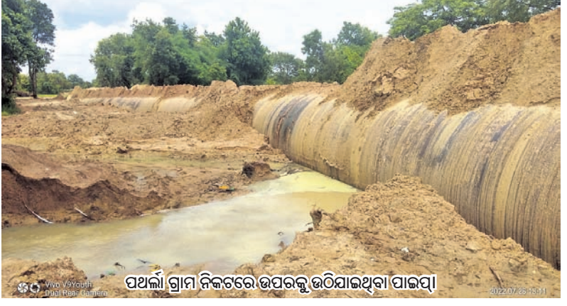
ପଥଲୀ ଗ୍ରାମ ନିକଟରେ ଉପରକୁ ଉଠିଯାଇଥିବା ପାଇପ୍