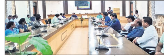
ବୈଠକରେ ଜିଲ୍ଲାପ୍ରଧାନ ଅଧିକାରୀମାନେ ଆଲୋଚନା କରୁଛନ୍ତି।