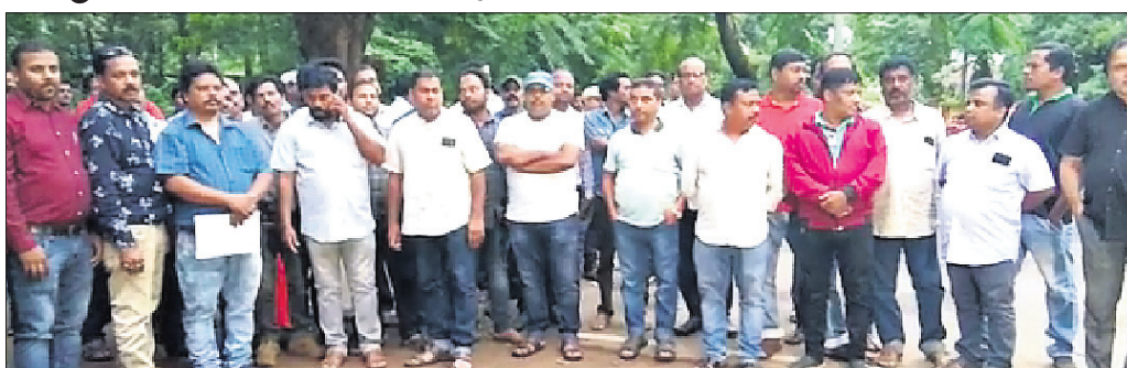
ସିଆର୍ସିଏମାନଙ୍କ ବିରୋଧ ନିଆଯାଇଥିବା ପଦକ୍ଷେପକୁ ଶିକ୍ଷକ ସଂଘ ଓ ଭାବପା କର୍ମକର୍ତ୍ତା ବିରୋଧ କରୁଛନ୍ତି।

ରାଜ୍ୟ ସରକାର ପିଏମ୍ ପୋକ୍ଷା ଯୋଜନାରେ ସ୍ଥୁଳଗୁଡ଼ିକରେ ମଧ୍ୟାହ୍ନଭୋଜନ ଚାର୍ଝ ବ୍ୟବସ୍ଥା କରାଯାଇଥିବା ଅନିୟମିତତା ଅଭିଯୋଗକୁ ଆଧାରକରି କୋରାପୁଟ ଜିଲ୍ଲାରେ କାର୍ଯ୍ୟରତ ୧୧୪ ଜଣ ସିଆର୍ସିଏ ଓ ୧୩ ଜଣ ଡାକ୍ତା ଏଣ୍ଡ୍ ଅପରେଟରଙ୍କୁ କାର୍ଯ୍ୟରୁ ବହିଷ୍କାର କରାଯାଇଥିଲା।