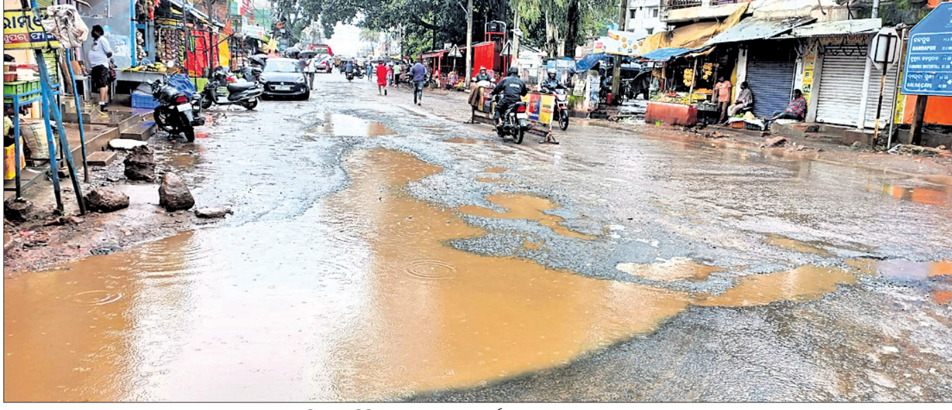
କୋରାପୁଟ ଜିଲ୍ଲା ସେମିକିଗୁଡ଼ା ସହରରେ ଅଳ୍ପ ବର୍ଷରେ ଶୋଚନୀୟ ହୋଇପଡ଼ୁଥିବା ରାସ୍ତା ।

ପଞ୍ଚାୟତରେ ଶିଶୁମାନେ ଅପସ୍ତୁରିତ ଶିକାର ହେଇଥିବା ଦେଖିବାକୁ ମିଳୁଛି। ଛୁଟି ଛୁଟି ପ୍ରଶାସନ ଏଥିପ୍ରତି ଦୃଷ୍ଟି ଦେବାକୁ ଅଞ୍ଚଳବାସୀ ଦାବି କରିଛନ୍ତି।