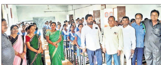
ଏକ ବିଦ୍ୟାଳୟରେ ଛାତ୍ରାଛାତ୍ରୀଙ୍କ ଗହଣରେ ଜିଲ୍ଲା ପରିଷଦ ଅଧକ୍ଷା ସମାଜିକ ଚାଳକ।

ସ୍କୁଲ ଦେଖିଛନ୍ତି। ମଣିଷକୁ ଯାଇଥିବା ରାସ୍ତାର ଉନ୍ନତି ସହ ଉକ୍ତ ଅଞ୍ଚଳରେ ସେଲାର ଲାଇଟ୍ ବ୍ୟବସ୍ଥା କରି ଏହାର ଉନ୍ନତୀକରଣ କରାଯିବାରୁ ଆଲୋଚନା ହୋଇଛି।