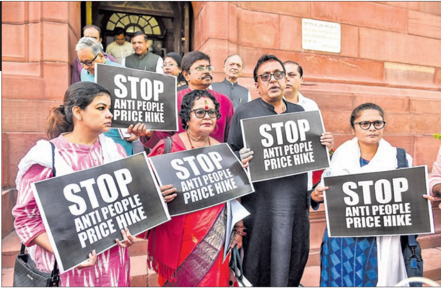
ଦରଦାମ ବୃଦ୍ଧି ପ୍ରତିବାଦରେ ମଙ୍ଗଳବାର ପାଇଁନେତାଙ୍କ ହାତସ୍ତକ ଚିତ୍ରଣ ଏମ୍ପିକ ବିଶୋଭ।

ତେଲୁ ନେଇ ଟେଲ, ଅଟା ନେଇ ଔଷଧ ସବୁ ସାମଗ୍ରୀର ଦରଦାମ ବଢ଼ିବାରେ ଲାଗିଛି। କେନ୍ଦ୍ର ସରକାର ନିଜ ରାଜନୈତିକ ମହତ୍ତ୍ୱାକାଂକ୍ଷାକୁ ଚରିତାର୍ଥ କରିବା ପାଇଁ ପ୍ରତ୍ୟେକ ଜିନିଷ ଉପରୁ ଖାଉଟିଙ୍କଠାରୁ ଉଚ୍ଚ ଟିକସ ଅସୁଲ କରୁଛନ୍ତି। ଆକାଶକୁଆଁ ଦରବୃଦ୍ଧିକୁ ନେଇ ଦେଶବାସୀ ହତସ୍ତକ। ଏହି ପ୍ରସଙ୍ଗ ଉଠାଇଲେ ବିରୋଧୀ ନେତାଙ୍କ ଘରେ ପ୍ରବର୍ତ୍ତନ ନିର୍ଦ୍ଦେଶାଳୟ (ଇଡି), କେନ୍ଦ୍ରୀୟ ତଦନ୍ତ ବ୍ୟୁରୋ (ସିବିଆଇ) ତତ୍ପର କରୁଛି ଏବଂ ପାଇଁନେତାଙ୍କ ସଦସ୍ୟମାନଙ୍କୁ ଗୃହକୁ ନିଲମ୍ବନ କରାଯାଉଛି। ଏଭଳି ଅଭିଯୋଗ ଆଣି ମଙ୍ଗଳବାର ବିରୋଧୀ ଦଳଗୁଡ଼ିକ ନୂଆ ରାଷ୍ଟ୍ରପତି ଡ୍ରୋପଦୀ ମୁକୁନ୍ଦ ପତ୍ର ଲେଖି ବ୍ରିଟ ହସ୍ତକ୍ଷେପ ଲୋଡ଼ିଛନ୍ତି।