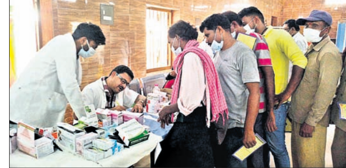
ସଫେଇ କର୍ମଚାରୀମାନେ ସ୍ଵାସ୍ଥ୍ୟ ପରୀକ୍ଷା କରାଉଛନ୍ତି।

କନ୍ୟପୁର ପୌର ପରିଷଦ ଅଧୀନ ସଫେଇ କର୍ମଚାରୀଙ୍କ ପାଇଁ ସଫେଇ କର୍ମଚାରୀଙ୍କ ପାଇଁ ସ୍ଵାସ୍ଥ୍ୟ ପରୀକ୍ଷା ଶିବିର ଅନୁଷ୍ଠିତ ହୋଇଛି। ୧୮୦ କର୍ମଚାରୀଙ୍କୁ ପରୀକ୍ଷା କରାଯାଇଛି।