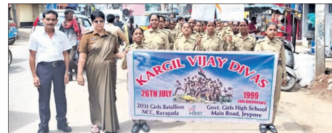
କନ୍ୟପୁର ସରକାରୀ ବାଳିକା ଉଚ୍ଚ ବିଦ୍ୟାଳୟ ପକ୍ଷରୁ ବାହାରିଥିବା ଶୋଭାଯାତ୍ରା।

ବିଭିନ୍ନ ଅନୁଷ୍ଠାନ ପକ୍ଷରୁ କାର୍ତ୍ତିକ ବିଜୟ ଦିବସ ପାଳନ ହୋଇଛି। ଏହି ଦିବସ ପାଳନ ହୋଇଛି। କନ୍ୟପୁର ସଦର ମହକୁମା ବାଳିକା ଉଚ୍ଚ ବିଦ୍ୟାଳୟରେ ପ୍ରଧାନ ଶିକ୍ଷକ ଅଧିକାରୀଙ୍କ ପକ୍ଷରୁ ମହାପାତ୍ର ଓ ଏନ୍.ସି.ସି. ଶିକ୍ଷକମାନଙ୍କୁ ଏନ୍.ସି. ଭାବରେ ଆଜ୍ଞା ଦେବୁଥିବା ସମୟରେ ପ୍ରମୁଖ ଶିକ୍ଷକମାନେ ଶ୍ରଦ୍ଧାଘାତ ଦେଇଥିଲେ।