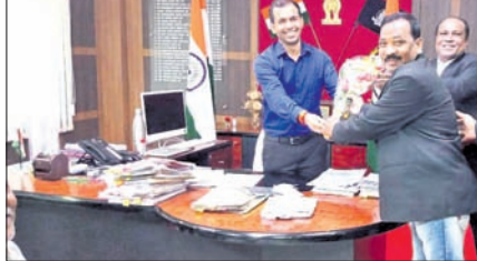
ଓକିଲ ସଂଘ ପକ୍ଷରୁ ଜିଲ୍ଲାପାଳଙ୍କୁ ସମ୍ମାନିତ କରାଯାଇଛି।