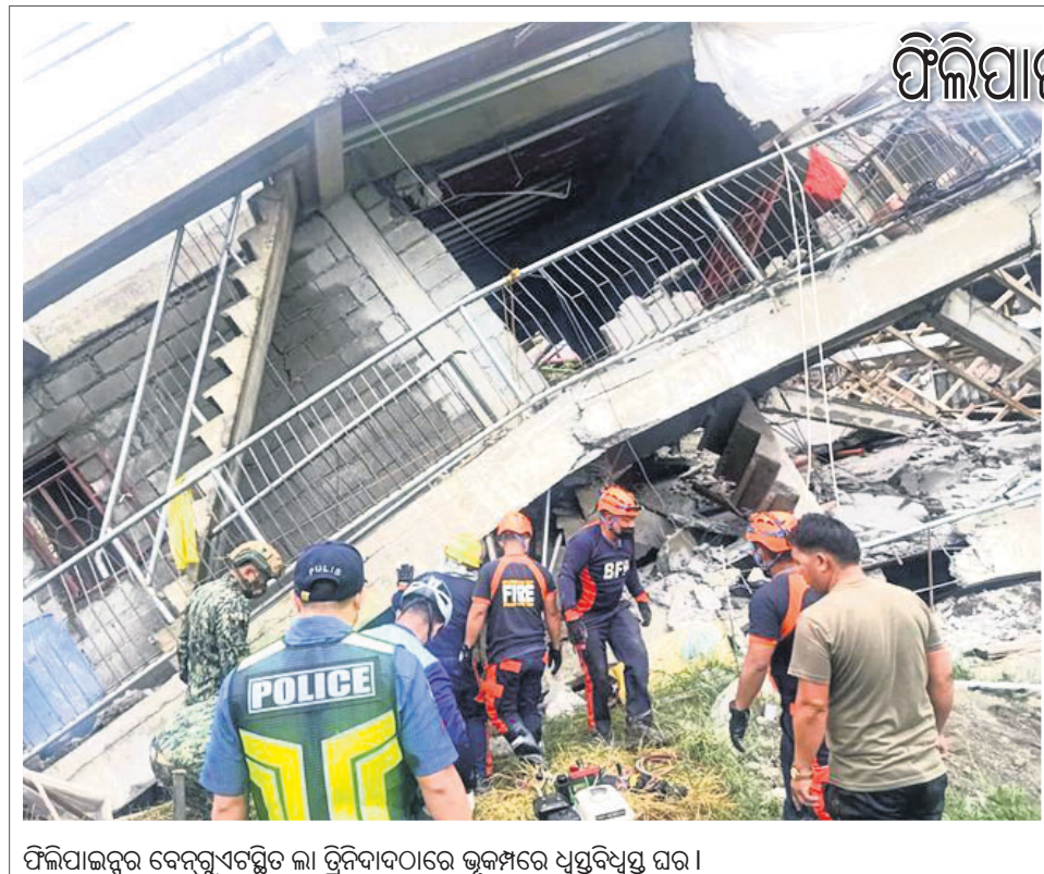
ଫିଲିପାଇନ୍ସରେ ବେଙ୍ଗଲୁ-ଏଟିକ୍ସ ଲା ଟ୍ରେନିଂବାଦରେ ଭୁଲ୍ମରେ ଧୁସୁରିବୁଧ ଘର।

ଗୁଜରାଟରେ ବିଷାକ୍ତ ମଦ: ମୃତ୍ୟୁସଂଖ୍ୟା ୪୦କୁ ବୃଦ୍ଧି ଅହମ୍ମଦାବାଦ, ୨୭ତା: ଗୁଜରାଟରେ ବିଷାକ୍ତ ମଦକିଲିତ ମୃତ୍ୟୁସଂଖ୍ୟା ବୃଦ୍ଧି ହୋଇଛି।