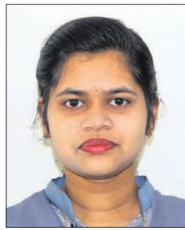
ସୌମ୍ୟା ସ୍ନାତକ ବିତା