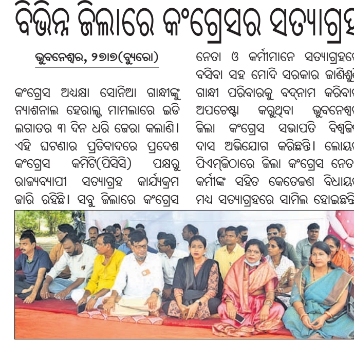
ସୋନିଆ ଗାନ୍ଧୀଙ୍କୁ ଭେଟି କେନ୍ଦ୍ରୀୟ ପ୍ରତିବାଦରେ ରୁଧିରା ଉତ୍ତରକୋଣାର ଲୋକସଭା ପିଏମ୍ପିଠାରେ ଜିଲ୍ଲା କଂଗ୍ରେସ ପକ୍ଷରୁ ଧାରଣା।

କୋଲକାତା, ୨୭/୭ ପଶ୍ଚିମବଙ୍ଗ ରାଜ୍ୟ ଦଳ ଭୃତ୍ୟୁଙ୍କ କଂଗ୍ରେସ (ଟିଏମ୍ସି)ର ୩୮ ଜଣ ବିଧାୟକ ଭାଜପା ସହ ସମ୍ପର୍କରେ ରହିଥିବା ଅଭିଯୋଗ ତଥା ଭାଜପା ନେତା ମିଥୁନ ଚକ୍ରବର୍ତ୍ତୀ ଏକ ଖବରଦାତା ପୂର୍ବନା ଦେଖାଇଛନ୍ତି। ଶିକ୍ଷକ ନିମ୍ମୁଳି ପୁରୀରେ କରି ଲୋକଙ୍କୁ କମ୍ପୂରଣ ଶାସକ ଦଳ ପକ୍ଷରୁ କୁହାଯାଇଛି। ୨୧ ଜଣ ଟିଏମ୍ସି ବିଧାୟକ ସିଧାସଳଖ ଡାକ ସହ ଯୋଗାଯୋଗ କରିଥିବା ମିଥୁନ କହିଛନ୍ତି। ଅନ୍ୟପକ୍ଷରେ ମିଥୁନଙ୍କ ଅଭିଯୋଗକୁ ଟିଏମ୍ସି ପକ୍ଷରୁ ଖଣ୍ଡନ କରାଯିବା ସହ ବର୍ତ୍ତାମାନ ଅଭିଯୋଗ ନିସ୍ଵ ଦେଖାଇଛନ୍ତି।