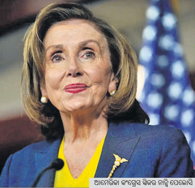
ଆମେରିକା କଂଗ୍ରେସ ସଭାରେ ନାହିଁ ପେଲୋସି

ଓଷ୍ଟିନ/ବେଙ୍ଗଲ, ୨୭ତା ୨୦୨୪ - ଆମେରିକା କଂଗ୍ରେସ ସଭାରେ ନାହିଁ ପେଲୋସି ରହିଛି। ଏହି ପ୍ରସ୍ତାବିତ ଗତ ନେଇ ସେ ଘୋଷଣା କରିବା ପରେ ଚାଇନା ପ୍ରତିକ୍ରିୟାଶୀଳ ହୋଇ ଓଷ୍ଟିନରେ ଖୋଲାଖୋଲି ଧମକ ଦେଇଛି।