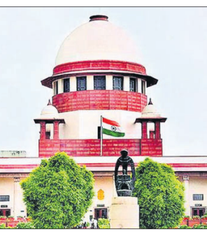
ଆଇନରେ ସଂଶୋଧନ କରିବାକୁ ସମ୍ମତ ଥିଲା।

ଅଭିଯୋଗ ପ୍ରମାଣର ଓଲଟା ଦାୟିତ୍ଵ ବଦଳାଇ ରଖି ନିୟମର ଉଦ୍ଦେଶ୍ୟଗୁଡ଼ିକ ସହ ଏହାର ଉଚିତ ସମ୍ପର୍କ ଥିବା ସ୍ପଷ୍ଟ କରିଛନ୍ତି।