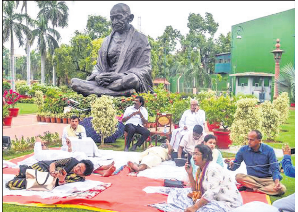
ଏମ୍ପିର ସଞ୍ଚୟ ସିଂଙ୍କ ସମେତ ରାଜ୍ୟ ସଭାରୁ ନିଲମ୍ବିତ ୨୦ ସଦସ୍ୟ ଏସବ ପରିସର ଗାନ୍ଧୀଗୃହି ଆଗରେ ଧାରଣା ଦେଇଛନ୍ତି।

ଦୁର୍ଦ୍ଦାମୀ, ୨୭/୭ ଅତ୍ୟାଧିକ ସାମଗ୍ରୀ ବରଦାମ୍ଭ କୃତ୍ତି ଏବଂ ଜିଏମ୍ ପ୍ରସଙ୍ଗରେ ଆଲୋଚନା ଦାଦି କରିଥିବା ପାର୍ଲିମେଣ୍ଟର ୨୪ ଏମ୍ପି ୩ ଦିନ ମଧ୍ୟରେ ନିଲମ୍ବିତ ହେଲେଣି। ଯୋଗଦାନ ଲୋକ ସଭାର ୪ ଓ ମଙ୍ଗଳବାର ରାଜ୍ୟ ସଭାର ୧୯ ସଦସ୍ୟଙ୍କୁ ବିଶୁଦ୍ଧିତ ଆବେଗ ପାଇଁ ନିଲମ୍ବନ କରାଯାଇଥିଲା।