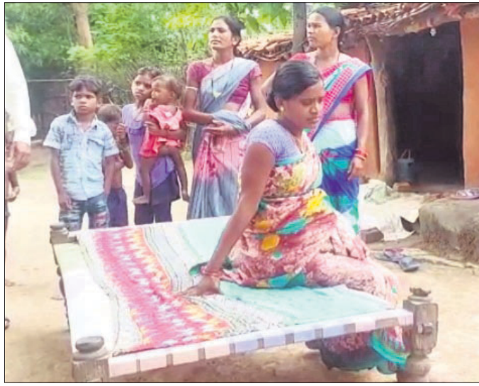
ଆଣି ଆୟୁରାଜୁରେ ଖଡ଼ିଆଳ ଉପଖଣ୍ଡ ନେଇ ଲାଞ୍ଜି ସରପଞ୍ଚ ବୈଦେହୀ ସ୍ୱାସ୍ଥ୍ୟକେନ୍ଦ୍ରକୁ ନିଆଯାଇଥିଲା। ଏ ମାଝିଙ୍କୁ ପଚାରିବାରୁ କେତେଜଣଙ୍କ

ବେହେରା, ୨୭/୭(ଡି.ଏନ.ଏ.): କଳାହାଣ୍ଡି ଜିଲ୍ଲା ବନ୍ଧପାଟ ଅଞ୍ଚଳର ବେହେରା ଗ୍ରାମରେ ବାର୍ଦ୍ଧକ୍ୟ ପ୍ରତିଷ୍ଠା ଅଞ୍ଚଳ ଗୁଡ଼ିକର ୧୦୮ରେ ଏସବିଆଇର ଶାଖା ଶୁଭାରମ୍ଭ ହୋଇଛି।