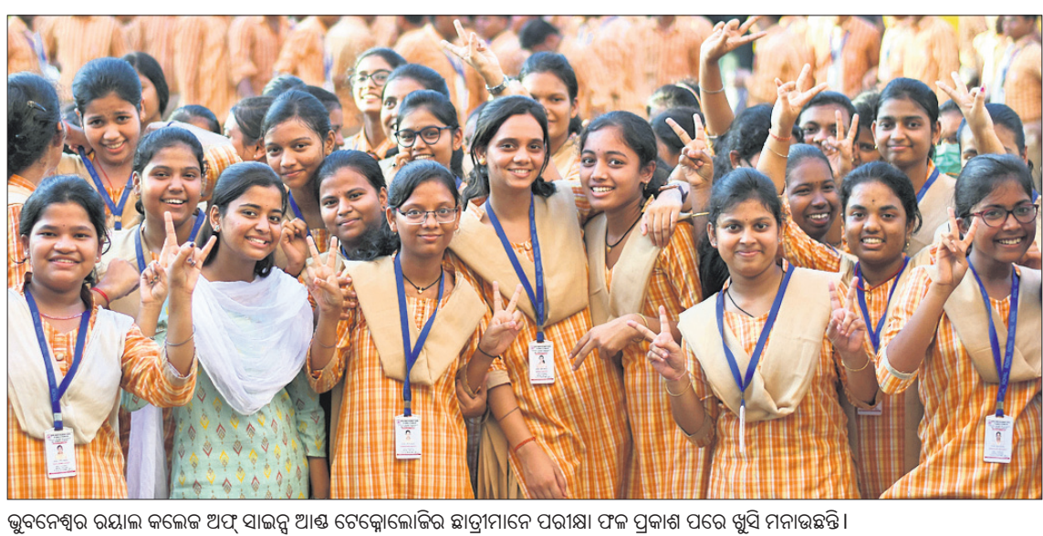
ଭୁବନେଶ୍ୱର ରୟାଲ କଲେଜ ଅଫ୍ ସାଇନ୍ସ ଆଣ୍ଡ ଟେକ୍ନୋଲୋଜିର ଛାତ୍ରୀମାନେ ପରୀକ୍ଷା ପ୍ରକାଶ ପରେ ଖୁସି ମନାଉଛନ୍ତି।

ଭୁବନେଶ୍ୱର, ୨୭।୭।(ବୁଧବେଳା) ଉଚ୍ଚ ମାଧ୍ୟମିକ ଶିକ୍ଷା ପରିଷଦ(ସିଏସ୍‌ଏସ୍‌ସି) ଦ୍ୱାରା ପରିଚାଳିତ ଯୁକ୍ତ ୨ ବିଜ୍ଞାନ ଓ ବାଣିଜ୍ୟ ପରୀକ୍ଷା ପ୍ରକାଶ ପାଇଛି। ପରିଷଦ କାର୍ଯ୍ୟାଳୟରେ ବିଦ୍ୟାଳୟ ଓ ଗଣଶିକ୍ଷା ମନ୍ତ୍ରୀ ସମୀକ୍ଷା ରଞ୍ଜନ ଦାଶ ପରୀକ୍ଷାପତ୍ର ଯୋଷଣା କରିଛନ୍ତି। ଚଳିତବର୍ଷ ବିଜ୍ଞାନରେ ପାସ ହାର ୯୪.୧୨ ପ୍ରତିଶତ ଓ ବାଣିଜ୍ୟରେ ୮୯.୨୦ ପ୍ରତିଶତ ରହିଛି। ପ୍ରତିବର୍ଷ ପରି ଏଥର ବି ପୁଅଙ୍କୁ ପଛରେ ପକାଇ ଝିଅମାନେ ଆଗରେ ରହିଛନ୍ତି। ବିଜ୍ଞାନରେ ନିୟମିତରେ ସର୍ବାଧିକ ୯୯.୧୧% ପାଇଁ ଉତ୍ତୀର୍ଣ୍ଣ ହୋଇଥିବାବେଳେ ବାଣିଜ୍ୟରେ ବୌଦ୍ଧ ଜିଲ୍ଲା ଶତପ୍ରତିଶତ ରେକର୍ଡ୍ କରିଛି। ଚଳିତବର୍ଷ ବିଜ୍ଞାନରେ ୭୮,୦୭୭ ପୁଷ୍ପା-୨