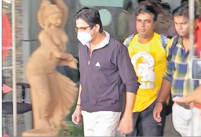
ଭୁବନେଶ୍ୱର ବିମାନ ବନ୍ଦରରୁ ବାହାରୁଛନ୍ତି ଅଭିନେତା ବାବୁସାନ ।