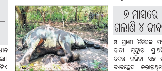
ମୃତ ହାତୀ ଛୁଆ ।