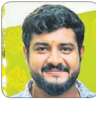
- ସମ୍ପାଦକ ପ୍ରଧାନ, ସିଦ୍ଧିଲ ଇଞ୍ଜିନିୟରିଂ ଟପ୍ପର, କଟକ

ପରୀକ୍ଷା ଭଲ ହୋଇଥିଲା । ଟପ୍ପର ହେବି ଆଶା କରି ନ ଥିଲି । ତେଣୁ ଅଧିକ ଖୁସି ଲାଗୁଛି । ବହୁ ବର୍ଷ ହେଲାଣି ପ୍ରସ୍ତୁତି କରୁଥିଲି । କିନ୍ତୁ ଭଲ ଖୋରକୁ ଅପେକ୍ଷା କରିଥିଲି । କରୋନା ସମୟରେ ପରୀକ୍ଷା ପାଇଁ ପ୍ରସ୍ତୁତି ଭଲରେ କରିପାରିଥିଲି । ସେଥିପାଇଁ ପରୀକ୍ଷା ଭଲ ହୋଇଥିଲା ।