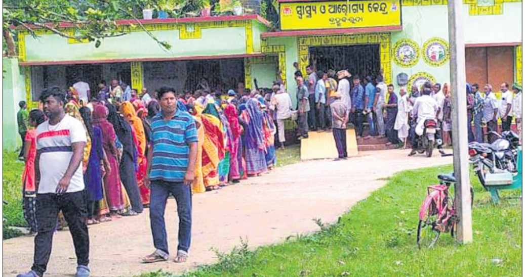
ବୁଝୁର ଡୋକ୍ଟର ବିକା ନେବାକୁ ଲୋକେ ଲାସ୍ ଧାଡ଼ି ବାନ୍ଧିଛନ୍ତି।

ଅପେକ୍ଷା କରି ରହିଛନ୍ତି। ସ୍କୁଲ ଓ କଲେଜ ପିଲାଙ୍କ ପାଇଁ ବୁଝୁରା ଷ୍ଟେଡିଂ ବିକାକରଣ କରାଯିବାର କାର୍ଯ୍ୟକ୍ରମ ରହିଛି। ଭିଡ଼ ନିୟନ୍ତ୍ରଣ ଓ ଶାନ୍ତି ଶୁଖିଲା ରକ୍ଷା ପାଇଁ ବ୍ରହ୍ମବରଦା ପୀଠି ପକ୍ଷରୁ ପୋଲିସ୍ ଫୋର୍ସ ମୁତୟନ କରାଯାଇଛି।