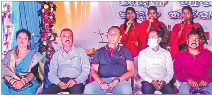
ବିଜୁଳି ଉତ୍ସବରେ ଯୋଗଦେଇଥିବା ଅତିଥି।