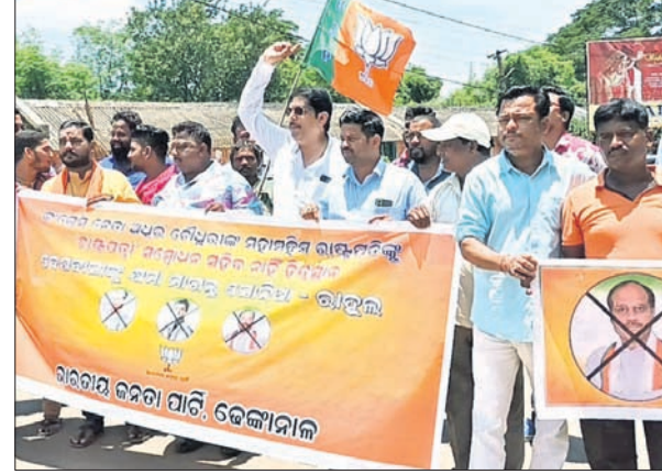
ଭାଜପା ମୁଦମୋର୍ତ୍ତୀ ପକ୍ଷରୁ ବିକ୍ଷୋଭ ପ୍ରଦର୍ଶନ କରାଯାଇଛି ।

ରାଷ୍ଟ୍ରପତିଙ୍କ ଉଦ୍ଦେଶ୍ୟରେ ବରିଷ୍ଠ କଂଗ୍ରେସ ନେତା ଅଧୀର ରଞ୍ଜନ ଚୌଧୁରୀ ବେଲପୁର ଅପମାନପୁତ୍ରକ ମତ୍ତବ୍ୟ ପ୍ରତିବାଦରେ ଡେକୋନାଲ ଜିଲ୍ଲା ଭାଜପା ମୁଦମୋର୍ତ୍ତୀ ପକ୍ଷରୁ ଗୁରୁବାର ବିକ୍ଷୋଭ ପ୍ରଦର୍ଶନ କରାଯାଇଛି । ଦଳୀୟ କାର୍ଯ୍ୟକର୍ତ୍ତାମାନେ ରାଷ୍ଟ୍ରକୁ ଗାନ୍ଧୀ, ସୋନିଆ ଗାନ୍ଧୀ, ଅଧୀର ରଞ୍ଜନଙ୍କ କୁଣ୍ଡପୁଜିକା ଦାହ କରିଥିଲେ । ରାଷ୍ଟ୍ରପତି ଡ୍ରୋପି