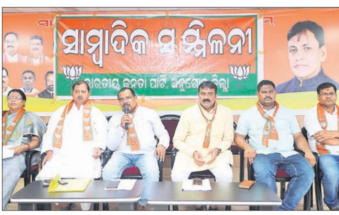
ଖବରଦାତା ସମ୍ମିଳନୀରେ ଭାଜପା କର୍ମକର୍ମୀମାନେ ।

ଅନୁଗୋଳ ଅଫିସ, ୨୮୭- ଅନୁଗୋଳ ଡେଇ ଯାଇଥିବା କଟକ-ସମଲପୁର ୫୫୫୯. ଜାତୀୟ ରାଜପଥର ଅବସ୍ଥା ଅତ୍ୟନ୍ତ ଶୋଚନୀୟ ହୋଇପଡିଛି । ସାମାନ୍ୟ ବର୍ଷା ହେଲେ ଏହି ରାଜପଥରେ ଗାଡ଼ି ଚଳାଚଳ ବ୍ୟାହତ ହେଉଛି । ବିଶେଷକରି ଅନୁଗୋଳ ଜିଲାର ଜୀବନରେଖା କୁହାଯାଉଥିବା ବର୍ଅଁରପାଳ ଠାରୁ ରଞ୍ଜନେଶ ପର୍ଯ୍ୟନ୍ତ ରାସ୍ତା ଅବ୍ୟାବଧି ମରାମତି କରାଗଲା ନାହିଁ । ଏଥିପାଇଁ ରାଜ୍ୟ ସରକାର ଓ ଜିଲ୍ଲା ପ୍ରଶାସନ ଦାୟୀ ବୋଲି ଅନୁଗୋଳ ଜିଲ୍ଲା ଭାଜପା ପକ୍ଷରୁ ଜିଲ୍ଲା କାର୍ଯ୍ୟାଳୟରେ ଗୁରୁତ୍ୱପୂର୍ଣ୍ଣ ଅନୁରୋଧ ଏକ ଖବରଦାତା ସମ୍ମିଳନୀରେ ଅଭିଯୋଗ କରାଯାଇଛି ।