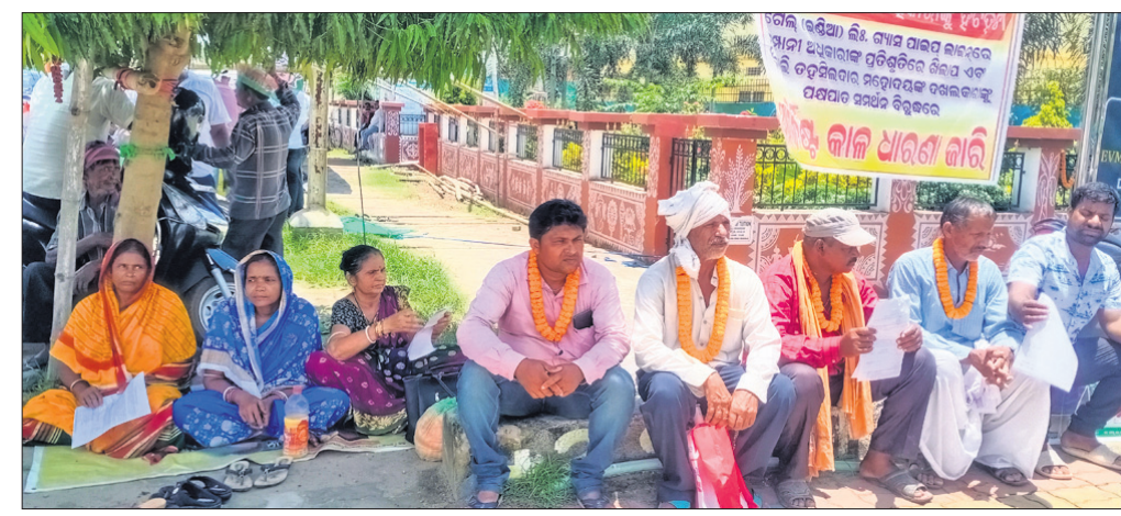
ଜିଲାପାଳଙ୍କ କାର୍ଯ୍ୟାଳୟ ଆଗରେ ଜମି ମାଲିକମାନେ ଧାରଣାରେ ବସିଛନ୍ତି।