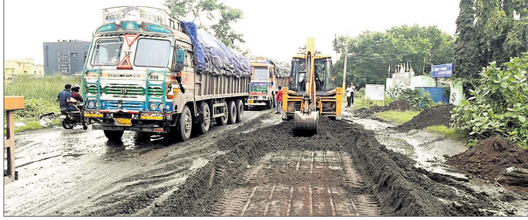
ଜିଲ୍ଲା ପ୍ରଶାସନ ପକ୍ଷରୁ କରାଯାଉଥିବା ମରାମତି କାର୍ଯ୍ୟ ।

ଅନୁଗୋଳ/୨୦୨୨-୨୩/୧୯୫୫ରେ ଚିଠି ଲେଖିଥିଲେ । ଏଥିରେ ଶ୍ରେଣୀ ଭାବେ ଲେଖାଯାଇଥିଲା ଯେ, ଜିଲ୍ଲା ପ୍ରଶାସନର ଡିଏମ୍.ଏ.ଏ. ପାଣ୍ଡୁ କରାଯାଉଥିବା ଜାତୀୟ ରାଜପଥର ଶ୍ରତି ପ୍ୟାଟ କାର୍ଯ୍ୟ ଚାଲିଛି । ଶ୍ରତି ପ୍ୟାଟର ନୂତନ ରାସ୍ତା କାର୍ଯ୍ୟ ଶେଷ ହୋଇଥିଲା । କିନ୍ତୁ ଡ୍ରେନ୍ ଓ କ୍ରମ ଡ୍ରେନେଜ ପ୍ରକ୍ରିୟା ପାଇଁ ବାରମ୍ବାର ବୁ ପ୍ରିଣ୍ଟ ମରାଯାଇଥିଲେ ମଧ୍ୟ ଏନ୍.ଏ.ଏ.ଆଇ ତାହାକୁ ପ୍ରଦାନ କଲା ନାହିଁ । ଫଳରେ ଗତି ପ୍ୟାଟ ବର୍ଷାରେ ଧୋଇଗଲା । ଦୁଇ ବୁ ପ୍ରିଣ୍ଟ ମାରିଥିଲେ ଡ୍ରେନ୍ ଥିବା ଗ୍ଲାନରୁ ଏନ୍.ଏ.ଏ.ଆଇ ଡ୍ରେନ୍ ଥିବା ଗ୍ଲାନରୁ ପ୍ରଦାନ କରାଯାଉ ନାହିଁ । ତେଣୁ ଏନ୍.ଏ.ଏ.ଆଇର ଅସହଯୋଗ ଯୋଗୁ ବାଧ୍ୟ ହୋଇ ଜିଲ୍ଲା ପ୍ରଶାସନ ମରାମତି କାର୍ଯ୍ୟକୁ ଓହରିଯିବ ବୋଲି ପ୍ରଶାସନ ପକ୍ଷରୁ କୁହାଯାଇଛି ।