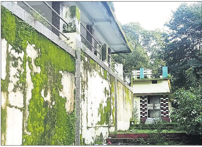
କପିଳାସ ପୀଠ ପରିସରରେ ଥିବା କଳା ପରିଷଦ ମଣ୍ଡପ ।

କାଳରେ ମାଡ଼ିଗଲାଣି ମୋଟା ବହଳର ଶିଉଳି । ଛାତ ଉପରେ ଉଠିଗଲାଣି ଗଛ । ଅନାବନା ଲଗାବୁଦ୍ଧିରେ ପରିପୂର୍ଣ୍ଣ ହୋଇ ଅରଣ୍ୟର ରୂପ ନେଲାଣି ପ୍ରବେଶ ପଥ । ପବିତ୍ର ଜାଗରାଯାତ୍ରାରେ ଯେଉଁ ମଣ୍ଡପ ଦାସପଦ ହୋଇଉଠୁଥିଲା, ତାହା ଏବେ ପାଇଁ ବ୍ୟାଧିର ସମାପ୍ତ ହୋଇ ଠିକଣା । ଶ୍ରାବଣ କାଉଡ଼ିପାତ୍ରା ବେଳେ ବର୍ଷା ହେଲେ ଯେଉଁଠି ଶ୍ରଦ୍ଧାଳୁମାନେ ମୁଣ୍ଡ ଗୁଣ୍ଡୁଥିଲେ, ସେଠାରେ ବର୍ଷେ ହେଲା ଝୁଲୁଛି ଚାଲା । ଦେବୋତ୍ତର ବିଭାଗର ଦାୟିତ୍ଵହୀନତା କାରଣରୁ ରାଜ୍ୟର ପ୍ରସିଦ୍ଧ ଶୈବକ୍ଷେତ୍ର କପିଳାସ ପୀଠରେ ୧୫ଲକ୍ଷ ଟଙ୍କା ବ୍ୟୟରେ ନିର୍ମିତ କଳା ପରିଷଦ ମଣ୍ଡପ ଏବେ ପରିଷଦ ଅବସ୍ଥାରେ । କେବଳ ଏତିକି ନୁହେଁ, ଠିକ ଜଙ୍ଗଲ ପରିଚାଳନା ହେଉ ନ ଥିବାରୁ ଧର୍ମଶାଳା, ପାଠାଗାର ମଧ୍ୟ ଜରାଜୀର୍ଣ୍ଣ ଅବସ୍ଥାକୁ ଚାଲି ଆସିଲାଣି, ଯାହାକୁ ନେଇ ଶ୍ରଦ୍ଧାଳୁଙ୍କ ମଧ୍ୟରେ ଦେଖାଦେଇଛି ତୀବ୍ର ଅସନ୍ତୋଷ । ଐତିହାସିକ ଏବଂ ପୌରାଣିକ ଦୃଷ୍ଟିକୋଣରୁ କପିଳାସ କ୍ଷେତ୍ରାଧିପତି ଶ୍ରୀମନ୍ତ୍ରଣେଶ୍ଵରଙ୍କ ପୀଠର ଗୁରୁତ୍ଵ ଅନେକ । ବ୍ରାହ୍ମଣ ଶତାବ୍ଦୀର ଏହି ପ୍ରାଚୀନ ଐତିହ୍ୟର ସଂରକ୍ଷଣ ଲାଗି