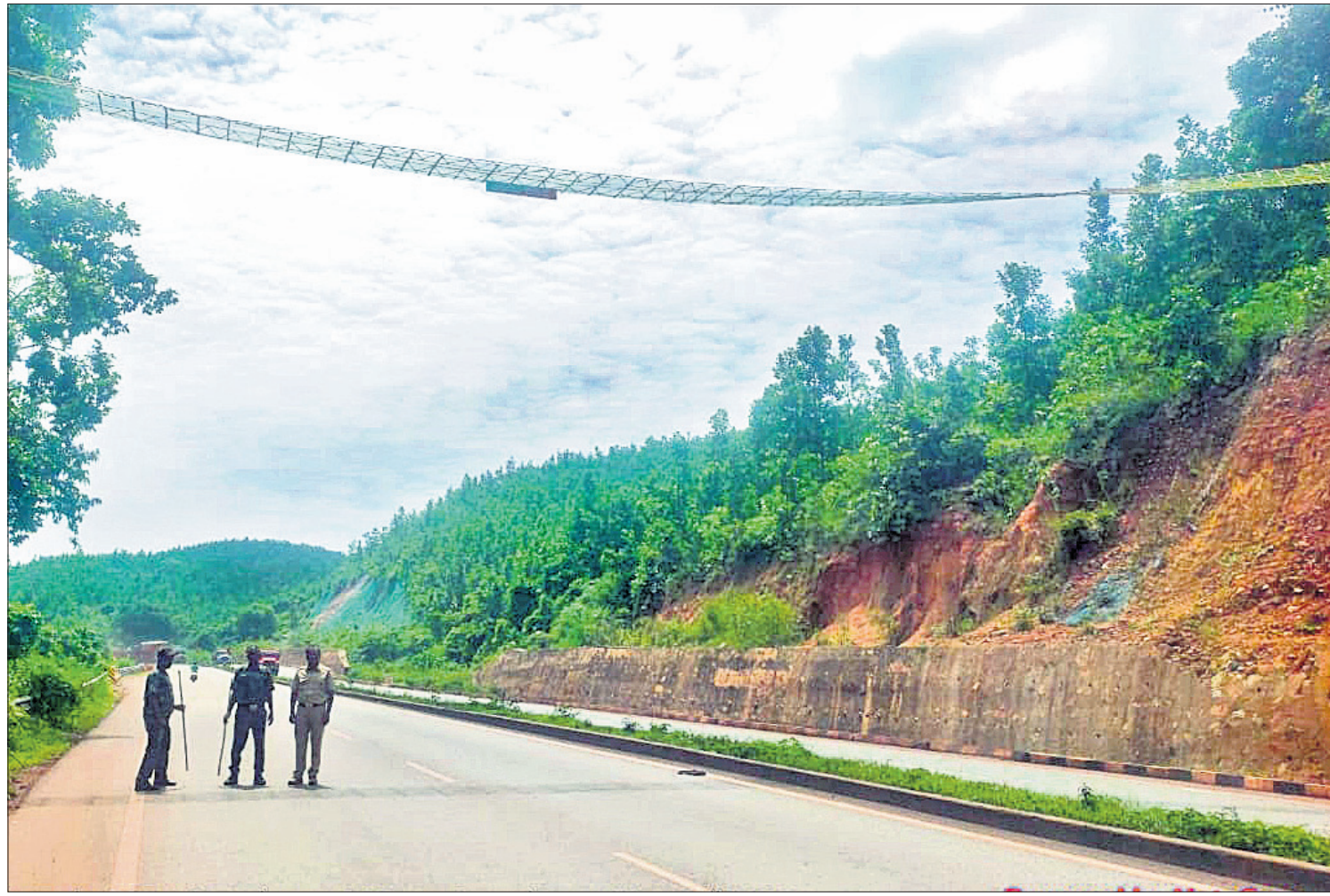
କେନ୍ଦୁଝର ଜିଲାର ଏନ୍-୯-୪୯ରେ ଦୁର୍ଘଟଣାଜନିତ ମୃତ୍ୟୁକୁ ମାଙ୍କଡ଼ଙ୍କ ସୁରକ୍ଷା ପାଇଁ କୁଟିଆ ଘାଟି ନିକଟରେ ବନ ବିଭାଗ ପକ୍ଷରୁ ହୋଇଥିବା ଝୁଲନ୍ତା ଚଳାପଥ।