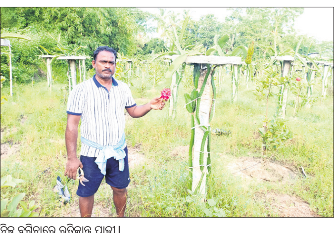
ନିଜ ବଗିଚାରେ ରଚିକାର ପାଠ୍ୟ।

ଫଳିବା ଆରମ୍ଭ କରିଥିଲା। ଏହି ଫଳର ଔଷଧୀୟ ଗୁଣ ଯୋଗୁଁ ବଜାରରେ ହାସିଦା ମଧ୍ୟ ଅଧିକ। ଉତ୍ତମ କଳାସ, କର୍କଟ ଓ ମଧୁମେହ ରୋଗୀ ଏହି ଫଳକୁ ଖାଇଲେ ରୋଗ ପ୍ରତିରୋଧକ ଶକ୍ତି ବଢ଼ିବା ସହ ରୋଗ ମଧ୍ୟ ନିୟନ୍ତ୍ରଣ ହୋଇଥାଏ। ବଜାରରେ କିଲୋ ପ୍ରତି ଏହି ଫଳ ୧୮୦ରୁ ୨୦୦ ଟଙ୍କାରେ ବିକ୍ରି ହେଉଥିବା ବେଳେ ପ୍ରଥମ ବର୍ଷ ୨ କୁଇଣ୍ଟାଲରୁ ଅଧିକ ଫଳ ବିକ୍ରି ହୋଇଛି। ଜଳିତବର୍ଷ ଏଥିରୁ ଅଧିକ ୪ ଗୁଣା ଫଳ ଉତ୍ପାଦନ ହେବ ବୋଲି ସେ ଆଶା ରଖିଛନ୍ତି। ଏହି ଗଛ ଥରେ ଲଗାଇଲେ ୩୦ ବର୍ଷ ଯାଏ ବଞ୍ଚି ରହିବ ବୋଲି ସେ କହିଛନ୍ତି। ଏହି ଗଛ ପାଇଁ ସେ ୫ ଲକ୍ଷ ଟଙ୍କା ଖର୍ଚ୍ଚ କରିଛନ୍ତି। ନୂଆ ପ୍ରକାର ଗଛ ଯୋଗୁଁ ବିଫଳ ହେବା ଆଶଙ୍କା କରି କିଛି ଆଶିଥିଲେ। ସେହିବର୍ଷ ଜୁନ୍‌ରେ ନିଜ ବାଡ଼ିରେ ସେ ଏହି ଗଛ ଲଗାଇଥିଲେ। ଏହାର ୧୦ ମାସ ପରେ ଗଛରେ ଫଳ