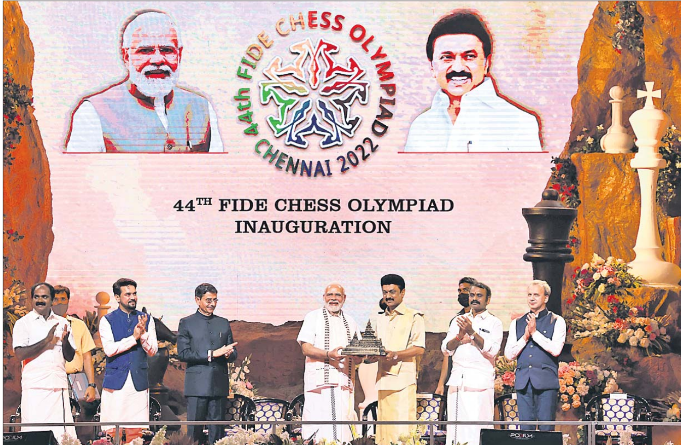
44 TH FIDE CHESS OLYMPIAD INAUGURATION

କଟକ ଅଫିସ୍, ୨୮୧୬: ଆସନ୍ତା ଅକ୍ଟୋବର ୧୨ ତାରିଖରେ ଓଡ଼ିଶା ସିଲିକନ୍ ସିଟି (ଓସିଏସ୍) ପ୍ରତିମା ନିର୍ମାଣ ପ୍ରକଳ୍ପର ୨୦୨୧ ଅନୁଷ୍ଠିତ ହେବ। ଏବେଲେ ଓଡ଼ିଶା ଲୋକସେବା ଆୟୋଗ (ଓସିଏସ୍) ପକ୍ଷରୁ ଗୁରୁତ୍ୱପୂର୍ଣ୍ଣ ବିକାଶ ପ୍ରକଳ୍ପ ପାଇଛି। ଏହି ପ୍ରକଳ୍ପର ଉଦ୍ଦେଶ୍ୟ ହେଉଛି ପ୍ରାୟ ୨୦୦୦ ପ୍ରାଥମିକ ଆବେଦନ କରିଥିଲେ। ସେମାନଙ୍କ ମଧ୍ୟରୁ ୨ ହଜାର ୩୯୯ ଜଣ ଆଶାୟାଙ୍କ ଆବେଦନକୁ ବିଭିନ୍ନ ତ୍ରୁଟି ଥିବା ଦର୍ଶନା ନାକର କରିଦିଆଯାଇଥିଲା। ବ୍ୟକ୍ତିଗତ ବିବରଣୀ ନ ଦେବା, ଠିକଣା ବିବରଣୀ ନ ଦେବା, ଫିକିକାଲ ମେଜନମେଣ୍ଟ ଓ ଶିକ୍ଷାଗତ ଯୋଗ୍ୟତା ବିବରଣୀ ନ ଥିବା, ଅନ୍ୟ ପ୍ରମାଣପତ୍ର ଫଟୋକପି ଅନୁଲୀନନରେ ଅସ୍ପଷ୍ଟ ହୋଇ ନ ଥିବା ଆଦି ବିଭିନ୍ନ କାରଣରୁ ଅନେକ ଆଶାୟାଙ୍କ ଦରଖାସ୍ତ ନାକର ହୋଇଥିଲା। ସୂଚନା ଥାଉଛି, ଓସିଏସ୍ ପାଇଁ ପ୍ରତିମା, ମେନ୍, ଏ ଓ ଇଣ୍ଟରଭ୍ୟୁ ଭଳି ଗତି ସ୍ତରରେ ପରୀକ୍ଷା କରାଯାଇଥାଏ।