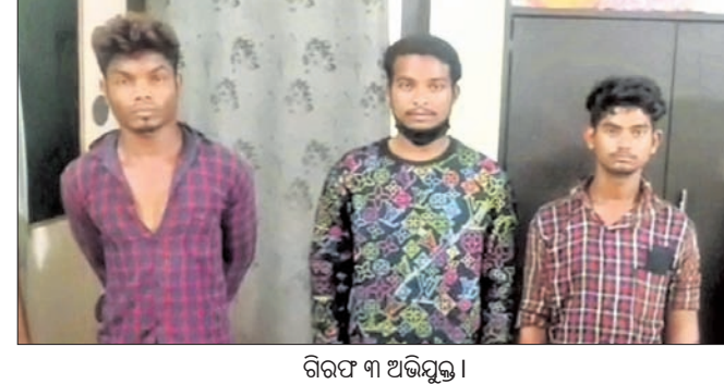
ଗିରଫ ୩ ଅଭିଯୁକ୍ତ।

୨୨୨୨ର ଖସିଯାଇଥିବା ଜଣାପଡ଼ିଛି। ପୂର୍ତ୍ତୀ ଅନୁସାରେ, ବଡ଼ବିଲ ଥାନା ରାଜକାଠାରେ ବନ୍ଦ ପଡ଼ିଥିବା ଶୀତଳ ମିନେରାଲ ନାମକ ଏକ କ୍ରସରରେ ୫ ଜଣ ବୁର୍ତ୍ତୁ ବଳାଠି ହୋଇ ଡକାୟତି ଯୋଜନା କରୁଥିବା ଗ୍ରାମର ପାଇଁ ପୋଲିସ୍ ଚଢ଼ାଇ କରିଥିଲା ପୋଲିସ୍। ୩ ଅଭିଯୁକ୍ତଙ୍କୁ ଗୁରୁବାର ବୁର୍ତ୍ତୁକ ମାନଙ୍କ ନିକଟରୁ ଏକ ଦେଶୀ ବନ୍ଧୁକ, ୨ଟି ଖଣ୍ଡା, ଏକ ଚୋରା ବାଲକ, ଏକ ସୁଟି, ୨ଟି ମୋବାଇଲ ଜବତ କରିଛି। ତେବେ ପୋଲିସ୍ ଚଢ଼ାଇ ବେଳେ ଅନ୍ଧାରର ସୁଯୋଗ ନେଇ