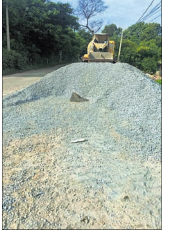
କେନ୍ଦୁଝର ସହର ରାସ୍ତା କଡ଼ରେ ଚିପ୍ପ ଜମା ହୋଇଛି।

ପ୍ରତିବାଦ କଲେ ମଧ୍ୟ ପୌରପାଳିକା ପକ୍ଷରୁ ପାଇନ କିମ୍ବା ଆଇନଗତ କାର୍ଯ୍ୟାନୁଷ୍ଠାନ ନିଆଯାଉନାହିଁ। ଏ ନେଇ ସ୍ଥାନୀୟ ଲୋକ କେନ୍ଦୁଝରଗତ ଗବା ହୋଇ ରାସ୍ତା ଅବରୋଧ କରୁଥିବାରୁ ଦୁର୍ଘଟଣା ବହୁଛି। ବ୍ୟବସାୟିକ ଘର ଏବଂ ଘର ଉଦ୍ଦେଶ୍ୟରେ ବ୍ୟବହାର ହେଉଥିବା ବାଲି, ଚିପ୍ପ ରାସ୍ତା ଉପରେ ପକାଇବା କାରଣ ହେଉଥିବାରୁ ଯାତାୟାତରେ ବାଧା ସୃଷ୍ଟି ହେଉଛି। ପୌରପାଳିକା ପକ୍ଷରୁ ରାସ୍ତା ଉପରେ ବାଲି, ଚିପ୍ପ ଓ ଅନ୍ୟାନ୍ୟ ସାମଗ୍ରୀ ରାସ୍ତା ଉପରେ ପକାଇବା ଉପରେ ବାରଣ କରାଯାଇ ମାଲକ ଯୋଗେ ଜନସାଧାରଣଙ୍କୁ ସଚେତନ କରାଯାଉଛି। ଏହା ସତ୍ତ୍ୱେ ପୌରପାଳିକା ଆଦେଶକୁ କେହି ମାନ୍ୟ ନାହାନ୍ତି। କେନ୍ଦୁଝର ସହରର ଜନକାର୍ଣ୍ଣ ରାସ୍ତା କଲେଜ ରୋଡ଼ ରାସ୍ତା, ବିଜୁ ପଟ୍ଟନାୟକ ସ୍ଟାଡ଼ିଓ ଠାରୁ ଚେଲିଫୋନ ଏକ୍ସପ୍ରେସ୍ ସ୍ଟାଡ଼ିଓ, ମାଲିନି ରୋଡ଼, ବୁଲାହୁଆର ସାହି ମୁଖ୍ୟ ରାସ୍ତା ସମେତ ସାହି ରାସ୍ତାରେ ମଧ୍ୟ ବାଲି ଓ ଚିପ୍ପ ପଡ଼ି ରହୁଛି। ସ୍ଥାନୀୟ ଲୋକ ଏହାର