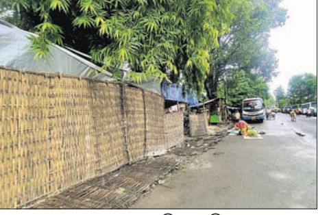
ଅବଗତ କରାଯାଇଛି । ଯଦି ରାସ୍ତାକୁ ନ ଉଠିବେ ତେବେ ଦୋକାନ ଘରକୁ ଉଚ୍ଛେଦ କରାଯିବ ବୋଲି ଚେତାବନା ଦିଆଯାଇଛି ।

ଅନୁଗୋଳ ସଦର ରାଜା ଛକ ଠାରୁ ଥାନା ଛକ ରାସ୍ତା ପାଖରେ ଜବରଦଖଲ ବଢ଼ିଥିବାରୁ ସେଠାରେ ଗ୍ରାମିକ ଜାମ ଦେଖାଦେଉଛି । ଏ ନେଇ 'ଧରଣି'ରେ ଗତ ୨୪ ଓ ୨୬ ତାରିଖରେ ଖବର ପ୍ରକାଶ ପରେ ପୌର ପ୍ରଶାସନର ଚେତା ପଶିଥିଲା । ଏ ନେଇ ଗୁରୁତ୍ୱପୂର୍ଣ୍ଣ ଅପରାହ୍ନରେ ଜବରଦଖଲକାରୀଙ୍କୁ ଗ୍ଲାନ ଖାଲି କରିବାକୁ ପୌରପାଳିକା ପକ୍ଷରୁ ଅନୁରୋଧ କରାଯାଇଛି । ଯଦି ରାସ୍ତାକୁ ନ ଉଠିବେ ତେବେ ଦୋକାନ ଘରକୁ ଉଚ୍ଛେଦ କରାଯିବ ବୋଲି ଚେତାବନା ଦିଆଯାଇଛି ।