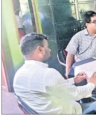
ବୈଠକରେ ବୁକ ଅଧ୍ୟକ୍ଷଙ୍କ ସମେତ ଅଧ୍ୟାପକମାନେ ।

ଅନୁପସ୍ଥିତିକୁ ନେଇ ଅନେକ ଅଧ୍ୟାପକ ହାଜିରା ପକାଇ କ୍ଲାସ୍ କରୁ ନ ଥିବା ନେଇ ଅସନ୍ତୋଷ ପ୍ରକାଶ କରିଥିଲେ । କଲେଜ ତରଫରୁ ବିଭିନ୍ନ ସମସ୍ୟାକୁ ନେଇ ଅଧ୍ୟାପକ କର୍ମଚାରୀମାନେ ଏକ ଦାବିପତ୍ର ପ୍ରଦାନ କରିଥିଲେ । ଏ ନେଇ ବୁକ ଅଧ୍ୟକ୍ଷ କହିଛନ୍ତି, ଠିକ ପାଠପଢ଼ା କାର୍ଯ୍ୟ ସହିତ ଅଧ୍ୟାପକ, କର୍ମଚାରୀମାନେ କର୍ତ୍ତବ୍ୟ ନିର୍ବାହ କରିବାକୁ ପରାମର୍ଶ ଦେଇଛି । ସମସ୍ୟା ସମାଧାନକୁ ନେଇ ଜିଲ୍ଲାପାଳ ଓ ଲୋକପ୍ରତିନିଧିଙ୍କ ସହିତ ଆଲୋଚନା କରିବି ।