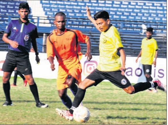
ଚାଉଳିଆଗଞ୍ଜ କ୍ଳବ୍ ଓ ଖାଇଭିକି ମଧ୍ୟରେ ଅନୁଷ୍ଠିତ ମ୍ୟାଚ୍।