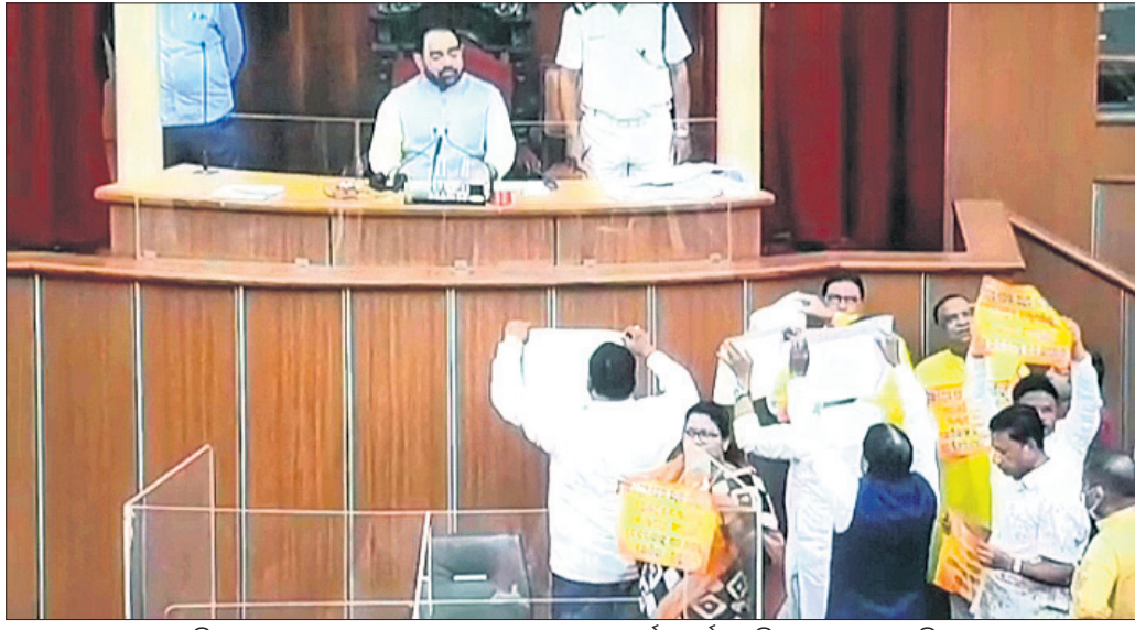
ବିଧାନସଭାରେ ଗୁରୁବାର ଭାଜପା ସଦସ୍ୟମାନେ ପ୍ଲାକାର୍ଡ ପ୍ରଦର୍ଶନ କରି ହଜଗୋଳ କରୁଛନ୍ତି।

କଂଗ୍ରେସ ଏମ୍ପି ଅଧୀର ରଞ୍ଜନ ଚୌଧୁରୀଙ୍କ ବିବାହାୟ ବୟାନ 'ରାଷ୍ଟ୍ରପତ୍ନୀ'କୁ ନେଇ ବିଧାନସଭାରେ ହଜାମା ହୋଇଛି। ଭାଜପା ସଦସ୍ୟମାନେ କଂଗ୍ରେସ ନେତାଙ୍କ ବୟାନକୁ ବିରୋଧ କରି ବିଧାନସଭାରେ ପ୍ରବଳ ପାଟିଭାଣ୍ଟ କରିଥିଲେ। ଏଥିଯୋଗୁ ପ୍ରଶ୍ନୋତ୍ତର, ଶୂନ୍ୟକାଳ, ପୂଲଟତବା ଆଦି ସମ୍ପୂର୍ଣ୍ଣ ଅଟକ ହୋଇ ଯାଇଥିଲା।