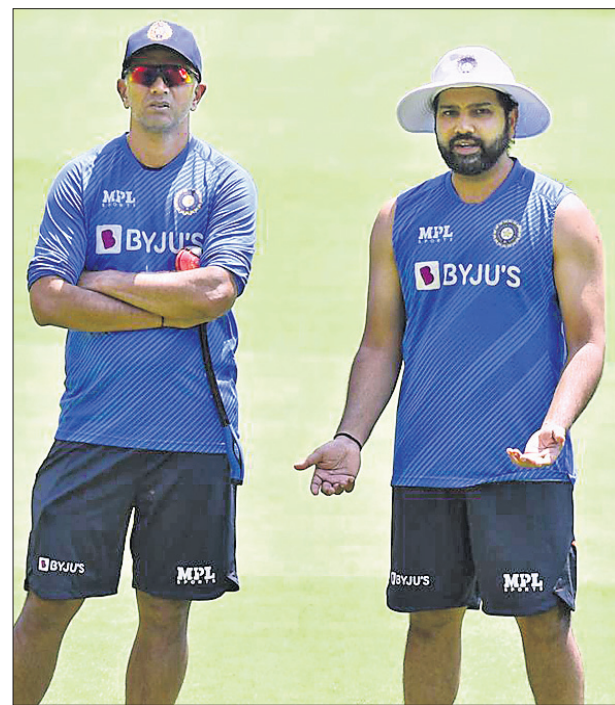
କୋର୍ ରାହୁଲ ଡ୍ରାଭିଡ୍ ଓ ରୋହିତ ଶର୍ମା।