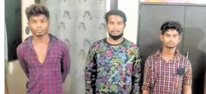
ଗିରଫ ୩ ଅଭିଯୁକ୍ତ।

୨୮ ବୁଡ଼ିବା ଖସିଯାଇଥିବା ଜଣାପଡ଼ିଛି। ପୂର୍ବରୁ ଅନୁପାୟା, ବଡ଼ବିଲ ଥାନା ରାଜକାଠାରେ ବନ୍ଦ ପଡ଼ିଥିବା ଶୀତଳ ମିନେରାଲ ନାମକ ଏକ କ୍ରସରରେ ୫ ଜଣ ବୁଡ଼ିବା ଏକାଠି ହୋଇ ଡକାୟତି ଯୋଜନା କରୁଥିବା ପୂର୍ବରୁ ପାଇ ପୋଲିସ୍ ଚଢ଼ାଉ କରିଥିଲା ପୋଲିସ୍। ୩ ଅଭିଯୁକ୍ତଙ୍କୁ ଗୁରୁବାର ବୁଡ଼ିବା ମାନଙ୍କ ନିକଟରୁ ଏକ ଦେଶୀ ବନ୍ଧୁକ, ୨ଟି ଖଣ୍ଡା, ଏକ ଚୋରା ବାଲକ, ଏକ ସୁଟି, ୨ଟି ମୋବାଇଲ ଜବତ କରିଛି। ତେବେ ପୋଲିସ୍ ଚଢ଼ାଉ ବେଳେ ଅଧିକାରୀ ସୁଯୋଗ ନେଇ ବୁଣାଖ ଦାଣ ସୂଚନା ଦେଇଛନ୍ତି।