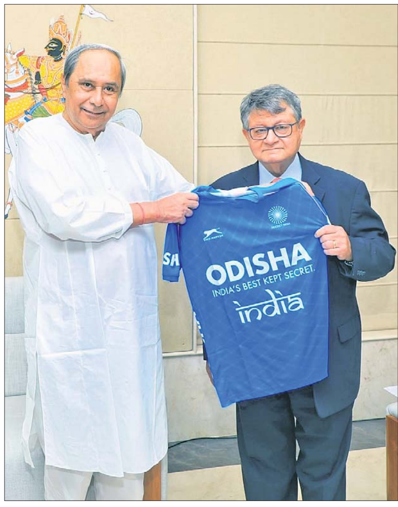
ମୁଖ୍ୟମନ୍ତ୍ରୀ ନବୀନ ପଟ୍ଟନାୟକ ନୀତି ଆୟୋଗ ଉପାଧ୍ୟକ୍ଷ ସୁମନ କେ. ବେରାଙ୍କୁ ଏକ ଜର୍ସି ପ୍ରଦାନ କରୁଛନ୍ତି।