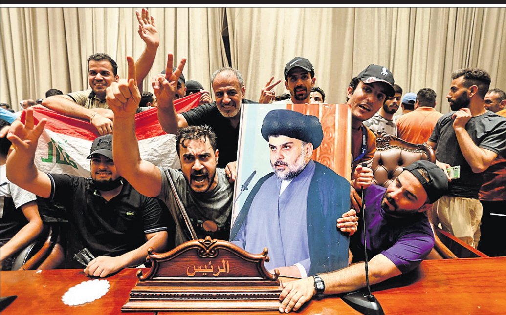
ଇରାକ ପାର୍ଲିମେଣ୍ଟ ଭବନରେ ଶିଆ ବିଦ୍ଵାନ ମୁକ୍ତାଦାଆ ଅଲ୍-ସଦରଙ୍କ ସମର୍ଥକମାନେ ବିରୋଧ କରୁଛନ୍ତି।

ସଦରଙ୍କ ମେଣ୍ଟକୁ ବିପୁଳ ସମର୍ଥନ ମିଳିଥିଲେ ହେଁ ଏହା ବହୁତ ପାଇବାକୁ ବଞ୍ଚିତ ହୋଇଥିଲା। ଏହି କାରଣରୁ ଦେଶରେ ପ୍ରାୟ ୧୦ ମାସ ପରେ ବି ନୂଆ ସରକାର ଗଠନକୁ ନେଇ ଅନିଶ୍ଚିତତା ଲାଗି ରହିଛି। ନିର୍ବାଚନ ପରେ ମଧ୍ୟ ନିଜ ରାଜନୈତିକ ପଡ଼ିଆରା ପ୍ରବର୍ତ୍ତନ ଉଦ୍ଦେଶ୍ୟରେ ଶିଆ ବିଦ୍ଵାନ ଅଲ୍-ସଦର ବହୁ ସଂଖ୍ୟକ ଲୋକଙ୍କୁ ଚଳାଇ ପ୍ରାରମ୍ଭରେ ଅଲ୍-ସଦରଙ୍କ ତାକତାରେ ତାଙ୍କ ହଜାର ହଜାର ସମର୍ଥକ ରଖିପ୍ରାର୍ଥନା ପାଇଁ ଏକକୃତ ହୋଇଥିଲେ।