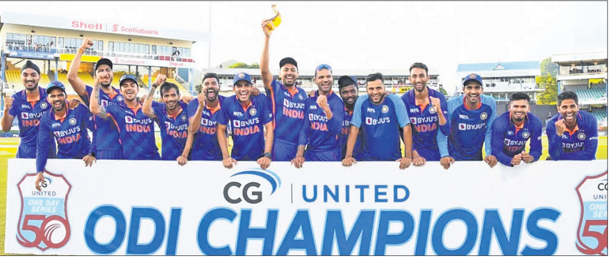
ଖେଳୁକିକ୍ ବିପକ୍ଷ ଅନ୍ତର୍ଜାତୀୟ ଦିନକିଆ କ୍ରିକେଟ୍ ସିରିଜ ବିଜୟୀ ଭାରତୀୟ ଦଳର ଖେଳାଳିମାନେ ଚ୍ରୁପି ସହ ସୁସ୍ଥି ପୁହୁର୍ବରେ।

ଅବସର ନେବେ ଭେଟେଲି ବୁଦାପେଷ୍ଟ, ୨୮୭ (ଏପି): ଚାରିଆଡ଼ ଫର୍ମୁଲାସ୍ତାନ ଚାମିୟନ ସେବାସ୍ଥିଆନ ଭେଟେଲି ସିକନ ଶେଷରେ ତାଙ୍କର ଅବସର ନେବେ। ସେ ତାଙ୍କ ପରିବାର ସହ ଅଧିକ ସମୟ ଦେବେ। କର୍ନାଟାର ଏହି ଭ୍ରାଜଭର ଗୁରୁବାର ଏହା ପ୍ରକାଶ କରିଛନ୍ତି। ଭେଟେଲି ୨୦୧୦-୧୩ରୁ ରେଡ୍‌ବଲ୍ ସହ ଚାଲିଛନ୍ତି ଜିତିଥିଲେ। ତାଙ୍କର ଶେଷ ବିଷୟ ୨୦୧୧ରେ ଫେରାରି ସହ ହୋଇଥିଲା। ଚଳିତ ସିକନରେ ସେ ଆଷ୍ଟନ ମାର୍ଟିନ ଚରଫ୍‌ରୁ ପ୍ରତିନିଧିତ୍ୱ କରି ଅବଫଳ ରହିଛନ୍ତି।