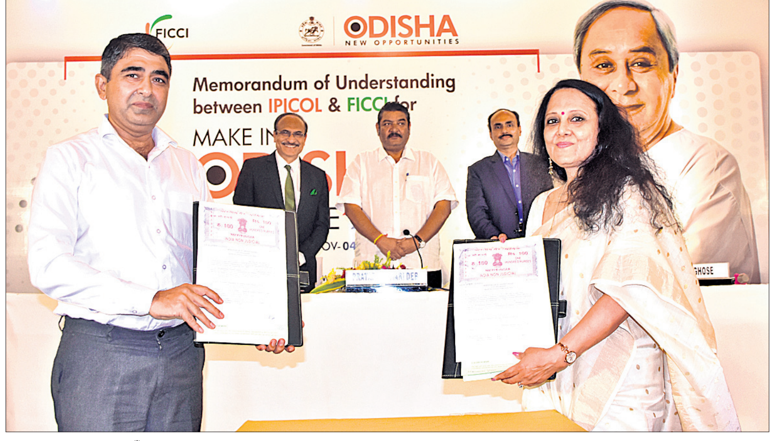
ମେକ୍ ଇନ୍ ଓଡ଼ିଶା କନ୍ଫେରନ୍ସ ପାଇଁ ଇପିକଲ୍ ଏବଂ ଫିକି ମଧ୍ୟରେ ଗୁରୁବାର ରୁଖାମଣାପତ୍ର ସ୍ୱାକ୍ଷରଣ ହୋଇଛି ।