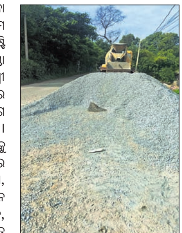
କେନ୍ଦୁଝର ସହର ରାସ୍ତା କଡ଼ରେ ଚିମ୍ପୁ ଜମା ହୋଇଛି।

କେନ୍ଦୁଝର ସହରର ବିଭିନ୍ନ ମୁଖ୍ୟ ରାସ୍ତା ସମେତ ସାହି ରାସ୍ତାରେ ବାଲି ଓ ଚିମ୍ପୁ ଗୋରୁ ଯାନ ଯାନୁକ୍ରମେ ଦୂର୍ଘଟଣା ବହୁଛି। ବ୍ୟବସାୟିକ ଘର ଏବଂ ଘର ଉଦ୍ଦେଶ୍ୟରେ ବ୍ୟବହାର ହେଉଥିବା ବାଲି, ଚିମ୍ପୁ ରାସ୍ତା ଉପରେ ପକାଇ କାମ ହେଉଥିବାକୁ ଯାଚାଯାଚରେ ବାଧା ସୃଷ୍ଟି ହେଉଛି। ପୌରପାଳିକା ପକ୍ଷରୁ ରାସ୍ତା ଉପରେ ବାଲି, ଚିମ୍ପୁ ଓ ଅନ୍ୟାନ୍ୟ ସାମଗ୍ରୀ ରାସ୍ତା ଉପରେ ପକାଇବା ଉପରେ ବାରଣ କରାଯାଇ ମାଲକ ଯୋଗେ ଜନସାଧାରଣଙ୍କୁ ସଚେତନ କରାଯାଉଛି। ଏହା ସତ୍ତ୍ୱେ ପୌରପାଳିକା ଆବେଶକୁ କେହି ମାନ୍ୟ ନାହାନ୍ତି। କେନ୍ଦୁଝର ସହରର ଜନକାର୍ଯ୍ୟ ରାସ୍ତା କଲେଜ ରୋଡ଼ ରାସ୍ତା, ବିଜୁ ପଟ୍ଟନାୟକ ଛକ ଠାରୁ ଚେଲି ରାସ୍ତା ଏକ୍ସପୋଜି ଛକ, ମାଲିନି ରୋଡ଼, ବୁଲାଦୁଆର ସାହି ମୁଖ୍ୟ ରାସ୍ତା ସମେତ ସାହି ରାସ୍ତାରେ ମଧ୍ୟ ବାଲି ଓ ଚିମ୍ପୁ ପଡ଼ି ରହିଛି। ସ୍ଥାନୀୟ ଲୋକ ଏହାର