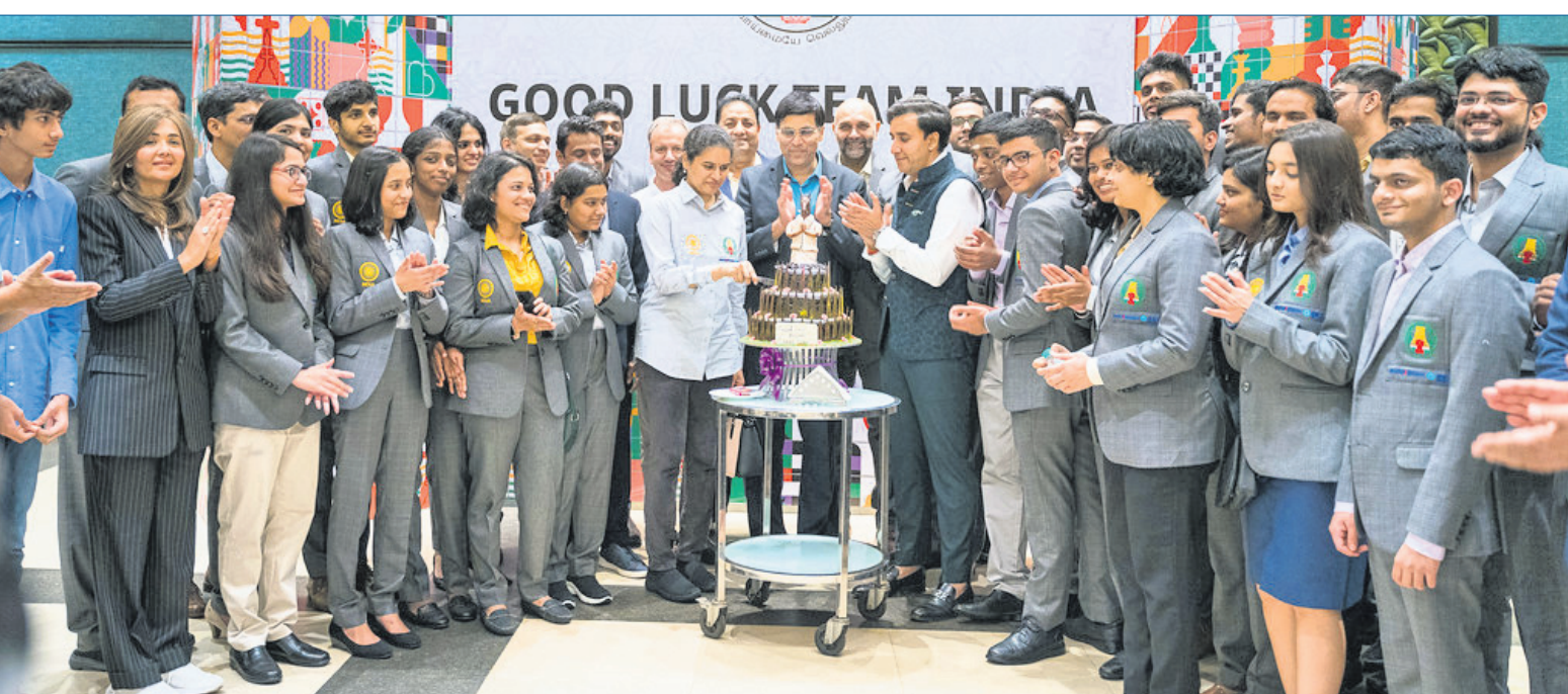
ଚେନାଇରେ ୪୪ତମ ଚେସ୍ ଅଲିମ୍ପିଆଡର ଉଦ୍‌ଘାଟନା ଦିବସ ଅବସରରେ ଭାରତୀୟ ଦଳର ସଦସ୍ୟମାନଙ୍କ ଉପସ୍ଥିତିରେ କେନ୍ଦ୍ର କର୍ମାୟାତ୍ରୀ।