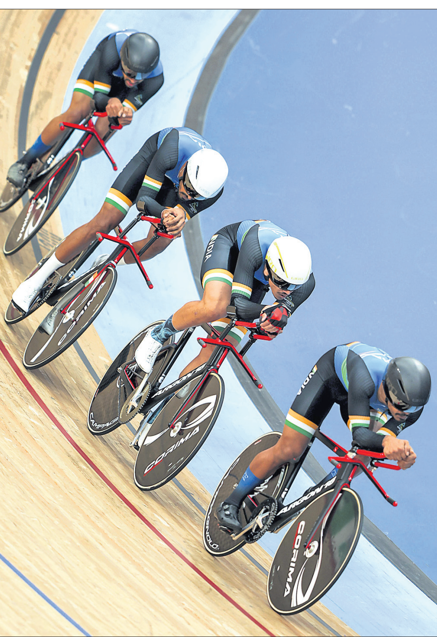
ବର୍ମିହାମ୍‌ରେ ଚାଲିଥିବା ରାଜ୍ୟଗୋଷ୍ଠୀ କ୍ରୀଡ଼ାର ଶୁକ୍ରବାର ଅନୁଷ୍ଠିତ ଗ୍ରାଜ୍‌ସାଇକ୍ଲିଂ ୪୦୦୦ ମିଟର ରିମ୍ ପୁସ୍ପିକ୍ କାଲାନାମକ ଅବସରରେ ଭାରତୀୟ ଦଳ।