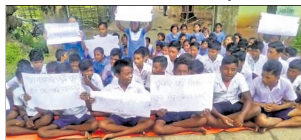
ଛାତ୍ରାଛାତ୍ରୀମାନେ ଧାରଣା ଦେଇଛନ୍ତି।

ସୂଚନା ଉପାୟ, ୧୯୫୨ରେ ପ୍ରତିଷ୍ଠିତ ହୋଇ ବିଦ୍ୟାଳୟରେ ନରଣେ କେହେରା ପଞ୍ଚମ ପ୍ରଥମକୁ ଅଷ୍ଟ ଶ୍ରେଣୀ ପର୍ଯ୍ୟନ୍ତ ପଢ଼ାଉଛନ୍ତି।