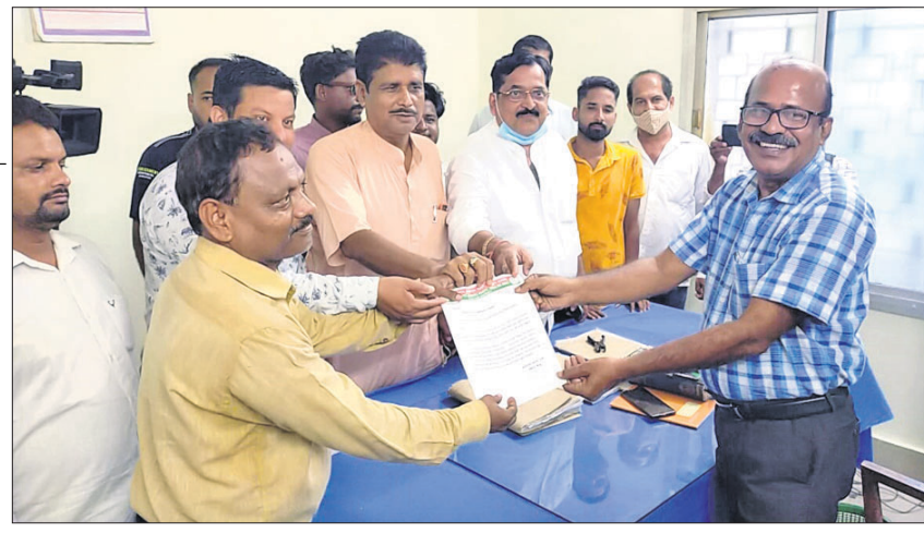
ଭାଜପା ସାମ୍ବାଦ ସେଲ ପକ୍ଷରୁ ଦାବିପତ୍ର ପ୍ରଦାନ କରାଯାଇଛି।