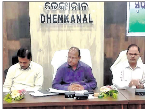
ସ୍ଵାଧୀନତା ଦିବସ ପାଳନ ପ୍ରସ୍ତୁତି ବୈଠକ।

ଢେଙ୍କାନାଳ ଜିଲ୍ଲା କାର୍ଯ୍ୟାଳୟରେ ସଂଭାବନା ରୂପରେ ୨୭ତମ ସ୍ଵାଧୀନତା ଦିବସ ପାଳନ ଉପଲକ୍ଷେ ପ୍ରଭୃତି ବୈଠକ ଅନୁଷ୍ଠିତ ହୋଇଯାଇଛି।