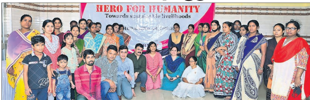
ରାଜ୍ୟର ୧୫୦ ଚିତ୍ର ପରିବାର ପାଇଁ ସ୍ୱତନ୍ତ୍ର କଲ୍ୟାଣ ପ୍ୟାକେଜ ପ୍ରଦାନ କରାଯାଇଛି ।

ଭୁବନେଶ୍ୱର, ୨୯/୭ - ରାଜ୍ୟର ୧୫୦ ଚିତ୍ର ପରିବାର ପାଇଁ ସ୍ୱତନ୍ତ୍ର କଲ୍ୟାଣ ପ୍ୟାକେଜ ପ୍ରଦାନ କରାଯାଇଛି । ଆସୋସିଏଟିଭ ଅଫ୍ ଡିଭିଜନ୍ ଓ ମେନ ଇନ୍ କର୍ମ୍ୟ ଆଣ୍ଡ ଇଣ୍ଡଷ୍ଟ୍ରି (ଏବିଡିଏମ୍ଆଇ) ସହ ମିଳିତ କୋଭିଡ୍ ପ୍ରଭାବିତ ପରିବାରକୁ ପୋଷ୍ୟ ଭାବେ ଗ୍ରହଣ କରିଛି । କମ୍ପାନୀର ସେହି କର୍ମଚାରୀଙ୍କ ସାମାଜିକ ଦାୟିତ୍ୱବାଦୀ (ସିଏସ୍ଆର୍) ପ୍ଲାନ୍ ଫର୍ 'ହିରେରା ଓ କେୟାର' ଅନ୍ତର୍ଗତ ଆରମ୍ଭ ହୋଇଥିବା 'ହିରେରା ଫର୍ ହୁଏମାନିଟି' ପ୍ରୋଜେକ୍ଟରେ କରୋନା ଭାଇରସ୍ ମହାମାରୀ ଯୋଗୁ ଗୁରୁତର ପ୍ରଭାବିତ ହୋଇଥିବା ସମାଜର ଉନ୍ନତି ଦିଗରେ ନିଜର ପ୍ରତିବଦ୍ଧତାକୁ ପାଳନ କରିବାକୁ ଯାଇ ହିରେରା ମୋଟୋକର୍ପ ଓଡ଼ିଶାର ୧୫୦ କୋଭିଡ୍ ପ୍ରଭାବିତ ପରିବାରକୁ ପୋଷ୍ୟ ଭାବେ ଗ୍ରହଣ କରିଛି । କମ୍ପାନୀର କର୍ମଚାରୀଙ୍କ ସାମାଜିକ ଦାୟିତ୍ୱବାଦୀ (ସିଏସ୍ଆର୍) ପ୍ଲାନ୍ ଫର୍ 'ହିରେରା ଓ କେୟାର' ଅନ୍ତର୍ଗତ ଆରମ୍ଭ ହୋଇଥିବା 'ହିରେରା ଫର୍ ହୁଏମାନିଟି' ପ୍ରୋଜେକ୍ଟରେ କରୋନା ଭାଇରସ୍ ମହାମାରୀ ଯୋଗୁ ଗୁରୁତର ପ୍ରଭାବିତ ହୋଇଥିବା ସମାଜର ଉନ୍ନତି ଦିଗରେ ନିଜର ପ୍ରତିବଦ୍ଧତାକୁ ପାଳନ କରିବାକୁ ଯାଇ ହିରେରା ମୋଟୋକର୍ପ ଓଡ଼ିଶାର ୧୫୦ କୋଭିଡ୍ ପ୍ରଭାବିତ ପରିବାରକୁ ପୋଷ୍ୟ ଭାବେ ଗ୍ରହଣ କରିଛି ।