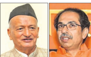
ଭରତ ସିଂ କୋଶିୟାରା ଉତ୍ତରୀ ଦଳ ନେତା

ପଞ୍ଚାମାଷ ରାଜ୍ୟପାଳଙ୍କ ମନ୍ତବ୍ୟକୁ ନେଇ ବିବାଦ ପୂର୍ଣ୍ଣ, ୩୦୭: ପଞ୍ଚାମାଷ ରାଜ୍ୟପାଳ ଭରତ ସିଂ କୋଶିୟାରାଙ୍କ ବିବାଦୀୟ ମନ୍ତବ୍ୟକୁ ନେଇ ରାଜ୍ୟରେ ରାଜନୈତିକ ଝଡ଼ ଦେଖାଦେଇଛି।