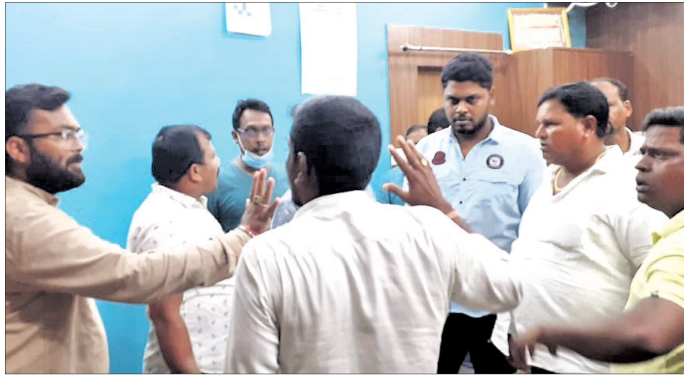
ଭେଙ୍କାନାଳ ପୌରସଂସ୍ଥା କାର୍ଯ୍ୟକ୍ରମରେ ଶନିବାର ଭାଜପା ଓ ବିଜେଡି କାର୍ଯ୍ୟକ୍ରମର ମଧ୍ୟରେ କଥା କଟାକଟି