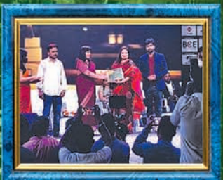
Awarded as Best Nursing & Paramedical College of Odisha