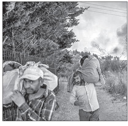
ବିଭିନ୍ନ ଅଞ୍ଚଳରେ ଅତ୍ୟଧିକ ଗ୍ରୀଷ୍ମପ୍ରବାହ, ମନୁଡ଼ି, ବୃଷ୍ଟିପାତ, ବନ୍ୟା, ଝଡ଼ବାଦୀ, ଭୂସ୍ଥଳ ଇତ୍ୟାଦି ପ୍ରକୃତି ବିପଦ ହେଉଛି, ଯାହା ଲୋକଙ୍କର ଖାଦ୍ୟ ନିରାପତ୍ତା ଏବଂ ଜୀବନନୀତିକୁ ପ୍ରତି ବିପଦ ସୃଷ୍ଟି କରୁଛି।

ପ୍ୟାରିସ୍ ଜଳବାୟୁ ଚୁକ୍ତି ଅନୁଯାୟୀ ଚାପମାତ୍ରା ବୃଦ୍ଧିକୁ ଅସମ୍ଭବତା ହେଉଥିବା ଦେଖି ତିନି ସେକ୍ସିଆସ ମଧ୍ୟରେ ରୋକିବାରେ ଆମେ ସମର୍ଥ ହେଲେ ମଧ୍ୟ ଏହା ସମସ୍ତଙ୍କ ପାଇଁ ପୁରୁଷିତ ନୁହେଁ ଏବଂ ଏହା ମଧ୍ୟକୁ କିଛି କ୍ଷତି ଅପରିବର୍ତ୍ତନୀୟ ସାଧ୍ୟ ହେବ। ଋତୁର ଅନୁପାୟୀ, ପରବର୍ତ୍ତୀ ଦଶନ୍ଧିରେ ଜଳବାୟୁ ପ୍ରଭାବକୁ ୩୨୭ ୧୩୨ ନିୟୁତ ପର୍ଯ୍ୟନ୍ତ ଲୋକ ଅତ୍ୟନ୍ତ ଦାମ୍ଭିକ ମଧ୍ୟକୁ ଠେଲି ହୋଇଯିବେ। ମାତ୍ର ୧.୧ ଡିଗ୍ରୀର ଉତ୍ତାପ ବୃଦ୍ଧିରେ ଏବେ ପୃଥିବୀର ବିଭିନ୍ନ ଅଞ୍ଚଳରେ ଅତ୍ୟଧିକ ଗ୍ରୀଷ୍ମପ୍ରବାହ, ମନୁଡ଼ି, ବୃଷ୍ଟିପାତ, ବନ୍ୟା, ଝଡ଼ବାଦୀ, ଭୂସ୍ଥଳ ଇତ୍ୟାଦି ପ୍ରକୃତି ବିପଦ ହେଉଛି, ଯାହା ଲୋକଙ୍କର ଖାଦ୍ୟ ନିରାପତ୍ତା ଏବଂ ଜୀବନନୀତିକୁ ପ୍ରତି ବିପଦ ସୃଷ୍ଟି କରୁଛି। ଭାରତ ସହ ଅନ୍ୟ ଦକ୍ଷିଣ ଏବଂ ଦକ୍ଷିଣ-ପୂର୍ବ ଏସୀୟ ରାଷ୍ଟ୍ରଗୁଡ଼ିକ ସମ୍ପ୍ରତି ଏପରି ବିପର୍ଯ୍ୟୟସବୁର ସମ୍ମୁଖୀନ ହୋଇପାରିଛନ୍ତି। ଶସ୍ୟ ଉତ୍ପାଦନ ବ୍ୟାହତ ହେବା ସହ ଉଚ୍ଚ ଜଳାଭାବ ସମସ୍ୟା ୨୦୫୦ ପୂର୍ଣ୍ଣ ଭାରତର ୪୦% ଲୋକଙ୍କୁ ପ୍ରଭାବିତ କରିବାର ସମ୍ଭାବନା ରହିଛି। ୨୦୩୦ ପୂର୍ଣ୍ଣ ବିଶ୍ୱର ଅତିରିକ୍ତ ୩୫ କୋଟି ଲୋକ ଜଳକ୍ଷିଣ୍ଣତାର ସମ୍ମୁଖୀନ ହେବେ। ସମୁଦ୍ର ପତନର ଉତ୍ତୀର୍ଣ୍ଣ ଉପକୂଳାଞ୍ଚଳକୁ ଅଧିକ ଜଳମୟ ତଥା କୃଷି ପାଇଁ ଅନୁପଯୁକ୍ତ କରିବ, ସମୁଦ୍ର ନିର୍ମୂଳିତ କୂଳ ଲିଫ୍ଟିଂ, ଉପକୂଳ ଅବସ୍ଥାରେ ବୃଦ୍ଧି ଘଟିବ ଏବଂ ଉପକୂଳବର୍ତ୍ତୀ ସହର ଓ ସମୁଦ୍ରକୂଳ ବର୍ଷିତ ବିପଦର ସମ୍ମୁଖୀନ ହେବେ। ୨୦୩୦ ପୂର୍ଣ୍ଣ ଗ୍ଲୋବାଲ ଗ୍ରୀହଣ ୧୪ ଶତାଂଶ ଜୀବଜାତି ବିନଷ୍ଟ ହେବାର ଆଶଙ୍କା ସୃଷ୍ଟି ହୋଇଛି। ବନାମ୍ନି ପୂର୍ବପେକ୍ଷା ଅଧିକ ଅଞ୍ଚଳକୁ ବ୍ୟାପ୍ତି, ଯାହା ପ୍ରାକୃତିକ ଭୂତାଳ ତଥା ଚୈତବିଧିତାରେ ଅବସ୍ଥା ଘଟାଉଛି। ଆଗାମୀ ଦିନରେ ବୃହତ୍ତାକାର