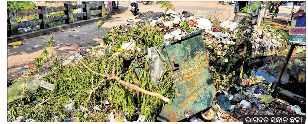
ଭାଗବତ ସହାନ ଛକା

ଏହାସହେ ଆବର୍ଜନାମୟ ରାସ୍ତାଘାଟକୁ ଦେଖିଲେ ବିଏମ୍‌ସିର ଏସବୁ ଯୋଜନା ଓ ବ୍ୟବସ୍ଥା ପ୍ରତି ଅନୁକ୍ରମିକ ନିର୍ଦ୍ଦେଶ କରୁଛି । କ'ଣ ପାଇଁ ଏପରିସ୍ଥିତି ସୃଷ୍ଟି ହୋଇଛି ତାହାକୁ ବିଏମ୍‌ସି ତଦାରଖ କରିବାର ଆବଶ୍ୟକତା ରହିଛି ।