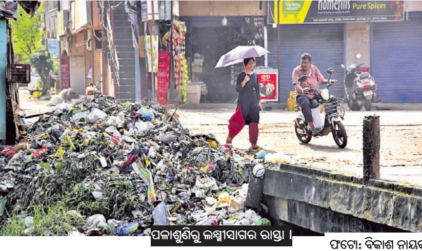
ପାଳାଶୁଣ୍ଠି ଲକ୍ଷ୍ମୀସାଗର ରାସ୍ତା ।