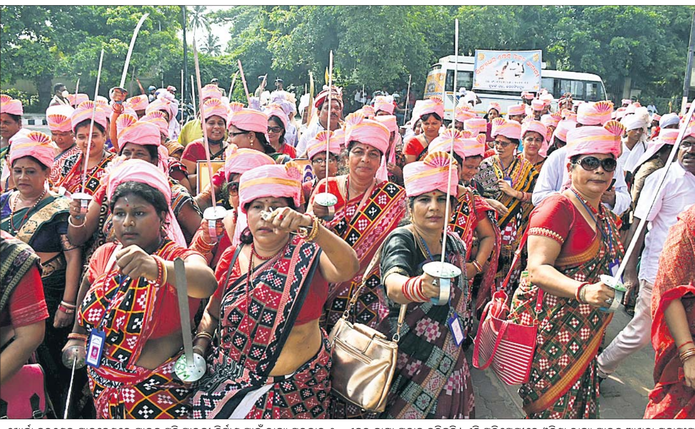
ଖୋର୍ଦ୍ଧା ବରୁଣେଇ ପାଦଦେଶରେ ପାଇକ ସ୍ମୃତି ସ୍ମାରକା ନିର୍ମାଣ ପାଇଁ ରାଜ୍ୟ ସରକାର ୧୦ ଏକର ଜାଗା ପ୍ରଦାନ କରିଛନ୍ତି । ଏହି ପରିପ୍ରେକ୍ଷାରେ ଓଡ଼ିଶା ରାଜ୍ୟ ପାଇକ ଆଖଡ଼ା ମହାସଂଘ ପକ୍ଷରୁ ରବିବାର ଭୁବନେଶ୍ୱର ପୂର୍ବନା ଭବନଠାରେ ବିଜୟ ଉତ୍ସବ ଓ ସମର୍ପଣା ପର୍ବ ସହ ରାଜ୍ୟପତ୍ରୀୟ ମହିଳା ପାଇକ ସମାବେଶର ଆୟୋଜନ କରାଯାଇଥିଲା । ସମାବେଶରେ ଯୋଗଦେବା ପାଇଁ ମହିଳାମାନେ ପାଇକ ବେଶରେ ଶୋଭାଯାତ୍ରାରେ ଆସୁଛନ୍ତି ।

ଜଗତସିଂହପୁର, ପୁରୀ, ଖୋର୍ଦ୍ଧା, ନୟାଗଡ଼, ଗଞ୍ଜାମ, ଗଜପତି, ମାଲକାନଗିରି, ବୌଦ୍ଧ, ଅନୁଗୋଳ, କେନ୍ଦୁଝର, ମୟୂରଭଞ୍ଜ, ଜେଜେନାଳ, ଦେବଗଡ଼, ସୁନ୍ଦରଗଡ଼, ନବରଙ୍ଗପୁରରେ ମଙ୍ଗଳବାର କୋରାପୁଟ, ମାଲକାନଗିରି, ରାୟଗଡ଼ା, କଳାହାଣ୍ଡି, ଗଜପତି, ଗଞ୍ଜାମ, କେନ୍ଦୁଝର, ମୟୂରଭଞ୍ଜ, ବାଲେଶ୍ୱର, ଯାଜପୁର, ଭଦ୍ରକ, ଅନୁଗୋଳ, ଜେଜେନାଳ, ସୁନ୍ଦରଗଡ଼, ଦେବଗଡ଼, କନ୍ଧମାଳ, ନବରଙ୍ଗପୁରରେ ଝଡ଼ତୋପାନ ସହ ବଜ୍ରପାତ ହେବାର ଆଶଙ୍କା ରହିଛି । ଏସବୁ ଜିଲ୍ଲାକୁ ଯେଲୋ ଓଡ଼ିଶା ଭାରି କରାଯାଇଛି । ତେବେ କୁସବାର ଦକ୍ଷିଣ ଓଡ଼ିଶାର ଅଧିକାଂଶ ସ୍ଥାନ ଏବଂ ଭଜର ଓଡ଼ିଶାର କିଛି ଜିଲ୍ଲାରେ ସ୍ୱଳ୍ପ ଧରଣର ବର୍ଷା ହେବାର ସମ୍ଭାବନା ରହିଥିବା ଭୁବନେଶ୍ୱର ଆଞ୍ଚଳିକ ପାଣିପାଗ କେନ୍ଦ୍ର ପୂର୍ବାନୁମାନ କରିଛି । ସେପେଟେ ରବିବାର ଚାନ୍ଦବାଲିରେ ୨୫.୬ ମିମି ବର୍ଷା କେବଳ କରାଯାଇଥିବାବେଳେ ବାଲେଶ୍ୱରରେ ୨.୫, ପାରାଦୀପ ୨.୨, କଟକସହରରେ ୨.୧, ଚାନ୍ଦବାଲିରେ ୨.୧ ମିମି ବର୍ଷା ହୋଇଥିବା ପାଣିପାଗ କେନ୍ଦ୍ର ପୂର୍ବନା ବେଲିଛି ।