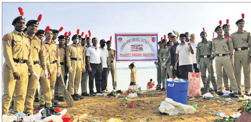
ବାଲିଯାତ୍ରା ପଡ଼ିଆ ସଫେଇ କାର୍ଯ୍ୟକ୍ରମରେ ସାମିଲ ହୋଇଥିବା ଏନ୍‌ସିସି କ୍ୟାଡେଟ୍ ଓ ଅନ୍ୟମାନେ।