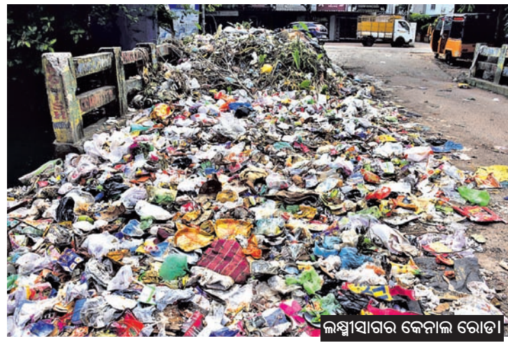
ଲକ୍ଷ୍ମୀସାଗର କେନାଲ ରୋଡ଼ା