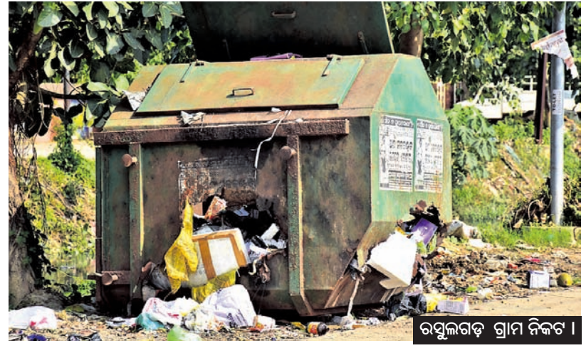
ରଫୁଲଗଡ଼ ଗ୍ରାମ ନିକଟ