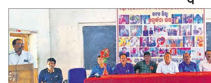
ସଭାରେ ଯୋଗଦେଇଥିବା ଅଧ୍ୟାପକ ସଂଘର କର୍ମକର୍ତ୍ତାମାନେ।