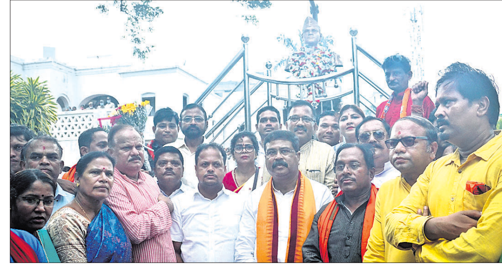
ନେତାଜୀ ଜନ୍ମସ୍ଥାନ ସଂଗ୍ରହାଳୟରେ କେନ୍ଦ୍ରମନ୍ତ୍ରୀ ଧର୍ମେନ୍ଦ୍ର ପ୍ରଧାନଙ୍କ ସହ ଭାଜପା ନେତୃବୃନ୍ଦ ଓ ଅନ୍ୟମାନେ।

ପ୍ରଜାତନ୍ତ୍ରର ୭୫ ବର୍ଷ ପୂର୍ତ୍ତି ଉପଲକ୍ଷେ ଆସନ୍ତା ୮ ତାରିଖରେ କଟକ କବାହରଲାଲ ନେହେରୁ ଇନ୍‌ଡୋର ଷ୍ଟାଡିୟମରେ ଏକ କାର୍ଯ୍ୟକ୍ରମ ଅନୁଷ୍ଠିତ ହେବ। ଏଥିରେ କେନ୍ଦ୍ରମନ୍ତ୍ରୀ ଅମିତ ଶାହା ଯୋଗଦେବାର କାର୍ଯ୍ୟକ୍ରମ ରହିଛି। ଶାହାଙ୍କ ସହିତ ଗପ୍ଟ ପୂର୍ବରୁ କେନ୍ଦ୍ରମନ୍ତ୍ରୀ ଧର୍ମେନ୍ଦ୍ର ପ୍ରଧାନ ଷ୍ଟାଡିୟମର ସ୍ଥିତି ଅନୁଧ୍ୟାନ କରିଥିଲେ। ଏଥିସହ ସୁରକ୍ଷା ବ୍ୟବସ୍ଥାର ସମୀକ୍ଷା କରିଥିଲେ। ଧର୍ମେନ୍ଦ୍ର କଟକରେ ପହଞ୍ଚିବା ପରେ ଭାଜପା ପକ୍ଷରୁ ତାଙ୍କୁ ସ୍ୱାଗତ କରାଯାଇଥିଲା। ଏହାପରେ