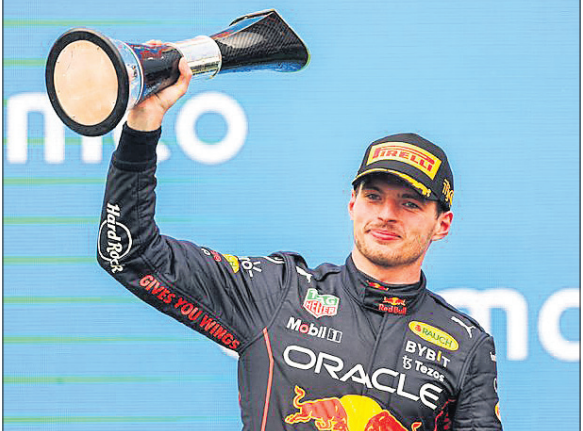
ଚ୍ରମ୍ପି ସହ ମାଜ୍ ଭର୍ଷ୍ଟାପେନ୍।

ରେଡ୍‌ବୁଲ୍‌ର ମାଜ୍ ଭର୍ଷ୍ଟାପେନ୍ ୧୦ମ ଗ୍ରାଡୁରୁ ରେସ୍ ଆରମ୍ଭ କରିଥିଲେ ହେଁ ହଲ୍‌ଫୋରିଆନ ଫର୍ମୁଲା ଓନ୍ ମୋଟର ରେସ୍ ଜିତିଛନ୍ତି। ଚଳିତ ସିଜନରେ ଏହା ହେଉଛି ତାଙ୍କ ୮ମ ଚାଉଟଲ। ଭର୍ଷ୍ଟାପେନ୍ ତାଙ୍କ ଚାଉଟଲ ପ୍ରତିଦ୍ୱନ୍ଦ୍ୱୀ ଚାଲ୍ ଲେକ୍‌ରେକ୍‌କୁ ଦୁଇଥର ଅତିକ୍ରମ କରିବା ଫେରାରିର ରେସ୍ ପରିଚାଳନାକୁ ନେଇ ସାନ ପ୍ରଶ୍ନ ଉଠିଛି। ରେଡ୍‌ବୁଲ୍‌ର ପିଟ୍ ରଣନାତି ଭର୍ଷ୍ଟାପେନ୍‌ଙ୍କୁ ଯୋଲ୍ ସିଟର ଜର୍ଜ ରସେଲଙ୍କଠାରୁ ଆଗରେ ରଖିଥିଲା। ରସେଲଙ୍କ ଚିମ୍‌ପେନ୍ ୬ ଥର ଫର୍ମୁଲା ଓନ୍ ଚାମ୍ପିୟନ