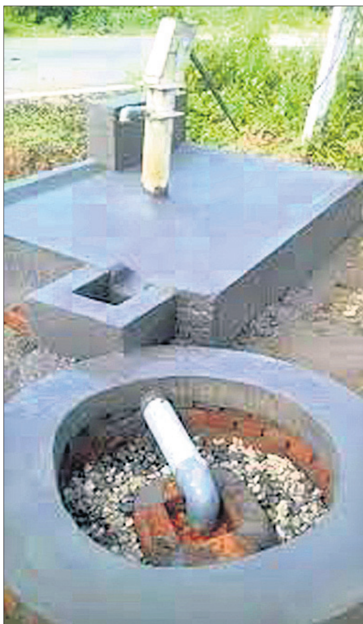
ନଳକୂପ ପାଖରେ ଭୂତଳକୁ ପାଣି ରିଚାର୍ଜ ଲାଗି ସକ୍ରିୟ ନିର୍ମାଣ କରାଯାଇଛି।

କେନ୍ଦ୍ରାପଡ଼ା ଜିଲ୍ଲା ପାନୀୟ ଜଳ ସଫଳତା ଓ ଜଳ ସଂରକ୍ଷଣ ସମସ୍ୟା ମଧ୍ୟ ଦେଇ ଗତି କରୁଛି। ଜିଲ୍ଲାର ୯୯ଟି ମଧ୍ୟରୁ ରାଜକନିକା, ଆଳି, ପଟ୍ଟାମୁଣ୍ଡା, ରାଜନଗର, ମହାକାଳପଡ଼ା, ମାର୍ଗାପାଳ ବ୍ଲକରେ ଏହା ଉତ୍ତମ ହୋଇଛି।