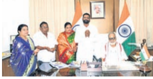
ରାହାମା, ୧୮ (ଡି.ଏନ.ଏ.):

ଜଗନ୍ନାଥ ସଂସ୍କୃତି, ଭାଗବତ ପ୍ରସାର ଲାଗି ରାଜ୍ୟପାଳଙ୍କୁ ସୁପାରିସ