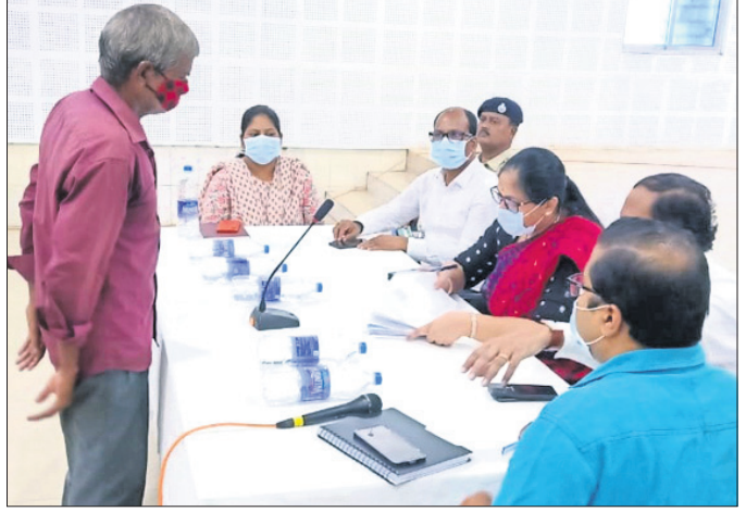
କିଲାପାଳ ଓ ଅନ୍ୟ ଅଧିକାରୀମାନେ ଅଭିଯୋଗ ଶୁଣାଣି କରୁଛନ୍ତି।