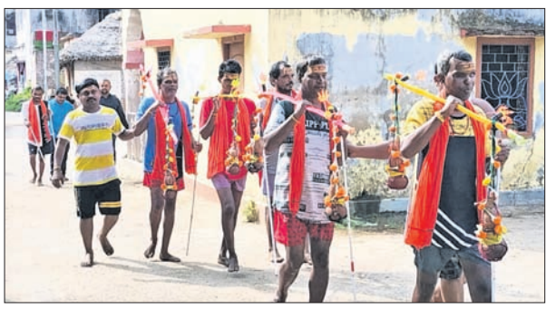
ଦୃଷ୍ଟିବାଧୁତ କାନ୍ଧିଆମାନେ ପାଣି ଭାର ନେଉଛନ୍ତି।

ଶ୍ରୀରାମ ମାସରେ ଶିବଙ୍କୁ ଜଳାଶୟନ କରିବାକୁ ସାରା ଦେଶରେ ଶ୍ରଦ୍ଧାଳୁ କାନ୍ଧରେ ଭାର ରଖୁଛନ୍ତି। ଚଳିତବର୍ଷ କେନ୍ଦ୍ରାପଡ଼ା ଜିଲ୍ଲାର ୬ ଦୃଷ୍ଟିବାଧୁତ ମୂଳକ ଏଥିରେ ସାମିଲ ହୋଇଛନ୍ତି।