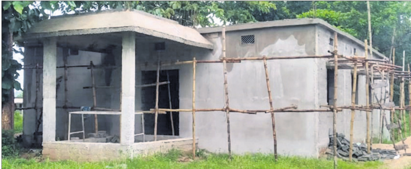
ନୀଳମାଧବ ମହାବିଦ୍ୟାଳୟରେ ନୂତନ ଲାଇବ୍ରେରୀ ଗୃହ ନିର୍ମାଣ ଚାଲିଛି।