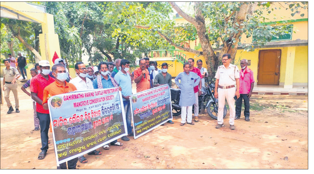
ଗହୀରମଥା ମେରାଇନ ଚର୍ଚ୍ଚଳ ପ୍ରୋଟେକ୍ସନ ଓ ମ୍ୟାନଗ୍ରୁଭ କଞ୍ଚରଭେଗନ ସୋସାଇଟି ପକ୍ଷରୁ ଡିଏସ୍‌ସିକୁ ଦାବିପତ୍ର ଦେଉଛନ୍ତି।

ବିଶ୍ୱ ପ୍ରସିଦ୍ଧ ଭିତରକନିକା ଜାତୀୟ ଉଦ୍ୟାନ ଓ ଗହୀରମଥା ସାଂସ୍କୃତିକ ଅଭୟାରଣ୍ୟର ସୁରକ୍ଷା ନିମନ୍ତେ ଗହୀରମଥା ମେରାଇନ ଚର୍ଚ୍ଚଳ ପ୍ରୋଟେକ୍ସନ ଓ ମ୍ୟାନଗ୍ରୁଭ କଞ୍ଚରଭେଗନ ସୋସାଇଟି ପକ୍ଷରୁ ପ୍ରତ୍ୟାମୁଖ୍ୟ ଉଦ୍ଦେଶ୍ୟରେ ମାନପତ୍ର ରାଜନଗର ଡିଏସ୍‌ସିକୁ ପ୍ରଦାନ କରାଯାଇଛି।