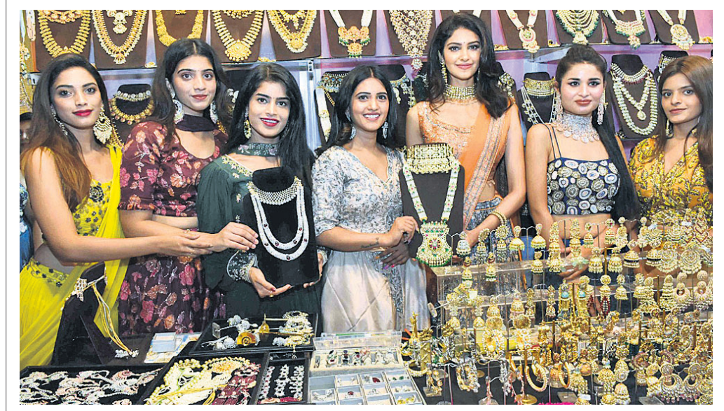
ହାଇ ଲାଇଫ୍ ଏକ୍ସିଭିଗନ ପକ୍ଷରୁ ଆୟୋଜିତ ୨ ଦିନିଆ ଫ୍ୟାଶନ ଆଣ୍ଡ ଲାଇଫ୍ ଷ୍ଟାଇଲ ପ୍ରଦର୍ଶନୀର ଶେଷ ଦିନରେ ଜାତୀୟସ୍ତରର ଡିଜାଇନରଙ୍କ ଦ୍ୱାରା ପ୍ରସ୍ତୁତ ଭିନ୍ନ ଭିନ୍ନ ଅଙ୍କନରୁ ମହିଳା ଡିଜାଇନରମାନେ ପ୍ରଦର୍ଶନ କରୁଛନ୍ତି।

ନୂଆଦିଲ୍ଲୀ, ୧୮: ଲଗାତାର ୪ର୍ଥ ଦିନ ପାଇଁ ଷ୍ଟକ୍ ବଜାର ଶେୟାର ବୃଦ୍ଧି ପାଇଛି। ଏପରିକି ଚଳିତ ସପ୍ତାହର ପ୍ରଥମ କାର୍ଯ୍ୟ ଦିବସରେ ଘରୋଇ ଷ୍ଟକ୍ସ ନିବେଶକଙ୍କ ମଧ୍ୟରେ ଉତ୍ସାହ ପରିଲକ୍ଷିତ ହୋଇଛି। ଅନ୍ତର୍ଜାତୀୟ ଟେକ୍ ବଜାରରେ କ୍ରମାଗତ ଦର ହ୍ରାସ ଏବଂ ଭାରତୀୟ ମୁଦ୍ରାର ସୁଧାର ଯୋଗୁ ଷ୍ଟକ୍ ମାର୍କେଟର ୧ମ କାର୍ଯ୍ୟ ଦିବସରେ ମଧ୍ୟ କାରବାର ଭଲ ରହିଛି। ସୋମବାର ଉତ୍ତର ସେକ୍ଟରରେ ୧୯% ରୁ ଊର୍ଦ୍ଧ୍ୱ ଶେୟାର ବୃଦ୍ଧି ଘଟିଛି। ଫଳରେ ସେକ୍ଟରାଳ ୫୪୫ (୫୪୫.୨୫) ପଏଣ୍ଟ ବୃଦ୍ଧି ଘଟି ୫୮,୧୧୫ (୫୮,୧୧୫.୫୦) ଅଙ୍କରେ କାରବାର ବନ୍ଦ ହୋଇଥିବା ବେଳେ ନିଫ୍ଟି-୫୦ରେ ୧୮୨ (୧୮୧.୮୦) ପଏଣ୍ଟ ବୃଦ୍ଧି ୧୭,୩୪୦ (୧୭,୩୪୦.୦୫) ଅଙ୍କରେ କାରବାର ଶେଷ କରିଥିବା ସୂଚନା ମିଳିଛି। ଉଲ୍ଲେଖଯୋଗ୍ୟ, ଷ୍ଟକ୍ ବଜାରର ୧ମ କାର୍ଯ୍ୟ ଦିବସରେ ବିଶେଷ କରି ବ୍ୟାଙ୍କ, ଆରଟି ଓ ମେଟାଲ ଏପରିକି ସେକ୍ଟରୀଆଲ କ୍ଷେତ୍ରରେ ମଧ୍ୟ ଉନ୍ନତ ପରିଲକ୍ଷିତ ହୋଇଛି।