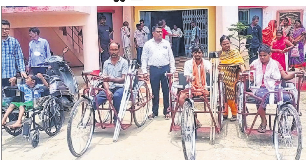
ଦିବ୍ୟାଙ୍ଗମାନଙ୍କୁ ଟ୍ରାଇ ସାଇକେଲ ପ୍ରଦାନ କରାଯାଇଛି।