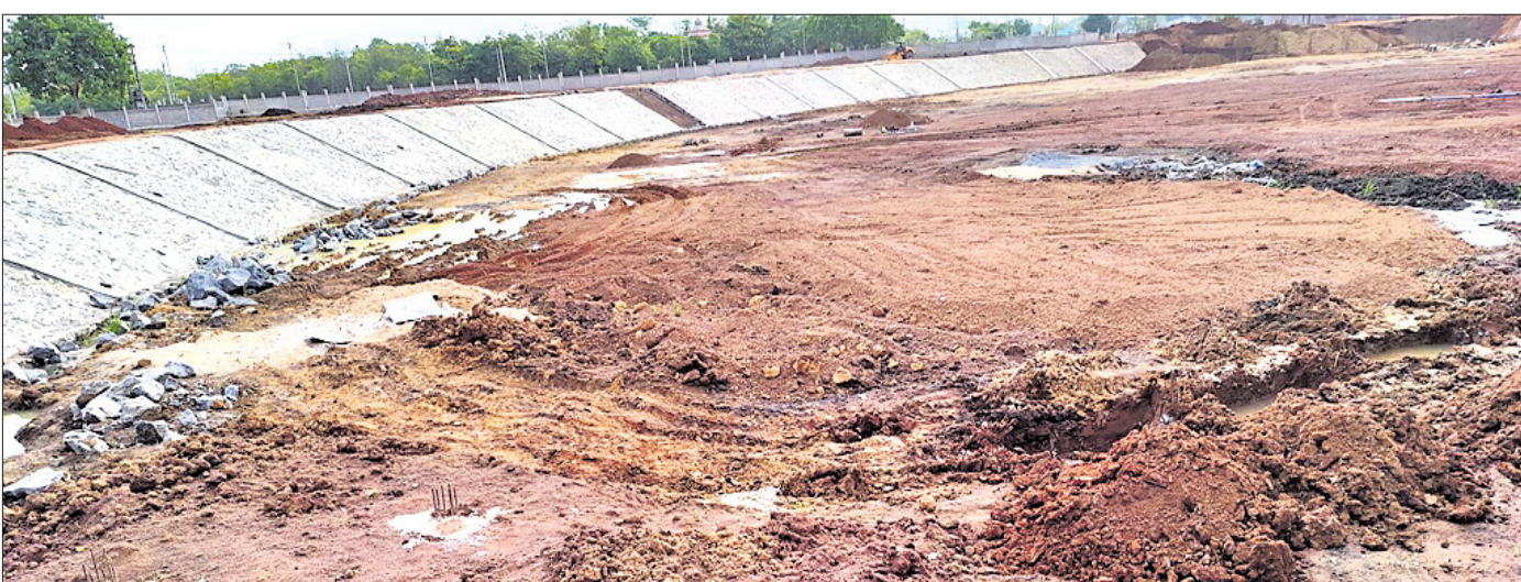
ବ୍ୟାସ ସରୋବର ଉନ୍ନୟନ କାର୍ଯ୍ୟ ଚାଲିଛି।