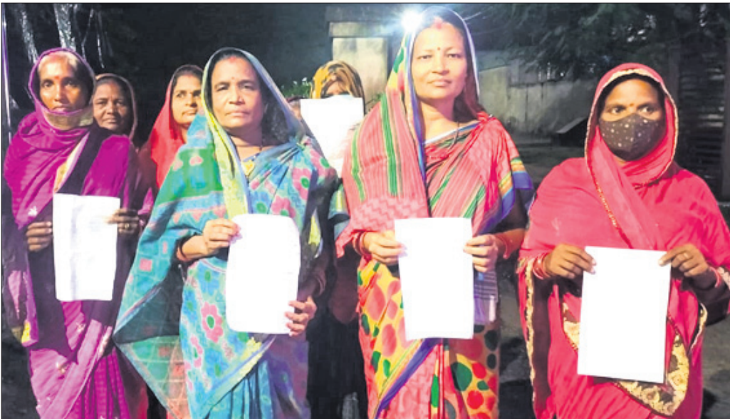
ମହିଳାମାନେ ଅଭିଯୋଗପତ୍ର ଦେଖାଉଛନ୍ତି।