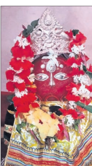
କରିବାର କାର୍ଯ୍ୟକ୍ରମ ରହିଛି। ପରମ୍ପରା ଅନୁଯାୟୀ ମନ୍ଦିରକୁ ମା'ପ୍ରବେଶ କରିବା

ବିଦଗ୍ଧ କରି ଅଭିନୟ ସାମଗ୍ରୀସହରକ ଦ୍ୱାରା ପ୍ରତିଷ୍ଠିତ ମାନସ ବୁଦ୍ଧବନ୍ଦନେ ମା' ବୁଢ଼ୀ ଜାଗୁଳା ବରା ଅଞ୍ଚଳର ଅଗ୍ରଦେବୀ ଭାବେ ପୂଜା ପାଇଥାନ୍ତି। ତାଙ୍କୁ ଆଜ୍ଞା କଷ୍ଟରେ ଆରପନା କଲେ କାହାର ପ୍ରାଣନା ବ୍ୟର୍ଥ ହୁଏ ନାହିଁ ବୋଲି କନକ୍ଷୁତି ଅଛି। ପବିତ୍ର ଶ୍ରାବଣ ମାସ ଏକାଦଶୀ ତିଥିରୁ ମା'ମନ୍ଦିରକୁ ବାହାରି ସେବକମାନଙ୍କ ଦ୍ୱାରା ଭକ୍ତର ଦୁଃଖ ବୁଝିବାକୁ ୯ ଦିନ ଗ୍ରାମ ପରିକ୍ରମା କରିଥାନ୍ତି। ଆତାଖଳ ବ୍ରାହ୍ମଣ ବୁଢ଼ୀ ଯାଇ ମା'ଜାଗୁଳା ମଣୋହା କରିବା ସହ ୯ ଦିନ ପରେ ବ୍ରାହ୍ମଣୀ ସପ୍ତମୀ ଯତ୍ନ ନଦୀରୁ ସ୍ନାନ ସାରି ମନ୍ଦିରକୁ ପ୍ରବେଶ କରନ୍ତି। ମଙ୍ଗଳବାର ଜାଗୁଳା ପଞ୍ଚମୀ। ମା' ଜାଗୁଳାଙ୍କ କାତ୍ୟାୟନୀକାଞ୍ଚ ଏକ ବିରାଟ ଶୋଭାଯାତ୍ରାରେ ବାହାରି ଘଣ୍ଟଘଣ୍ଟା, ବାଦ୍ୟ ସଂକୀର୍ତ୍ତନର ତାଳେ ତାଳେ ମନ୍ଦିରକୁ ପ୍ରବେଶ