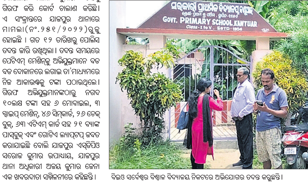
ବିଭାଗ ସର୍ବେକ୍ଷଣ ବିଦ୍ୟାଳୟ ନିକଟରେ ଅଭିଯୋଗର ତଦନ୍ତ କରୁଛନ୍ତି।

ବିଭିନ୍ନ ବୃକ୍ଷ କଷ୍ଟିଆର ସରକାରୀ ପ୍ରାଥମିକ ବିଦ୍ୟାଳୟରେ ପାଠ ପଢ଼ାଉଥିବା ଦୁଇ ଶିକ୍ଷୟିତ୍ରୀଙ୍କ ମଧ୍ୟରେ ଦୀର୍ଘ ଦିନ ହେବ ଝଗଡ଼ା ଲାଗିରହିଛି। ଏନେଇ ପିଲାଙ୍କ ପାଠପଢ଼ା ବାଧାପ୍ରାପ୍ତ ହେଉଥିବାରୁ ଉଭୟଙ୍କୁ ବିଦ୍ୟାଳୟରୁ ହଟାଇ ଦିଆଯାଇଥିଲା।