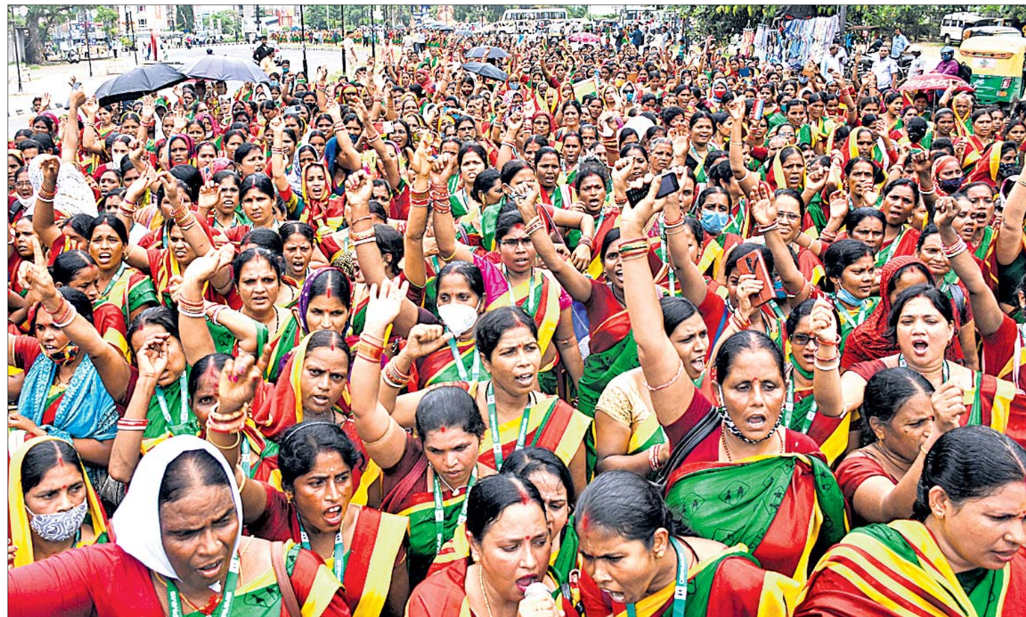
୫ଲକ୍ଷ ଟଙ୍କାର କାବନ ବାମା, ମାସିକ ୧ହଜାର ଟଙ୍କା ଭତ୍ତା, ପିଲାଙ୍କୁ ଶିକ୍ଷା ସୁବିଧା ସମେତ ବିକ୍ରୟ ପଦ୍ଧତି, ରଣ, କମି ଆଦି ୭ ବମା ବାବି ନେଇ ସୋମବାର ଓଡ଼ିଶା ସରକାର ପତ୍ରିକା ମହିଳା ମହାସଂଘ ପକ୍ଷରୁ ଭୁବନେଶ୍ୱର ଲୋକସଭା ପିଏମ୍‌ସିରେ ବିରୋଧ।

ରାସ୍ତାକଡ଼ି ବନାବଳୀ ନଷ୍ଟ ହୋଇଥିଲା। ଚାରାରୋପଣ ପାଇଁ ଭୁଲ ସ୍ଥାନ ଚୟନ ଓ ଅନୁପାଳନ ପରିଚାଳନା ଯୋଗୁ ୨୫୧ ଘାଟିରେ ଚାରା ରୋପଣ ସମ୍ପୂର୍ଣ୍ଣ ଫେଲ୍ ମାରିଛି। ରାଉରକେଲା ବନଖଣ୍ଡ ଡିଭିଜନରେ ୨୦୧୫ରୁ ୨୦୧୬ ମଧ୍ୟରେ ପାନପୋଷ, କୁଆଁରମୁଣ୍ଡା, ରାଜଗାଙ୍ଗୁଳୀ ସହରାଞ୍ଚଳ ଚାରାରୋପଣରେ ଜଳ ସଞ୍ଚନ ପାଇଁ ବିନା ଟେଣ୍ଡରରେ ୬୯.୧୨ ଲକ୍ଷ ଟଙ୍କା ଦିଆଯାଇଥିବା ରିପୋର୍ଟରୁ ଜଣାପଡ଼ିଛି। ରାଜ୍ୟରେ ସବୁଜ ବନୟ ପୃଷ୍ଠି କରିବା ପୂର୍ବରୁ କାର୍ଯ୍ୟ ଜଳାଭୟ ନାତି ଅନୁଯାୟୀ ରାଜ୍ୟ ସରକାର ନିଜସ୍ୱ ଜଳାଭୟ ନାତି କରିବା କଥା। ମାତ୍ର ଏହା ନ ହେବା ଯୋଗୁ ରାଜ୍ୟରେ ଜଳାଭୟ ଦୃଷ୍ଟି ପାଇଁ ପର୍ଯ୍ୟାପ୍ତ ଯୋଜନା ହୋଇପାରି ନାହିଁ। ଚାରା ରୋପଣ ପରେ ରକ୍ଷଣାବେକ୍ଷଣ ନେଇ ଶ୍ରେଣୀଗୁଡ଼ିକରେ କାର୍ଯ୍ୟ କରୁଥିବା କର୍ମଚାରୀମାନେ ରିପୋର୍ଟ ରଖିନାହାନ୍ତି। ଏ ଦିଗରେ ଅଭାବରେ ରଖାଯାଇଥିବା ସିଏଜି ତାଙ୍କ ରିପୋର୍ଟରେ ଉଲ୍ଲେଖ କରିଛନ୍ତି। ରାଜ୍ୟର ଜଳବାୟୁ ଅନୁସାରେ ଶାଳ ଗଛ ଲଗାଇବା ସ୍ଥାନରେ ଜଳାଭୟ ବିଭାଗ ଶାଳୁଆନ ଗଛ ଲଗାଇଥିଲେ, ଯାହାକି ଡିଭିଜନରୁ ନଷ୍ଟ କରିଥିଲା। ରାଜ୍ୟରେ ମହମ୍ମା ଗାନ୍ଧୀ ୧୮ ପୃଷ୍ଠା-୨