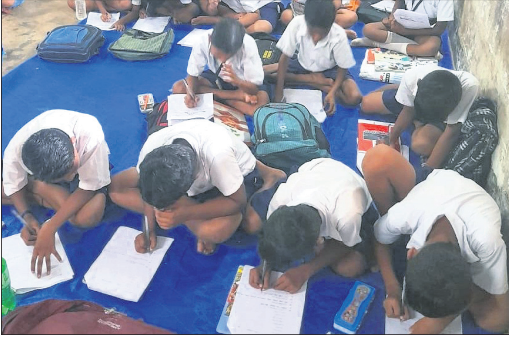
ଛାତ୍ରମାନେ ବାରଣ୍ଡାରେ ବସି ପଢୁଛନ୍ତି।

ନୟାଗଡ଼ ଜିଲା ସଦର ମହକୁମାଠାରୁ ମାତ୍ର ୧ କିମି ଦୂରରେ ଅବସ୍ଥିତ ସିନ୍ଧୁରିଆ ସରକାରୀ ଉଚ୍ଚ ବିଦ୍ୟାଳୟ। ଏଠାରେ ଶ୍ରେଣୀ ଗୃହ ଓ ଶିକ୍ଷକ ଅଭାବ କନିଟ ସମସ୍ୟାକୁ ନେଇ ପରିଚାଳନା କମିଟି ପକ୍ଷରୁ ଚଳିତ ୫ ଚାରିଖର ବିଦ୍ୟାଳୟ ସମ୍ପୂର୍ଣ୍ଣରେ ଧାରଣା ଦିଆଯିବା ପାଇଁ ଉଚ୍ଚ ପଦବୀକୁ ଲିଖିତ ଭାବେ ଜଣାଇ ଦିଆଯାଇଛି। ବିଦ୍ୟାଳୟରେ ପ୍ରଥମରୁ ଦଶମ ଶ୍ରେଣୀ ପର୍ଯ୍ୟନ୍ତ ୩୦୫ ଜଣ ଛାତ୍ରଛାତ୍ରୀ ପାଠ ପଢୁଥିବା ବେଳେ ୧୦ଟି ଶ୍ରେଣୀ ଗୃହ ବଦଳରେ ମାତ୍ର ୫ଟି ଅଛି। ୧୯୩୦ ମସିହାରୁ ପ୍ରତି ଏହି ବିଦ୍ୟାଳୟଟି ଜାତୀୟ ରାଜପଥ ନଂ. ୫୭ କଡ଼ରେ ରହିଛି। ଶ୍ରେଣୀ ଗୃହ ଅଭାବରୁ ପିଲାମାନେ ବିଦ୍ୟାଳୟର ବାରଣ୍ଡାରେ ଅତି ଦୟନୀୟ ଅବସ୍ଥାରେ ପାଠ ପଢୁଛନ୍ତି। ଅତିରିକ୍ତ ଶ୍ରେଣୀଗୁଡ଼ିକ ନିର୍ମାଣ ପାଇଁ ପ୍ରଶାସନର ବାରମ୍ବାର ଦୃଷ୍ଟି ଆକର୍ଷଣ କରାଯିବା ସତ୍ତ୍ୱେ ମାତ୍ର ଗୋଟିଏ ଶ୍ରେଣୀ ଗୃହ ନିର୍ମାଣ କାର୍ଯ୍ୟ ଆରମ୍ଭ କରାଯାଇଛି। ଯଦି ବିଦ୍ୟାଳୟକୁ ୫-୬ଟି ଅଧୀନରେ ରୂପାନ୍ତରିତ କରାଯାଇ ପାରନ୍ତା ତେବେ ଏହି ସର୍ବପୁରାତନ ଅନୁଷ୍ଠାନଟି ନୂଆ ରୂପ ପାଇ ପାରନ୍ତା।