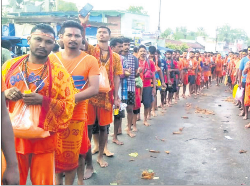
ଲଡୁବାବାଙ୍କ ପାଖରେ ଜଳ ଲାଗି କରୁବାକୁ କାଉଡ଼ିଆମାନେ ଲାଠି ଧାଡ଼ିରେ ଠିଆ ହୋଇଛନ୍ତି।