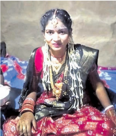
ଅପରାଜିତା (ପାଲକ ପଟ୍ଟା)

କୃଷକମାନଙ୍କୁ ଉତ୍ସାହ ଦେବା ପାଇଁ ବିଭାଗୀୟ ଅଧିକାରୀଙ୍କ ସହିତ ମିଳିତ ଭାବରେ କାର୍ଯ୍ୟାଳୟରେ ବସନ୍ତ ପର୍ବ ପାଳନ କରାଯାଇଛି।