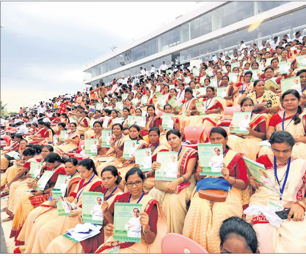
ଭୁବନେଶ୍ୱରରେ କଳିଙ୍ଗ ହକି ଷ୍ଟାଡ଼ିୟମରେ ସୋମବାର ଆୟୋଜିତ ପ୍ରଶିକ୍ଷଣ କାର୍ଯ୍ୟକ୍ରମରେ ନବନିଯୁକ୍ତ ୬,୮୯୧ ହାଇସ୍କୁଲ ଶିକ୍ଷୟିତ୍ରୀ ଓ ଶିକ୍ଷକଙ୍କୁ ମୁଖ୍ୟମନ୍ତ୍ରୀ ନବୀନ ପଟ୍ଟନାୟକ ଶୁଭେଚ୍ଛା ଜଣାଇଛନ୍ତି ।