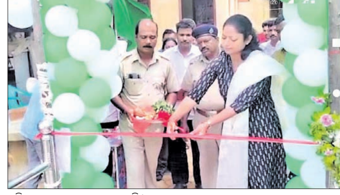
ଏଣୁ ପଏଣୁ ଉଦ୍ଘାଟନ କରାଯାଇଛି।