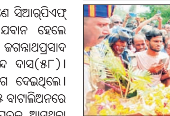
ଉଠାଇ ଅଚେତ ଖବରଦେଇ ତୁରନ୍ତ ଚରମ୍ପା ଶେଷକରଣ ପହଞ୍ଚିବାକୁ କହୁଥିଲେ।

ରେଳରେ ବିଭାଗର ଡାକ୍ତରଖାନାକୁ ନେଇଥିଲେ। ସେଠାରେ ତାଙ୍କୁ ମୃତ ଘୋଷଣା କରାଯାଇଥିଲା।