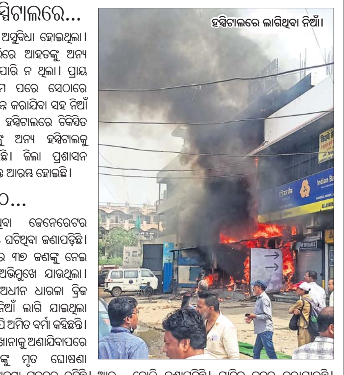
ହସ୍ତିଚାଲରେ ଲାଗିଥିବା ନିଆଁ।

ସ୍ଥାନାନ୍ତର କରିବାରେ ଅସୁବିଧା ହୋଇଥିଲା। ଫଳରେ ଦ୍ୱିତୀ ଭିତ୍ତିରେ ଆହତଙ୍କୁ ଅନ୍ୟ ହସ୍ତିଚାଲକୁ ନିଆଯାଇପାରି ନ ଥିଲା। ପ୍ରାୟ ଘଣ୍ଟାଏ ଧରି ଉଦ୍ୟମ ପରେ ସେଠାରେ ବିଦ୍ୟୁତ୍ ସଂଯୋଗ ବିଚ୍ଛିନ୍ନ କରାଯିବା ସହ ନିଆଁ ଲିଭାଯାଇଥିଲା। ଉକ୍ତ ହସ୍ତିଚାଲରେ ଚଳିଥିବା ହେଉଥିବା ରୋଗୀଙ୍କୁ ଅନ୍ୟ ହସ୍ତିଚାଲକୁ ସ୍ଥାନାନ୍ତର କରାଯାଇଛି। ଜିଲ୍ଲା ପ୍ରଶାସନ ପକ୍ଷରୁ ଘଟଣାର ତଦନ୍ତ ଆରମ୍ଭ ହୋଇଛି।