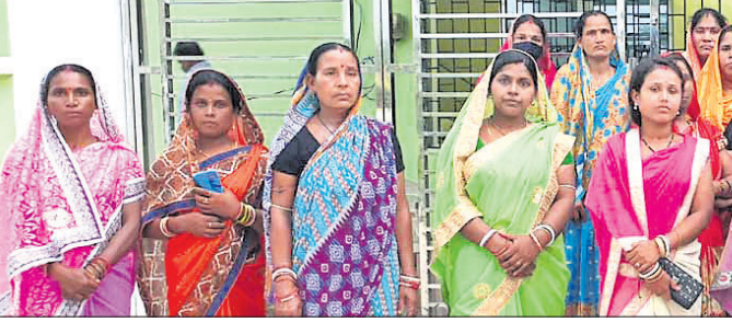
ସିପୁଲିଆ କୃଷି କାର୍ଯ୍ୟାଳୟ ଫାଟକ ସମ୍ମୁଖରେ ମହିଳାମାନେ ଧାରଣା ଦେଇଛନ୍ତି।

ବାଲେଶ୍ଵର ଜିଲ୍ଲା ସିପୁଲିଆ ବ୍ଲକ୍ ପୁରୁଣା ପଞ୍ଚାୟତ କାର୍ଯ୍ୟାଳୟ ପରିସରରେ ୧୦୦ବସ୍ତ୍ରା ଗ୍ରୋମର ସାର ଜବତକୁ କେନ୍ଦ୍ର କରି ସୋମବାର ପଞ୍ଚାୟତର ବିଭିନ୍ନ ଅଞ୍ଚଳକୁ ୩୦ରୁ ଊର୍ଦ୍ଧ୍ଵ ମହିଳା ସିପୁଲିଆ କୃଷି ବିଭାଗ ଫାଟକ ସମ୍ମୁଖରେ ଧାରଣା ଦେବା ସହିତ ଚାଷ କାମ ପାଇଁ ୧୦୦ବସ୍ତ୍ରା ଗ୍ରୋମର ସାର ଯୋଗାଇ ଦେବାକୁ ଦାବି କରିଛନ୍ତି। ସକ୍ଷା ପର୍ଯ୍ୟନ୍ତ ସାର ସମସ୍ୟାର ସମାଧାନ ହୋଇପାରିନାହିଁ । ସାର ନ ମିଳିବା ପର୍ଯ୍ୟନ୍ତ ଏହି ଧାରଣା ଚାଲୁ ରହିବ ବୋଲି ମହିଳାମାନେ ସୂଚନା ଦେଇଛନ୍ତି । ଅପରପକ୍ଷେ କୃଷି ଉଚ୍ଚ କର୍ତ୍ତୃପକ୍ଷ ଓ ଜିଲ୍ଲାପାଳ ଏହାର ତଦନ୍ତ ଦାୟିତ୍ଵ ନେଇଥିବାରୁ ତକ୍ଷୁରରେ