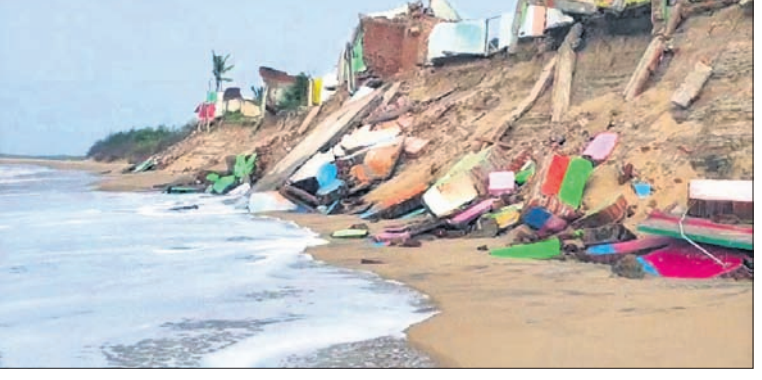
କୂଳଖାଇ କନକସଡ଼ି ଆଡ଼କୁ ମାଟି ଆସିଛି ସମୁଦ୍ର ।

ଗଞ୍ଜାମରେ କୂଳ ଖାଇଛି ସମୁଦ୍ର ଆଦର୍ଶ କଲୋନୀରେ ଥଇଥାନ ଯୋଜନା: ଜିଲାପାଳ