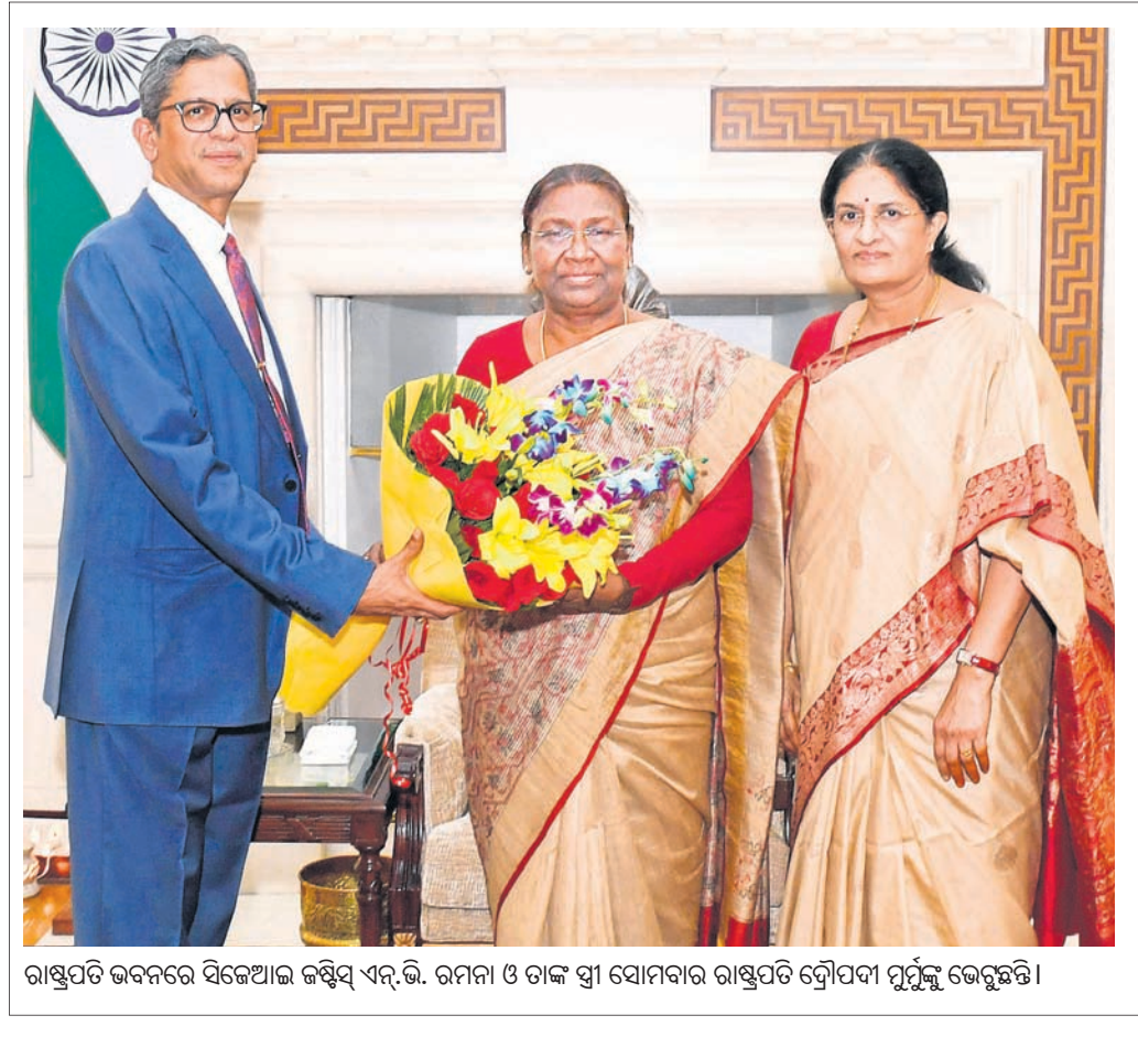
ରାଷ୍ଟ୍ରପତି ଭବନରେ ସିଜେଆଇ ଜଷ୍ଟିସ୍ ଏନ୍.ଭି. ରମଣା ଓ ତାଙ୍କ ସ୍ତ୍ରୀ ସୋମବାର ରାଷ୍ଟ୍ରପତି କ୍ରୀଡ଼ାପଦା ମୁର୍ତ୍ତିକୁ ଭେଙ୍ଗୁଛନ୍ତି।