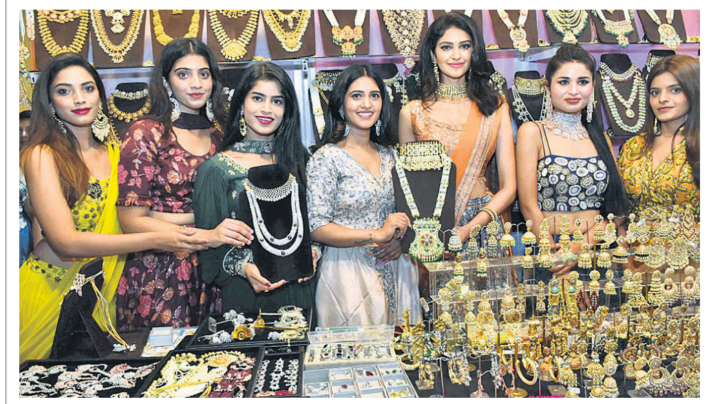
ହାଇ ଲାଇଟ୍ ଏକ୍ସିଭିଶନ ପକ୍ଷରୁ ଆୟୋଜିତ ୨ ଦିନିଆ ଫ୍ୟାଶନ ଆଣ୍ଡ ଜୱେଲ୍ ଷୋର ପ୍ରଦର୍ଶନୀର ଶେଷ ଦିନରେ ଜାତୀୟସ୍ତରର ଡିଜାଇନରଙ୍କ ଦ୍ୱାରା ପ୍ରସ୍ତୁତ ଭିନ୍ନ ଭିନ୍ନ ଅନୁଭବକୁ ମହିଳା ଡିଜାଇନରମାନେ ପ୍ରଦର୍ଶନ କରୁଛନ୍ତି।

ନୂଆଦିଲ୍ଲୀ, ୧୮: ଲଗାତର ୪ର୍ଥ ଦିନ ପାଇଁ ଷ୍ଟକ୍ ବଜାର ଶେୟାର ବୃଦ୍ଧି ପାଇଛି। ଏପରିକି ଗତ ସପ୍ତାହର ପ୍ରଥମ କାର୍ଯ୍ୟ ଦିନରେ ବଜାର ଷ୍ଟକ୍ ଇଣ୍ଡେକ୍ସରେ ମଧ୍ୟ ଉତ୍ସାହ ପରିଲକ୍ଷିତ ହୋଇଛି।