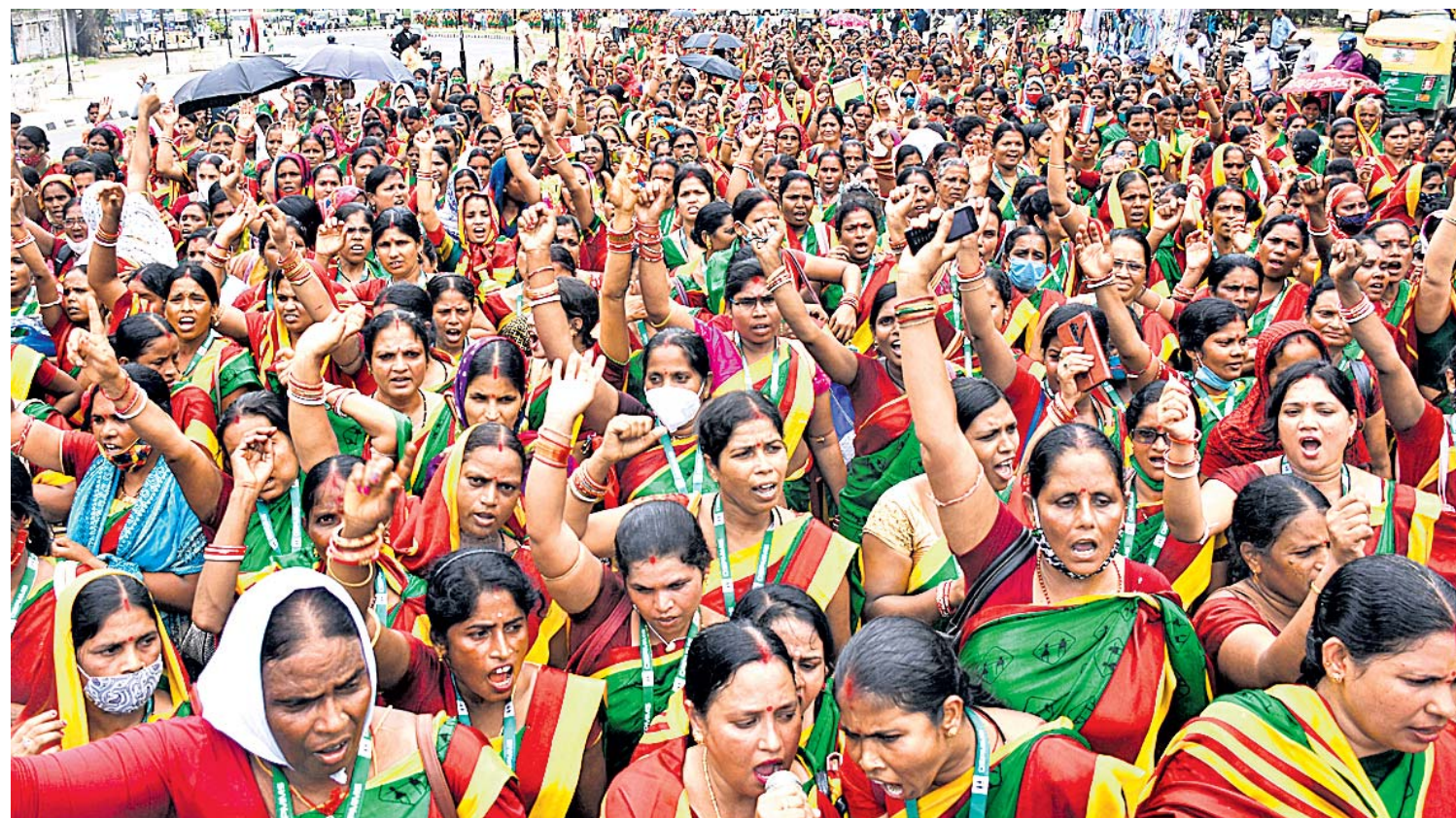
୫ଲକ୍ଷ ଚକାର ଜୀବନ ବାପା, ମାସିକ ୧ହଜାର ଟଙ୍କା ଭତ୍ତା, ପିଲାଙ୍କୁ ଶିକ୍ଷା ପୁସ୍ତକ ସମେତ ବିକ୍ରୟ ପାଇଁ, ରଣ, କମି ଆଦି ୭ ବର୍ଷା ବାଦି ନେଇ ସୋମବାର ଓଡ଼ିଶା ସରକାର ପତ୍ରିକା ମହିଳା ମହାସଂଘ ପକ୍ଷରୁ ଭୁବନେଶ୍ଵର ଲୋକସଭା ପିଏମ୍‌ସିରେ ବିରୋଧ।

ବିଲିଭ୍ ଅଭିନେତା ଆମିର ଖାନଙ୍କ ଦ୍ଵାରା ଅଭିନୀତ 'ଲାଲ୍ ସିଂ ଚଡ଼ା'କୁ ନେଇ ଟୁଇଟ୍ଟରରେ ବ୍ୟକ୍ତ ଶ୍ରେଷ୍ଠ ଆରମ୍ଭ ହୋଇଛି।