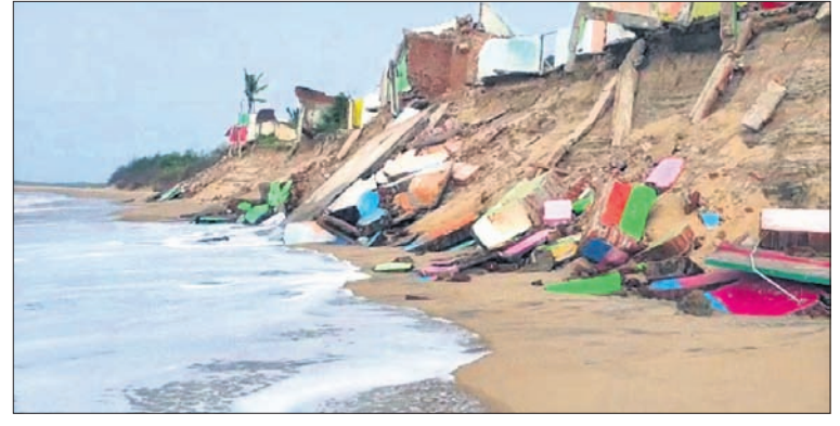
କୂଳଖାଇ କନକସଡ଼ି ଆଡ଼କୁ ମାଟି ଆସିଛି ସମୁଦ୍ର।

ଗଞ୍ଜାମରେ କୂଳ ଖାଉଛି ସମୁଦ୍ର ଆଦର୍ଶ କଲୋନୀରେ ଥଇଥାନ ଯୋଜନା: ଜିଲାପାଳ