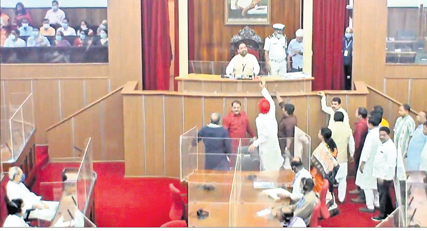
ବିଧାନସଭାରେ ସୋମବାର ମୃତ୍ୟୁ, ଚିତ୍ତଫଳ ପ୍ରସଙ୍ଗରେ ବିରୋଧୀ ଭାଙ୍ଗପା ଓ କଂଗ୍ରେସ ବିଧାୟକଙ୍କ ହଜିଗୋଲ ।