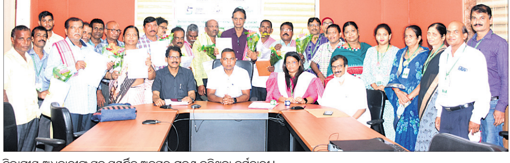
ବିଭାଗୀୟ ଅଧିକାରୀଙ୍କ ସହ ସମ୍ପର୍କିତ ଅବସର ଗ୍ରହଣ କରିଥିବା କର୍ମଚାରୀ।

ଭୁବନେଶ୍ୱର, ୧୮ (ସ୍ୱାଭାବ) - କୃଷି ଓ ଖାଦ୍ୟ ଉତ୍ପାଦନ ନିର୍ଦ୍ଦେଶାଳୟର ୧୨ଜଣ କ୍ଷେତ୍ର କର୍ମଚାରୀଙ୍କୁ ଅବସର ଦିନରେ ଫାଇନାଲ୍ ପେନ୍‌ସନ୍ ପ୍ରଦାନ କରାଯାଇଛି। ଏମାନଙ୍କ ମଧ୍ୟରେ କୋରାପୁଟ, ନୁଆପଡ଼ା, ସୁନ୍ଦରଗଡ଼, ବଲାଙ୍ଗୀର, ନବରଙ୍ଗପୁର, ଖୋର୍ଦ୍ଧା, ଗଞ୍ଜାମ, କେନ୍ଦୁଝର ଏବଂ ପୁଲଘାଣା ଜିଲାର ଏଗ୍ରିକଲଚର ଓଭରସିଅର, ସିନିଅର୍ ସ୍ପେନା, ସ୍ୱାଡ଼ିଂଗଜାଲ୍ ଆସିଷ୍ଟଣ୍ଟ