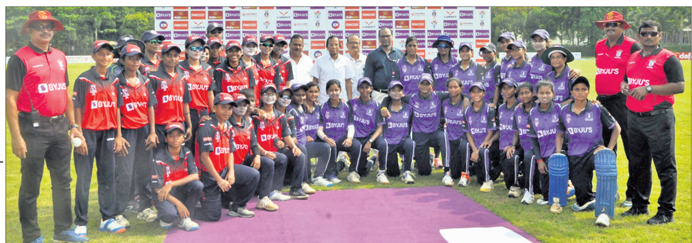
କଟକ ଡ୍ରିମ୍ ଗ୍ରାଉଣ୍ଡରେ ସୋମବାର ଓଡ଼ିଶା ମହିଳା ଟି୨୦ ଲିଗ୍ ଉଦ୍‌ଘାଟନ ଅବସରରେ ଅତିଥିକ ସହ ଖେଳାଳି।

ଭୁବନେଶ୍ୱର କପ୍ ଉପରେ ଫୋକସ ରହିଛି: ଗୋପାଳ ଭୁବନେଶ୍ୱର କପ୍ ଉପରେ ଫୋକସ ରହିଛି: ଗୋପାଳ ଭୁବନେଶ୍ୱର କପ୍ ଉପରେ ଫୋକସ ରହିଛି: ଗୋପାଳ