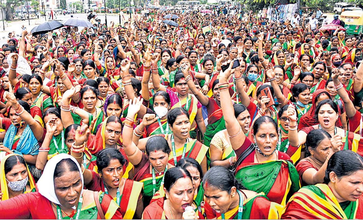
୫ଲକ୍ଷ ଟଙ୍କାର ଜୀବନ ବୀମା, ମାସିକ ୧ହଜାର ଟଙ୍କା ଭତ୍ତା, ପିଲାଙ୍କୁ ଶିକ୍ଷା ସୁବିଧା ସମେତ ବିକ୍ରି ପଦ୍ଧତିର, ରଣ, କମି ଆଦି ୭ ବର୍ଷା ବାବି ନେଇ ଘୋଷଣା ଓଡ଼ିଶା ସରକାର ପତ୍ରିକା ମହିଳା ମହାସଂଘ ପକ୍ଷରୁ ଭୁବନେଶ୍ୱର ଲୋକସଭା ପରିସରରେ ବିରୋଧ।