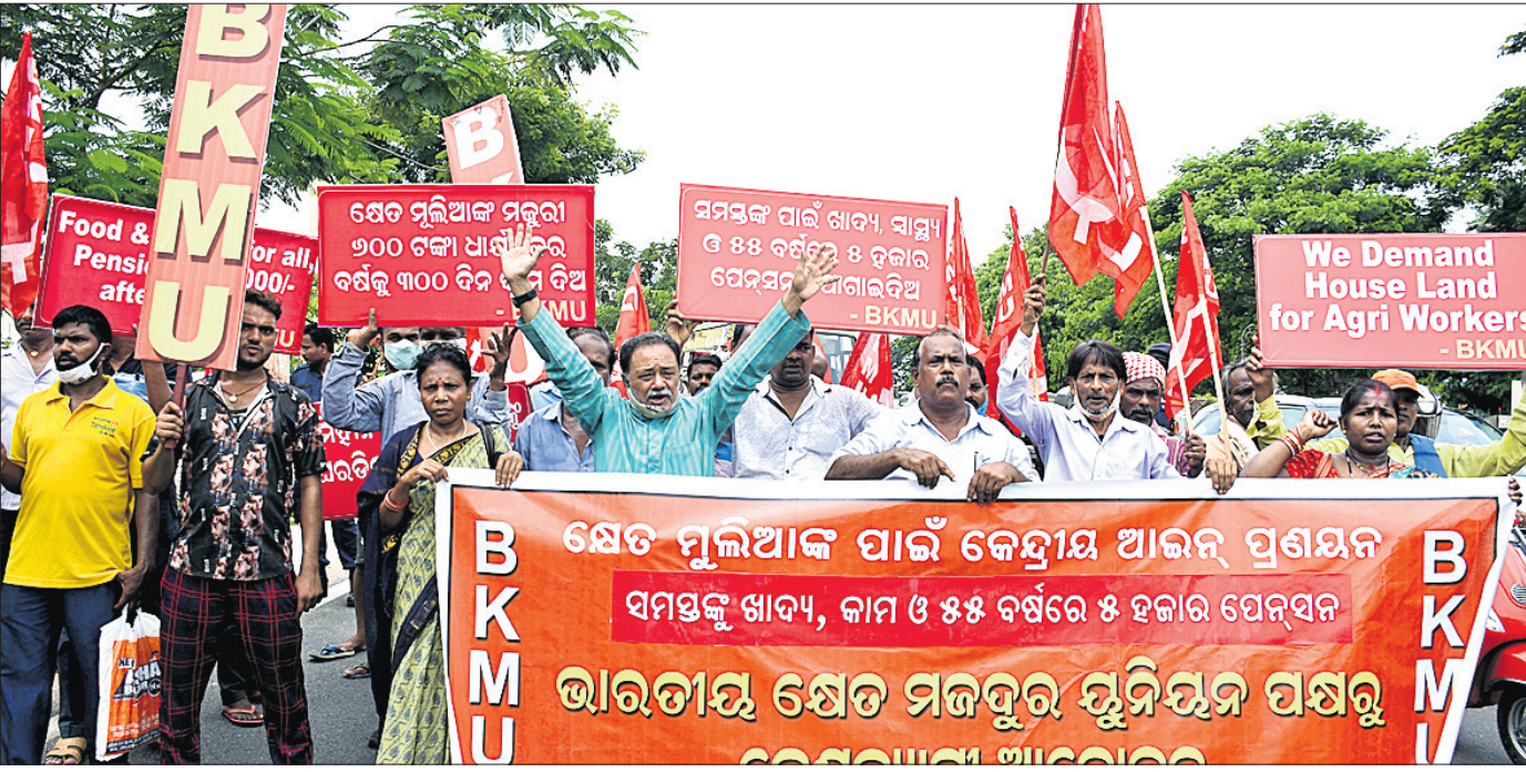
ଶେତ ମୂଲିଆଙ୍କ ପାଇଁ କେନ୍ଦ୍ରୀୟ ଆଇନ ପ୍ରଣୟନ ସମ୍ପର୍କରେ ଭାରତୀୟ ଶେତ ମଜଦୁର ସଂଘର ପକ୍ଷରୁ ଭୁବନେଶ୍ୱର ମାଷ୍ଟରକ୍ୟାଣ୍ଟିନରେ ବିରୋଧ କରାଯାଇଛି ।