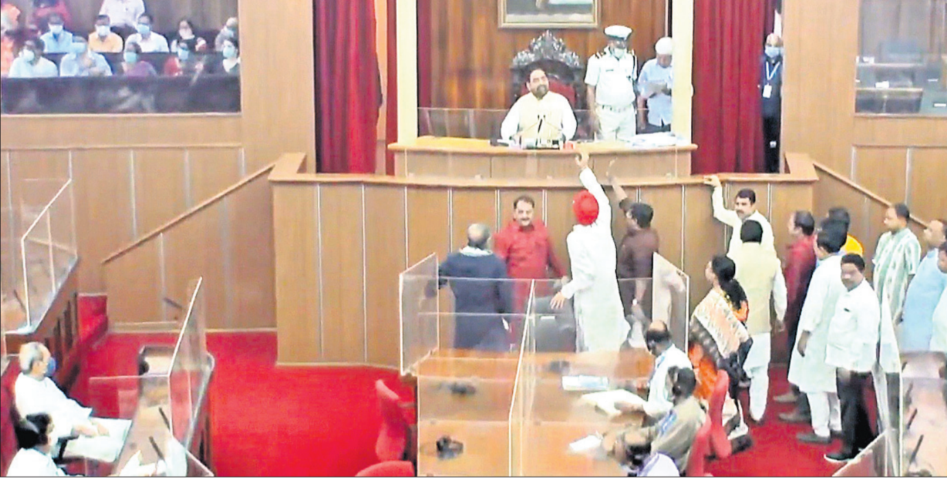
ବିଧାନସଭାରେ ସୋମବାର ମୃତ୍ୟୁ, ଚିତ୍ତଫଳ ପ୍ରସଙ୍ଗରେ ବିରୋଧୀ ଭାଜପା ଓ କଂଗ୍ରେସ ବିଧାୟକଙ୍କ ହତବଳତା ।