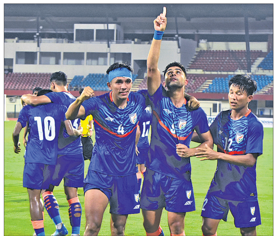
ଗୋଲ ଖୋର ପରେ ଖୁସି ମୁହଁରେ ଭାରତୀୟ ଖେଳାଳି।

ଭୁବନେଶ୍ୱର, ୨୮ (କ୍ରୀଡ଼ା ପ୍ରତିନିଧି) କଳିଙ୍ଗ ଷ୍ଟାଡ଼ିୟମରେ ଚାଲିଥିବା ୨୦ ବର୍ଷରୁ କମ୍ ବୟସ୍କ (ସାଉଥ ଏସିଆନ ଫୁଟବଲ ଫେଡେରେଶନ) ଫୁଟବଲ ଟୁର୍ନାମେଣ୍ଟର ଫାଇନାଲରେ ଭାରତ ପ୍ରବେଶ କରିଛି। ମଙ୍ଗଳବାର ଅନୁଷ୍ଠିତ ଶେଷ ଲିଗ୍ ମ୍ୟାଚରେ ଭାରତ ୧-୦ ଗୋଲରେ ମାଳଦିବା ପ୍ରଦୀପକୁ ପରାସ୍ତ କରି ଫାଇନାଲ ପାଇଁ ଟିକେଟ୍ ଜାରି କରିଛି। ତାହା ସଂପର୍କିତ ମ୍ୟାଚରେ କଡ଼ା ଚ୍ୟାଲେଞ୍ଜ ଦେଇଥିଲା ମାଳଦିବା।