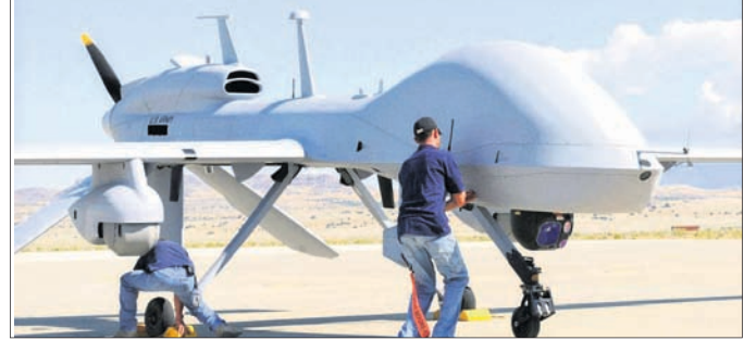
ଆକ୍ରମଣରେ ବ୍ୟବହୃତ ଡ୍ରୋନ୍।

ଆଲ୍-କାଏଦା ମୁଖ୍ୟ ଜଫ୍ଫାହିରିଙ୍କୁ ନିପାତ କରିବା ପାଇଁ ଆମେରିକା ଏକ ଡ୍ରୋନ୍‌ର ସହାୟତା ନେଇଥିଲା। ଉକ୍ତ ଡ୍ରୋନ୍‌ରେ ହେଲ୍‌ଫାୟାର ମିଶାଇଲ ଖଞ୍ଜାଯାଇଥିଲା। ଏହି କ୍ଷେପଣାସ୍ତ୍ର ଲକ୍ଷ୍ୟସ୍ଥଳକୁ ଭେଦ କରିଥାଏ। କିନ୍ତୁ ଚାଗେଟ୍ ବେଳେ କୌଣସି ବିଘ୍ନରଣ ଘଟି ନ ଥାଏ। ନିର୍ଦ୍ଦିଷ୍ଟ ଭାବେ ଯାହାକୁ ଚାଗେଟ୍ କରାଯାଇଥିବ ତାଙ୍କ ବ୍ୟତୀତ ଅନ୍ୟ କାହାରି କିଛି କ୍ଷତି ହୋଇ ନ ଥାଏ। ଆତକବାଦୀଙ୍କୁ ନିପାତ କରିବାରେ ଏହା ବିଶେଷ ସହାୟକ ହୋଇଥାଏ। ୫ ଫୁଟ ଲମ୍ବ ବିଶିଷ୍ଟ ଏହି ଆର୍ତ୍ତବ୍ୟକ୍ତ ମିଶାଇଲର ଓଜନ ୪୫ କେ.ଜି.।