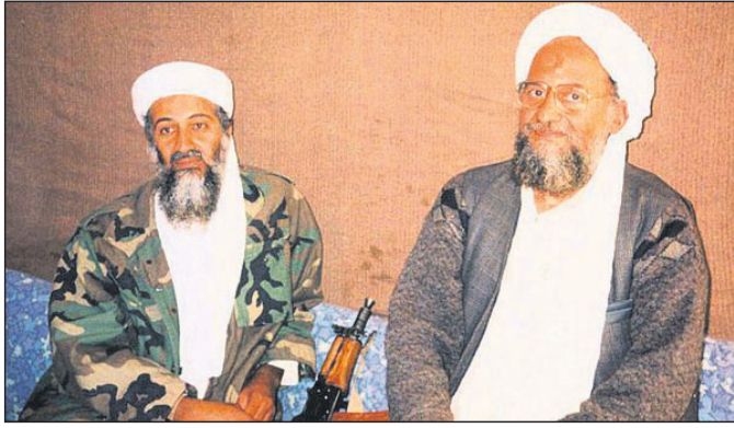
ଓଷାମା ବିନ୍ ଲାଡେନ୍‌ଙ୍କ ସହ ଅୟମନ ଆଲ୍-ଜଫ୍ଫାହିରି।