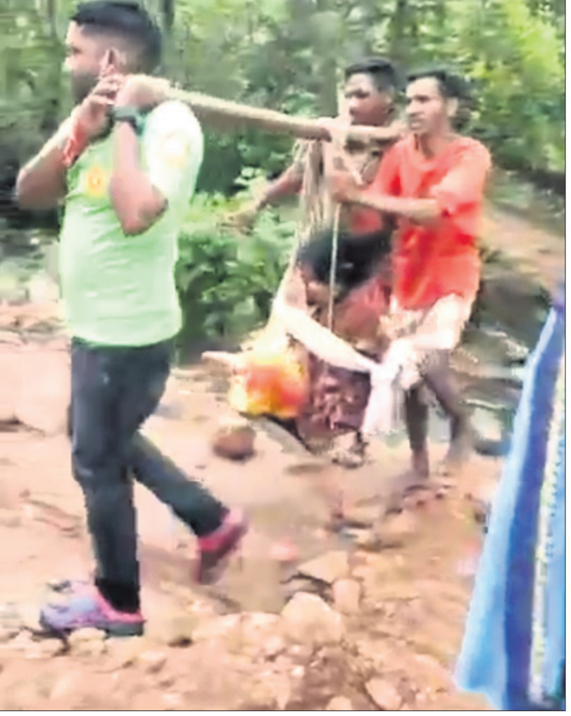
ଭାରରେ ଗର୍ଭବତୀଙ୍କୁ ନିଆଯାଇଛି।