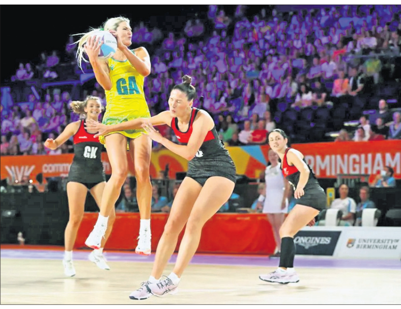
ମଙ୍ଗଳବାର ଅଷ୍ଟ୍ରେଲିଆ ଓ ଫ୍ରେଜ୍ ମଧ୍ୟରେ ଅନୁଷ୍ଠିତ ମହିଳା ନେଟ୍‌ବଲ୍ ମ୍ୟାଚ୍ । ମହିଳା ହେପ୍‌ଟାଥଲନ ଇଭେଣ୍ଟର ୧୦୦ ମିଟର ହର୍ଡ୍ଲ୍ ଅଧିକାରରେ ଇଲ୍‌ଉର କାଟାରିନା ଜନସନ-ଅମ୍‌ସନ ଓ ଅଷ୍ଟ୍ରେଲିଆର ଚାରିଲ କ୍ରାସେ।

ଶତପୁର ମନପ୍ରୀତ ଶତପୁର ମନପ୍ରୀତ କୌର ଫାଇନାଲରେ ପ୍ରଦେଶ କରିଛନ୍ତି। କ୍ୱାଲିଫିକେଶନ ଅଙ୍କ ୧୮ ମିଟର ହାସଲ ନ କରି ଯେଉଁ ୯ଜଣ ମହିଳା ଫାଇନାଲକୁ ଉନ୍ନତ ହୋଇଛନ୍ତି ସେମାନଙ୍କ ମଧ୍ୟରେ ସେ ଅନ୍ୟତମ। ଶ୍ରେଣୀ ୧୨ ପ୍ରଦର୍ଶନକାରୀଙ୍କ ମଧ୍ୟରେ ସେ ଯୋଗ୍ୟତା ଅର୍ଜନ କରିଥିଲେ। ୩୨ ବର୍ଷୀୟ କୌର ଗ୍ରୁପ୍ ବି କ୍ୱାଲିଫିକେଶନ ରାଉଣ୍ଡରେ ଏକ ଶ୍ରେଣୀ ଥିଲା ୧୬.୭୮ ମିଟର ସହ ତତ୍ତ୍ୱ ଏବଂ ଓଭରାଲ ୭ମ ସ୍ଥାନରେ ରହିଥିଲେ। ତାଙ୍କର ସିଜନ ଶ୍ରେଣୀ ୧୮.୦୬ ମିଟର ଏବଂ ବ୍ୟକ୍ତିଗତ ଶ୍ରେଣୀ ୧୮.୮୬ ମିଟର ରହିଛି।