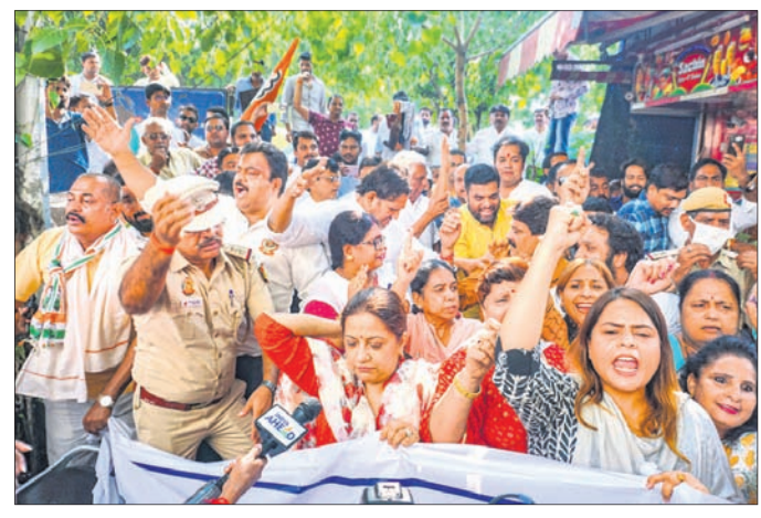
ଦିଲ୍ଲୀ ପ୍ରଦେଶ କଂଗ୍ରେସ କମିଟି ସଦସ୍ୟମାନେ ନ୍ୟାଶନାଲ ହେରାଲ୍ଡ ଅଧିକ ବାହାରେ ବିଶୋଭ କରୁଛନ୍ତି।

ସମ୍ପର୍କିତ ଜବତ କରିପାରେ ବୋଲି କେତେକ ସୂତ୍ରରୁ କୁହାଯାଇଛି। ଅନ୍ୟପକ୍ଷରେ ଇଡି ଚଢ଼ାଉ ପ୍ରତିବାଦରେ ନ୍ୟାଶନାଲ ହେରାଲ୍ଡ ଅଧିକ ବାହାରେ ବହୁସଂଖ୍ୟାରେ କଂଗ୍ରେସ କର୍ମୀ ଏକାଠି ହୋଇ ବିଶୋଭ ପ୍ରଦର୍ଶନ କରିଛନ୍ତି। ସେମାନେ ପ୍ଲକାର୍ଡ ଧରି ସରକାରଙ୍କ ବିରୋଧରେ ସ୍ଲୋଗାନ ଦେଉଥିବା ଦେଖାଯାଇଛି। ମୁଦ୍ରାକ୍ଷତି, ବେରୋଜଗାରିଆ ଆଦି ଗୁରୁତ୍ଵପୂର୍ଣ୍ଣ ପ୍ରସଙ୍ଗରେ ବିରୋଧୀ ଦଳ ପ୍ରଶ୍ନର ଉତ୍ତର ଦେଇପାରୁ ନ ଥିବା କେନ୍ଦ୍ର ସରକାର ଏଭଳି କେତେ ଚଢ଼ାଉ କରି ପ୍ରଶ୍ନ କରୁଥିବା ବ୍ୟକ୍ତିଙ୍କୁ ଅପମାନିତ ଓ