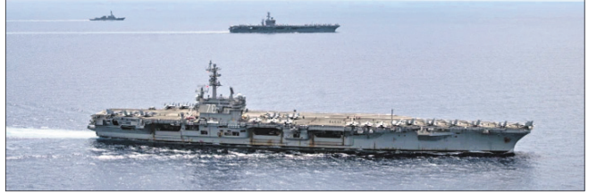
ଡ୍ରାଗିଂଟନ୍, ୨୮: ତାଇନା ପକ୍ଷରୁ କୌଣସି ସାମରିକ କାର୍ଯ୍ୟାନୁଷ୍ଠାନ ଆଶଙ୍କାରେ ଆମେରିକା ନୌସେନା ସତର୍କ ରହିଛି। ଆମେରିକା ପୂର୍ବ ତାଇଫ୍ଟାନରେ ୪ ଯୁଦ୍ଧପୋତ ମୁତୟନ କରିଛି। ଏୟାରକ୍ରାଫ୍ଟ କ୍ୟାରିୟର ଯୁଏସ୍‌ଏସ୍ ରୋଗାଲ୍ ରେଗାନ୍ ସାଧାରଣ ଲୋକଙ୍କ ଭୁଲିକାର ରୁଦ୍ଧକୁ ତାଇଫ୍ଟାନ ବୁଝିଛି। ତେଣୁ ସେଠାକାର ଲୋକଙ୍କୁ ତାଇପେଇ ଯୁଦ୍ଧକୌଶଳ ତାଲିମ ପ୍ରଦାନ କରାଯାଇଛି।

ପକ୍ଷରେ ତାଇନାର ହାତ ଥିବା କୁହାଯାଇଛି। କିଛି ସମୟ ପାଇଁ ରାଷ୍ଟ୍ରପତି କାର୍ଯ୍ୟାଳୟ ଡ୍ଵେର୍ସାଲଟ୍ କାମ କରିବା ବନ୍ଦ କରିଦେଇଥିଲା। ପରେ ତାହାକୁ ସ୍ଵାଭାବିକ କରାଯାଇଥିବା ଜଣାପଡ଼ିଛି।