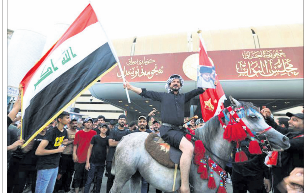
ଭରାଟ୍ ସମର୍ଥକ ଭାରତ ପ୍ରଧାନମନ୍ତ୍ରୀ ପ୍ରୀୟଙ୍କା ବିରୋଧ କରି ଲୋକପ୍ରିୟ ନେତା ମୁକ୍ତଦା ଅଲ୍-ସଦରକ୍ ସମର୍ଥକମାନେ ବାଗଦାସ୍ତ୍ରୀତ ପାଲିମେଖ ବାହାରେ ବିଖୋଇ କରୁଛନ୍ତି।

ସ୍ଵାସ୍ଥ୍ୟମନ୍ତ୍ରୀ ମନ୍ମୋହନ ରାଜ୍ୟ ସଭାରେ ଏକ ପ୍ରଶ୍ନର ଉତ୍ତର ଦେଇ କହିଛନ୍ତି। ୮ ମାମଲା ମଧ୍ୟରୁ ୫ ଜଣ ବିଦେଶ ଭ୍ରମଣରେ ଯାଇଥିଲେ। ଦିଲ୍ଲୀରେ ତିନି ଜଣ ୩୫ ବର୍ଷୀୟ ବିଦେଶୀ ମଙ୍ଗଳବାର ନିଦାନ ଓ ଚିକିତ୍ସା ବିକାଶ ଲାଗି ଜାତୀୟ ଚାଷ୍ଟ୍ରୋପାର୍ଯ୍ୟ ଗଠନ କରାଯାଇଥିବା କେନ୍ଦ୍ର ତେବେ ସେ ନିକଟରେ ବିଦେଶ ଭ୍ରମଣରେ