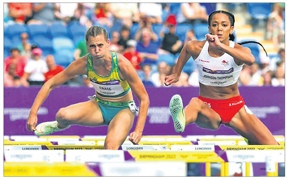
ମଙ୍ଗଳବାର ଅଷ୍ଟ୍ରେଲିଆ ଓ ଫ୍ରେଜ୍ ମଧ୍ୟରେ ଅନୁଷ୍ଠିତ ମହିଳା ନେଟ୍‌ବଲ୍ ମ୍ୟାଚ୍ । ମହିଳା ହେପ୍‌ଟାଥଲନ ଇଭେଣ୍ଟର ୧୦୦ ମିଟର ହର୍ଡ୍ଲ୍ ଅଧିକାରରେ ଇଲ୍‌ଉର କାଟାରିନା ଜନସନ-ଅମ୍‌ସନ ଓ ଅଷ୍ଟ୍ରେଲିଆର ଚାରିଲ କ୍ରାସେ।