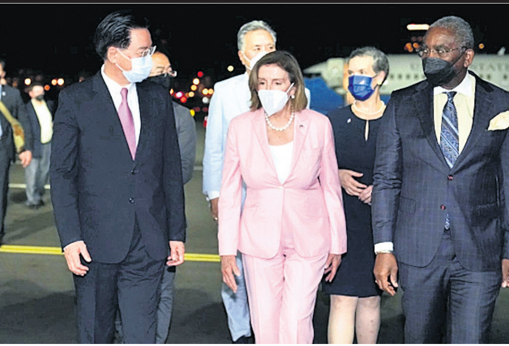
ତାଇପେଇରେ ପହଞ୍ଚିବା ପରେ ନାଡ଼ି ପେଲୋସିଙ୍କୁ ସାଗର କରୁଛନ୍ତି ତାଇଫ୍ଟାନ ବହିର୍ଦ୍ଦାୟା ପମ୍ପା କୋସେପ୍ (ଘାମ)।

ବୋଲି ସେ ଲେଖିଛନ୍ତି। ତାଇଫ୍ଟାନ ସହ ଆଲୋଚନା ଭରସା ରାଷ୍ଟ୍ରର ସହଭାଗିତାକୁ ସିଦ୍ଧାନ୍ତରେ ପହଞ୍ଚିଥିଲେ। ପରେ ପ୍ରତିନିଧି ଦଳ ସହ ନାଡ଼ି ମାଲେସିଆ ଯାଇଥିଲେ। ମାଲେସିଆ ଏୟାର ପୋର୍ଟ ବେସରୁ ସେ ତାଇଫ୍ଟାନ ଅଭିଯୁକ୍ତ ବାହାରିଥିଲେ। ତାଇପେଇରେ ପହଞ୍ଚିବା ପରେ ତାଇଫ୍ଟାନର ମୁଖ୍ୟମାନ ନାଡ଼ିକୁ ଏକୃତ ପ୍ରଦାନ କରିଥିଲେ। ପରେ ନାଡ଼ି ଏ ନେଇ ଏକ ରୁଲ୍ କରିଥିଲେ। 'ଆମ ପ୍ରତିନିଧିକ ତାଇଫ୍ଟାନ ଗସ୍ତ ଏହି ଦ୍ଵୀପରାଷ୍ଟ୍ରର ଗଣତନ୍ତ୍ର ପ୍ରତି ଆମେରିକାର ସମର୍ଥନ ପ୍ରତୀକ୍ଷାକୁ ଦର୍ଶାଉଛି' ବୋଲି ସେ ଲେଖିଛନ୍ତି। ତାଇଫ୍ଟାନ ସହ ଆଲୋଚନା ଭରସା ରାଷ୍ଟ୍ରର ସହଭାଗିତାକୁ ସିଦ୍ଧାନ୍ତରେ ପହଞ୍ଚିଥିଲେ। ପରେ ପ୍ରତିନିଧି ଦଳ ସହ ନାଡ଼ି ମାଲେସିଆ ଯାଇଥିଲେ। ମାଲେସିଆ ଏୟାର ପୋର୍ଟ ବେସରୁ ସେ ତାଇଫ୍ଟାନ ଅଭିଯୁକ୍ତ ବାହାରିଥିଲେ। ତାଇପେଇରେ ପହଞ୍ଚିବା ପରେ ତାଇଫ୍ଟାନର ମୁଖ୍ୟମାନ ନାଡ଼ିକୁ ଏକୃତ ପ୍ରଦାନ କରିଥିଲେ। ପରେ ନାଡ଼ି ଏ ନେଇ ଏକ ରୁଲ୍ କରିଥିଲେ। 'ଆମ ପ୍ରତିନିଧିକ ତାଇଫ୍ଟାନ ଗସ୍ତ ଏହି ଦ୍ଵୀପରାଷ୍ଟ୍ରର ଗଣତନ୍ତ୍ର ପ୍ରତି ଆମେରିକାର ସମର୍ଥନ ପ୍ରତୀକ୍ଷାକୁ ଦର୍ଶାଉଛି'