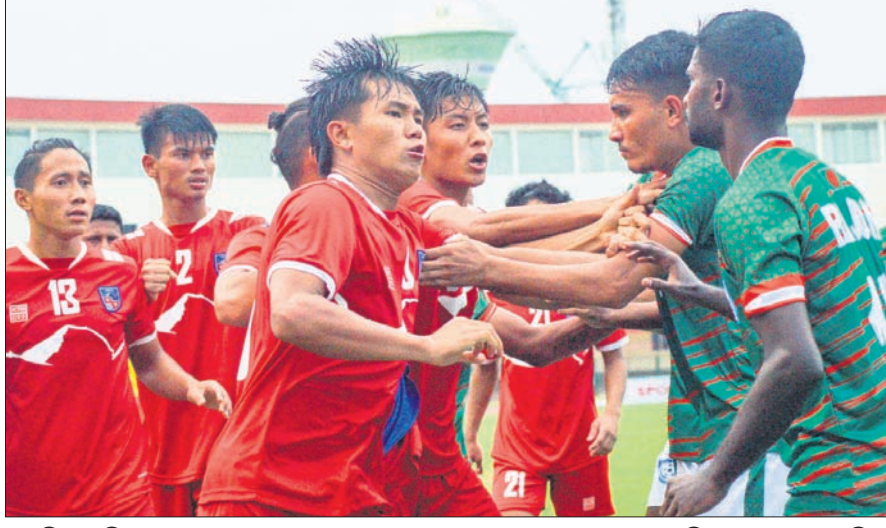
କଳିଙ୍ଗ ଷ୍ଟାଡ଼ିୟମରେ ମଙ୍ଗଳବାର ମ୍ୟାଚ ଅବସରରେ ନେପାଳ ଓ ବାଂଲାଦେଶ ଖେଳାଳିଙ୍କ ମଧ୍ୟରେ ଯଥାଧିକ୍ଷି।