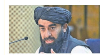
-କାବିହୁଲା ମୁଜାହିଦ, ତାଲିବାନ ମୁଖପତ୍ର

ଓଷ୍ଟିନରୁ ପକ୍ଷରୁ ଡ୍ରୋନ୍ କରିଆରେ ଏହି ଆକ୍ରମଣ ଅନ୍ତର୍ଜାତୀୟ ସିଦ୍ଧାନ୍ତର ଉଲ୍ଲଂଘନ। ଏହା ହେଉଛି ଆମେରିକାର ବିଗତ ୨୦ ବର୍ଷ ବିଫଳ ଅଭିଯୋଗର ପୁନରାବୃତ୍ତି।