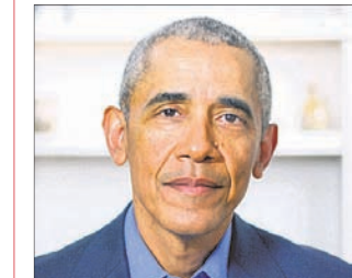
-ବାରାକ ଓଷାମା, ଆମେରିକାର ପୂର୍ବତନ ରାଷ୍ଟ୍ରପତି

କିମ୍ବା ସୁରକ୍ଷା ଆତଙ୍କବାଦର ଅନ୍ତ ଘଟାଯାଇପାରେ। ଆଲ୍-ଜଫାରିଙ୍କ ମୃତ୍ୟୁ ହେଉଛି ଏହାର ବଳିଷ୍ଠ ପ୍ରମାଣ। ୯/୧୧ ଆକ୍ରମଣକାରୀଙ୍କୁ ଉଚିତ ଜବାବ ଦେଇଥିବା ବାଉଡେନ୍ ପ୍ରଶଂସନର ଏହି ଅପରେଶନ ପ୍ରଶଂସନୀୟ।