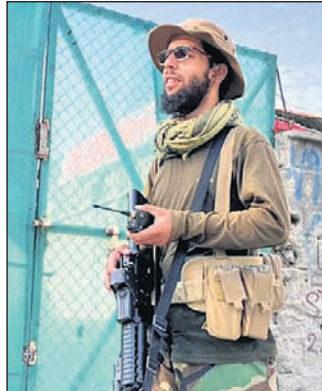
ନିହତ ଆଲ୍-ଜଫାରି ଆଶ୍ରୟ ନେଇଥିବା କାକୁଲର ଏକ ଘର ବାହାରେ ତାଲିବାନ ଫାଇଟରଙ୍କ କଡ଼ା ପ୍ରହର।

ଜଫାରିଙ୍କ ମୃତ୍ୟୁ ପରେ ଆଲ୍-କାଏଦାର ପରବର୍ତ୍ତୀ ମୁଖ୍ୟ କିଏ ହେବେ ତାକୁ ନେଇ ଆତଙ୍କବାଦୀ ସଙ୍ଗଠନ ଭିତରେ ବିଚାର ବିମର୍ଶ ଆରମ୍ଭ ହୋଇଛି। ବରିଷ୍ଠତା ଦୃଷ୍ଟିରୁ ସିଫ୍ ଆଲ୍-ଆଦେଲ, ଅବଦେଲ-ରହମାନ ଆଲ୍-ମାସୁଦି ଏବଂ ଯାକିନ୍ ମୋହାମ୍ମଦ୍ ମଧ୍ୟରୁ ଜଣଙ୍କୁ ଉତ୍ତରାଧିକାରୀ ରଖିନ କରାଯାଇପାରେ ବୋଲି କୁହାଯାଉଛି।