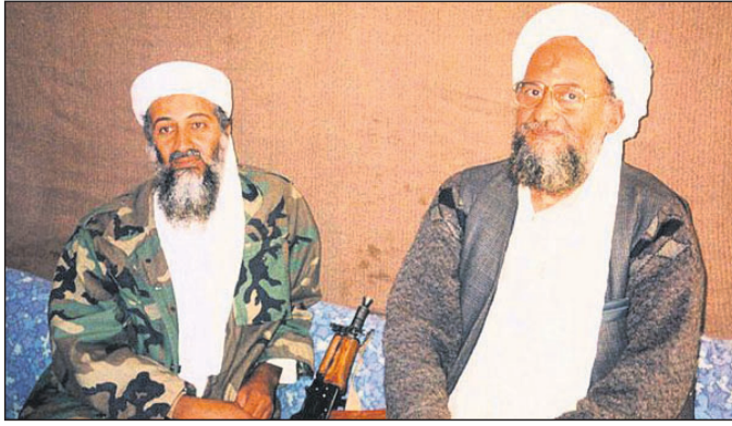
ଓଷାମା ବିନ୍ ଲାଡେନ୍‌ଙ୍କ ସହ ଅୟମନ ଆଲ୍-ଜଫାରି।