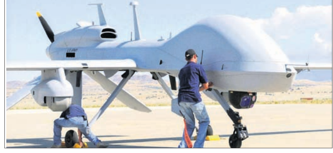
ଆକ୍ରମଣରେ ବ୍ୟବହୃତ ଡ୍ରୋନ୍।

ଆଲ୍-କାଏଦା ମୁଖ୍ୟ ଜଫାରିଙ୍କୁ ନିପାତ କରିବା ପାଇଁ ଆମେରିକା ଏକ ଡ୍ରୋନ୍‌ର ସହାୟତା ନେଇଥିଲା। ଉଚ୍ଚ ଡ୍ରୋନ୍‌ରେ ହେଲ୍‌ଫାୟର ମିଶାଇଲ ଖଞ୍ଜାଯାଇଥିଲା। ଏହି କ୍ଷେପଣାସ୍ତ୍ର ଲକ୍ଷ୍ୟସ୍ଥଳକୁ ଭେଦ କରିଥାଏ। କିନ୍ତୁ ଚାଗେଟ ବେଳେ କୌଣସି ବିଘ୍ନରଣ ଘଟି ନ ଥାଏ। ନିର୍ଦ୍ଦିଷ୍ଟ ଭାବେ ଯାହାକୁ ଚାଗେଟ କରାଯାଇଥିବା ତାଙ୍କ ବ୍ୟତୀତ ଅନ୍ୟ କାହାରି କିଛି କ୍ଷତି ହୋଇ ନ ଥାଏ। ଆତଙ୍କବାଦୀଙ୍କୁ ନିପାତ କରିବାରେ ଏହା ବିଶେଷ ସହାୟକ ହୋଇଥିଲା। ୫ ଫୁଟ ଲମ୍ବ ବିଶିଷ୍ଟ ଏହି ଆର୍ତ୍ତବ୍ୟବ୍ତ ମିଶାଇଲର ଓଜନ ୪୫ କେ.ଜି.।