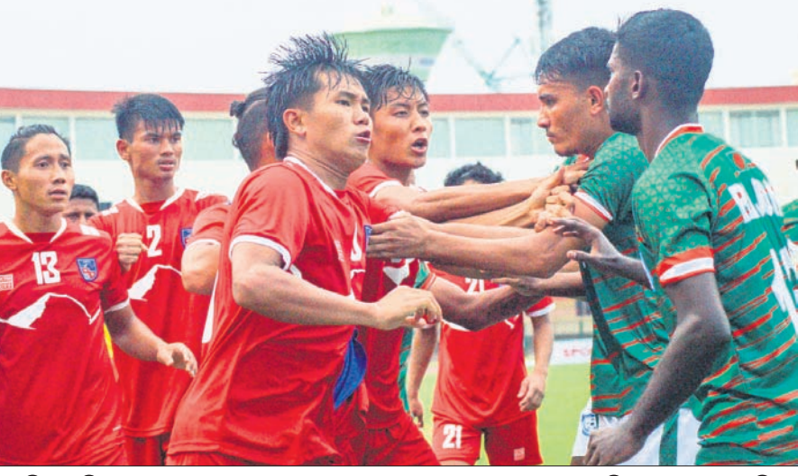
କଳିଙ୍ଗ ଷ୍ଟାଡ଼ିୟମରେ ମଙ୍ଗଳବାର ମ୍ୟାଚ ଅବସରରେ ନେପାଳ ଓ ବାଂଲାଦେଶ ଖେଳାଳିଙ୍କ ମଧ୍ୟରେ ଯଥାଧର୍ମ ।