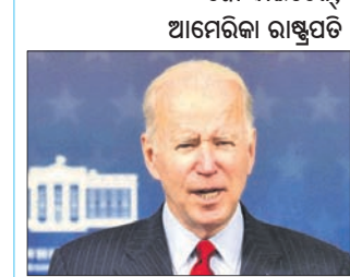
-ଜୋ ବାଇଡେନ୍, ଆମେରିକା ରାଷ୍ଟ୍ରପତି

ଆଲ୍-କାଏଦା ନେତା ଅୟମନ ଆଲ୍-ଜଫାରିଙ୍କ ହତ୍ୟା ଏକ ବଡ଼ ନ୍ୟାୟ, ଯାହାକୁ ଆମେରିକାୟମାନେ ଦୀର୍ଘ ବର୍ଷ ଧରି ଅପେକ୍ଷା କରିଥିଲେ। ଆଫଗାନିସ୍ତାନକୁ ପୁଣିଥରେ ଆତଙ୍କବାଦୀଙ୍କ ଭୂସର୍ଗ ହେବାକୁ କେବେ ବିଆସିବ ନାହିଁ।