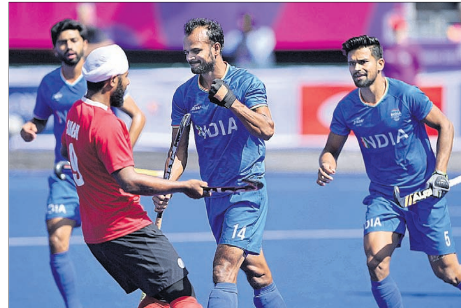
ରାଜ୍ୟଗୋଷ୍ଠୀ କ୍ରୀଡ଼ାରେ ରୁଧିର ଅନୁଷ୍ଠିତ ମ୍ୟାଚରେ ବିଜୟ ହାସଲପରେ ଉଲ୍ଲସିତ ଭାରତୀୟ ମହିଳା ଓ ପୁରୁଷ ହକି ଦଳର ଖେଳାଳି।