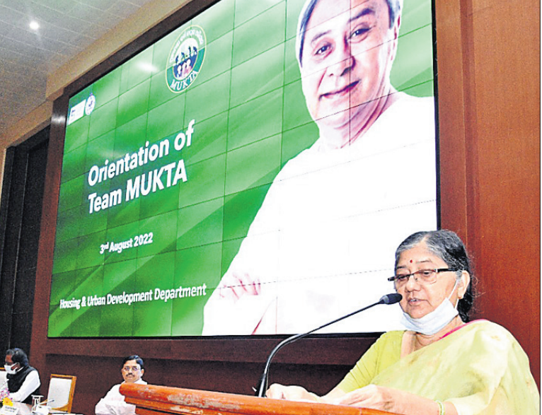
ଲୋକସେବା ଭବନ କନ୍ଠଭେନୁଗଡ଼ ହଲଠାରେ ରୁଧିରା ଗୃହ ନିର୍ମାଣ ଓ ନଗର ଉନ୍ନୟନ ମନ୍ତ୍ରୀ ଉଷା ଦେବୀ ମୁକ୍ତା କାର୍ଯ୍ୟକ୍ରମର ଶୁଭାରମ୍ଭ ଅବସରରେ ଉଦ୍ଘାଟନ ବେଳେ କହିଥିଲେ।