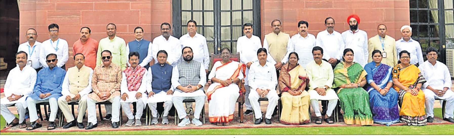
ରାଷ୍ଟ୍ରପତି ଭବନରେ ରୁପାୟନ ରାଷ୍ଟ୍ରପତି ଶ୍ରୀପତୀ ମୁର୍ମୁଙ୍କ ସହ ଓଡ଼ିଶାର ବାରଷତି ଓ ବିଧାନସଭା ନେତାମାନେ।

କର୍ମଚାରୀଙ୍କ ସହଜ ଭବିଷ୍ୟତ। ଭଦିରା ଓ ରାଜୀବ ଲିଙ୍ଗାୟତ ଦାମ୍ନା ନେଇଥିଲେ। ଏବେ ରାଜୁଲ ମଧ୍ୟ ଦାମ୍ନା ନେଇଛନ୍ତି। ସେ ମଧ୍ୟ ଦିନେ ଭାରତର ପ୍ରଧାନମନ୍ତ୍ରୀ ହେବେ। ଏହା ଶୁଣି ଶିବପୂର୍ଣ୍ଣି କହିଥିଲେ, ଏପରି କୁହନ୍ତୁ ନାହିଁ। ଏହା ଉପଯୁକ୍ତ ମଧ୍ୟ ନୁହେଁ। ଲୋକେ ନିଶ୍ଚିତ ନେବେ। ପ୍ରକାଶ ଯେ, କର୍ମଚାରୀଙ୍କ ଜନସଂଖ୍ୟାର ୧୭% ହେଉଛି ଲିଙ୍ଗାୟତ, ଯାହାକୁ ଭାଜପାର ପାରମ୍ପରିକ ଭାବେ ବିବେଚନା କରାଯାଏ।