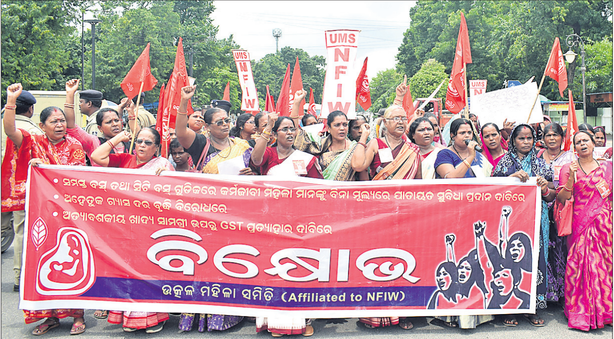
ଦରଦାମ ବୃଦ୍ଧିର ପ୍ରତିବାଦ, ଅତ୍ୟାଚାରୀୟ ଶାସନ ସାମଗ୍ରୀ ଉପରୁ ବିକ୍ଷୋଭ ପ୍ରଦର୍ଶନ, କର୍ମଚାରୀ ମହିଳାଙ୍କୁ ବିନା ମୂଲ୍ୟରେ ଯାତାୟତ ସୁବିଧା ପ୍ରଦାନ କରିବେ ଆଦି ବିନିମେଷ ରୂପକାର ଉତ୍ସାହୀ ସମିତି ପକ୍ଷରୁ ଭୁବନେଶ୍ୱର ମାଷ୍ଟରକ୍ୟାଣ୍ଟିନ ଛକରେ ବିକ୍ଷୋଭ ।