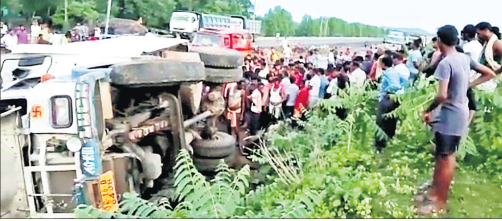
ଭାରସାମ୍ୟ ହରାଇ ଟ୍ରକ୍ ଓଲଟି ପଡ଼ିଛି।

ଧର୍ମଶାଳା/ଚଢ଼େଇଧରା, ୩୮୮ (ଡି.ଏନ.ଏ.): ଯାଜପୁର ଜିଲ୍ଲା ଜେନାପୁର ଥାନା ଅନ୍ତର୍ଗତ ୫୩ ନଂ. ଜାତୀୟ ରାଜପଥର ବରଡ଼ା ଛକ ନିକଟରେ ଗୁଧାବାର ଅପରାଧରେ ଏକ ବୁଝାପଞ୍ଚ ଘଟଣା ଘଟିଛି।