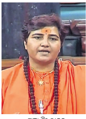
ପ୍ରଜ୍ଞା ସିଂ ଠାକୁର

୨୦୦୮ ମାଲେଗାଠି ବିଦ୍ଘୋରଣରେ ବ୍ୟବହୃତ ସ୍ମରଣ ଛୋପାଳ ଏମ୍ପି ପ୍ରଜ୍ଞା ସିଂ ଠାକୁରଙ୍କ ନାମରେ ପଞ୍ଜୀକୃତ ହୋଇଥିଲା।