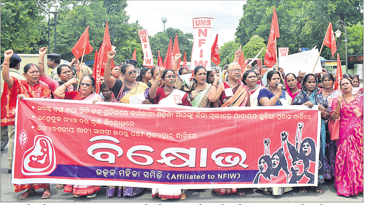
ଦରଦୀନ ବୃଦ୍ଧଙ୍କ ପ୍ରତିବାଦ, ଅତ୍ୟାଚାରଣ ଓ ଶାନ୍ତି ସମାପନ ଉପରୁ ବିପତ୍ତି ପ୍ରତ୍ୟାହାର, କର୍ମଚାରୀ ମହିଳାଙ୍କୁ ବିନା ମୂଲ୍ୟରେ ଯାତାୟତ ସୁବିଧା ପ୍ରଦାନ ଦାବିରେ ଆଦିବିନେଇ ବୁଧବାର ଉତ୍କଳ ମହିଳା ସମିତି ପକ୍ଷରୁ ଭୁବନେଶ୍ୱର ମାଷ୍ଟରକ୍ୟାମ୍ପରେ ଉଦ୍‌ଘାଟନ କରାଯାଇଥିବା ବିକ୍ଷୋଭ।