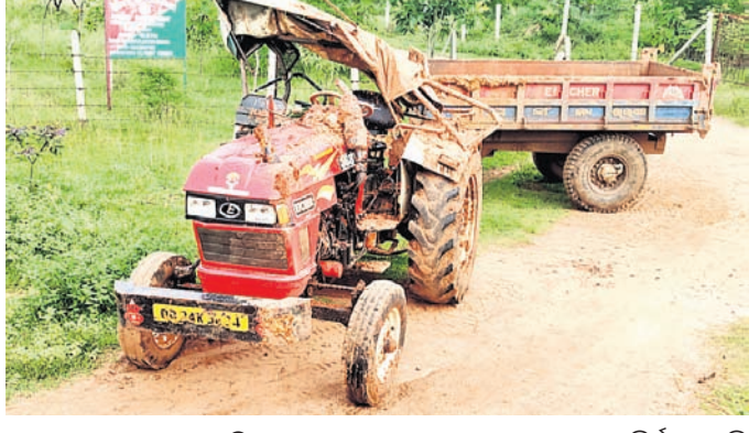
ଯାଜପୁର ରୋଡ଼, ୩୮୮ (ଡି.ଏନ.ଏ.)

ଯାଜପୁର ରୋଡ଼ ଥାନା ଅନ୍ତର୍ଗତ ଦରଦାମରେ ଜଗନ୍ନାଥ ମନ୍ଦିର ନିକଟରେ ମଙ୍ଗଳବାର ରାତିରେ ଗ୍ରାଙ୍କୁର ଓଲଟି ପଡ଼ିବାକୁ ଜଣେ ଚାଳକଙ୍କ ମୃତ୍ୟୁ ଘଟଣା ଘଟିଛି।