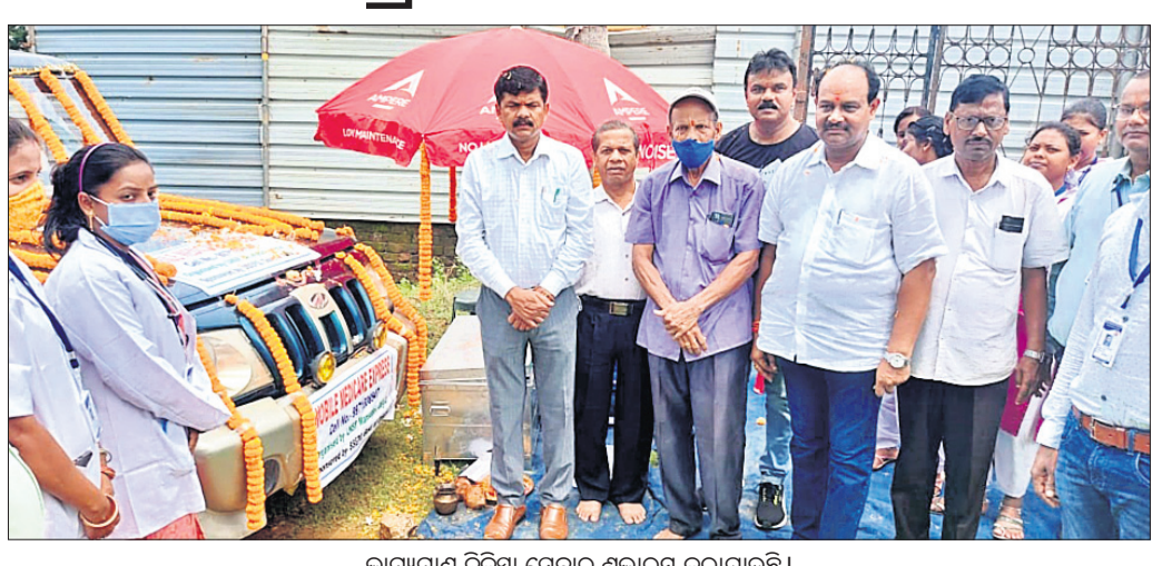
ଭ୍ରାମ୍ୟମାଣ ଚିକିତ୍ସା ସେବା ଶୁଭାରମ୍ଭ କରାଯାଇଛି।

ଯାଜପୁର ଚାଉଳ, ୩୮୮ (ଡି.ଏନ.ଏ.): ବରିଷ୍ଠ ନାଗରିକଙ୍କୁ ନିଷ୍କଣ୍ଡ ଭ୍ରାମ୍ୟମାଣ ଚିକିତ୍ସା ସୁବିଧା ଯୋଗାଇଦେବାକୁ ଏକ ଯୋଜନା ରାଜ୍ୟ ସରକାରଙ୍କ ସାମାଜିକ ସୁରକ୍ଷା ଓ ଭିକ୍ଷାମୁକ୍ତ ସମାଜକରଣ ବିଭାଗ ଦ୍ୱାରା ପରିଚାଳନା କରାଯାଇଛି।