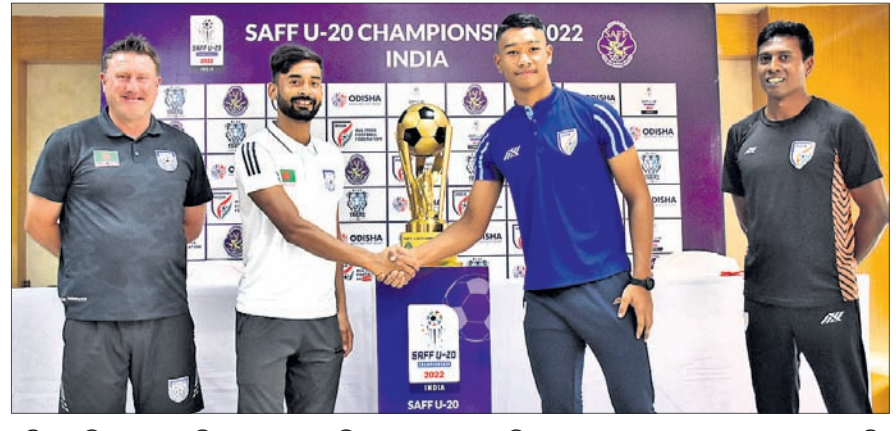
କଳିଙ୍ଗ ଷ୍ଟାଡ଼ିୟମରେ ଅନୁଷ୍ଠିତ ଖବରଦାତା ସମ୍ମିଳନୀ ଅବସରରେ ଟ୍ରଫି ସହ ଭାରତ ଓ ବାଂଲାଦେଶ କୋଚ୍ ଓ ଖେଳାଳି ।

ସେହି ରଣନୀତିରେ ନଜର ଆସି ନ ଥିଲା । ସେମାନେ ଖେଳରେ ଭିନ୍ନତା ଆଣିଛନ୍ତି । ତେଣୁ ଆମେ ସେହି ଅନୁସାରେ ପ୍ରସ୍ତୁତ ହୋଇଛୁ” ବୋଲି ସ୍ୱଳ୍ପ କହିଛନ୍ତି । ଭାରତୀୟ ଦଳର ଦୁର୍ବଳତା ଉପରେ ଆମର ନଜର ରହିଛି ବୋଲି ସେ ପ୍ରକାଶ କରିଛନ୍ତି ।