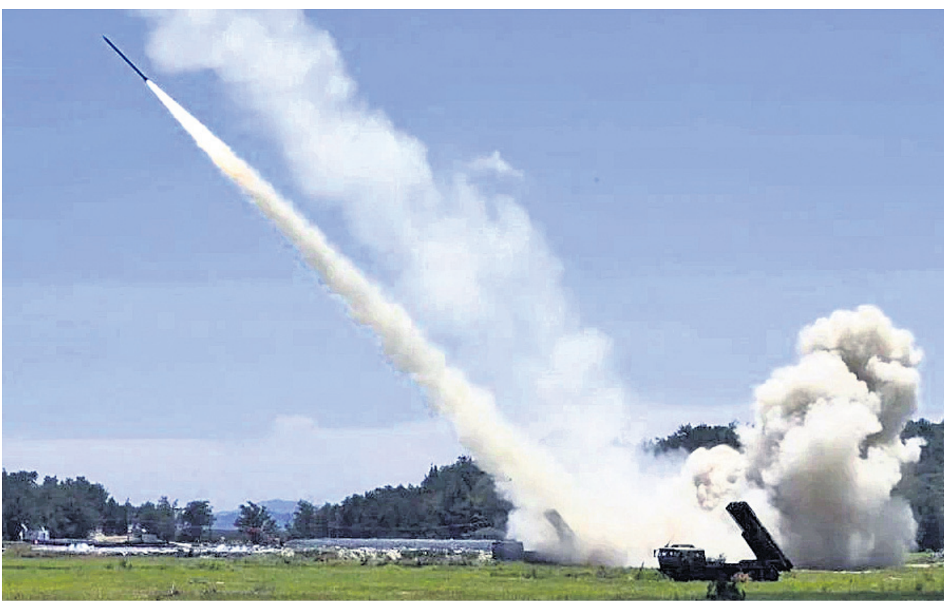
ପିଏଲ୍‌ଏଚ୍‌ର ଲକ୍ଷ୍ମଣ କମାଣ୍ଡ ଆଧାର ଗ୍ରାଉଣ୍ଡ ଫୋର୍ସ ଗୁରୁବାର ଚାଇଂନା ପ୍ରଶାସନରେ ଦୂରଗାମୀ କ୍ଷେପଣାସ୍ତ୍ର ପରୀକ୍ଷଣ କରୁଛି।