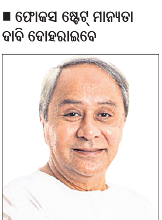
ନବୀନ ପଟ୍ଟନାୟକ ପ୍ରତିଶ୍ରୁତି ଦେଇ ଅଣଦେଖା କରିବାଲିଛି । ନୀତି ଆୟୋଗ ବୈଠକରେ ସେ ଏହାକୁ ପୁଣି ଥରେ ବୋଧହୋଇବେ । ଏଥିସହିତ

ଭୁବନେଶ୍ୱର, ୬।୮ (ବୁଧବୋ) ମୁଖ୍ୟମନ୍ତ୍ରୀ ନବୀନ ପଟ୍ଟନାୟକ ୩ ଦିନିଆ ନୂଆଦିଲ୍ଲୀ ଗସ୍ତରେ ଅଛନ୍ତି । ସେ ରବିବାର ପ୍ରଧାନମନ୍ତ୍ରୀ ନରେନ୍ଦ୍ର ମୋଦିଙ୍କ ଅଧିକାରୀରେ ଅନୁଷ୍ଠିତ ନୀତି ଆୟୋଗ ଗଭର୍ନିଂ କାଉନସିଲ ବୈଠକରେ ଯୋଗଦେବେ । ବୈଠକରେ ନବୀନ ଓଡ଼ିଶାକୁ ଫୋକସ ଷ୍ଟେଟ୍‌ସ ମାନ୍ୟତା, କୃଷି, ସ୍ୱାସ୍ଥ୍ୟ ସହ ରାଜ୍ୟ ସ୍ୱାର୍ଥ ସମ୍ବଳିତ ବିଭିନ୍ନ ପ୍ରସଙ୍ଗ ଉଠାଇବେ ବୋଲି ଜଣାପଡ଼ିଛି । ସ୍ୱତନ୍ତ୍ର ରାଜ୍ୟ ପାହ୍ୟା ବ୍ୟବସ୍ଥା ଉଲ୍ଲେଦ ହୋଇଛି । ଓଡ଼ିଶାକୁ ସ୍ୱତନ୍ତ୍ର ଫୋକସ ଷ୍ଟେଟ୍ ମାନ୍ୟତା ଦେବାକୁ ମୁଖ୍ୟମନ୍ତ୍ରୀ ଦାବି କରିବେ । ଦୀର୍ଘ ୨ ଦଶନ୍ଧି ଧରି କେନ୍ଦ୍ର ସରକାରଙ୍କ ନିକଟରେ ଓଡ଼ିଶା ଏହି ଦାବି କରିଆସୁଛି । ହେଲେ କେନ୍ଦ୍ର