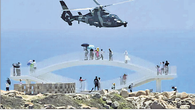
ତାଇଫ୍ଟାନ ନିକଟବର୍ତ୍ତୀ ପିଙ୍ଗ୍‌ତାନ୍ ଦ୍ଵୀପ ଉପରେ ଉଡ଼ୁଥିବା ତାଇନା ସାମାଗ୍ରିକ ହେଲିକପ୍ଟରକୁ ପର୍ଯ୍ୟଟକମାନେ ଦେଖୁଛନ୍ତି।

ତାଙ୍କ ରୁମ୍ ମଧ୍ୟରେ କେହି ପ୍ରବେଶ କରିଥିବାର ପ୍ରମାଣ ମିଳି ନ ଥିବା ସିଏନ୍ଏ ବିପୋର୍ଟରେ ପ୍ରକାଶ ପାଇଛି। ପୂର୍ବରୁ ସେ ହୃଦ୍‌ରୋଗରେ ପୀଡ଼ିତ ଥିଲେ ବୋଲି