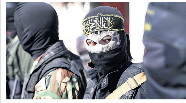
ତେଲ ଆଭିଭ୍, ୨୮

ଗତ ବର୍ଷ ଇସ୍ରାଏଲ ଏବଂ ଆତଙ୍କବାଦୀ ସମ୍ମୁଖୀନ ହମାସ୍ ସଦସ୍ୟଙ୍କ ମଧ୍ୟରେ ୧୧ ଦିନ ଧରି ସମାପରେ ସଂଘର୍ଷ ରହିବା ପରେ ଏବେ ୨ ଦିନ ହେଲା ପୁଣି ଅନୁରୂପ ସ୍ଥିତି ଉପୁଜିଛି। ଇରାନ ସମର୍ଥିତ ପାଲେଷ୍ଟାଇନ ଇସ୍ଲାମିକ୍ ଜେହାଦ୍ ଆତଙ୍କବାଦୀ ଗୋଷ୍ଠୀକୁ ଚାଲିଛି ଇସ୍ରାଏଲ ରକେଟ୍ ମାଡ଼ କରିବା ପରେ ଏହି ଚୁପ୍ ପାଇଁ ଆକ୍ରମଣ କରି ଶତାଧିକ ରକେଟ୍ ମାଡ଼ କରିଛି। ପାଲେଷ୍ଟାଇନରୁ ଆତଙ୍କବାଦୀ କାର୍ଯ୍ୟକଳାପ ଜାରି ରଖୁଥିବା ପ୍ରମୁଖ ସମ୍ମୁଖୀନ ହମାସ୍ ହୋଇଥିବାବେଳେ ଇସ୍ରାଏଲିକ୍ ଜେହାଦ୍ ଏହି ଗୋଷ୍ଠୀକୁ ଅନୁକରଣ କରିଥାଏ। ଇସ୍ରାଏଲିକ୍