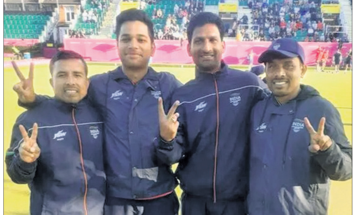
ଲନ୍ ବୋଲ୍‌ରେ ରୌପ୍ୟ ଜିତିଥିବା ଭାରତୀୟ ପୁରୁଷ ଦଳ।