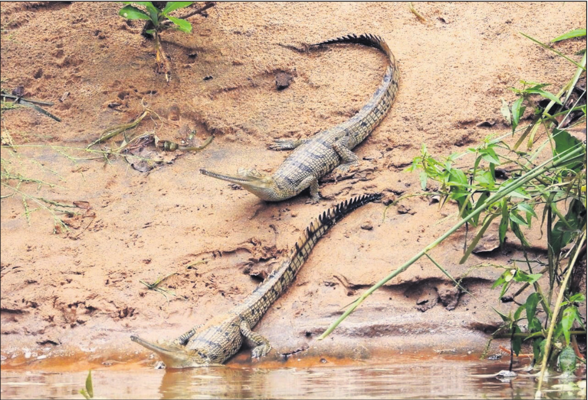
ଅନୁଗୋଳ ଜିଲାର ସାତକୋଶିଆ ଗଣ୍ଡରେ ୨ଟି ଘଡ଼ିଆଳ କୁମ୍ଭୀର ଶାବକ ବିଚରଣ କରୁଛନ୍ତି।

ଶନିବାର ରାତି ୧୦୦୦ ସୁଦ୍ଧା (+ ଅନ୍ୟ ରୋଗରେ କରୋନା ଆକ୍ରାନ୍ତ ମୃତ୍ୟୁ) ଓ ଅଧିକ: https://www.worldometers.info/coronavirus/ ଏବଂ ଡ଼ିଜିଟାଲ ସରକାର