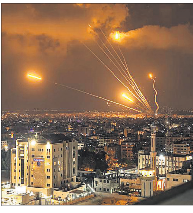
ପାଲେଷ୍ଟାଇନ ଆତଙ୍କବାଦୀମାନେ ଗାଜା ସିଟିକୁ ଇସ୍ରାଏଲର କେତେକ ସହରକୁ ଚାଲି ରକେଟ୍ ଛାଡ଼ୁଛନ୍ତି।

ଜିହାଦକୁ ଇରାନ ପକ୍ଷରୁ ଆର୍ଥିକ ଓ ସାମଗ୍ରିକ ସହାୟତା ମିଳିଥାଏ। ଅନ୍ତର୍ଜାତୀୟ ସ୍ତରରେ ପାଲେଷ୍ଟାଇନ ମାନ୍ୟତା ପାଇବା ପରେ ହମାସ୍ ୨୦୦୭ରେ ଗାଜା ପକ୍ଷୀ କରୁଥିଲା। ଇସ୍ରାଏଲକୁ ଚାଲିଛି କରିବା ପାଇଁ ଚାଲିବା ଦେବା ସହ ଅର୍ଥ ଏବଂ ଅସ୍ତ୍ରଶସ୍ତ୍ର ଯୋଗାଇଥାଏ। କେନ୍ଦ୍ରୀୟ ଇସ୍ରାଏଲିକ୍ ଜେହାଦ୍ ତେଲ ଆଭିଭ୍ରେ ମେଡ୍ରୋପଲିଟାନ୍ ଅଞ୍ଚଳରେ ଆକ୍ରମଣ କରିବା ପାଇଁ ଦୀର୍ଘ ଚେଷ୍ଟା ରକେଟ୍ ଇରାନ ଏହି ଆତଙ୍କବାଦୀ ସମ୍ମୁଖୀନ ଯୋଗାଇଛି। ଏହି ରକେଟ୍ ଯୋଗେ ଇସ୍ରାଏଲିକ୍ ଜେହାଦ୍ ଆକ୍ରମଣ ଯୋଜନା କରିଥିବା ଇସ୍ରାଏଲକୁ ଖବର ମିଳିବା ପରେ ସମ୍ପର୍କ ସଂଘର୍ଷ ଆରମ୍ଭ ହୋଇଛି।