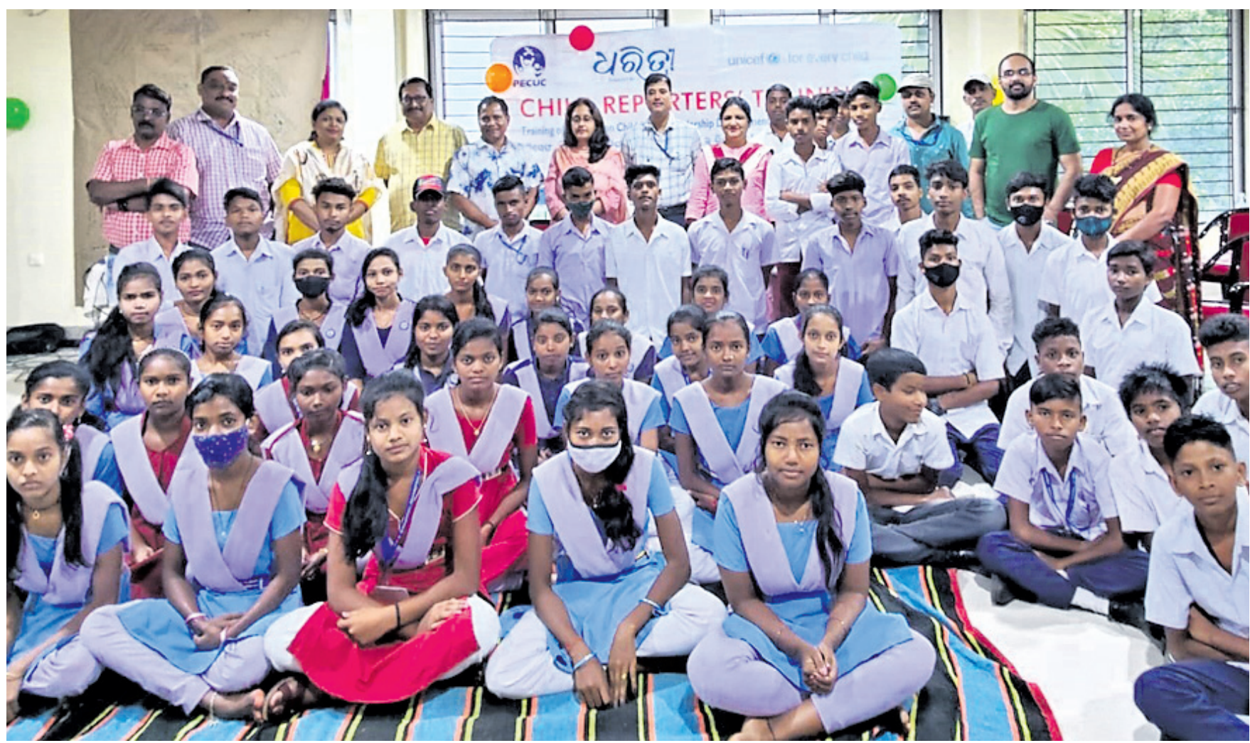
କର୍ମଶାଳାରେ ଛାତ୍ରାଛାତ୍ରଙ୍କ ରହଣରେ ଜିଲା ଶିଶୁ ସ୍ମରଣା ଅଧିକାରିଣୀ, ଧରଣୀ, ଯୁନିସେଫ୍ ଓ ପିକକର୍ କର୍ମକର୍ତ୍ତା।