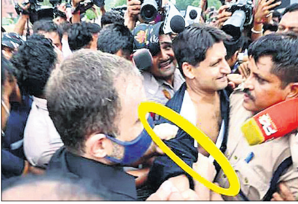
କଂଗ୍ରେସ ବିକ୍ଷୋଭ ଦେଇ ରାଷ୍ଟ୍ରଲ ଗାନ୍ଧୀ ଦାପେନ୍ଦ୍ରଙ୍କୁ ଶର୍ତ୍ତ ଧରିଥିବା ଫଟୋକୁ ଭାଙ୍ଗି ପକ୍ଷରୁ ଭାଙ୍ଗିବା କରାଯାଇଛି ।

ନୂଆଦିଲ୍ଲୀ, ୩୮: ଦରଦୀପ୍ ବୁଝି, ବେକାରୀ ଏବଂ ଜି-୯୫ ବିରୋଧରେ କଂଗ୍ରେସ ପକ୍ଷରୁ ଶୁକ୍ରବାର ଦେଖିବାପାଇଁ ବିକ୍ଷୋଭ ପ୍ରଦର୍ଶନ କରାଯାଇଥିଲା । ଏହି କ୍ରମରେ ନୂଆଦିଲ୍ଲୀରେ ଦକର ପୂର୍ବତନ ଅଧ୍ୟକ୍ଷ ରାଷ୍ଟ୍ରଲ ଗାନ୍ଧୀ ଏବଂ ରାଷ୍ଟ୍ରଲ ସାଧାରଣ ସମ୍ପାଦକ ପ୍ରଭାକର ଗାନ୍ଧୀ ଉପାଦାନ ସମେତ ବହୁ ନେତାଙ୍କୁ ଗିରଫ କରାଯାଇଥିଲା ।