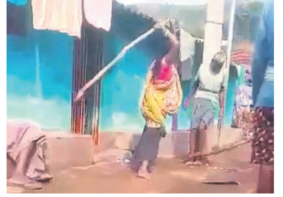
ବୃକ୍ଷକୁ ବିଦ୍ୟୁତ୍ ଖୁଣ୍ଟରେ ବାନ୍ଧି ଜଣେ ମହିଳା ପିଟୁଥିବା ସମୟର ଚିତ୍ର।