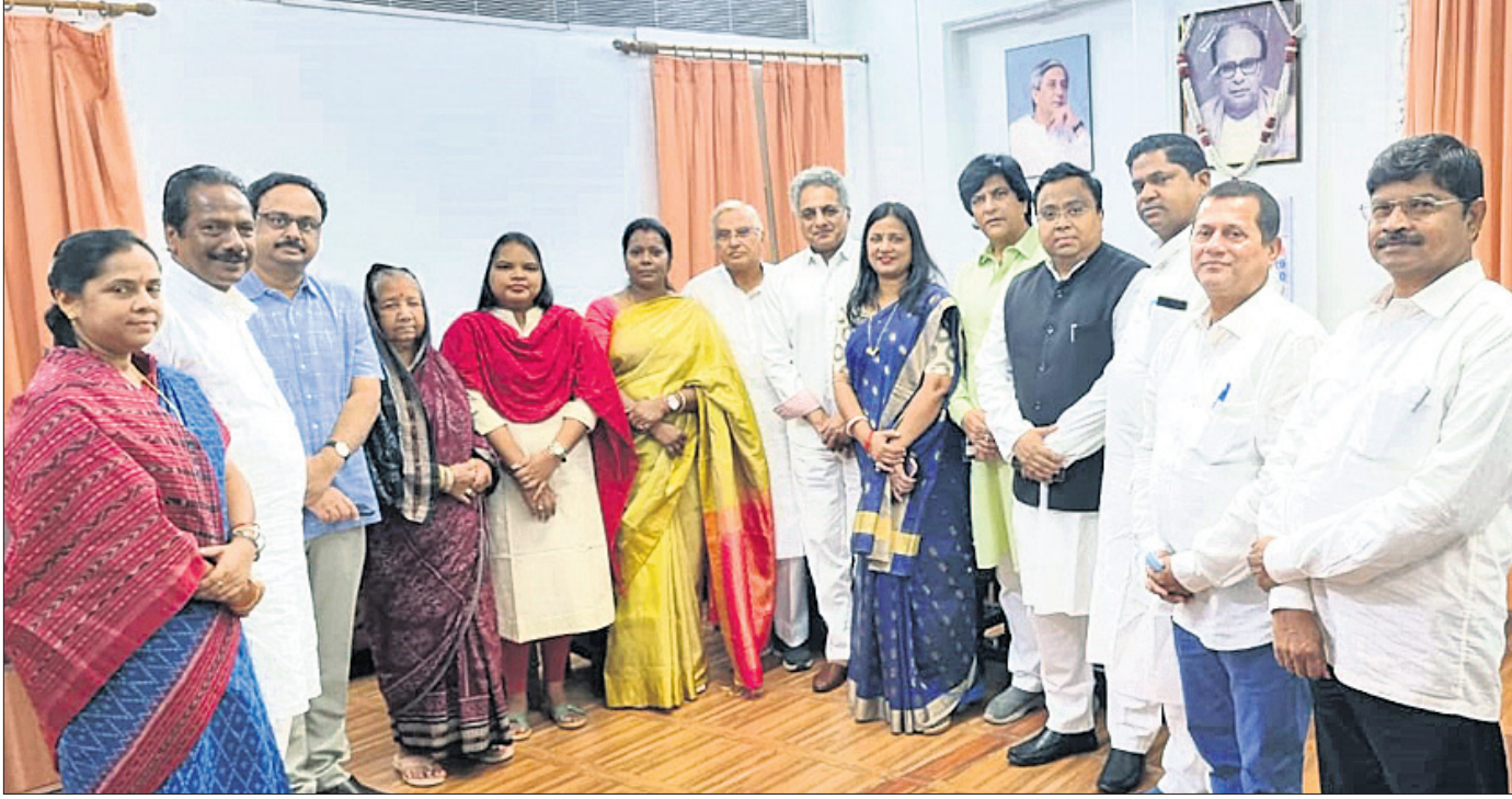
ନୂଆଦିଲ୍ଲୀରେ ଶନିବାର ଉପରାଷ୍ଟ୍ରପତି ପ୍ରାଥୀ ଜଗଦୀପ୍ ଧନକରଙ୍କୁ ଭୋଟ ଦେବା ପରେ ବିଜେଡି ଲୋକ ସଭା ଓ ରାଜ୍ୟ ସଭା ଏମ୍ପିମାନେ ।