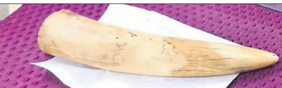
ଜବତ କଟା ହାତୀ ଦାନ୍ତ