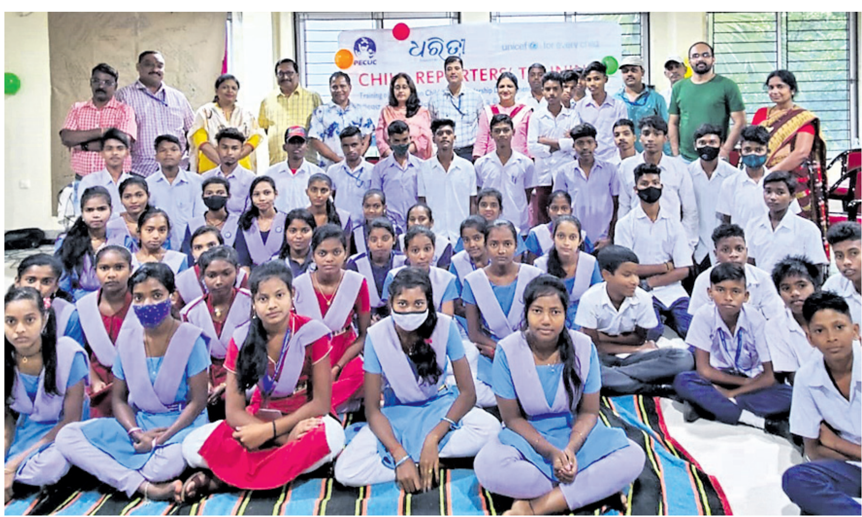
କର୍ମଶାଳାରେ ଛାତ୍ରାଛାତ୍ରଙ୍କୁ ଗହଣରେ ଜିଲା ଶିଶୁ ସ୍ମରଣା ଅଧିକାରୀ, ଧରଣୀ, ଯୁନିସେଫ୍ ଓ ପିକକର୍ କର୍ମକର୍ତ୍ତା।