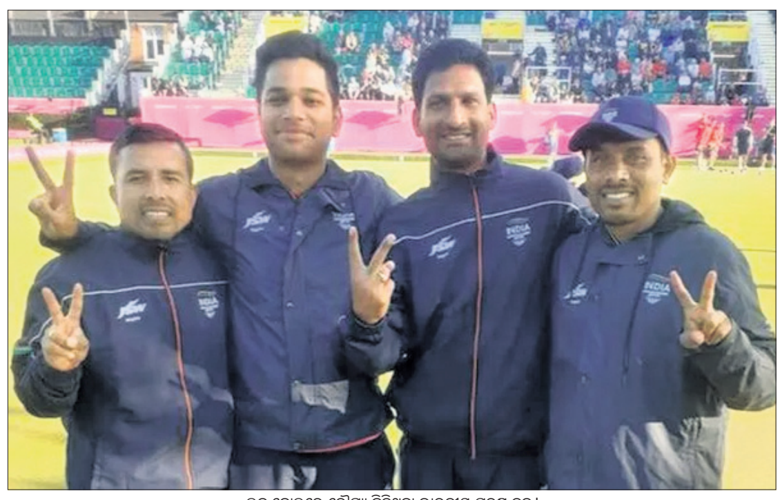
ଲନ୍ ବୋଲ୍ରେ ରୌପ୍ୟ ଜିତିଥିବା ଭାରତୀୟ ପୁରୁଷ ଦଳ।