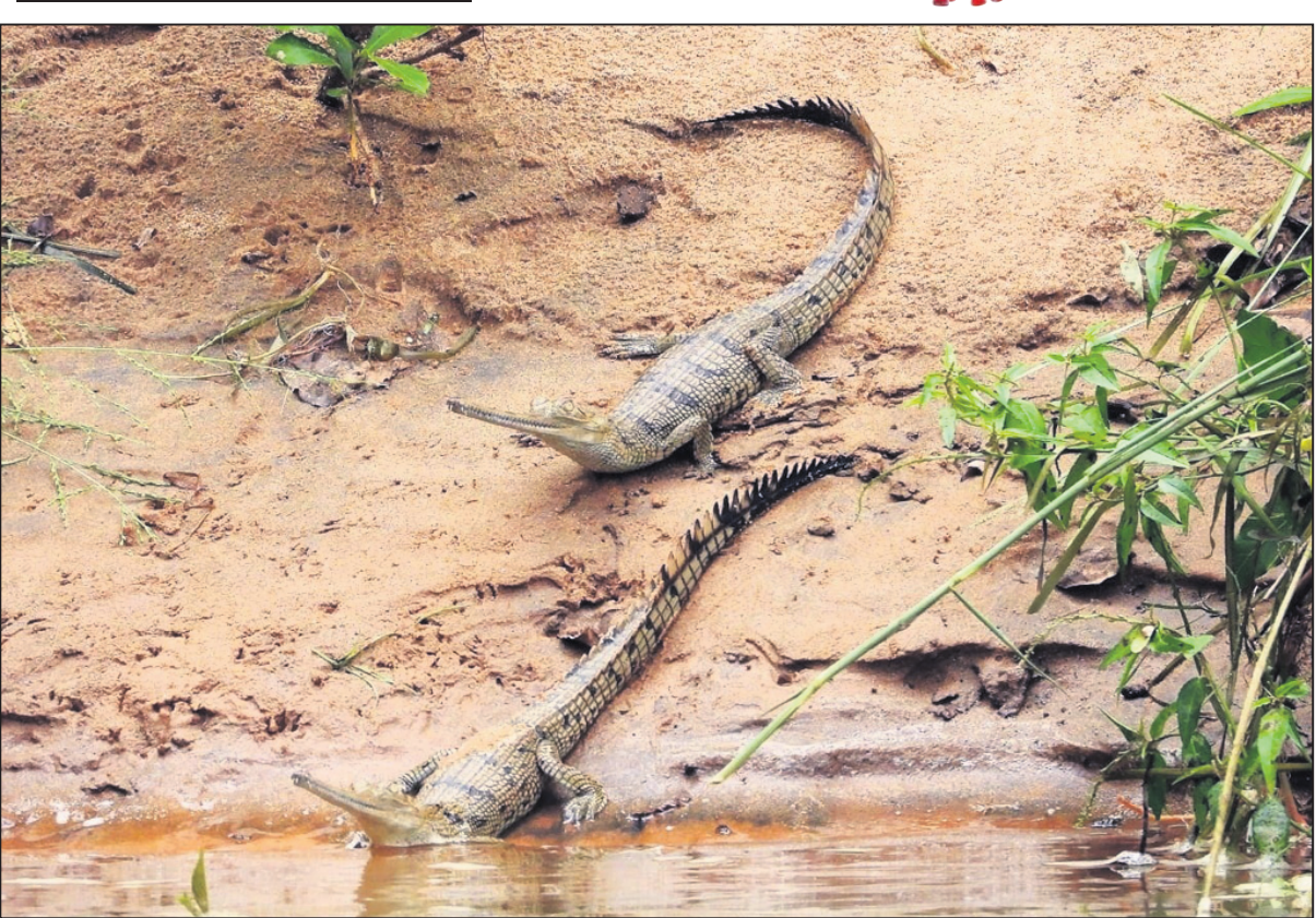
ଅନୁଗୋଳ ଜିଲାର ସାତକୋଣିଆ ଗଣ୍ଡରେ ୨ଟି ଘଡ଼ିଆଳ କୁମ୍ଭୀର ଶାବକ ବିଚରଣ କରୁଛନ୍ତି। (ଫଟୋ-ବୁଦ୍ଧ)

ମାମଲା ରୁକ୍ଷ ତଦନ୍ତ କରି ଉକ୍ତ ୪ ଅଭିଯୁକ୍ତଙ୍କୁ ଗିରଫ କରିଥିଲା। ଗାଁରେ ପୋଲିସ୍ ଯୋଗେ ମୁତୟନ ରହିଥିବା ସମୟରେ ଗିରଫ ଭୟରେ ଅନ୍ୟ ଅଭିଯୁକ୍ତମାନେ ଗ୍ରାମ ଛାଡି ଚାଲିଯାଇଛି।