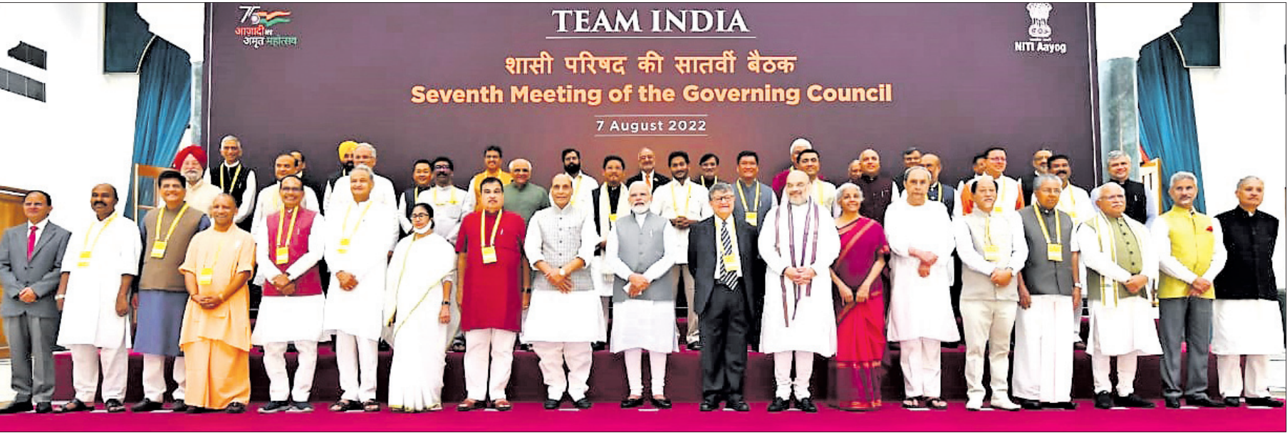
TEAM INDIA 75th Anniversary Meeting of the Governing Council 7 August 2022

ପରାବର: ଏହି ସ୍ତମ୍ଭଟି ବ୍ୟବହାର କରି ସମସ୍ତ ମାତ୍ରାରେ କର୍ତ୍ତବ୍ୟ ଶୁଭେଚ୍ଛା, ଧର୍ତ୍ତିତା, ବି-୨୬, ଉପହାସନ ଶୃଙ୍ଖଳ, ଭୁବନେଶ୍ୱର-୧୦ ଠିକଣାରେ ପଠାଯାଇ ପାରିବ।