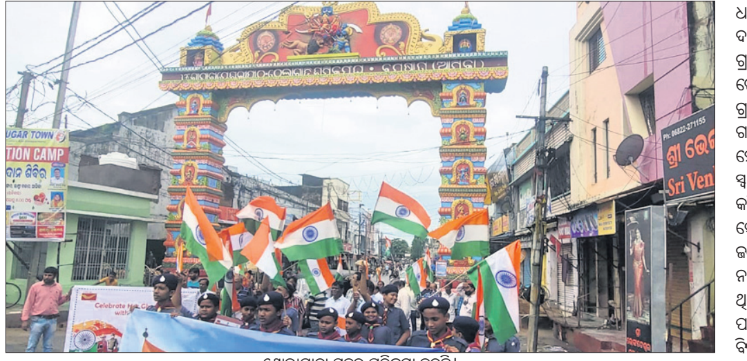
ଶୋଭାଯାତ୍ରା ସହର ପରିକ୍ରମା କରୁଛି। ଆସିକା, ୨୮୮ (ଡି.ଏନ୍.ଏ.): ଆସିକା ତାକମଣ୍ଡଳ ପକ୍ଷରୁ ଉଦ୍‌ଯୋଗ ଆସିକା ସହରରେ ଭ୍ରମଣ ଶୋଭାଯାତ୍ରା କରାଯାଇଥିଲା। ଶୋଭାଯାତ୍ରୀମାନେ ହରିହର ହାତୀମାନଙ୍କ ଦ୍ୱାରା ବ୍ୟାଚ୍ଚାରଣ କରାଯାଇଥିବା ଆସିକା ଅନୁଷ୍ଠାନରେ ପହଞ୍ଚିଥିଲେ।