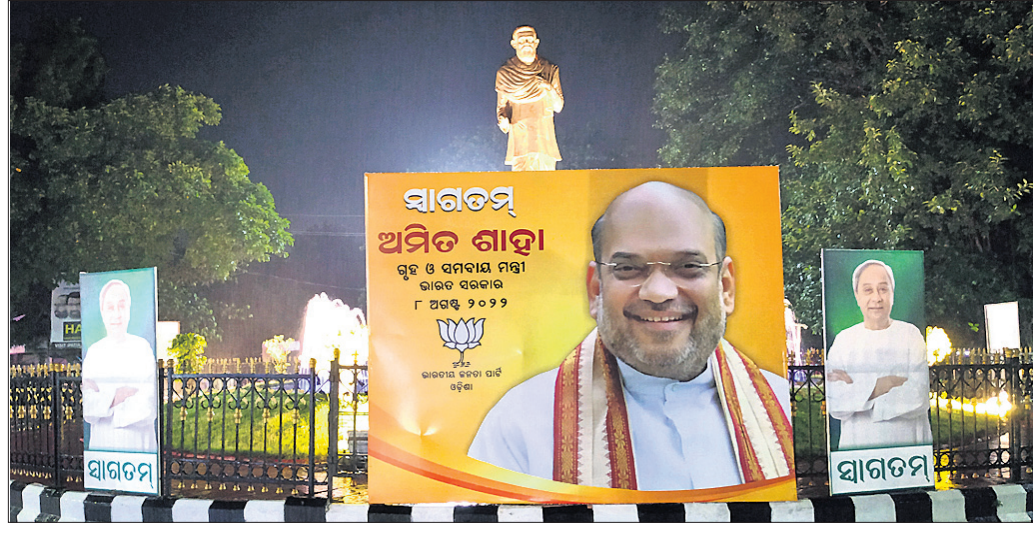
ଦଳୀୟ ନେତାଙ୍କୁ ସ୍ୱାଗତ କରିବା ପାଇଁ କଟକ ବାରବାଟୀ ସ୍ୱାତିୟମ ଛକ ଉତ୍କଳପଣି ଗୋପବନ୍ଧୁ ଦାସଙ୍କ ପ୍ରତିମୂର୍ତ୍ତି ସମ୍ମୁଖରେ ଲାଗିଥିବା କେନ୍ଦ୍ର ସରାଂସ ପନ୍ଥା ଅଧିକ ଶାହା ଓ ମୁଖ୍ୟମନ୍ତ୍ରୀ ନବୀନ ପଟ୍ଟନାୟକଙ୍କ ପୋଷ୍ଟର।

କେନ୍ଦ୍ର ସରାଂସ ପନ୍ଥା ଅଧିକ ଶାହାଙ୍କ ସୋମବାର କଟକ ଗସ୍ତକୁ ନେଇ ଭାଜପା କର୍ମୀମାନଙ୍କ ମଧ୍ୟରେ ବେଶ୍ ଉତ୍ସାହ ଦେଖାଦେଇଛି।