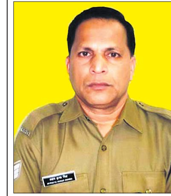
ସଦାନ ଅଧ୍ୟକ୍ଷ ମିଶ୍ର

ଘଟଣା ଘଟଣାରେ ଉପସ୍ଥିତ ଯୋଗ ଦେଇଥିବା କର୍ମଚାରୀମାନଙ୍କୁ ଏହା ସମ୍ବନ୍ଧରେ ଆହୁରି ଆଗାଧିଗାମୀ ପଦକ୍ଷେପ ଗ୍ରହଣ କରିବାକୁ ପରାମର୍ଶ ଦିଆଯାଇଥିଲା । ଏଥିରେ ଉପସ୍ଥିତ ଯୋଗ ଦେଇଥିବା କର୍ମଚାରୀମାନଙ୍କୁ ଏହା ସମ୍ବନ୍ଧରେ ଆହୁରି ଆଗାଧିଗାମୀ ପଦକ୍ଷେପ ଗ୍ରହଣ କରିବାକୁ ପରାମର୍ଶ ଦିଆଯାଇଥିଲା ।