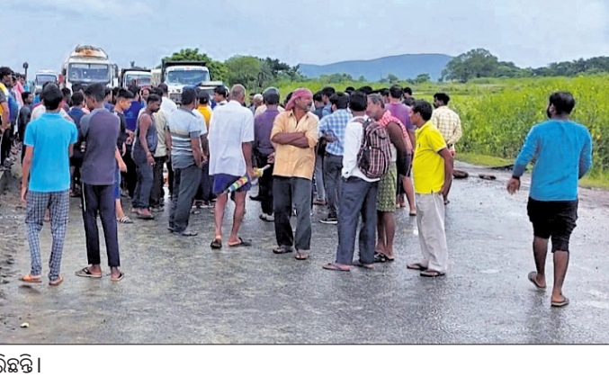
ଆରୁହା ଛକରେ ଲୋକେ ରାସ୍ତା ଅବରୋଧ କରିଛନ୍ତି।

ହତ୍ୟା ମାମଲା ରୁଜୁ ପରିବର୍ତ୍ତେ ଏକ ଅପମୃତ୍ୟୁ ମୃତ୍ୟୁ ମାମଲା ରୁଜୁ କରି ତଦତ୍ତ ଖବର ଦେଇଥିଲେ। ପୋଲିସ୍ ପହଞ୍ଚି ମୃତଦେହକୁ ଜବତ କରି ବ୍ୟବଚ୍ଛେଦ ପାଇଁ ପଠାଇବା ସହ ଏକ ଅପମୃତ୍ୟୁ ମାମଲା ରୁଜୁ କରିଥିଲା।