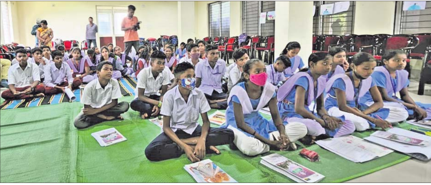
ସୁନିସେଫ୍, ଧରିତ୍ରୀ ଏବଂ ପିକ୍କି ମିଳିତ ସହଯୋଗରେ କେନ୍ଦ୍ରରେ ଆୟୋଜିତ ୩ ଦିନିଆ ଶିଶୁ ସାମ୍ବାଦିକତା ସମ୍ପର୍କିତ କର୍ମଶାଳା ଉଦ୍ଘାଟନା ଦିନକୁ ଗୋଟାଏ ନେଇଥିବା ଛାତ୍ରଛାତ୍ରୀମାନେ ।