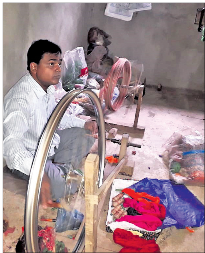
ଜଣେ ବୁଣାକାର ସୂତା କାଟୁଛନ୍ତି।

ଯାଜପୁର ଜିଲ୍ଲା ରଞ୍ଜିତପୁର ବ୍ଲକ ଅଧୀନ ପ୍ରଥମାଞ୍ଚଳ ପଞ୍ଚାୟତର ଗୋପାଳପୁର ଗାଁ ବୁଣାକାରବନ୍ଧୁଙ୍କ ଗାଁ ଅଟେ। ଏଠାରେ ୧୫୦୦ରୁ ଉର୍ଦ୍ଧ୍ୱ ବୁଣାକାର ବସ୍ୟାସ କରୁଛନ୍ତି। ବିଭିନ୍ନ ସମସ୍ୟା ଭିତରେ ଗତି କରୁଥିବା ଉଚ୍ଚ ବୁଣାକାର ସମ୍ପ୍ରଦାୟ ରବିବାର ୮ମ ଜାତୀୟ ବୁଣାକାର ଦିବସ ପାଳନ କରିଛନ୍ତି। ତେଣୁ ଦୂରଦୂରାନ୍ତ ବୁଣାକାର ଯୋଜନାକୁ ପ୍ରଶଫଳ କରିବାରେ ଗୋଟିଏ ନୂଆ ଅଧ୍ୟାୟ ଖୋଲିବାକୁ ନେଇ ବୁଣାକାର ସମ୍ପ୍ରଦାୟ ଆଶା ଆଶଙ୍କାରେ ରହିଛନ୍ତି। ତେଣୁ ବୁଣାକାରଙ୍କ କୌଳିକ ବୃତ୍ତିକୁ ବଞ୍ଚାଇବା ପାଇଁ ସରକାର ସେମାନଙ୍କ ଦାବିପୂର୍ଣ୍ଣ ଦିଗରେ ଗୁରୁତ୍ୱ ଦେବାକୁ ମତପ୍ରକାଶ ପାଇଛନ୍ତି। ଏବେ ବୁଣାକାର କୁଳ ବେତ୍ତଣକୁ ଭୁଲିବାକୁ ବସିଲେଣି। ତନ୍ମଧ୍ୟରେ ରୋଜଗାର ହାଣ୍ଡିଶାଳକୁ ସୁହାର ନ ଥିବାରୁ କୌଳିକ ବୃତ୍ତିରେ ତାଳା ପଡ଼ିବା ଆରମ୍ଭ ହେଲାଣି। କେତେକ ବୁଣାକାରଙ୍କ ଘରେ ଆଉ ତନ୍ମଧ୍ୟରେ ଖଡ଼ଖାଡ଼ ଶବ୍ଦ ଶୁଣିବାକୁ ମିଳୁନାହିଁ। କୌଳିକ ବୃତ୍ତି ଛାଡ଼ି ବୁଣାକାର ସୁରକ୍ଷାପ୍ରାଣୀ ହେଲେଣି ଓ ଅନେକ ଲକ୍ଷ୍ମଣାତ୍ମି ଶ୍ରମିକ ସାଜିଲେଣି। ମଧ୍ୟାଦ୍ଦିନ, ବାଦ୍ୟା, ବାଦ୍ୟା ଓ କରୋନା ସମୟରେ ସରକାର ବୁଣାକାରଙ୍କ ସ୍ୱାର୍ଥକୁ ଅଣଦେଖା କରୁଛନ୍ତି। ଏହା କୌଳିକ ବୃତ୍ତି ବୁଡ଼ିବାର ମୁଖ୍ୟ କାରଣ ବୋଲି କୁହାଯାଉଛି।