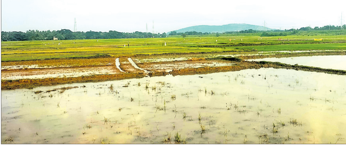
ପତରାକପୁର ଅଞ୍ଚଳର ଗଣଜମି।

ଯାଜପୁର ଜିଲ୍ଲା ଦର୍ପଣ ତହସିଲର ୯ଟି ରାଜସ୍ୱ ମୌଜା ୧୯୨୯ ପରେ ବନ୍ଦୋବସ୍ତ କିମ୍ବା ଚକବନ୍ଦୀ ହୋଇପାରି ନ ଥିଲା।