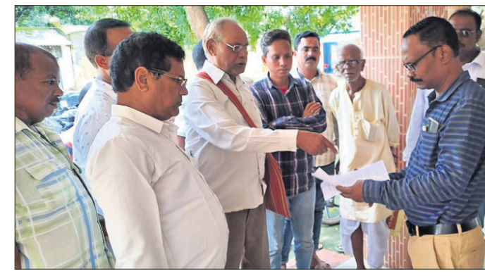
ବିତିଷ୍ଟ ଦାବିପତ୍ର ପ୍ରଦାନ କରାଯାଇଛି ।

ସମ୍ବଲପୁର, ୯।୮ (ବୁଧବାର) ରାଜ୍ୟ ସରକାରଙ୍କ ପକ୍ଷରୁ ଯୁଗ୍ମପୁରା ହାଲସ୍କୁଲ ପଡିଆରେ ଏକ ହଜି ଷ୍ଟିଡିଓ ନିର୍ମାଣ କରାଯାଇଛି ।