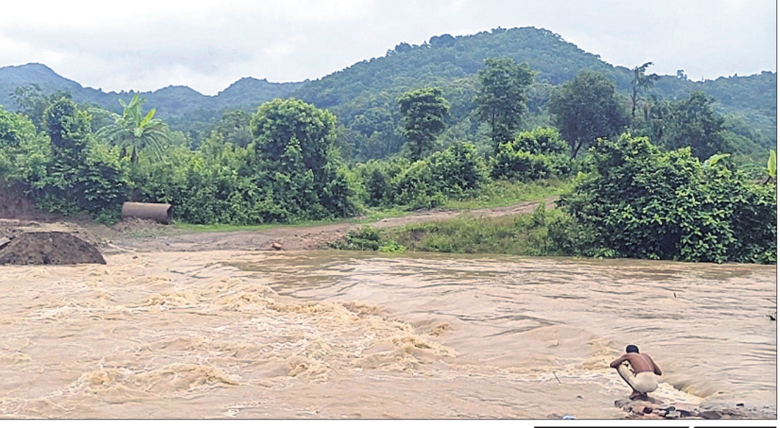
ହରଭଙ୍ଗି ନଦୀରେ ଆସିଥିବା ବନ୍ୟା ।