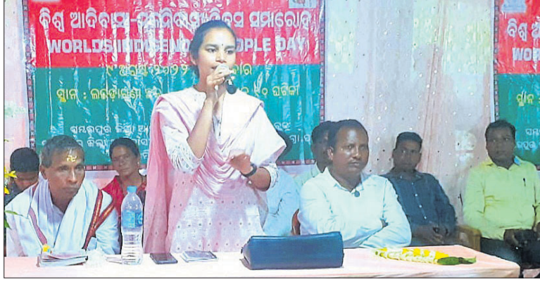
କୃତିଷ୍ଣାଠାରେ ଅନୁଷ୍ଠିତ ସମାବେଶରେ ଯୋଗଦେଇଥିବା ଅତିଥିମାନେ ।