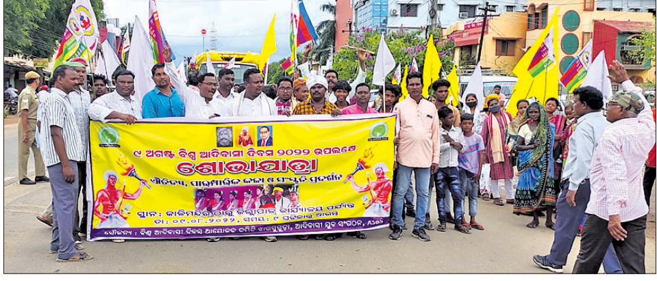
ଝାରସୁଗୁଡ଼ାରେ ଆଦିବାସୀ ଯୁବ ସଂଗଠନ ତରଫରୁ ଶୋଭାଯାତ୍ରା ।