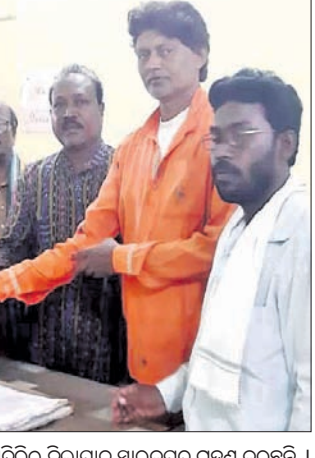
ପଶ୍ଚିମ ଓଡ଼ିଶା କଳାକାର ମହାସଂଘ କର୍ମକର୍ତ୍ତାଙ୍କଠାରୁ ଅତିରିକ୍ତ ଜିଲ୍ଲାପାଳ ସ୍ମାରକପତ୍ର ଗ୍ରହଣ କରୁଛନ୍ତି ।