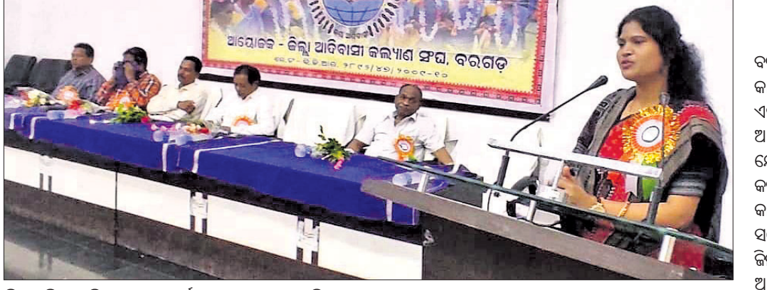
ବିଶ୍ୱ ଆଦିବାସୀ ଦିବସ ପାଳନ କାର୍ଯ୍ୟକ୍ରମରେ ମଞ୍ଚାସୀନ ଅତିଥିବୃନ୍ଦ ।