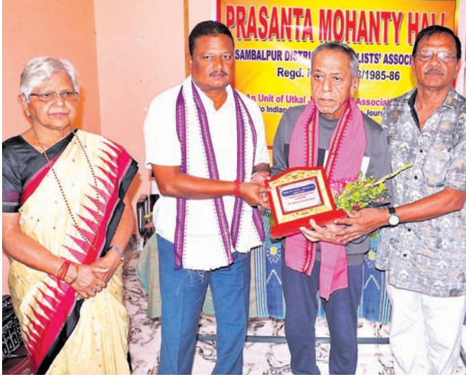
ସାମ୍ବାଦିକ ଭବନରେ ଆୟୋଜିତ କାର୍ଯ୍ୟକ୍ରମରେ ମନ୍ତ୍ରୀ ଓ ଅନ୍ୟମାନେ ।

ଜନକବିରା, ୯।୮ (ଡି.ଏନ.ଏ.): ଶ୍ରୀବତ୍ସର ଶେଷ ସୋମବାରରେ ଜଳଲାଗି ପାଇଁ ଜନକବିରା ବ୍ଲକର ବିଭିନ୍ନ ଶୈବପୀଠରେ ଶ୍ରୀକାଳୁଙ୍କ ସମାରୋହ କରାଯାଇଥିଲା ।