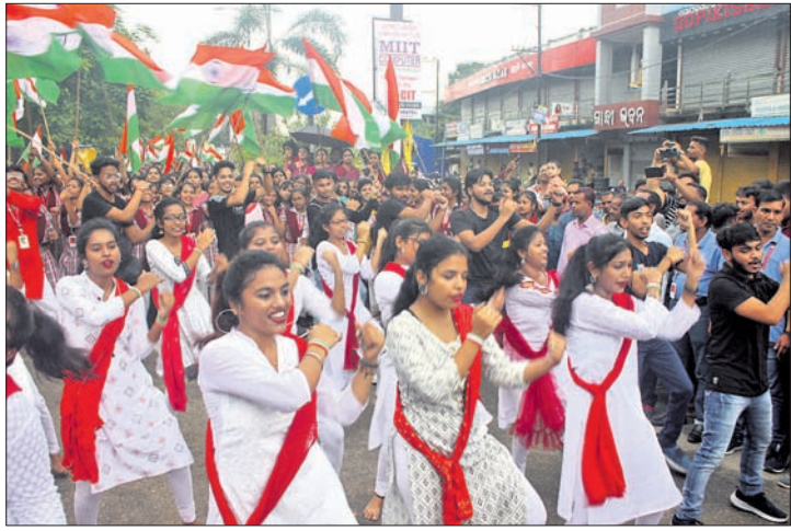
ତ୍ରିରଙ୍ଗା ଶୋଭାଯାତ୍ରାରେ ବିକାଶ ଗ୍ରୁପ୍ ଛାତ୍ରାଛାତ୍ରଙ୍କ ଦେଶାତ୍ମବୋଧକ ସାଂସ୍କୃତିକ କାର୍ଯ୍ୟକ୍ରମ ପରିବେଷଣ । ବରଗଡ଼ରେ ବିକାଶ ଗ୍ରୁପ୍ ଶୋଭାଯାତ୍ରା ।

ଦେଶ ମାତୃକାର ସ୍ୱାଧୀନତାର ୭୫ବର୍ଷ ପୂର୍ତ୍ତି ଅବସରରେ ସମଗ୍ର ଭାରତବର୍ଷରେ ଆଜାଦୀ କା ଅମୃତ ମହୋତ୍ସବ ପାଳନ କରାଯାଉଛି । ଏହି ଅବସରରେ ହର୍ ଘର୍ ତ୍ରିରଙ୍ଗା ଅଭିଯାନ ଚାଲିଛି । ମଙ୍ଗଳବାର କ୍ରାନ୍ତି ଦିବସରେ ବରଗଡ଼ର ବିକାଶ ଗ୍ରୁପ୍ ଏହାକୁ ନିଆରା ଢଙ୍ଗରେ ପାଳନ କରିଛି । ବିକାଶ ଗ୍ରୁପ୍ ର ଛାତ୍ରାଛାତ୍ରୀ ଏବଂ କର୍ମଚାରୀମାନେ ୧କି.ମି ଲମ୍ବର ତ୍ରିରଙ୍ଗା ପତାକା ଧରି ଶୋଭାଯାତ୍ରାରେ ସହର ପରିକ୍ରମା କରିଥିଲେ । ଏଥିରେ ସହର ତ୍ରିରଙ୍ଗାମୟ ହୋଇପଡ଼ିଥିବାବେଳେ ଛାତ୍ରାଛାତ୍ରଙ୍କ ବନ୍ଦେ ମାତରମ, ଭାରତ ମାତା କି ଜୟ ଧ୍ୱନି ଏବଂ ସାଂସ୍କୃତିକ କାର୍ଯ୍ୟକ୍ରମରେ ନିଆରା ପରିବେଶ ସୃଷ୍ଟି ହୋଇଥିଲା ।