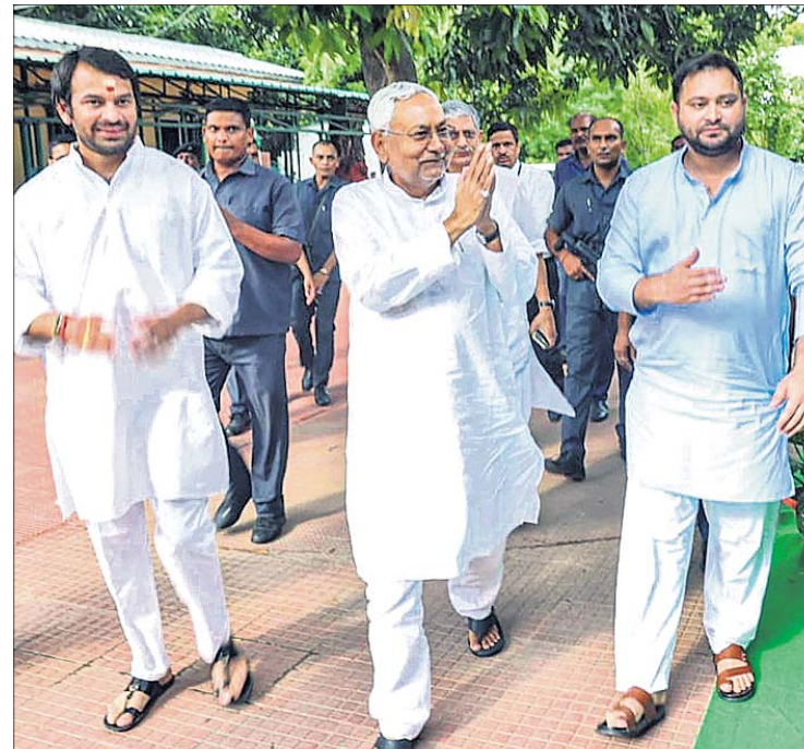
ଆରଜେଡି ନେତା ତେଜସ୍ୱୀ ଯାଦବ ଓ ତେଜ ପ୍ରତାପକ ରହଣିଙ୍କ ସହ ନୀତୀଶ କୁମାର।