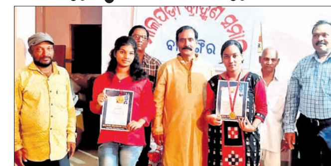
କୃତୀ ଛାତ୍ରୀଙ୍କୁ ସମ୍ବର୍ଦ୍ଧନ କରାଯାଇଛି।

ମାଳପଡ଼ା ବ୍ରାହ୍ମଣ ସମାଜ ପକ୍ଷରୁ ସମାପତ ପ୍ରଦେଶର ତତ୍କାଳୀନ ମିଶ୍ରଙ୍କ ଅଧିକାରରେ କୃତୀ ଛାତ୍ରୀଙ୍କୁ ସମ୍ବର୍ଦ୍ଧନା ସଭା ଅନୁଷ୍ଠିତ ହୋଇଯାଇଛି।