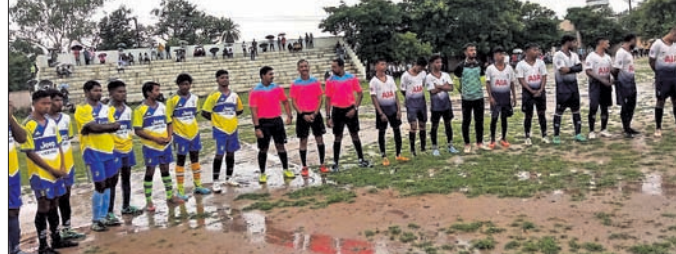
ମ୍ୟାଚ ପୂର୍ବରୁ ଅତିଥିଙ୍କ ଗହଣରେ ଭଲ ଫଳ ଖେଳାଳିମାନେ।

ନୂଆପଡ଼ା ଜିଲ୍ଲା ଖଡ଼ିଆଳ ବ୍ଲକ୍‌ରେ ଖେଳ ପଡ଼ିଆରେ ୧୩ତମ ରାଜା ଅନୁପ ସିଂହେ ଫେଡେରାସନାଲ ଫୁଟବଲ ଚୁର୍ଣ୍ଣାମେଣ୍ଟ ଉଦ୍‌ଘାଟିତ ହୋଇଛି।