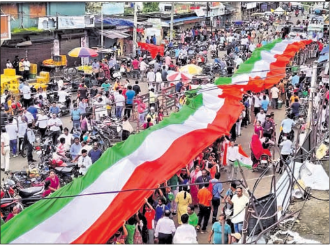
ଦେଶାତ୍ମବୋଧକ ସାଂସ୍କୃତିକ କାର୍ଯ୍ୟକ୍ରମ ପରିବେଷଣ । ବରଗଡ଼ରେ ବିକାଶ ଗ୍ରୁପ୍ ଶୋଭାଯାତ୍ରା ।