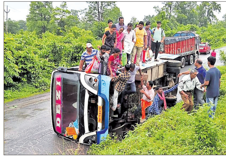
ଓଲଟି ପଡ଼ିଥିବା ବସ୍।

ଉତ୍ତରପ୍ରଦେଶ ପ୍ରକାଶ ପାଇଥିଲା। ସୁରନାୟୋଗ୍ୟ ଓଡ଼ିଶା-୦୭୫୫୩୩. ବିଶିଷ୍ଟ ବସ୍ ଅନୁଗୋଳକୁ ବାହାରି ସମ୍ବଲପୁର ଦେଇ ସୁନ୍ଦରଗଡ଼ ଯାଉଥିଲା। ଏହି ବସ୍ରେ ପ୍ରାୟ ୪୦ଜଣ ଯାତ୍ରୀ ରହିଥିଲେ। ଗଡ଼ଜାତର ନିକଟରେ ବସ୍ଟି ଯାନ୍ତ୍ରିକ ଛୁଟି ଯୋଗୁ ରାସ୍ତାରେ ଏପଟେସେପଟ ହୋଇ ଆସୁଥିଲା। ପ୍ରାୟ ୧୦ କିଲୋମିଟର ପରେ ଗାଡ଼ି ହାତୀବାଟିରେ ଓଲଟି ପଡ଼ିଥିଲା। ଶବ୍ଦ ଶୁଣି ଗ୍ରାମୀଣ ଲୋକେ ଉଦ୍ଧାର ପାଇଁ ପହଞ୍ଚିଆଇଥିଲେ। ପ୍ରାୟ ୭ଜଣ ଯାତ୍ରୀ ସାମାନ୍ୟ ହୋଇଥିବାବେଳେ ହାତୀବାଟି ଡାକ୍ତରଖାନାରେ ପ୍ରାଥମିକ ଚିକିତ୍ସା ପରେ ଛାଡ଼ି ଦିଆଯାଇଥିଲା। ଏହି ଘଟଣାରେ ପୋଲିସ୍ ଏକ ମାମଲା ରୁଜୁ କରି ତଦନ୍ତ କରୁଛି।