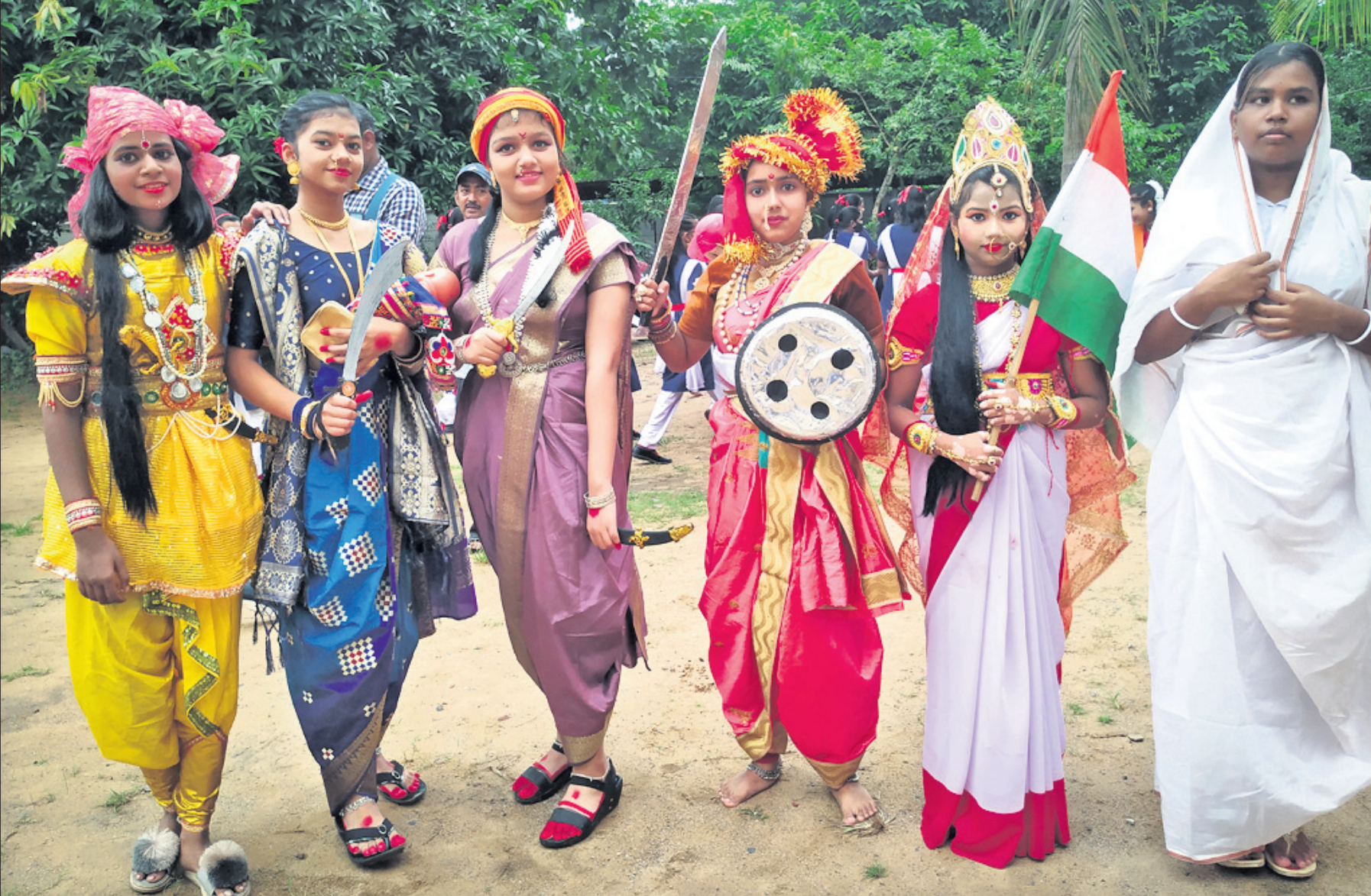
ଆଜ୍ଞାତ କା ଅନୁତ ମହୋତ୍ସବ ପାଳନ ଅବସରରେ ମଙ୍ଗଳବାର କଟକ ରୁକ୍ମାପୁରସ୍ଥିତ ସରସ୍ୱତୀ ଶିଶୁ ବିଦ୍ୟାଳୟରେ ବିଭିନ୍ନ ବେଶ ପ୍ରତିଯୋଗିତାରେ ଭାଗନେଇଥିବା ଛାତ୍ରୀମାନେ ।

ମଙ୍ଗଳବାର ରାତି ୧୦ଟା ସୁଦ୍ଧା (+ ଅନ୍ୟ ରୋଗରେ ଜଣେ ଆକ୍ରାନ୍ତ ମୃତ୍ୟୁ) ଠିକଣା: https://www.worldometers.info/coronavirus/ ଏବଂ ଓଡ଼ିଶା ସରକାର