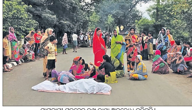
ଗ୍ରାମବାସୀ ମୃତଦେହ ରଖି ରାସ୍ତା ଅବରୋଧ କରିଛନ୍ତି।

ଡେକାନାଲ ଜିଲ୍ଲା ଭୁବନ ଥାନା ପୁରୁଷୋତ୍ତମପୁର ଗ୍ରାମର ଜଣେ ଯୁବକଙ୍କ ବାଇକ୍ ଧକ୍କାରେ ମୃତ୍ୟୁକୁ ନେଇ ଚାନ୍ଦ ଉତ୍ତେଜନା ଦେଖାଦେଇଛି। ମୃତକଙ୍କ ପରିବାରକୁ କ୍ଷତିପୂରଣ ପ୍ରଦାନ ଏବଂ ବାରମ୍ବାର ସେହି ସ୍ଥାନରେ ଦୁର୍ଘଟଣା ଘଟି ଧନକ୍ଷୀଣ ହାନି ହେଉଥିବାରୁ ଏହାର ପ୍ରତିକାର କରିବାକୁ ଦାବି କରି ଅଞ୍ଚଳବାସୀ ଡେକାନାଲ-ଭୁବନ ପୂର୍ବ ବିଭାଗ ରାସ୍ତାରେ ମୃତଦେହ ପୂର୍ଣ୍ଣ ପ୍ରାୟ ୬ ଘଣ୍ଟା ଧରି ଆନ୍ଦୋଳନ କରିଥିଲେ। ପୋଲିସ୍ ପହଞ୍ଚି ବୁଝାଶୁଣା ଏହାର ପ୍ରତିକାର କରିବାକୁ ଦାବି କରି ଅଞ୍ଚଳବାସୀ ଡେକାନାଲ-ଭୁବନ ପୂର୍ବ ବିଭାଗ ରାସ୍ତାରେ ମୃତଦେହ ପୂର୍ଣ୍ଣ ପ୍ରାୟ ୬ ଘଣ୍ଟା ଧରି ଆନ୍ଦୋଳନ କରିଥିଲେ। ପୋଲିସ୍ ପହଞ୍ଚି ବୁଝାଶୁଣା ଏହାର ପ୍ରତିକାର କରିବାକୁ ଦାବି କରି ଅଞ୍ଚଳବାସୀ ଡେକାନାଲ-ଭୁବନ ପୂର୍ବ ବିଭାଗ ରାସ୍ତାରେ ମୃତଦେହ ପୂର୍ଣ୍ଣ ପ୍ରାୟ ୬ ଘଣ୍ଟା ଧରି ଆନ୍ଦୋଳନ କରିଥିଲେ। ପୋଲିସ୍ ପହଞ୍ଚି ବୁଝାଶୁଣା ଏହାର ପ୍ରତିକାର କରିବାକୁ ଦାବି କରି ଅଞ୍ଚଳବାସୀ ଡେକାନାଲ-ଭୁବନ ପୂର୍ବ ବିଭାଗ ରାସ୍ତାରେ ମୃତଦେହ ପୂର୍ଣ୍ଣ ପ୍ରାୟ ୬ ଘଣ୍ଟା ଧରି ଆନ୍ଦୋଳନ କରିଥିଲେ।