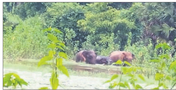
ପୋଖରୀରେ ଫସିଗଲେ ହାତୀପଲ

ପାଣି ପିଇବାକୁ ଆସିଥିବାବେଳେ ପୋଖରୀରେ ଫସିଗଲେ ହାତୀପଲ। ଡେକାନାଲ ଜିଲ୍ଲା ପରଜଙ୍ଗ ବ୍ଲକ ମୁକ୍ତାପାଣି ଫରେଷ୍ଟ ସେକ୍ଟର ଅଧୀନ କଳିକି ଗ୍ରାମରେ ମଙ୍ଗଳବାର ଘଟିଛି ଏଭଳି ଏକ ଅଭାବନୀୟ ଘଟଣା। ହାତୀକୁ ଦେଖିବା ଲାଗି ପ୍ରବଳ ଜନଗହଳି ହୋଇଥିବାବେଳେ ହାତୀମାନେ ପାଣିରୁ ବାହାରି ଜଙ୍ଗଲକୁ ଯିବାକୁ ବାଟ ପାଇ ନ ଥିଲେ। ଜନଗହଳି କମିବା ପରେ ସେମାନେ ଜଙ୍ଗଲକୁ ପଳାଇ ଯାଇଛନ୍ତି। କଳିକି ଗ୍ରାମ ଦନାର ପୋଖରୀରେ ମଙ୍ଗଳବାର ଭୋର ସମୟରେ ଏକ ପଲରେ ୫ଟି ହାତୀ ପାଣି ପିଇବାକୁ ଆସିଥିଲେ। ସକାଳୁ ଗ୍ରାମର କେତେଜଣ ବ୍ୟକ୍ତି ଦିଲକୁ ଯାଉଥିବାବେଳେ ଏହା ଦେଖି ଗ୍ରାମବାସୀଙ୍କୁ ଜଣାଇଥିଲେ। ସୂଚନା ପାଇ ବନ କର୍ମଚାରୀ ପହଞ୍ଚି ହାତୀ ଉପରେ ନଜର ରଖୁଥିବାବେଳେ ଜନଗହଳି ବଢ଼ିବାରେ ଲାଗିଥିଲା। ବାଣ ଫୁଟାଇ, ସାଇଲେ ବଜାଇ ହାତୀଙ୍କୁ ଜଙ୍ଗଲକୁ ଘଉଡ଼ାଇବାକୁ ଉଦ୍ୟମ