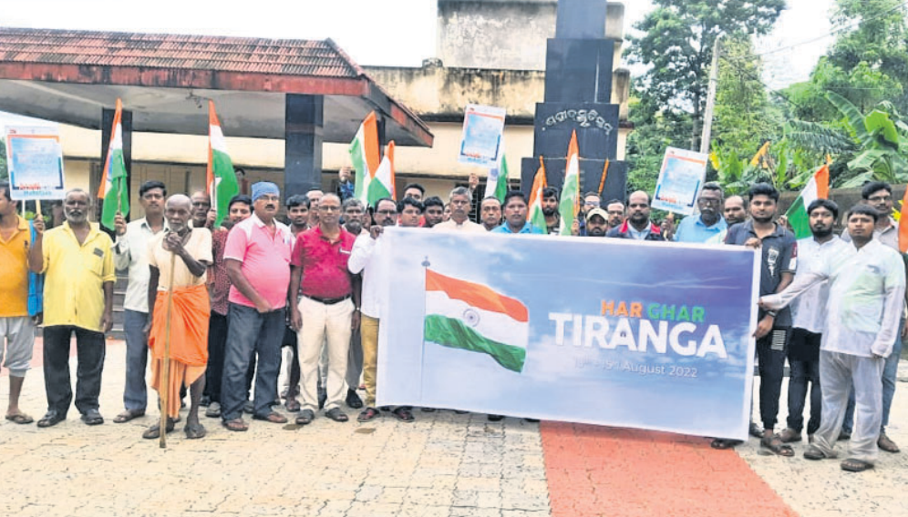
କାର୍ଯ୍ୟକ୍ରମରେ ତାଙ୍କ ବିଭାଗ କର୍ମଚାରୀ, ଅଞ୍ଚଳର ବୁଦ୍ଧିଜୀବୀ, ମାନ୍ୟଗଣ୍ୟ ବ୍ୟକ୍ତିଙ୍କ ସମେତ ଅନ୍ୟମାନେ।