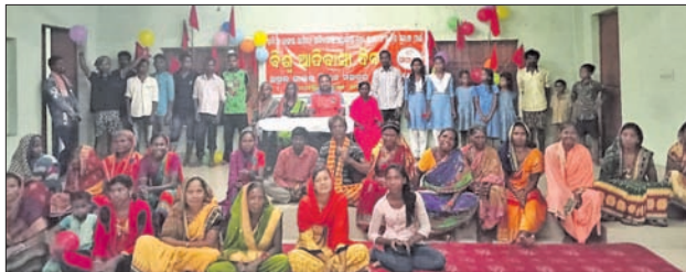
ସମାବେଶରେ ଉପସ୍ଥିତ ଆଦିବାସୀ ନେତା ଓ ଅନ୍ୟମାନେ।

ଆଠମଲିକ, ୯୮ (ଡି.ଏନ.ଏ.) ହେଉଛି ସଂଘର୍ଷ, ବୀର ଓ ଦକ୍ଷିଣରେ ବୋଲି ଅଭିହିତ କରିଥିଲେ। ରାଜ୍ୟର ଏକ ଚରୁଆଁଶ କନଟା ଆଦିବାସୀ ହୋଇଥିଲା ବେଳେ ସରକାରଙ୍କ ଅବହେଳା ଓ ସମ୍ବେଦନହୀନତା ଲାଗି ସେମାନଙ୍କ ଭାଷା, ଲିପି, ସାହିତ୍ୟ ଓ ସଂସ୍କୃତିର ବିକାଶ ହୋଇପାରୁନାହିଁ ବୋଲି ଅଭିଯୋଗ କରାଯାଇଥିଲା। ଶେଷରେ ଆଦିବାସୀମାନେ ନିଜର ଅଧିକାର ଉପରେ ହେଉଥିବା ଆକ୍ରମଣ ବିରୋଧରେ ସଂଗ୍ରାମ କରିବାକୁ ତଥା ଧର୍ମ ନାମରେ ଭାଗଭାଗ ନ ହୋଇ ଏକତାବଦ୍ଧ ରହିବାକୁ ତାକତା ଦିଆଯାଇଥିଲା। ଆଠମଲିକ ଅଞ୍ଚଳରେ କାନ୍ଧିଆ ରୂପ ପରିଚିତ ମୁଖ୍ୟ ଆଦିବାସୀ ସମ୍ପ୍ରଦାୟକୁ ଆଦିବାସୀ ମାନ୍ୟତା ପ୍ରଦାନ କରିବା ପାଇଁ ଦାବି କରାଯାଇଥିଲା। ସଙ୍ଗଠନର ଅନ୍ୟତମ ସଦସ୍ୟ ଇତିଶ୍ରୀ ମୁଖ୍ୟ ଧନ୍ୟବାଦ ପ୍ରଦାନ କରିଥିଲେ।