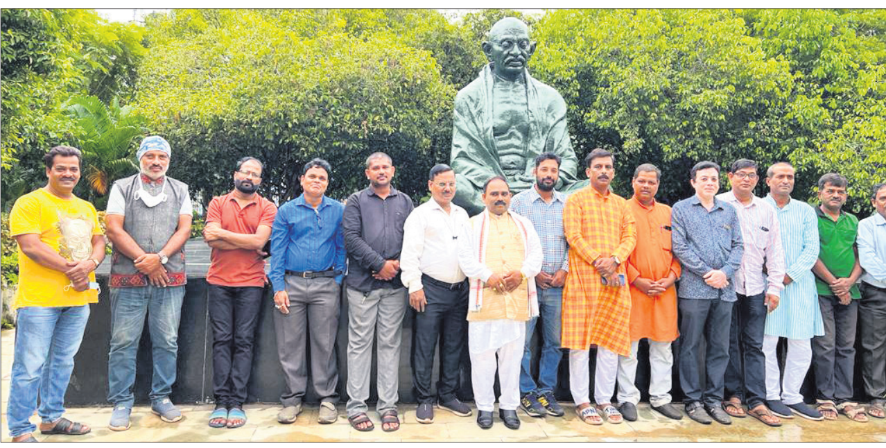
ଭୁବନେଶ୍ୱର ଜନତା ମଇଦାନ ମହାତ୍ମା ଗାନ୍ଧୀ ପାର୍କରେ ଓଡ଼ିଶା ଅଭିଭାବକ ମହାସଂଘ ପକ୍ଷରୁ ଶିକ୍ଷା କ୍ରାନ୍ତି ଅଭିଯାନର ଶୁଭାରମ୍ଭ କରାଯାଇଛି ।