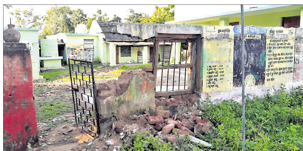
ଗଞ୍ଜରସାହି ସରକାରୀ ପ୍ରାଥମିକ ବିଦ୍ୟାଳୟର ଫାଟକ ବିପଦସଙ୍କୁଳ ଅବସ୍ଥାରେ ରହିଛି।