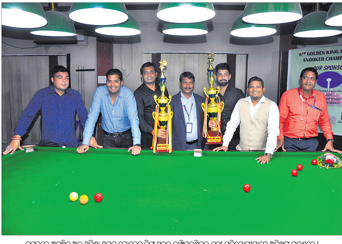
କଟକରେ ଅନୁଷ୍ଠିତ ଅଲ୍ ଓଡ଼ିଶା ଓପନ ଗୋଲ୍ଡେନ କିଙ୍ଗ୍ ସୁକର ଚାମ୍ପିୟନଶିପ୍‌ର କୃତୀ ପ୍ରତିଯୋଗୀମାନେ ଅଧିଥିବା ଗହଣରେ।

କୋର୍ଟଙ୍କ ଉତ୍ତର ମାନହାନି ମକଦ୍ଦମା ଉପରେ କୋର୍ଟ ଶୁଣାଣି କରିବା ସହିତ ଏପରି ପ୍ରମାଣକୁ ଉତ୍ତର କରିଛନ୍ତି। ରାଜ୍ୟ କ୍ରୀଡ଼ା ବିଭାଗରୁ କିଛି ତରଫରୁ ଏଭଳି ପଛଘୁଞ୍ଚି କାର୍ଯ୍ୟ କରାଯିବା ଆଦୌ ଗ୍ରହଣୀୟ ନୁହେଁ।