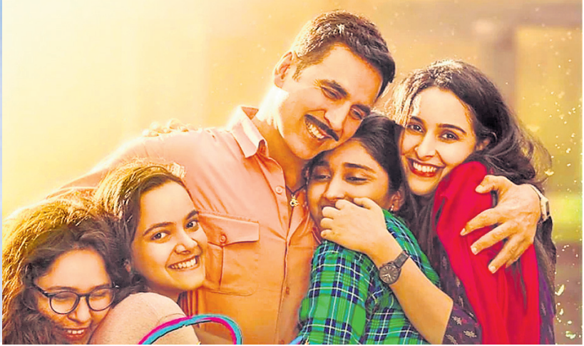
'ରକ୍ଷାବନ୍ଧନ' ଫିଲ୍ମର ଏକ ଦୃଶ୍ୟରେ ଅକ୍ଷୟ କୁମାର