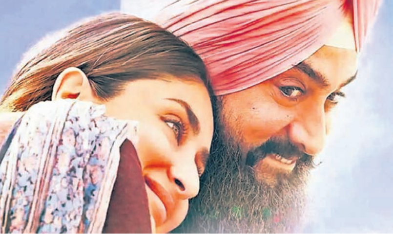
'ଲାଲ୍ ସିଂ ଚଡ଼ା' ଫିଲ୍ମରେ କରୀନା-ଆମୀର