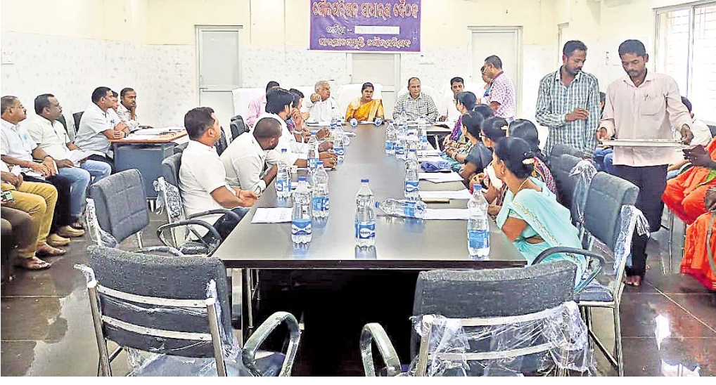
ବୈଠକରେ ଉପସ୍ଥିତ ସାଂସଦ, ବିଧାୟକ ପ୍ରତିନିଧିଙ୍କ ସମେତ ପୌର ପରିଷଦ ସଦସ୍ୟ