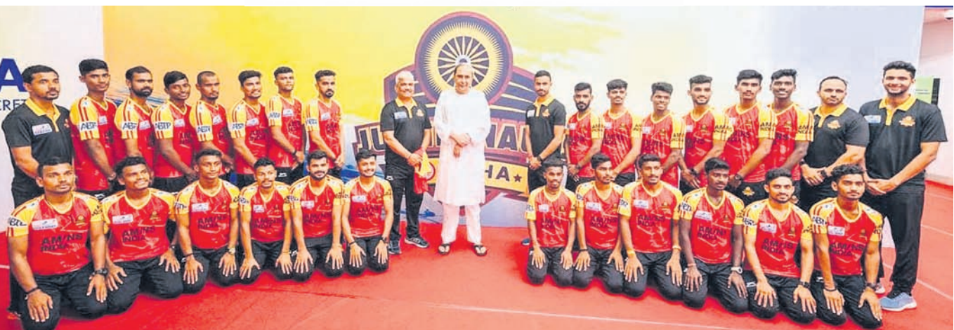
ଜର୍ସି ଉନ୍ମୋଚନ ଅବସରରେ ମୁଖ୍ୟମନ୍ତ୍ରୀ ନବୀନ ପଟ୍ଟନାୟକଙ୍କ ସହ ଓଡ଼ିଶା ଜଗରନଟ୍ସ ଦଳ।