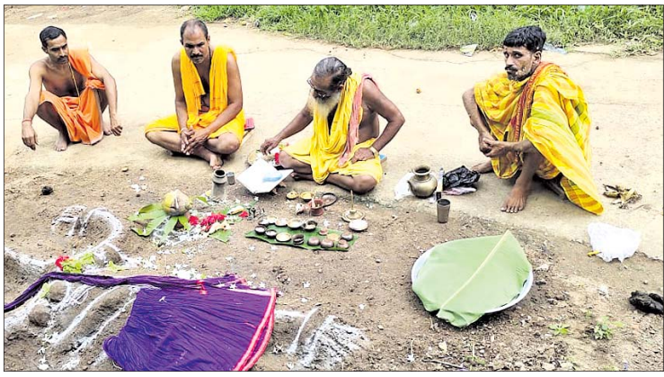
ଗହ୍ମା ପୂଜନ ପର୍ବ ।

ଗୋପାଳପୁର ଥାନା ଅନ୍ତର୍ଗତ ବ୍ରହ୍ମପୁର ବିଶ୍ୱବିଦ୍ୟାଳୟ ପରିସରରେ ଥିବା ଷ୍ଟେସନାରୀୟ ଏଟିଏମ୍ ରୁଜୁରୀ କୌଶଳୀ ବ୍ୟକ୍ତି ଭାଙ୍ଗିଦେଇଥିବା ଅଭିଯୋଗ ହୋଇଛି। ସକାଳେ ଚଳା ଉଠାଇବାକୁ ଆସିଥିବା ବ୍ୟକ୍ତି ଏଟିଏମ୍ ରୁଜୁରୀ ନ ବାହାରିବା ଫଳରେ ଡିପୋଜିଟ ଓ ଡ୍ରାଫ୍ଟ ଲାଭ ହେଉଥିବା ସ୍ଥାନ ଏବଂ ମନିଟରରୁ