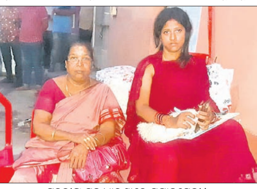
ମୁବତୀଙ୍କ ସହ ଧାରଣାରେ ସମାଜସେବୀ।