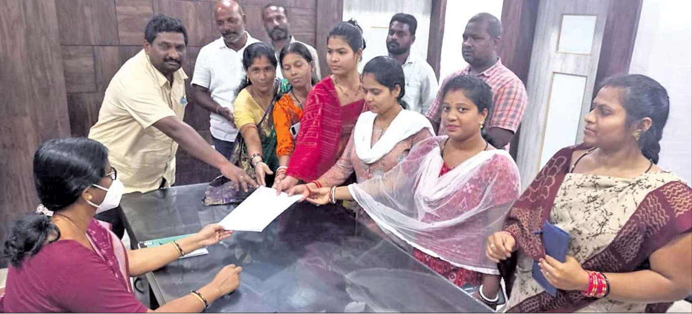
ସ୍ୱାଗତପତ୍ର ପ୍ରଦାନ କରାଯାଇଛି ।