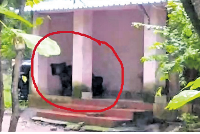
ଜଣେ ବ୍ୟକ୍ତିଙ୍କ ପିଣ୍ଡାରେ ଛିଡ଼ା ହୋଇଥିବା ଭାଲୁ।

ଆନନ୍ଦପୁର, ୧୧୮ (ସ.ପ୍ର.) ବଣ ଜଙ୍ଗଲରେ ବନ୍ୟପ୍ରାଣୀ ଚଳପ୍ରଚଳ କରିବା ଏକ ସାଧାରଣ କଥା। ହେଲେ ଗାଁ ଦାଣ୍ଡରେ ଦିନରେ ଭାଲୁ ବୁଲିବା, ଘରର ପିଣ୍ଡାରେ ବସିବା ଦେଖିଲେ ଯେ କେହି ବି ଚକିତ ହେବ। ଏଭଳି ଦୃଶ୍ୟ କେନ୍ଦ୍ରରେ ଜିଲା ଘସିପୁରା ବ୍ଲକ ପୁରୁଣାବାନ୍ଧଗୋଡ଼ା ଗ୍ରାମରେ ଦେଖିବାକୁ ମିଳିଛି। ଆନନ୍ଦପୁର ବନ୍ୟପ୍ରାଣୀ ବନଖଣ୍ଡ ଅଧୀନ ବରାଙ୍ଗ ସଂରକ୍ଷିତ ଜଙ୍ଗଲରୁ ମା' ଛୁଆ ମିଶି ୩ ଭାଲୁ ବାହାରି ପୁରୁଣାବାନ୍ଧଗୋଡ଼ା ଗ୍ରାମରେ ଗୁରୁବାର ବୁଲିବୁଲି କରିଥିଲେ। ଗାଁ ଲୋକଙ୍କ ପାଟି କରିବାକୁ ସେମାନେ ଜଙ୍ଗଲକୁ ପକାଇଥିଲେ। ଖାଦ୍ୟ ଅଭାବରେ ଭାଲୁ ତିନୋଟି ଗାଁ ମୁହାଁ ହୋଇଥିବା ଜଣାପଡ଼ିଛି। ବରାଙ୍ଗ ଜଙ୍ଗଲରୁ ଅଧିକାଂଶ ସମୟରେ ଭାଲୁ ଗାଁ ମୁହାଁ ହେଉଥିବାକୁ ଗ୍ରାମବାସୀ ଆତଙ୍କିତ ଅବସ୍ଥାରେ ରହୁଛନ୍ତି। ବନ ବିଭାଗ ଏଥିପ୍ରତି ସ୍ୱତନ୍ତ୍ର ଦୃଷ୍ଟି ଦେବାକୁ ଦାବି ହେଉଛି।