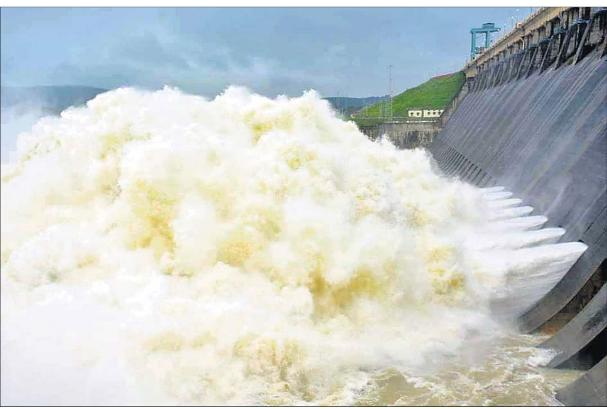
ଉପରପୁଞ୍ଜରେ ପ୍ରବଳ ବର୍ଷା ଯୋଗୁଁ ହାରାହାରି ଜଳଭଣ୍ଡାରରୁ ଗୁରୁବାର ୧୦ଟି ଫୁଲସ ଗେରୁଦେଇ ଜଳ ନିଷ୍କାସନ ହେଉଛି। (ବିପୋର୍ତ୍ତ: ପୃଷ୍ଠା-୨)