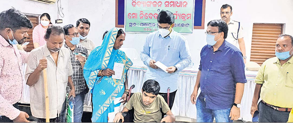
ଅଭିଯୋଗ ଶୁଣାଣି ଚାଲିଛି ।