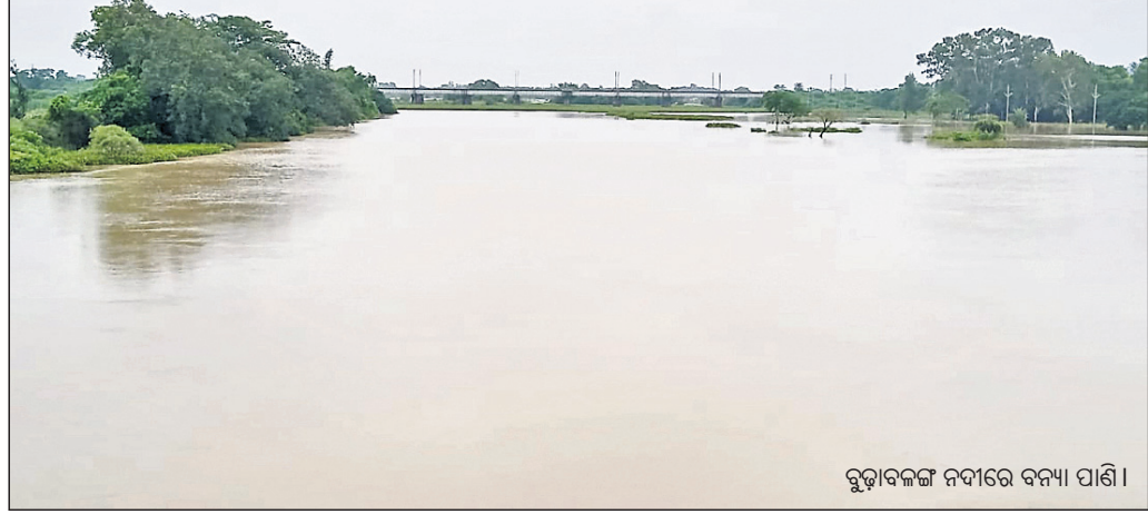
ବୁଡ଼ାବଳଙ୍ଗ ନଦୀରେ ବନ୍ୟା ପାଣି ।

ବାଲେଶ୍ୱର ଜିଲ୍ଲାରେ ଗତ ୪ଦିନ ଧରି ଲଗୁଚାପଜନିତ ଲଗାଣ ବର୍ଷା ଯୋଗୁ ବିଭିନ୍ନ ନଦୀରେ ଜଳସ୍ତର ବୃଦ୍ଧି ପାଇଛି । ମୁଖ୍ୟତଃ ବୁଡ଼ାବଳଙ୍ଗ ଓ ଜଳକା ନଦୀରେ ଜଳସ୍ତର କ୍ରମାଗତ ବୃଦ୍ଧି ପାଇଥିବାରୁ ବନ୍ୟା ଆଶଙ୍କା ସୃଷ୍ଟି ହୋଇଛି । ସୁବର୍ଣ୍ଣରେଖା ନଦୀରେ ଜଳସ୍ତର ସ୍ଥିର ଥିବା ଜଣାପଡ଼ିଛି । ଗୁରୁବାର ସନ୍ଧ୍ୟା ବୁଡ଼ାବଳଙ୍ଗ ନଦୀରେ ବିପଦସଙ୍କେତ ୮.୧୩ ମିଟର ରହିଥିବା ବେଳେ ୬.୭୨ମିଟରରେ ପ୍ରବାହିତ ହେଉଛି । ସୁବର୍ଣ୍ଣରେଖା ନଦୀରେ ବିପଦସଙ୍କେତ ୧୦.୩୨ମିଟର ରହିଥିବା ବେଳେ ୪.୨୭ ଓ ଜଳକା ନଦୀରେ ବିପଦ ସଙ୍କେତ ୫.୫୦ମିଟର ରହିଥିବା ବେଳେ ୫.୩୮ମିଟରରେ ପ୍ରବାହିତ ହେଉଛି । ବନ୍ୟା ଆଶଙ୍କା ନେଇ ନଦୀକୂଳିଆ ଲୋକେ ଚିନ୍ତାରେ ଅଛନ୍ତି । ବୁଡ଼ାବଳଙ୍ଗ ଓ ସୋନ ନଦୀର ଜଳସ୍ତର କ୍ରମାଗତ ବୃଦ୍ଧି ପାଇଥିବାରୁ ବନ୍ୟା ଆଶଙ୍କା ଦେଖାଦେଇଛି । ଫଳରେ ରେମୁଣା ବ୍ଲକ୍ ଅଧୀନ ତଳି ଅଞ୍ଚଳ ନିଜାମପୁର, ମହାରପୁର, ଦୁର୍ଗାଦେବୀ,