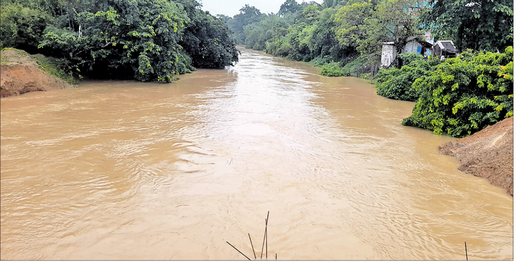
ବିପଦସଙ୍କେତ ଉପରେ ଜଳକା ନଦୀରେ ବର୍ଷା ଜଳ ପ୍ରବାହିତ ହେଉଛି ।

ବାଲିଆପାଳ ବ୍ଲକ୍‌ରେ ୨୩ମି.ମି., ସଦର ବ୍ଲକ୍‌ରେ ୨୯ମି.ମି., ରେମୁଣା ବ୍ଲକ୍‌ରେ ୩୬ ମି.ମି., ନୀଳଗିରି ବ୍ଲକ୍‌ରେ ୩୫ମି.ମି., ସୋର ବ୍ଲକ୍‌ରେ ୫୮ମି.ମି., ବାହାଦୁରୀ ବ୍ଲକ୍‌ରେ ୫୧ମି.ମି., ସିପୁଲିଆ ବ୍ଲକ୍‌ରେ ୪୧ମି.ମି., ଖଇରା ବ୍ଲକ୍‌ରେ ୭୯ମି.ମି., ଊପଦା ବ୍ଲକ୍‌ରେ ୭୧ମି.ମି. ବର୍ଷା ହୋଇଛି । ଜିଲ୍ଲାରେ ଗତ ୨୪ ବର୍ଷା ରେକର୍ଡ୍ ଅନୁଯାୟୀ ଭୋଗରାଇ ବ୍ଲକ୍‌ରେ ୫୪ମି.ମି., ବସ୍ତା ବ୍ଲକ୍‌ରେ ୨୮ ମି.ମି., ବାଲେଶ୍ୱର ବ୍ଲକ୍ ୫୭ମି.ମି.,