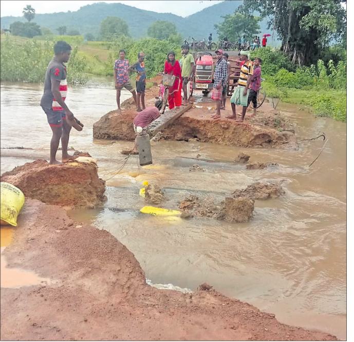
ଗ୍ରାମବାସୀ ବିଦ୍ୟୁତ୍ ଖୁଣ୍ଟ ପକାଇ ଯାତାୟତ ଲାଗି ଚେଷ୍ଟା କରୁଛନ୍ତି ।

ଲଗୁଚାପ ଜନିତ ଲଗାଣ ବର୍ଷା ଯୋଗୁ ମୟୂରଭଞ୍ଜ ଜିଲ୍ଲା ବିଶୋଇ ବ୍ଲକ୍ ଭୀତଛତ୍ର ପଞ୍ଚାୟତ ଅଧୀନ ମଝିଗାଁ-ନଦୀର ଦୁଇ ପାର୍ଶ୍ୱରେ ଥିବା ଚାଷ ଜମି ଅଧିକାଂଶ ସ୍ଥାନରେ ଜଳମଗ୍ନ ହୋଇ ରହିଥିବା ଦେଖା ଯାଇଛି । ସେହିପରି ସୋନ ଓ ପ୍ରସନ୍ନ ନଦୀରେ ମଧ୍ୟ ବନ୍ୟା ଜଳ ବୃଦ୍ଧି ପାଇଥିବା ଦେଖିବାକୁ ମିଳିଛି ।