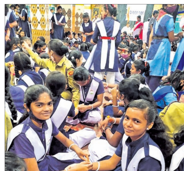
ରକ୍ଷାବନ୍ଧନ କାର୍ଯ୍ୟକ୍ରମରେ ଉପସ୍ଥିତ କେନ୍ଦୁଝର ଜିଲ୍ଲା କଳାକାର ଶିଶୁ ବିଦ୍ୟାଳୟର ଛାତ୍ରମାନେ।