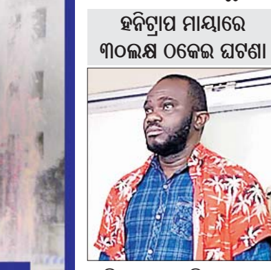
ହନିଗ୍ରାସ ମାୟାରେ ୩୦ଲକ୍ଷ ୦କୋଟ ଘଟଣା