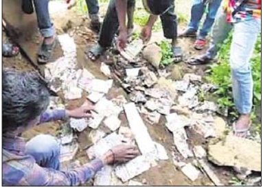
ରୁଧିରାଧିଆ ଶବରଙ୍କ ସମେତ ବହୁ ଗ୍ରାମବାସୀ। ପ୍ରକାଶ ଯେ, ତରାବ ଗାଁରେ ଥିବା ପୋଷ୍ଟ ଅଫିସ ଉପରେ ୬ ଖଣ୍ଡ ଗାଁର ଲୋକେ ନିଜର

କରନ୍ତି। ଏହି ୬ଖଣ୍ଡ ଗାଁର ଲୋକମାନେ ଆଧାର କାର୍ଡ ପାଇଁ ମୋହନା ଜନସେବା କେନ୍ଦ୍ରରେ ଆବେଦନ କରିଥିଲେ। କିନ୍ତୁ ଦୀର୍ଘ ଦିନ ବିତିଯାଇଥିଲେ ବି ସେମାନେ ଆଧାର କାର୍ଡ ପାଇବାକୁ ପାରିନଥିଲେ। ଗୁରୁବାର ପୋଷ୍ଟ ଅଫିସ ନିକଟସ୍ଥ ଅଲିଆ ଗଦାରେ କିଛି ଆଧାର କାର୍ଡ ପଡ଼ିଥିବା ଜଣେ ଯୁବକ ଦେଖିଥିଲେ। ତାଙ୍କର ସନ୍ଦେହ ହେବାରୁ ସେ ଗ୍ରାମବାସୀଙ୍କୁ ଜଣାଇଥିଲେ। ଗ୍ରାମବାସୀ ଆସି ମାଟି ଖୋଳିଲା ପରେ ଶହ ଶହ ଆଧାର କାର୍ଡ ବାହାରିଥିଲା। ନିଜ ନିଜ ପରିଚୟ ପତ୍ର ପାଇବାକୁ ମାଟି