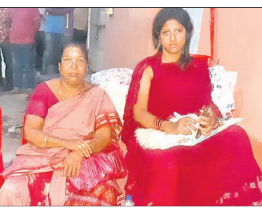
ମୁବତୀଙ୍କ ସହ ଧାରଣାରେ ସମାଜସେବା।