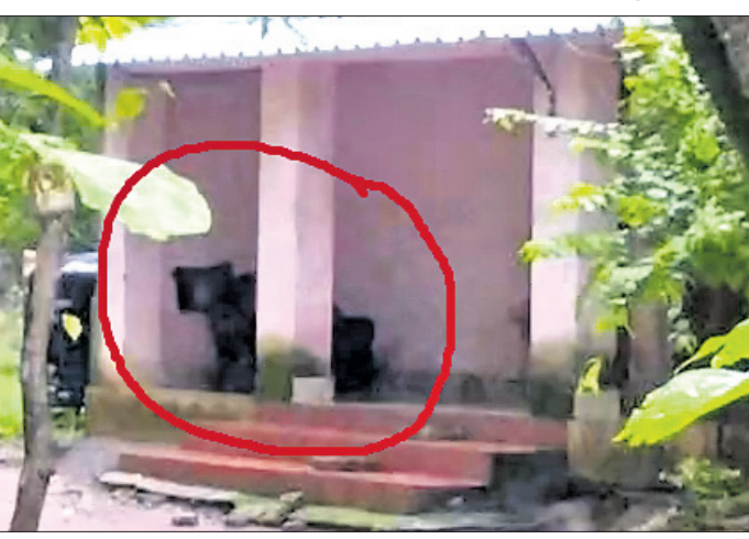
ଜଣେ ବ୍ୟକ୍ତିଙ୍କ ପିଆରେ ଛିଡ଼ା ହୋଇଥିବା ଭାଲୁ।

ଆନନ୍ଦପୁର, ୧୧୮୮ (ସ.ପ୍ର.) ବଣ ଜଙ୍ଗଲରେ ବନ୍ୟପ୍ରାଣୀ ଚଳପ୍ରଚଳ କରିବା ଏକ ସାଧାରଣ କଥା। ହେଲେ ଗାଁ ଦାଣ୍ଡରେ ଦିନରେ ଭାଲୁ ବୁଲିବା, ଘରର ପିଣ୍ଡାରେ ବସିବା ଦେଖିଲେ ଯେ କେହି ବି ଚକିତ ହେବ। ଏଭଳି ଦୃଶ୍ୟ କେନ୍ଦୁଝର ଜିଲ୍ଲା ଘସିପୁରା ବ୍ଲକ ପୁରୁଣାବାନ୍ଧଗଡ଼ା ଗ୍ରାମରେ ଦେଖିବାକୁ ମିଳିଛି। ଆନନ୍ଦପୁର ବନ୍ୟପ୍ରାଣୀ ବନଖଣ୍ଡ ଅଧୀନ ବରାଙ୍ଗ ସଂରକ୍ଷିତ ଜଙ୍ଗଲକୁ ମା' ଛୁଆ ମିଶି ୩ ଭାଲୁ ବାହାରି ପୁରୁଣାବାନ୍ଧଗଡ଼ା ଗ୍ରାମରେ ଗୁରୁବାର ବୁଲିବୁଲି କରିଥିଲେ। ଗାଁ ଲୋକେ ପାଟି କରିବାକୁ ସେମାନେ ଜଙ୍ଗଲକୁ ପକାଇଥିଲେ। ଖାଦ୍ୟ ଅଭାବରେ ଭାଲୁ ତିନୋଟି ଗାଁ ମୁହାଁ ହୋଇଥିବା ଜଣାପଡ଼ିଛି। ବରାଙ୍ଗ ଜଙ୍ଗଲରୁ ଅଧିକାଂଶ ସମୟରେ ଭାଲୁ ଗାଁ ମୁହାଁ ହେଉଥିବାରୁ ଗ୍ରାମବାସୀ ଆତଙ୍କିତ ଅବସ୍ଥାରେ ରହୁଛନ୍ତି। ବନ ବିଭାଗ ସଂପ୍ରତି ସ୍ୱତନ୍ତ୍ର ଦୃଷ୍ଟି ଦେବାକୁ ଦାବି ହେଉଛି।