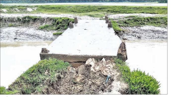
ବର୍ଷାରେ ସଂଯୋଗୀ ରାସ୍ତା ଧସିଯାଇଛି ।