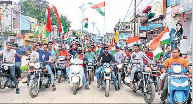
ବିଶ୍ୱ ହିନ୍ଦୁ ପରିଷଦ ଓ ବଜରଙ୍ଗ ଦଳର କର୍ମକର୍ତ୍ତା ଶୋଭାଯାତ୍ରାରେ ବାହାରି ଲୋକଙ୍କୁ ସଚେତନ କରୁଛନ୍ତି।

ସଚେତନ କରିବା ନିମନ୍ତେ ଶୋଭାଯାତ୍ରା ଓ ପଥପ୍ରାନ୍ତ ସଭା ଅନୁଷ୍ଠିତ ହୋଇଯାଇଛି। ବିଶ୍ୱ ହିନ୍ଦୁ ପରିଷଦ ଓ ବଜରଙ୍ଗ ଦଳର ଶତାଧିକ କର୍ମକର୍ତ୍ତାଙ୍କ ସମେତ ବିଭିନ୍ନ ବର୍ଗର ଲୋକ ଏଥିରେ ସାମିଲ ହୋଇଥିଲେ।