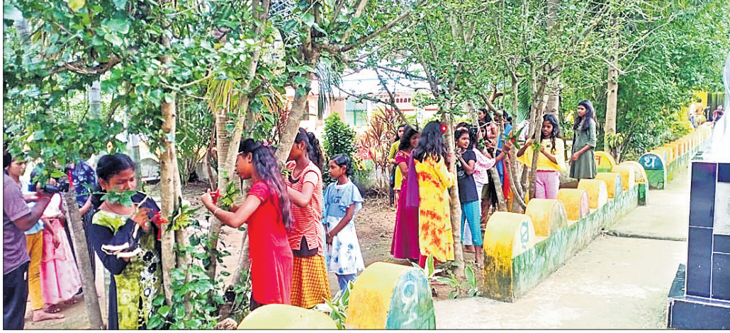
ଛାତ୍ରାମାନେ ଜଙ୍ଗଲରେ ବୃକ୍ଷକୁ ଭାଇ ମନେକରି ରାଖି ବାନ୍ଧୁଛନ୍ତି।