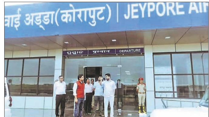
ଏୟାରପୋର୍ଟରେ ଜିଲାପାଳ କାର୍ଯ୍ୟ ସମାପ୍ତ କରୁଛନ୍ତି ।