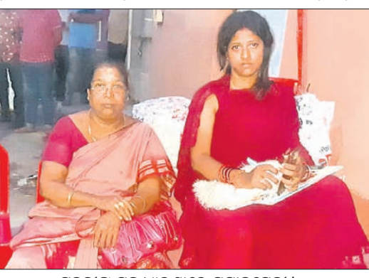
ମୁବତୀଙ୍କ ସହ ଧାରଣାରେ ସମାଜସେବୀ।