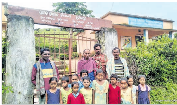
ସମୟ ପୂର୍ବରୁ ବିଦ୍ୟାଳୟ ବନ୍ଦ ରହିଛି।

ନିୟମିତ ଭାବେ ବିଦ୍ୟାଳୟ ଆୟୁର୍ଯ୍ୟାତ୍ମକ ଶିକ୍ଷକ। ଛାତ୍ରାଛାତ୍ରୀଙ୍କୁ ମଧ୍ୟାହ୍ନଭୋଜନରେ ଦେବା ଲାଗି ପ୍ରଦାନ କରାଯାଉଥିବା ଅଣ୍ଡା ହଠାତ୍ କରାଯାଉଥିବା ବିଦ୍ୟାଳୟ ଆସିବା ପ୍ରତି ସେମାନଙ୍କ ଆଗ୍ରହ କମିଯାଇଛି।