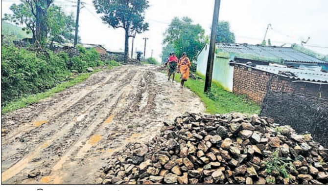
ଗ୍ରାମକୁ ପଡ଼ିଥିବା କାନ୍ଥୁଆ ରାସ୍ତା ।

କୋରାପୁଟ ଜିଲା ବଶମତପୁର ବୁକ୍ ଅନ୍ତର୍ଗତ ପାଇକ ଫୁଲବେଡ଼ା ସଦର ପଞ୍ଚାୟତ ଠାରୁ ଖୋପରାପଦର ଗ୍ରାମକୁ ସଂଯୋଗ କରୁଥିବା ମୁଖ୍ୟ ରାସ୍ତା କାନ୍ଥୁଆ ହୋଇ ଏକ ପ୍ରକାର ମରଣସନ୍ଧି ପାଲଟିଛି । ଖୋପରାପଦର ଗ୍ରାମ ଫୁଲବେଡ଼ା ଛକଠାରୁ ୭ କି.ମି. ଦୂର। ଏହି ରାସ୍ତାରେ ୫ ଖଣ୍ଡ ଗ୍ରାମ ବଦଳି ମାଳିଗୁଡ଼ା, ସଲପଗୁଡ଼ା, ତେନ୍ତୁଳିଗୁଡ଼ା ଏବଂ ମଧୁ ବିଶାଳି ଗ୍ରାମର ଲୋକମାନେ ନିର୍ଭର କରିଥାନ୍ତି। ଗ୍ରାମବାସୀଙ୍କ ପାଇଁ ପଙ୍କାଗାସ୍ତା ସାତସପନ ପାଲଟିଛି। ବର୍ଷାଦିନେ ଗ୍ରାମବାସୀ ନାହିଁ ନ ଥିବା ହରରାଣ ହେଉଛନ୍ତି। କାନ୍ଥୁଆ ରାସ୍ତାରେ ଜରୁରିକାଳୀନ ପରିସ୍ଥିତିର ଗ୍ରାମକୁ ୧୦୨ କି.ମି ୧୦୮ ଆସୁଲାନୁ ଆସିପାରେ ନାହିଁ। ଦୈନନ୍ଦିନ ଯାତାୟାତ ପାଇଁ ଗାଁକୁ ଭଲ ରାସ୍ତାଟିଏ ନାହିଁ। ବର୍ଷା ଦିନ ଆସିଲେ ଗର୍ଭବତୀ ମହିଳା ଏବଂ