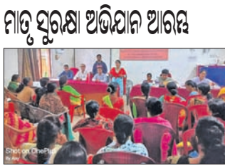
କୃତ୍ୱମୁକ୍ତଗୁଣ୍ଡା, ୧୧।୮ (ଡି.ଏନ.ଏ.)- କୃତ୍ୱମୁକ୍ତଗୁଣ୍ଡା ଗୋଷ୍ଠୀ ସ୍ୱାସ୍ଥ୍ୟ କେନ୍ଦ୍ରରେ ପ୍ରଥମ କରି ସିନି ଆହାର ପକ୍ଷରୁ ପ୍ରଧାନମନ୍ତ୍ରୀ ମାତୃ ସୁରକ୍ଷା ଅଭିଯାନ ଶୁଭାରମ୍ଭ ହୋଇଛି।