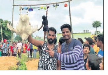
କରିଥିଲେ ଗଣ୍ଡାଡ଼ିଆଁ। ସାହି ନିକଟରେ ଥିବା ଗୋରମୁଣ୍ଡା ପୋଖରୀ ନିକଟରେ ହେଇଥିଲା।

ଆଧୁନିକତାର ଚାକଚକ୍ୟ ଭିତରେ ଆଜି ବି ବଞ୍ଚିଛି ସଂସ୍କୃତି ଓ ପରମ୍ପରା। ଗ୍ରାମାଞ୍ଚଳରେ ଯୁବଗୋଷ୍ଠୀ ଗଣ୍ଡା ପୂର୍ଣ୍ଣିମା(ଗଣ୍ଡା ଡିଆଁ) ପାଳନ କରିଛନ୍ତି। ପ୍ରଭୁ ବଳଦେବଙ୍କ ହାତରେ ଗଣ୍ଡାପୁରର ମୃତ୍ୟୁହେବା ପରେ ପୃଥିବୀ ପୃଷ୍ଠରୁ ପାପ କମିଯାଇଥିବାରୁ ଲୋକେ ଆନନ୍ଦରେ ଗଣ୍ଡାଡ଼ିଆଁ ଖେଳ ଖେଳିଥାନ୍ତି ବୋଲି ଲୋକକଥା ରହିଛି। ନବରଙ୍ଗପୁର ସହର ସ୍ଥିତ ମଙ୍ଗରାଜ ସାହିର ଯୁବକମାନେ ଆୟୋଜନ