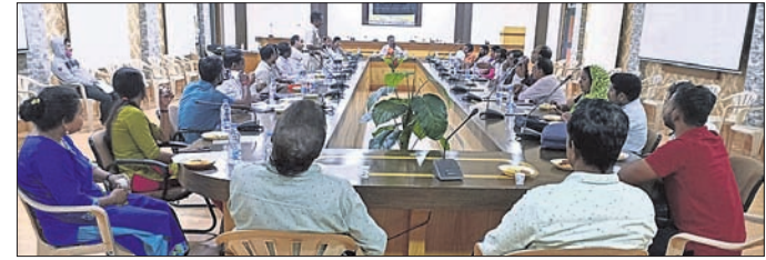
ବୈଠକରେ ଉପସ୍ଥିତ ଅଧିକାରୀମାନେ ନିଶା ନିବାରଣ ନେଇ ଆଲୋଚନା କରୁଛନ୍ତି।