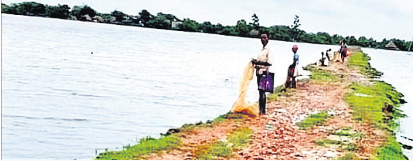
ମହାକାଳପଡ଼ା ବ୍ଲକ ନିପାଣିଆ ଅଞ୍ଚଳ ଚାଷ ଜମିରେ ସମୁଦ୍ରର ଲୁଣା ପାଣି।