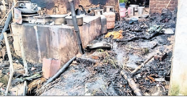
ଜଳ ଯାଇଥିବା ମିଠା ବୋକାଳ ।

ଖଣ୍ଡପଡ଼ା, ୧୧.୮.୨୨ (ସ୍ୱ.ପ୍ର.) ଉର୍ଦ୍ଧ୍ୱ ଚକା ଓ ୧୫ ହଜାର ଚକାର ମିଠା ପୋଡ଼ି ନଷ୍ଟ ହୋଇଯାଇଛି । ଅଗ୍ନିକାଣ୍ଡର ପ୍ରଭାବରେ ଗୃହାଳୟର ବନ୍ଧା ହୋଇଥିବା ଗୋଲାସାହି ଗ୍ରାମରେ ରୁଧିର ରାତି ବିକଳିତ ରାତିରେ ଅଗ୍ନିକାଣ୍ଡ ଘଟିଥିବା ଯୋଗୁଁ ବୋକାଳରୁ କୌଣସି ସାମଗ୍ରୀ ହୋଇଛି ।