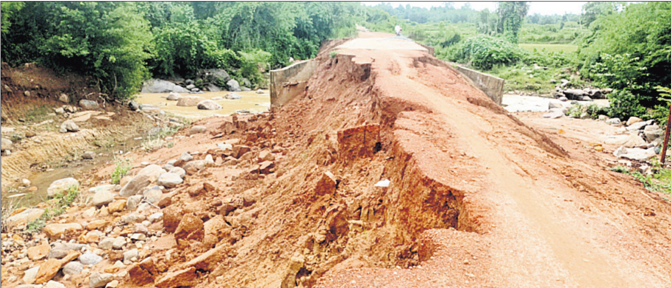
ଫୋଲ ପାର୍ଶ୍ୱରୁ ଧୋଇ ହୋଇଯାଇଥିବା ମାଟି ।

ନୂଆଗାଁ, ୧୧.୮.୨୨ (ଡି.ଏନ.ଏ.) ନୟାଗଡ଼ ଜିଲା ନୂଆଗାଁ ବ୍ଲକ୍ ବାଲଖାଠାରୁ ଅଭିଯୋଗ, ଏପରି କି ଭୋଟ ବର୍ଦ୍ଧନ ନିଷ୍ପତ୍ତି ବରକୋଳକୁ ସଂଯୋଗ କରୁଥିବା ପ୍ରଧାନମନ୍ତ୍ରୀ ସଡ଼କ ଯୋଜନାରେ ନିର୍ମାଣପାଇଁ ଫୋଲ ପାର୍ଶ୍ୱରୁ ମାଟି ଧୋଇ ହୋଇଯାଇଛି ।