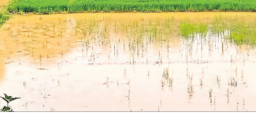
ପକାମୁଣ୍ଡା ଅଞ୍ଚଳରେ ଚାଷ ଜମିରେ ରୁଆ ହୋଇଥିବା ଧାନ ଚଳି ପାଣିରେ ବୁଡ଼ି ରହିଛି।