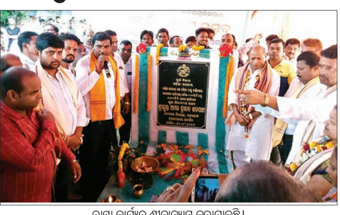
ରାସ୍ତା କାର୍ଯ୍ୟର ଶିଳାନିର୍ମାଣ କରାଯାଇଛି।