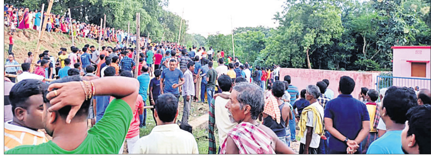
ସିଧାମୂଳାଠାରେ ଆୟୋଜିତ ଗହ୍ମାଡ଼ିଆଁ ବେସ୍ତା ପାଇଁ ଲୋକଙ୍କ ଭିଡ଼ ।

ଉତ୍କଳୀୟ ଧର୍ମ ସଂସ୍କୃତିର ପ୍ରତୀକ ଗହ୍ମା ପର୍ବ । ଏହି ପର୍ବ ଓଡ଼ିଶାର ପୁରପଲ୍ଲୀରେ ଶ୍ରାବଣ ପୂର୍ଣ୍ଣିମା ଦିନ ମହାଆଡ଼ମ୍ବର ସହକାରେ ପାଳନ କରାଯାଇଥାଏ । ଏହାକୁ ମଧ୍ୟ ବଳରାମଙ୍କ ଜନ୍ମ ତିଥି ଭାବେ ଗ୍ରହଣ କରାଯାଇଛି ।