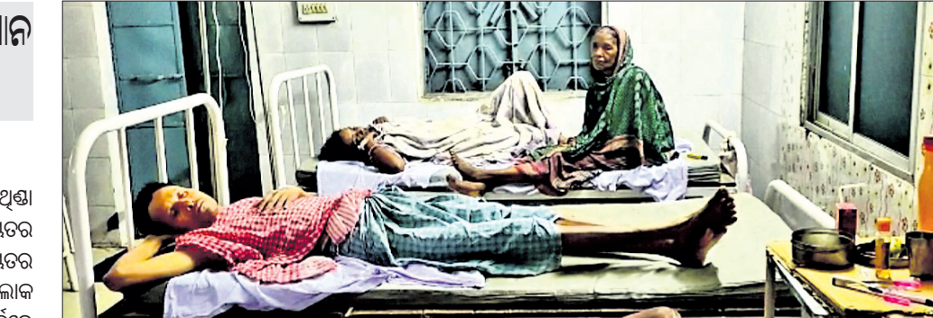
ଲଖନପୁର ଗୋଷ୍ଠୀ ସ୍ଵାସ୍ଥ୍ୟକେନ୍ଦ୍ରରେ ଚିକିତ୍ସିତ ହେଉଥିବା ରୋଗୀ।