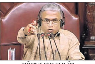
ହରିବଂଶ ନାରାୟଣ ସିଂହ

ଦୁଆବିଲ୍ଲା, ୧୧।୮ ବିହାର ମୁଖ୍ୟମନ୍ତ୍ରୀ ନୀତୀଶ କୁମାର ଭାଙ୍ଗିବା ପରେ ସମ୍ପର୍କ ଛିନ କରି ରାଷ୍ଟ୍ରୀୟ ଜନତା ଦଳ (ଆରଜେଡି) ସମର୍ଥନରେ ସରକାର ବଦଳାଇଛନ୍ତି। ଏହି ରାଜନୈତିକ ଘଟଣାକ୍ରମ ପରେ ରାଜ୍ୟ ସଭା ଉପାଧ୍ୟକ୍ଷ ହରିବଂଶ ନାରାୟଣ ସିଂହ ଭବିଷ୍ୟତ ଅନିଶ୍ଚିତ ଭାବରେ କୁହାଯାଇଛି। ସଂଯୁକ୍ତ ଜନତା ଦଳ (ଜେଡିୟୁ) ଏମ୍‌ପି ହରିବଂଶ ଉପସ୍ଥିତରେ ଉପାଧ୍ୟକ୍ଷ ପଦ ଛାଡ଼ିବେ କି ନାହିଁ ତାକୁ ନେଇ ନାନା କଳ୍ପନାଜଳ୍ପନା ପ୍ରକାଶ ପାଉଛି। ହରିବଂଶ ଏ ନେଇ ଅଧ୍ୟାପକ ପୂର୍ଣ୍ଣ ଖୋଲି ନାହାନ୍ତି। ତେବେ ସେ ଖୁବଶୀଘ୍ର ନୀତୀଶଙ୍କୁ ଭେଟି ପରବର୍ତ୍ତୀ କାର୍ଯ୍ୟପଦ ଛାଡ଼ି କରିବେ। ଜେଡିୟୁ ଅଧ୍ୟକ୍ଷ ରାଜୀବ ରଞ୍ଜନ ସିଂହ ଓଡ଼ିଆ ଲଲିତ ସିଂହ କହିଛନ୍ତି, ନୀତୀଶଙ୍କୁ ଏମ୍‌ପିରେ ସାମିଲ ହେବା ପାଇଁ ପରାମର୍ଶ ଦେଇଥିବା ନେତାଙ୍କ ମଧ୍ୟରେ ହରିବଂଶ ସାମିଲ ଥିଲେ। ରାଜନୈତିକ