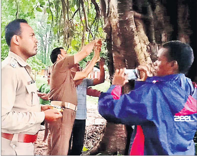
ଗ୍ରାମବାସୀ ଗଛରେ ରାଖି ବାଣିଛନ୍ତି।