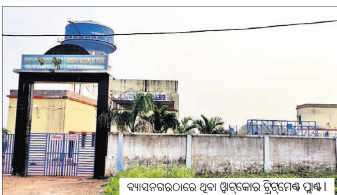
ବ୍ୟାସନଗରଠାରେ ଥିବା ଝାଡ଼କୋର ଡ୍ରିଟ୍‌ମେଣ୍ଟ ପ୍ଲାଣ୍ଟ।

ଯାଜପୁର ଜିଲାର ବ୍ୟାସନଗର ପୌରାଞ୍ଚଳବାସୀଙ୍କୁ ନିୟମିତ ଭାବେ ଗୋଲିଆ ପାଣି ଯୋଗାଣ କରି ଝାଡ଼କୋ ଝାଡ଼ାବାଡ଼ିକୁ ଆମନ୍ତ୍ରଣ କରୁଛି ବୋଲି ଚର୍ଚ୍ଚା ହେଉଛି। ନିକଟରେ ରାଜ୍ୟର ରାୟଗଡା, କୋରାପୁଟ, ନବରଙ୍ଗପୁର, ସୋନପୁର, ନୂଆପଡା, ଗଜପତି ଓ ଝାରସୁଗୁଡା ଜିଲାର ଝାଡ଼ାବାଡ଼ି ସଂକ୍ରମଣ ହୋଇଥିବାରୁ ଶତାଧିକ ଲୋକ ଆକ୍ରାନ୍ତ ହୋଇଥିଲେ। ଏହି ପରିପ୍ରେକ୍ଷାରେ ରାଜ୍ୟ ଗ୍ରାମ୍ୟ ଜଳଯୋଗାଣ ଓ ପରିମଳ(ଆରଡୁକ୍ସଏସଏ) ବିଭାଗ ପକ୍ଷରୁ ସଂପୂର୍ଣ୍ଣ ଅଧ୍ୟାୟତ୍ତ ଓ ନିର୍ବାହୀ ଯନ୍ତ୍ରାମାନଙ୍କୁ ପ୍ରତି ସପ୍ତାହରେ ରିପୋର୍ଟ ଦାଖଲ କରିବାକୁ ନିର୍ଦ୍ଦେଶ ଦେଇଛନ୍ତି। କିନ୍ତୁ ବ୍ୟାସନଗର ସହରବାସୀଙ୍କୁ ଗୋଲିଆ ପାଣି ଯୋଗାଣ କରି ଝାଡ଼କୋ କେବଳ ଅପରାଧ୍ୟ କାର୍ଯ୍ୟ କରୁନାହିଁ ବରଂ ଲୋକଙ୍କ ଜୀବନ ସହ ଖେଳ ଖେଳୁଛି ବୋଲି ଅଭିଯୋଗ ହେଉଛି। ଅପରପକ୍ଷେ ବିଭାଗୀୟ କର୍ତ୍ତୃପକ୍ଷ ବିଭିନ୍ନ ଆକଦେଖାଳ ଏହାକୁ ଅତି ହାଲୁକା ଭାବେ ନେବା ସାଧାରଣରେ ଅସନ୍ତୋଷ ସୃଷ୍ଟି କରିଛି। ମରାମତିଠାରୁ ଆରମ୍ଭ କରି ବିଭିନ୍ନ ଆକଦେଖାଳ ଝାଡ଼କୋ ଲକ୍ଷ୍ୟକ୍ଷମ କରିବା ବ୍ୟୟ କରୁଥିବାବେଳେ ଗୋଲିଆ ପାଣି ଯୋଗାଣ ନେଇ ସହରବାସୀଙ୍କ