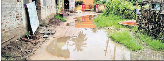
ରାସ୍ତା ପାର୍ଶ୍ୱରୁ ଯିବା ପଥ ଅବରୋଧ ଯୋଗୁ ଜମି ରହିଛି।