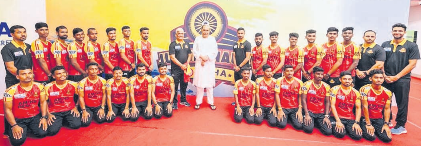
ଜର୍ସି ଉନ୍ମୋଚନ ଅବସରରେ ମୁଖ୍ୟମନ୍ତ୍ରୀ ନବୀନ ପଟ୍ଟନାୟକଙ୍କ ସହ ଓଡ଼ିଶା ଜଗରନଟ୍ ଦଳ।