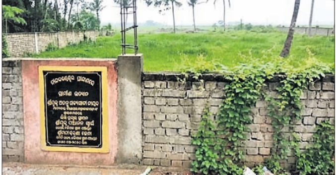
ଶ୍ରୀନୀଳକଣ୍ଠେଶ୍ୱର ଗ୍ରାମୀଣ ପାର୍କ ଅନାବନା ଗଛରେ ଭର୍ତ୍ତି ହୋଇଛି।