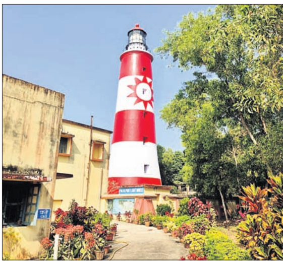
ଫଲ୍ଡ ପଏଣ୍ଟ ବା ବତିଘର ମୂଳସାକ୍ଷୀ ବ୍ରିଟିଶ ଡୋପ।