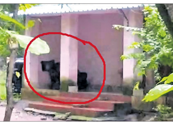
ଜଣେ ବ୍ୟକ୍ତିଙ୍କ ପିଣ୍ଡାରେ ଛିଡ଼ା ହୋଇଥିବା ଭାଲୁ।

ଆନନ୍ଦପୁର, ୧୧/୮ (ସ.ପ୍ର.) ବଣ ଜଙ୍ଗଲରେ ବନ୍ୟପ୍ରାଣୀ ଚଳପ୍ରଚଳ କରିବା ଏକ ସାଧାରଣ କଥା। ହେଲେ ଗାଁ ଦାଣ୍ଡରେ ଦିନରେ ଭାଲୁ ବୁଲିବା, ଘରର ପିଣ୍ଡାରେ ବସିବା ଦେଖିଲେ ଯେ କେହି ବି ଚକିତ ହେବ। ଏଭଳି ଦୃଶ୍ୟ କେନ୍ଦ୍ରରେ ଜିଲ୍ଲା ଘସିପୁରା ବ୍ଲକ ପୁରୁଣାବାନ୍ଧଗଡ଼ା ଗ୍ରାମରେ ଦେଖିବାକୁ ମିଳିଛି। ଆନନ୍ଦପୁର ବନ୍ୟପ୍ରାଣୀ ବନଖଣ୍ଡ ଅଧୀନ ବରାଙ୍ଗ ଏନ୍‌କ୍ସିଟ ଜଙ୍ଗଲକୁ ମା' ଛୁଆ ମିଶି ୩ ଭାଲୁ ବାହାରି ପୁରୁଣାବାନ୍ଧଗଡ଼ା ଗ୍ରାମରେ ଗୁରୁବାର ବୁଲିବୁଲି କରିଥିଲେ। ଗାଁ ଲୋକେ ପାଟି କରିବାକୁ ସେମାନେ ଜଙ୍ଗଲକୁ ପକାଇଥିଲେ। ଖାଦ୍ୟ ଅଭାବରେ ଭାଲୁ ତିନୋଟି ଗାଁ ମୁହାଁ ହୋଇଥିବା ଜଣାପଡ଼ିଛି। ବରାଙ୍ଗ ଜଙ୍ଗଲରୁ ଅଧିକାଂଶ ସମୟରେ ଭାଲୁ ଗାଁ ମୁହାଁ ହେଉଥିବାରୁ ଗ୍ରାମବାସୀ ଆତଙ୍କିତ ଅବସ୍ଥାରେ ରହୁଛନ୍ତି। ବନ ବିଭାଗ ଏଥିପ୍ରତି ସ୍ଵତନ୍ତ୍ର ଦୃଷ୍ଟି ଦେବାକୁ ଦାବି ହେଉଛି।