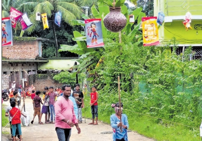
କଣେ ପ୍ରତିଯୋଗୀ ହାଣ୍ଡି ଭାଙ୍ଗିବାକୁ ଆସୁଛନ୍ତି ।

ନୟାଗଡ଼ ଜିଲା ନୂଆଗାଁ ଉଠାଣିସାହିରେ ଗୁରୁବାର ଗହ୍ମା ପୂର୍ଣ୍ଣିମା ଉପଲକ୍ଷେ ଦହି ହାଣ୍ଡି ଖେଳ ଅନୁଷ୍ଠିତ ହୋଇଥିଲା । ଭଉଣୀ ହାତରୁ ରାଖା ବାନ୍ଧି ସାରିବା ପରେ ଆରମ୍ଭ ହୋଇଥିଲା ଦହିହାଣ୍ଡି ପ୍ରତିଯୋଗିତା ।