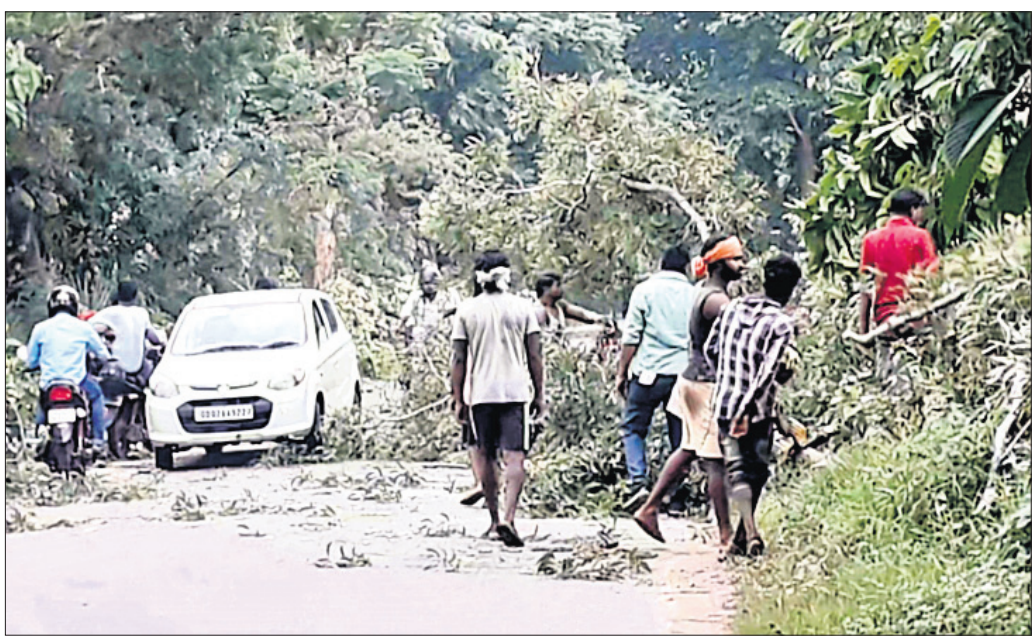
କଟକ-ନୂଆଗାଁ ୫୫ ନଂ. ଜାତୀୟ ରାଜପଥ ସମ୍ପ୍ରସାରଣ ପାଇଁ ରାସ୍ତା ପାର୍ଶ୍ୱରୁ ବନ ବିଭାଗ ପକ୍ଷରୁ ଗଛ କଟାଯାଇଛି।