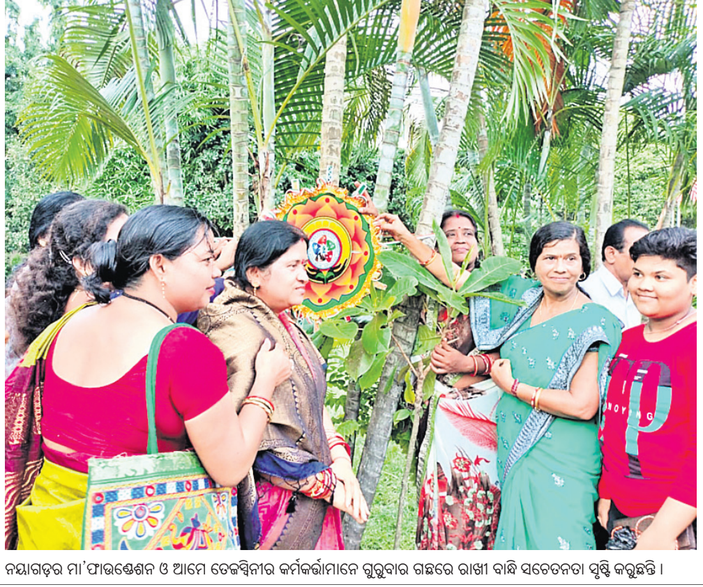
ନିୟାମତର ମା' ଫାଉଣ୍ଡେସନ ଓ ଆମେ ତେଜସ୍ୱିନୀର କର୍ମକର୍ମୀମାନେ ଗୁରୁବାର ଗଛରେ ରାଖି ବାଣି ସଚେତନତା ସୃଷ୍ଟି କରୁଛନ୍ତି