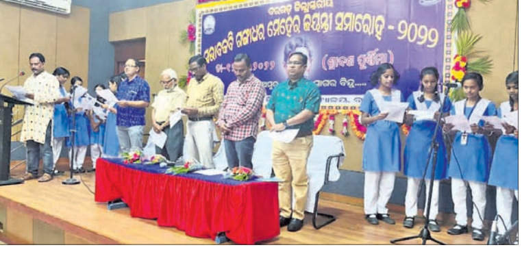
ବରଗଡ଼ ବିଜ୍ଞାନ କେନ୍ଦ୍ରରେ କବି ଗଙ୍ଗାଧରଙ୍କ ରଚିତ କବିତାକୁ ସାମୁହିକ ଗାନ କରାଯାଇଛି।