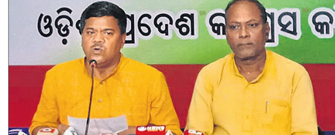
ଖବରଦାତା ସମ୍ମିଳନୀରେ କଂଗ୍ରେସ ନେତୃବୃନ୍ଦ।

ରାଜ୍ୟରେ ଆବାସ ଘର ବ୍ୟବସାୟ ସମ୍ପର୍କିତ ଶ୍ରେତପତ୍ର ଜାରି କରିବାକୁ ଦାବି