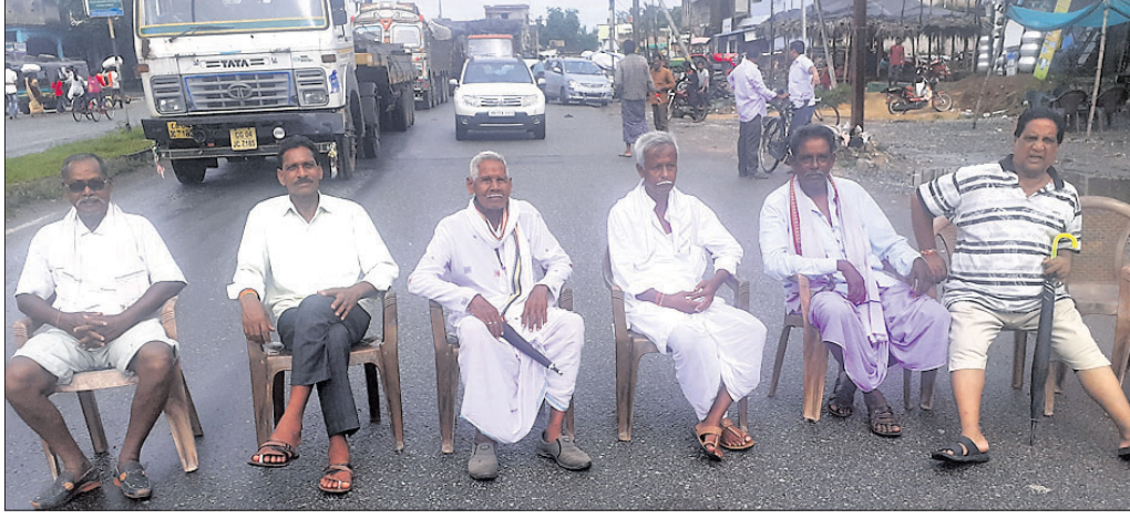
ଚାଷୀମାନେ ରାସ୍ତା ଅବରୋଧ କରିଛନ୍ତି।