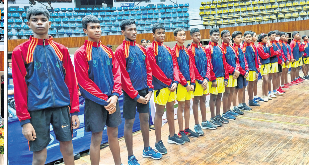
କଟକର ଜବାହରଲାଲ ନେହେରୁ ଇନ୍ଡୋର ସ୍ଥାଡିୟମରେ ଶୁକ୍ରବାର ଆନ୍ଧ୍ର-ସ୍ଥୁଲ ଏବଂ ଓଡ଼ିଶା ଟେଣିସ୍ ଚେମ୍ପିୟନଶିପ୍ରେ ଉଦ୍‌ଘାଟନା ସମାରୋହରେ ଉପସ୍ଥିତ ଅତିଥି ଏବଂ ଖେଳାଳିମାନେ।