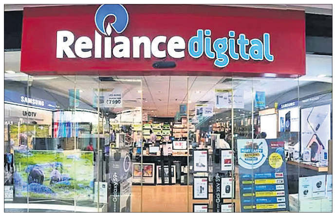
ଡିଜିଟାଲ ଇଣ୍ଡଷ୍ଟ୍ରି ସେଲ୍ ସହ ଆକର୍ଷଣୀୟ ଅଫର ଘୋଷଣା

ଦେଶର ପ୍ରମୁଖ ବାଣିଜ୍ୟିକ ପ୍ରତିଷ୍ଠାନ ରିଲାଏନ୍ସ ଇଣ୍ଡଷ୍ଟ୍ରି (ଆର୍.ଆଇ.ଏଲ୍) ର ଡିଜିଟାଲ ଟେକ୍ନୋଲୋଜି ଡିଭିଜନ୍ ରିଲାଏନ୍ସ ଡିଜିଟାଲ ପକ୍ଷରୁ ଭାରତର ସର୍ବବୃହତ୍ ଇଲେକ୍ଟ୍ରୋନିକ୍ସ ସେଲ୍ ସମ୍ପର୍କରେ ଘୋଷଣା କରାଯାଇଛି। ଏଠାରେ ବର୍ତ୍ତମାନ ସମସ୍ତ ବର୍ଗରେ ଆକର୍ଷଣୀୟ ଅଫର ସହ ଅନେକ ସୁବିଧା ସମୃଦ୍ଧ ୧୬ ପର୍ଯ୍ୟନ୍ତ ଉପଲବ୍ଧ ରହିଛି। ସେହିଭଳି ଏଠାରେ ଫୋନ୍, ଲାପ୍‌ଟପ୍, ଟିଭି, କିଚେନ ଓ ରୁଟ୍ ଉପକରଣ ଭଳି ଆହୁରି ଅନେକ ସାମଗ୍ରୀ କମ୍ପାନୀର ରିଲାଏନ୍ସ ଡିଜିଟାଲ, ମାଲ୍ ଡିପ୍ ଷ୍ଟୋର ଓ ରିଲାଏନ୍ସ ଡିଜିଟାଲ (ଅନୁଲାଇନ୍) ରେ ଲିଷ୍ଟାକିଣା କରିପାରିବେ। ଏହି ପରିପ୍ରେକ୍ଷୀରେ ଆଧୁନିକ ଅଲଗ୍ରା ହାଲ୍