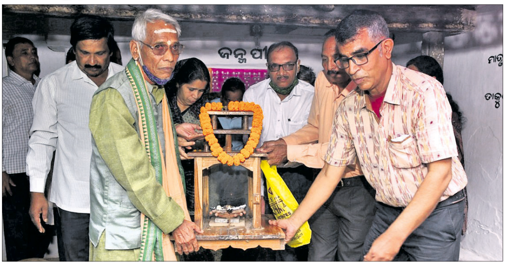
ବରପାଲି କବି ଭବନରୁ ଗଙ୍ଗାଧର କୋଟି ବାହାରିଥିଲା।

ବରଗଡ଼ ଅପ୍ଟିମ୍, ୧୨୮୮ ଗଙ୍ଗାଧର ସାହିତ୍ୟ କୃତି କେବଳ ଓଡ଼ିଆ ସାହିତ୍ୟକୁ ସମୃଦ୍ଧ କରିନାହିଁ। ବରଗଡ଼ ବିଜ୍ଞାନ ପ୍ରତିଷ୍ଠାନର ଗଙ୍ଗାଧରଙ୍କ ଦ୍ୱାରା ରଚିତ କବିତାକୁ ସାମୁହିକ ଗାନ କରାଯାଇଛି।