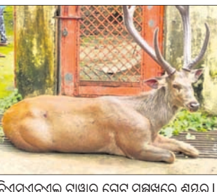
ବିଷୟବସ୍ତୁ ଗାଈର ଗେଡ଼ ସମ୍ମୁଖରେ ଶମ୍ଭର।

ପାଲକମାଳ, ୧୨୮୮ (ଡି.ଏନ.ଏ.): ବରଗଡ଼ ଜିଲ୍ଲା ନୃସିଂହନାଥ ଫରୋଷ୍ଟ ରୋଷ୍ଟି ଅଞ୍ଚଳରେ ଥିବା ବିଷୟବସ୍ତୁ ଗାଈର ଗେଡ଼ ସମ୍ମୁଖରେ ଶମ୍ଭର ଅପରାଧରେ ଏକ ଶମ୍ଭର ଆହତ ଅବସ୍ଥାରେ ପଡ଼ିଥିଲା।