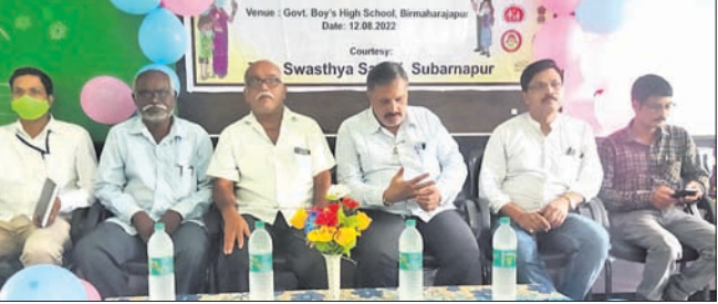
ଜାତୀୟ କୃମିନାଶ ଦିବସ ପାଳନ ଅବସରରେ ମଞ୍ଚାସୀନ ଅତିଥି।