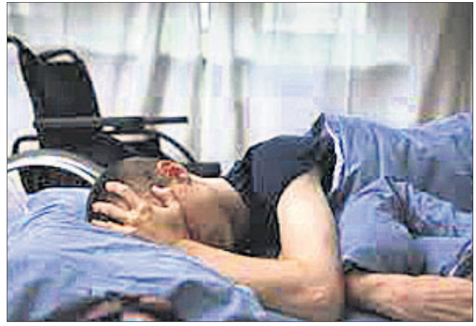
ଅଧିକ ବିବିଡ଼ିଯାଇଥିବା କୁହାଯାଉଛି। ମ୍ୟାଲକିକ୍ ଇନ୍‌ସେଫାଲୋପାଲିଟିଭ୍ କ'ଣ? ମ୍ୟାଲକିକ୍ ଇନ୍‌ସେଫାଲୋପାଲିଟିଭ୍

ଦିଲ୍ ରୋଗରେ ଆକ୍ରାନ୍ତ ଜଣେ ୪୨ ବର୍ଷୀୟ ବ୍ୟକ୍ତି ଇଚ୍ଛାମୃତ୍ୟୁ ନିଷ୍ପତ୍ତି ନେଇଛନ୍ତି। ପ୍ରତ୍ୟେକ ଦେଶରେ ଇଚ୍ଛାମୃତ୍ୟୁ ପାଇଁ ବିଭିନ୍ନ ଆଇନ ରହିଥିବାରୁ ସେ ସୁଅନେସିଆ ଲାଗି ସୁରଜରଲାଣ୍ଡ ଯିବାକୁ ବାହାରିଛନ୍ତି। ତେବେ ଏହାକୁ ବିରୋଧ କରି ତାଙ୍କ ବାନ୍ଧବୀ ଦିଲ୍ଲୀର ଏକକୋର୍ଟରେ ଆବେଦନ କରିଛନ୍ତି। ସୁରଜରଲାଣ୍ଡ ଯିବା ପାଇଁ ତାଙ୍କୁ ପାସ୍‌ପୋର୍ଟ ଦିଆ ନ ଯାଇ ବୋଲି ମହିଳା ଜଣକ ପିଟିଂଗରେ ଉଲ୍ଲେଖ କରିଛନ୍ତି। ୨୦୧୪ରୁ ବ୍ୟକ୍ତି ଜଣକ ମ୍ୟାଲକିକ୍ ଇନ୍‌ସେଫାଲୋପାଲିଟିଭ୍ ରୋଗରେ ଆକ୍ରାନ୍ତ ଥିବାରୁ ଚିକିତ୍ସା କରିପାରୁ ନାହାନ୍ତି। ତାଙ୍କ ଶାରୀରିକ ଯତ୍ନ ବିନା ଦିନ ବଢ଼ିବାରେ ଲାଗିଛି। ବର୍ତ୍ତମାନ ସେ ଶଯ୍ୟାଶାୟୀ। କରୋନା