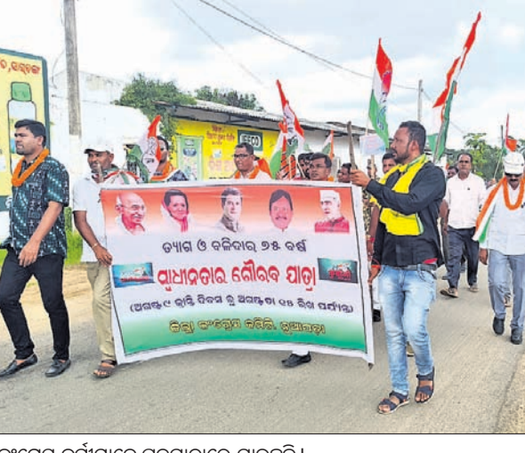
କଂଗ୍ରେସ କର୍ମୀମାନେ ପଦଯାତ୍ରାରେ ଯାଉଛନ୍ତି।