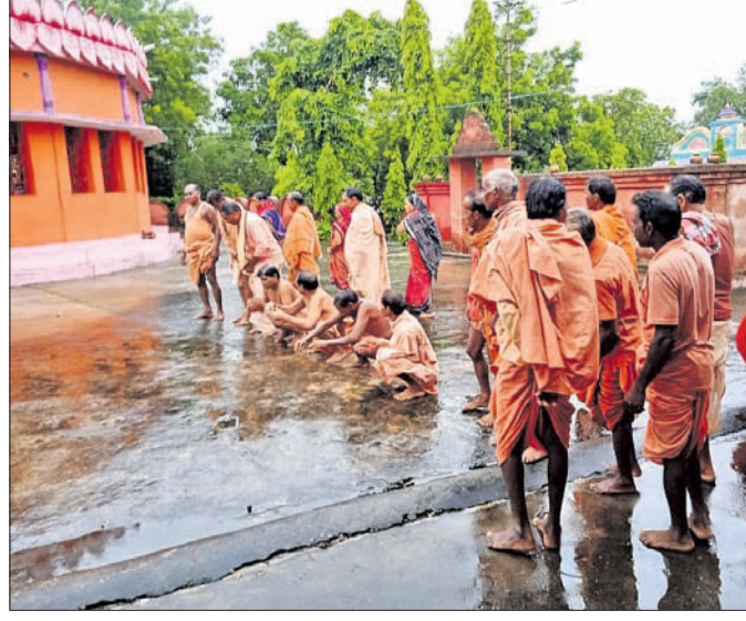
ମହିମା ଆଶ୍ରମରେ ସାଧୁସଙ୍ଗମାନେ ନବୀନ ଭକ୍ଷଣ କରୁଛନ୍ତି।

ଝାରସୁଗୁଡ଼ା ଅଧିକ, ୧୨୮: ଝାରସୁଗୁଡ଼ା ଗଜନ ଥାନା ଅଧୀନ ୪୯୯ ନଂ ଜାତୀୟ ରାଜପଥ କୁମୁଡ଼ାପାଲି ନିକଟରେ ନିକଟରେ ଶୁକ୍ରବାର ଏକ ଅଜଣା ଗାଡ଼ି ଧକ୍କାରେ ଜଣେ ଯୁବକଙ୍କ ମୃତ୍ୟୁ ହୋଇଛି। ମୃତକଙ୍କ ପରିଚୟ ମିଳିପାରିନାହିଁ। ତାଙ୍କ ବୟସ ୩୦ରୁ ୩୫ବର୍ଷ ହେବ ବୋଲି ପୋଲିସ୍ ଅନୁମାନ କରୁଛି। ପୋଲିସ୍ ମୃତଦେହ ଜବତକରି ଡିଲା ମୁଖ୍ୟ ଡିକିହାଲସ୍ ଶବ୍ଦସଂକ୍ଷଣ(ମର୍ଗ)ରେ ରଖିଛି। ଶନିବାର ବ୍ୟବହୃତ କରାଯିବ ବୋଲି ପୋଲିସ୍ କହିଛି।