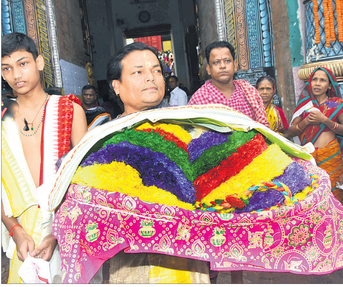
ରଞ୍ଜାପୁରୀର ଅବସରରେ ଶୁକ୍ରବାର ମହାପ୍ରଭୁ ଶ୍ରୀଜଗନ୍ନାଥଙ୍କ ପାଇଁ ପ୍ରସ୍ତୁତ ପାଟ ରାଖାକୁ ପାଟରା ସେବକ ଶ୍ରୀମନ୍ଦିରକୁ ନେଉଛନ୍ତି।

ଓଡ଼ିଆ ଜଗତମାଳି ଓ ଲୋକଗୀତ - ପ୍ରଫୁଲ୍ଲ ସଂପାଦକ