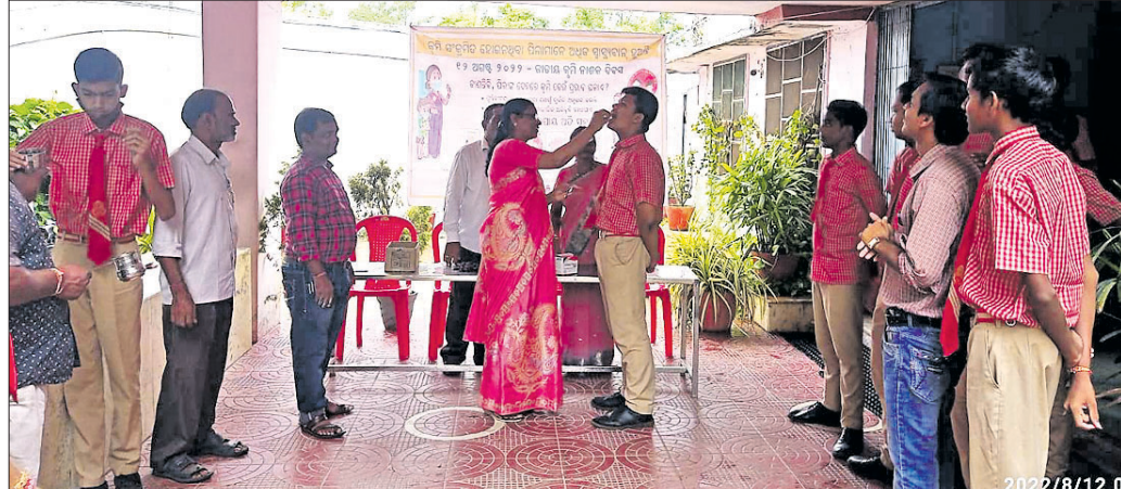
କୋଶଳ ସ୍କୁଲରେ ଅନୁଷ୍ଠିତ କୃମିନାଶ ଦିବସ।