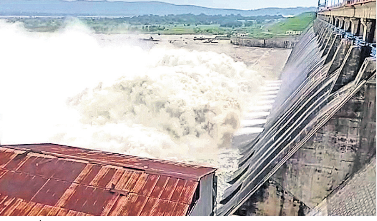
ଉପରପୁଣ୍ଡରେ ବର୍ଷା ଜାରି ରହିଥିବାରୁ ହାରାକୁଦ ଜଳଭଣ୍ଡାରକୁ ଜଳ ପ୍ରବେଶ ପରିମାଣ ବୃଦ୍ଧି ପାଇଛି । ଏହାକୁ ଦୃଷ୍ଟିରେ ରଖି ଶୁକ୍ରବାର ୨୦ଟି ଗେଟ୍ ଦେଇ ଜଳ ନିଷ୍କାସନ କରାଯାଇଛି ।

ଶୁକ୍ରବାର ରାତି ୧୦୦୧ ପୂଜା (+ ଅନ୍ୟ ରୋଗରେ କରୋନା ଆକ୍ରାନ୍ତ ମୃତ୍ୟୁ) ତଥ୍ୟ: https://www.worldometers.info/coronavirus/ ଏବଂ ଓଡ଼ିଶା ସରକାର