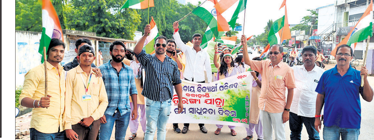
ଜୁନାଗଡ଼ରେ ଏବିଜିପି ପକ୍ଷରୁ ଡିମାନ୍ଦ ଯାତ୍ରା।