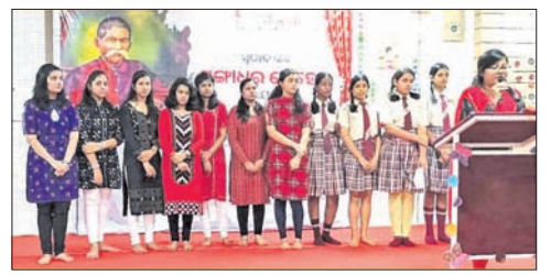
ସମ୍ବଲପୁର ବିକାଶ ଅନୁଷ୍ଠାନର ଛାତ୍ରାଛାତ୍ର ସଂଗୀତ ଗାନ କରୁଛନ୍ତି।