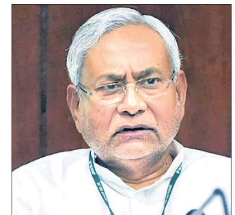
'ହାତ ଯୋଡ଼ି କହୁଛି, ମୋର ପ୍ରଧାନମନ୍ତ୍ରୀ ହେବା ମହତ୍ତ୍ୱାକାଂକ୍ଷୀ ନାହିଁ। ମୁଁ ସମଗ୍ରଙ୍କ ପାଇଁ କାମ କରିବି। ସବୁ ବିରୋଧୀ ଦଳକୁ ଏକାଠି କରିବା ଲାଗି ଉଦ୍ୟମ କରି ରଖିବି। -ନାଟାଶ କୁମାର, ବିହାର ମୁଖ୍ୟମନ୍ତ୍ରୀ

ନୂଆଦିଲ୍ଲୀ, ୧୨।୮ ଏନଡିଏରୁ ଗୋଟିଏ ପରେ ଗୋଟିଏ ସହଯୋଗୀ ଦଳ ଉଦ୍‌ଯତୀରେ ଲାଗିଛନ୍ତି। ଏହିକ୍ରମରେ ନିକଟରେ ଭାଜପା ସହ ସମ୍ପର୍କ ଛିନ୍ନ କରି ସଂଯୁକ୍ତ ଜନତା ଦଳ ବିହାର ମୁଖ୍ୟମନ୍ତ୍ରୀ ନାଟାଶ କୁମାର ରାଷ୍ଟ୍ରୀୟ ଜନତା ଦଳ (ଆରଜେଡି) ନେତୃତ୍ୱାଧୀନ ମହାମେଣ୍ଡ ସମର୍ଥନରେ ସରକାର ବଦଳାଇଛନ୍ତି। ନାଟାଶ ଅଗଷ୍ଟ ୧୦ରେ ଅଷ୍ଟମ ଥର ପାଇଁ ମୁଖ୍ୟମନ୍ତ୍ରୀ ରୁପେ ଶପଥ ନେଇଛନ୍ତି। ନାଟାଶ ୮-୧୦ ମାସ ପରେ ବର୍ତ୍ତମାନର ଉପମୁଖ୍ୟମନ୍ତ୍ରୀ ତେଜସ୍ୱୀ ଯାଦବଙ୍କୁ ମୁଖ୍ୟମନ୍ତ୍ରୀ ଚୈକିତରେ