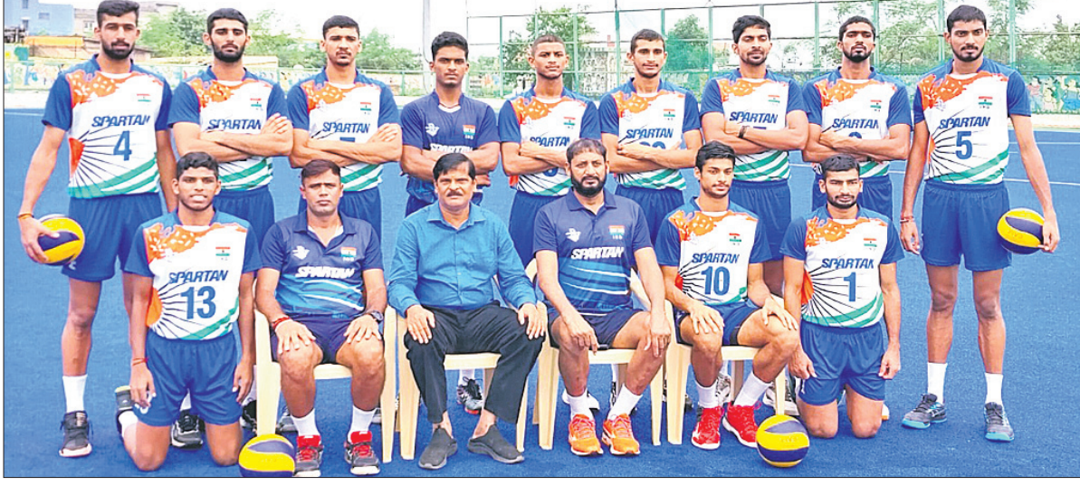
କର୍ମଚାରୀଙ୍କ ଗହଣରେ ୧୮ ବର୍ଷରୁ କମ୍ ଭାରତୀୟ ଭଲିବଲ୍ ଦଳ ।

ରାଜ୍ୟ କ୍ରୀଡ଼ା ବିଭାଗ ପ୍ରତି ଗଭୀର କୃତଜ୍ଞତା ଜଣାଇଛନ୍ତି । ଓଡ଼ିଶା ମହିଳା ପୁରୁଷ ଦଳ କୋଚ୍ କ୍ୟାମ୍ପ ଟିଏମ୍ ପରିସରରେ ୧୧ ତାରିଖରୁ ଆରମ୍ଭ ହୋଇଛି ଏବଂ ଏହା ସେପ୍ଟେମ୍ବର ୨୭ ପର୍ଯ୍ୟନ୍ତ ଚାଲିବ ।