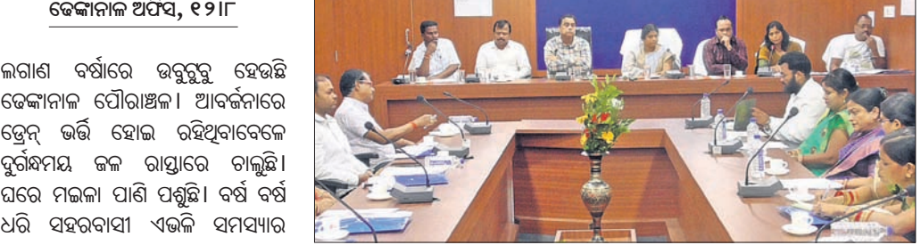
ବୈଠକରେ ବିଧାୟକ, ପୌରାଧିକାରୀ ସମେତ ଅନ୍ୟମାନେ ।

ଡେକାନାଲ ଅଫିସ, ୧୨।୮: ଡେକାନାଲର ପ୍ରସିଦ୍ଧ ଶୈବପୀଠ କପିଳାସରେ ଭାରତୀୟ ପ୍ରତ୍ନତତ୍ତ୍ୱ ସର୍ବେକ୍ଷଣ ସଂସ୍ଥା (ଏସ୍‌ଆଇ) ପକ୍ଷରୁ ସ୍ମୃତି ଫଳକ ପ୍ରଦାନ ଆନୁଷ୍ଠାନିକରେ