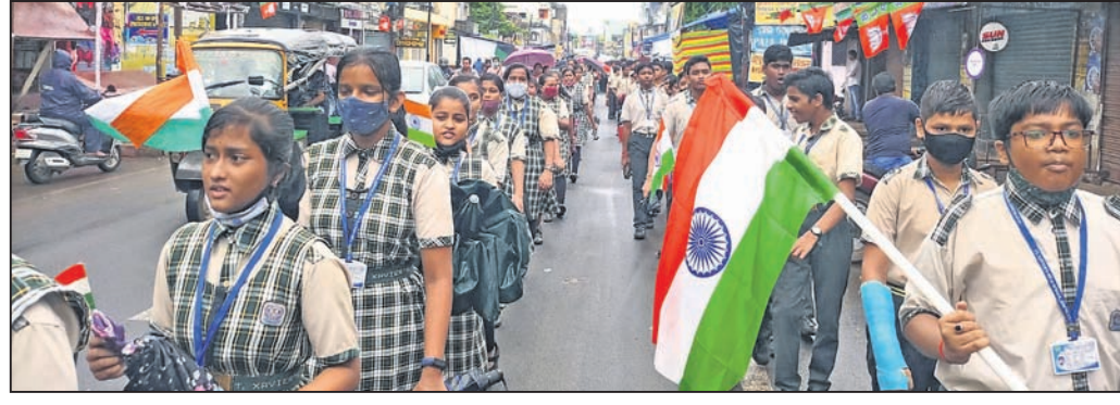
ଡେକାନାଲ ଅଫିସ, ୧୨।୮

ଦୀର୍ଘ ୪ କିଲୋମିଟର ପଦଯାତ୍ରା କରି ଦେଶପ୍ରେମର ବାଣୀ ବାଣିଲେ ୬୦୦ ଛାତ୍ରାଛାତ୍ର । 'ଆଜାଦା କା ଅମୃତ ଭାରତମାତାର ଜୟଗୀତା' ଦେଶପ୍ରେମ ଆଗରେ ଫିକା ପଡ଼ିଲା ପ୍ରବଳ ବର୍ଷା ।