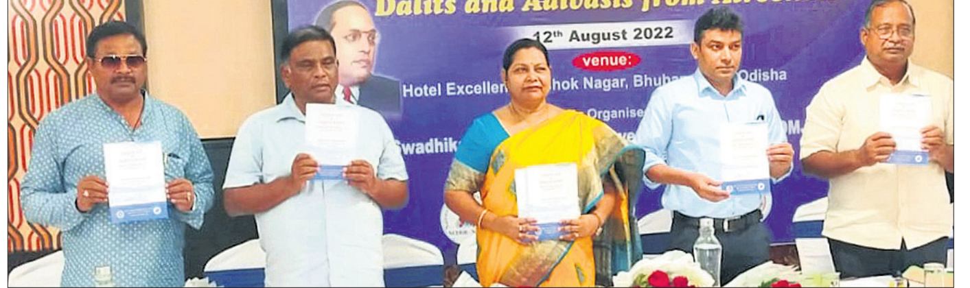
ଅନୁସୂଚିତ ଜାତି ଓ ଅନୁସୂଚିତ ଜନଜାତି (ନିର୍ଯ୍ୟାତନା ନିବାରଣ) ଆଇନ୍ ୧୯୯୮ ଓ ନିୟମାବଳୀ ୧୯୯୫ର ଉଦ୍ଦେଶ୍ୟ ଆଗାଧାରରେ ସଂଗୋଷ୍ଟିତ ସଂସ୍କରଣକୁ ଅତିଥିମାନେ ଲୋକାର୍ପଣ କରୁଛନ୍ତି।

ଭୁବନେଶ୍ୱର, ୧୨।୮ (ବ୍ୟୁରୋ) ଆଧ୍ୟାତ୍ମିକ-ଲୋହିଆ ବିଚାର ମଞ୍ଚ ଓ ନ୍ୟୁଆଦିଲ୍‌ଲାର ନ୍ୟାଶନାଲ ଦଳିତ ମୁକ୍ତିମେଣ୍ଟ ଫର୍ ଇଣ୍ଡିଆ ପକ୍ଷରୁ ଶୁକ୍ରବାର ଆନ୍ତର୍ଜାତୀୟ ଦିନିଆ ପରାମର୍ଶ ଶିବିର ଅନୁଷ୍ଠିତ ହୋଇଯାଇଛି। ସ୍ଥାନୀୟ ଏକ ହୋଟେଲରେ ଆୟୋଜିତ ଏହି କର୍ମଶାଳାରେ ରାଜ୍ୟ ଶିଶୁ ଅଧିକାର ସୁରକ୍ଷା କମିଶନ ଅଧ୍ୟକ୍ଷା ସମ୍ପାଦକ ପ୍ରଧାନ ଯୋଗଦେଇ କହିଲେ, ଦେଶ ଆଜିବାର ଅନୁତ ମହାସହ ପାଳନ କଲାବେଳେ ଆମକୁ ଭେଦଭାବହୀନ