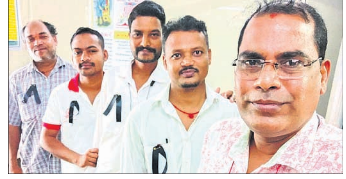
ରକ୍ତଭଣ୍ଡାର କର୍ମଚାରୀମାନେ କଳାବ୍ୟାଜ୍ ପିକି କାର୍ଯ୍ୟକୁ ଉତ୍ସାହୀନ ।

ଅଗ୍ନିଶାଳୀ କର୍ମଚାରୀ କାର୍ଯ୍ୟ କରୁଛନ୍ତି । କରୋନା ସମୟରେ ଜୀବନକୁ ବାଳିକାଗାଳ ସେମାନେ କାମ କରିଛନ୍ତି । ସ୍ୱଳ୍ପ ବେତନ ଯୋଗୁଁ ସମ୍ପୂର୍ଣ୍ଣ କର୍ମଚାରୀ ଓ ସେମାନଙ୍କ ପରିବାର ବୁଦ୍ଧିନରେ ଦିନ କାଟୁଛନ୍ତି । ସରକାରଙ୍କ ଏଭଳି ଅବିଚାର ଦୁର୍ଭାଗ୍ୟପୁର୍ଣ୍ଣ ବୋଲି ସେମାନେ ଅଭିଯୋଗ କରିଛନ୍ତି । ରକ୍ତଭଣ୍ଡାର ଭଳି ଚୈତ୍ତ୍ୱସିଦ୍ଧି, ଶ୍ଯାପନର୍ଯ୍ୟ, ପିଆରଓ, କିରାଣି, ତିଉଓ, ଏସ୍‌ଏସ୍‌ଆଇ, ଆକାଉଣ୍ଟାଣ୍ଟ କାଉନ୍ସିଲର, ପ୍ରୋପାଗାଣ୍ଡା ଅଫିସର, କାରଖାନା ଆଭିଷେଷ, ଆଚେଷ୍ଟାଣ୍ଟ, ସୁଇଚର ଆଦି ପଦବୀରେ