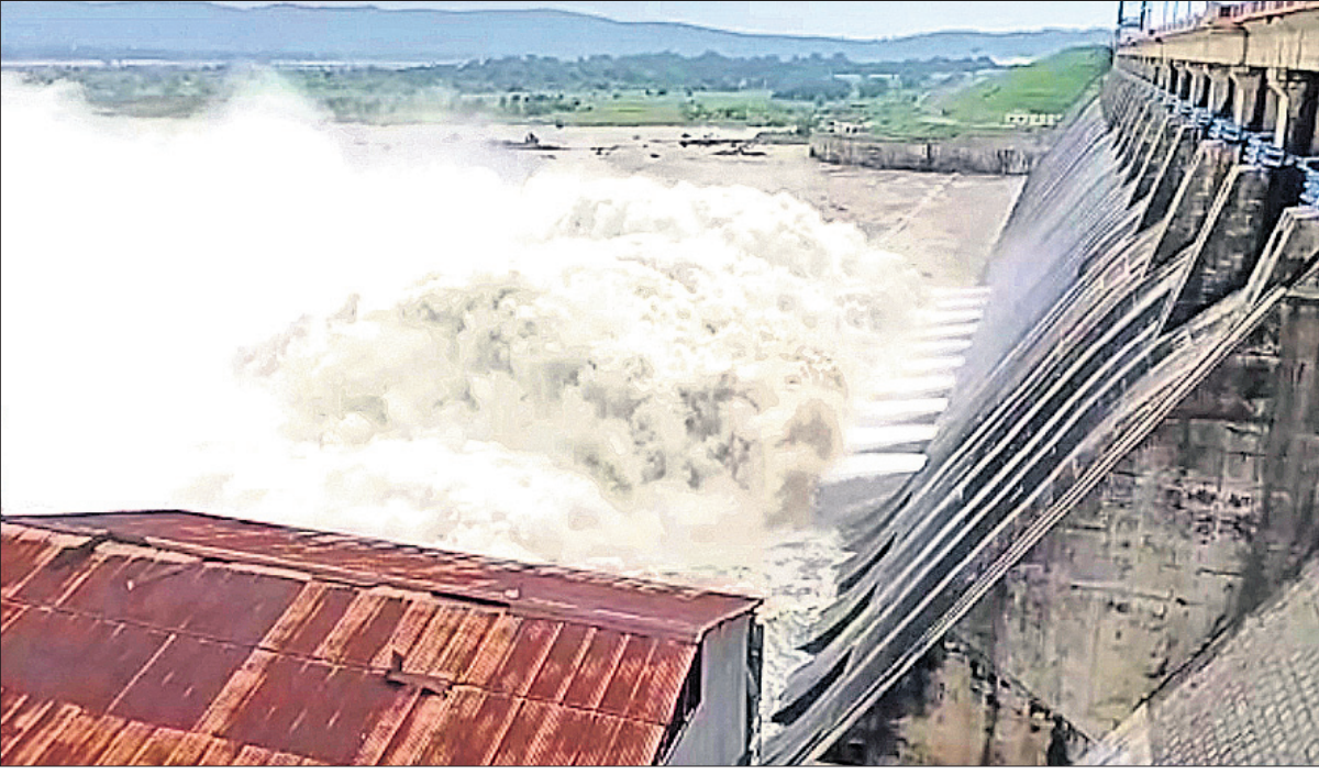
ଉପରପୁଣ୍ଡରେ ବର୍ଷା ଜାରି ରହିଥିବାରୁ ହାରାକୁଦ ଜଳଭଣ୍ଡାରକୁ ଜଳ ପ୍ରବେଶ ପରିମାଣ ବୃଦ୍ଧି ପାଇଛି । ଏହାକୁ ଦୃଷ୍ଟିରେ ରଖି ଶୁକ୍ରବାର ୨୦ଟି ଗେଟ୍ ଦେଇ ଜଳ ନିଷ୍କାସନ କରାଯାଇଛି ।