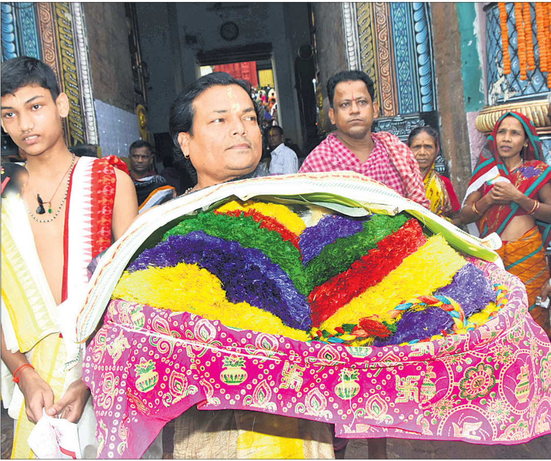
ଗଣ୍ଡାପୁଣ୍ୟ ଆବସରରେ ଶୁକ୍ରବାର ମହାପ୍ରଭୁ ଶ୍ରୀଜଗନ୍ନାଥଙ୍କ ପାଇଁ ପ୍ରସ୍ତୁତ ପାଟ ରାଖାକୁ ପାଟରା ସେବକ ଶ୍ରୀମନ୍ଦିରକୁ ନେଉଛନ୍ତି।