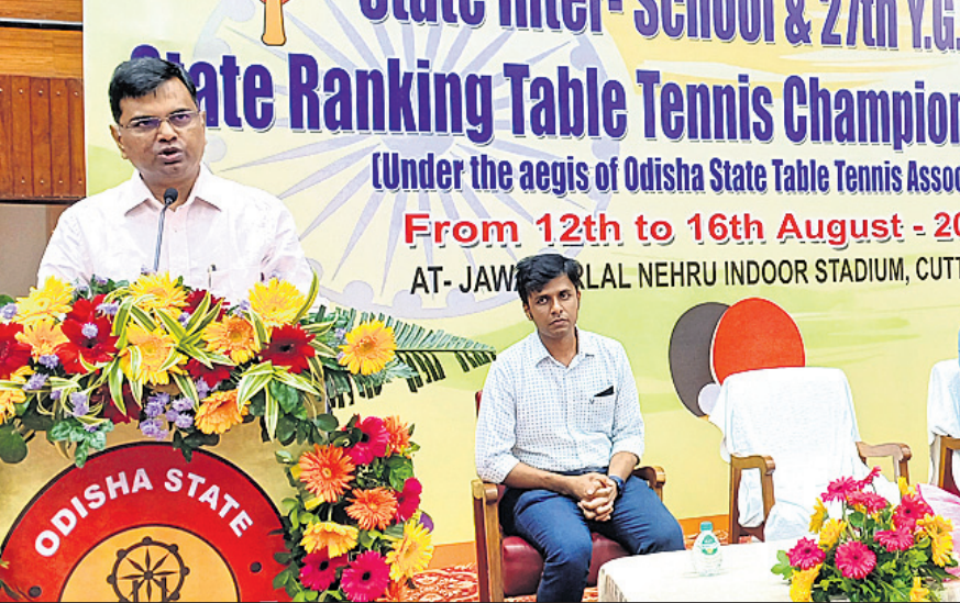
ଭୁବନେଶ୍ୱର, ୧୨।୮ (ବ୍ରାହ୍ମା ପ୍ରତିନିଧି) ଓଡ଼ିଶା ରାଜ୍ୟ ଟେବୁଲ୍ ଟେନିସ୍ ଆସୋସିଏସନ (ଓଏଏଟିଏ) ଆରମ୍ଭରେ ଆନ୍ତଃ-ସ୍କୁଲ ଏବଂ ୨୭ତମ ଓଡ଼ିଆ ଡିଭିଜିଏ ଟେବୁଲ୍ ଟେନିସ୍ ଟୁର୍ନାମେଣ୍ଟ ଶୁକ୍ରବାର କଟକର ଜବାହରଲାଲ ନେହେରୁ ଇନ୍‌ଡୋର ସ୍ଥଳରେ ଉଦ୍‌ଘାଟିତ ହୋଇଛି । ଆନ୍ତଃ-ସ୍କୁଲ ଟୁର୍ନାମେଣ୍ଟରେ ୭୦ଟି ବିଭିନ୍ନ ସ୍କୁଲରୁ ୯୫ ବାଳିକା