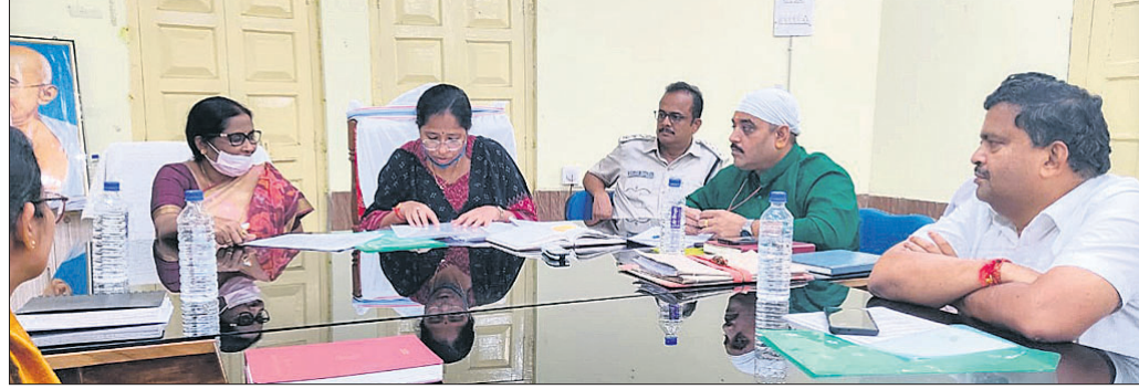
ଉପକ୍ରମାପାଳକ ସମ୍ମିଳନୀ କକ୍ଷରେ ଅନୁଷ୍ଠିତ ବୈଠକରେ ପ୍ରଶ୍ନାତ୍ମକ ଅଧିକାରୀଙ୍କ ସମେତ ଅନ୍ୟମାନେ ।

କମ୍ପାନୀ ନାଁ ବଦଳିଛି । ବଦଳିଛି କମ୍ପାନୀ କର୍ତ୍ତୃପକ୍ଷ ଏବଂ ପରିଚାଳନା କର୍ମଚି । ତେବେ ଏହି ବଦଳିବା ପ୍ରକ୍ରିୟା ମଧ୍ୟରେ ପୁରାତନ କର୍ମଚାରୀଙ୍କ ଭାଗ୍ୟ ଠେଲି ହୋଇଯାଇଛି ଅକ୍ଷୟ ମଧ୍ୟକୁ । କାରଖାନା ପାଇଁ ଜମି ହରାଇ ନିମୁଦ୍ରି ପାଇଥିବା କ୍ଷତିଗ୍ରସ୍ତଙ୍କୁ ଅଲଥାନ କରିବାରେ କୁହୁକୁହୁ ହେଉଛି 'ରିମ୍‌ଫିଲ୍' କମ୍ପାନୀ । ୪ଥର ବୈଠକ ସତ୍ତ୍ୱେ ଏ ବିଷୟରେ ସକାରାତ୍ମକ ପଦକ୍ଷେପ ଗ୍ରହଣ କରାଯାଇ ନ ଥିବାରୁ କର୍ମଚାରୀଙ୍କ ମଧ୍ୟରେ ଅସନ୍ତୋଷ ଚାତୁ ହେବାରେ ଲାଗିଛି ।