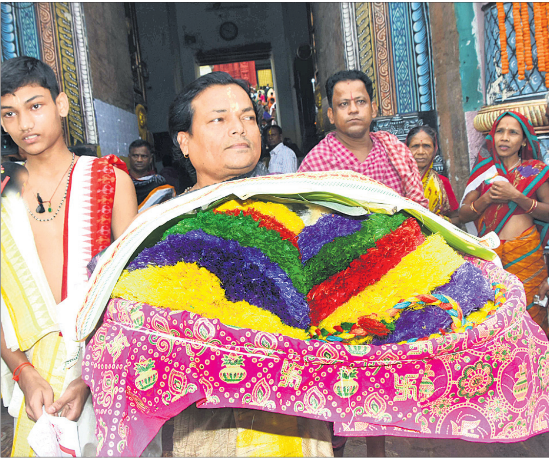
ଗଣ୍ଡାପୁର୍ଣ୍ଣିମା ଅବସରରେ ଶୁକ୍ରବାର ମହାପ୍ରଭୁ ଶ୍ରୀଜୀଉଙ୍କ ପାଇଁ ପ୍ରସ୍ତୁତ ପାଟ ରାଖାକୁ ପାଟରା ସେବକ ଶ୍ରୀମନ୍ଦିରକୁ ନେଉଛନ୍ତି।

ଓଡ଼ିଆ ଜଗତମାଳି ଓ ଲୋକଗୀତ - ପ୍ରଫୁଲ୍ଲ ସମ୍ପାଦନା