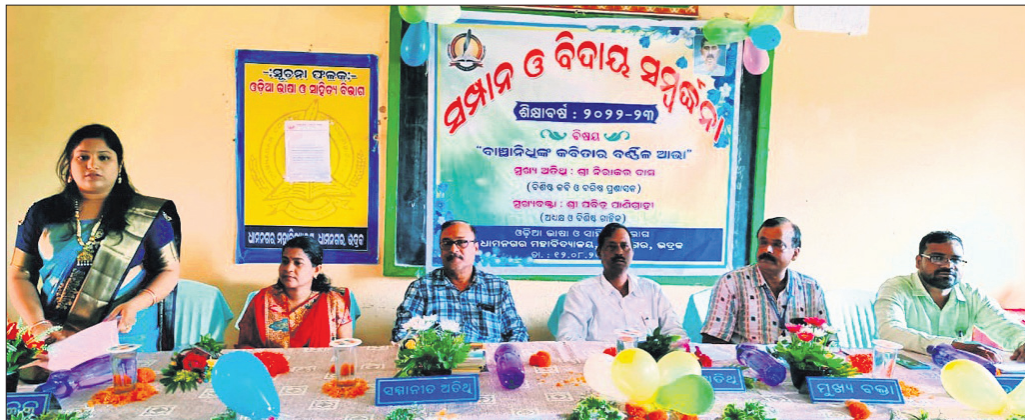
ଧାମନଗର ମହାବିଦ୍ୟାଳୟ ଓଡ଼ିଆ ବିଭାଗରେ ଅନୁଷ୍ଠିତ ଆଲୋଚନାଚକ୍ରରେ ଉପସ୍ଥିତ ଅତିଥି।