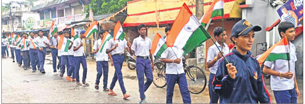
ଛାତ୍ରାଛାତ୍ରୀ ଶୋଭାଯାତ୍ରାରେ ସହର ପରିକ୍ରମା କରୁଛନ୍ତି।

ସହର ପରିକ୍ରମା କରିଛନ୍ତି। ଅଟଳ ବିହାରୀ ହାଇସ୍କୁଲ ସହ ସମଗ୍ର ଶିକ୍ଷାନୁଷ୍ଠାନରେ ମଧ୍ୟ ତ୍ରିରଙ୍ଗା ଶୋଭାଯାତ୍ରା ଆୟୋଜନ କରାଯାଇ ହର୍ ଘର ତ୍ରିରଙ୍ଗା କାର୍ଯ୍ୟକ୍ରମକୁ ସଫଳ କରାଯାଇଛି।