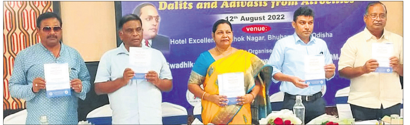
ଅନୁସୂଚିତ ଜାତି ଓ ଅନୁସୂଚିତ ଜନଜାତି (ନିର୍ଯାତନା ନିବାରଣ) ଆଇନ୍ ୧୯୯୮ ଓ ନିୟମାବଳୀ ୧୯୯୫ର ଓଡ଼ିଆ ଭାଷାରେ ସଂଶୋଧିତ ସଂସ୍କରଣକୁ ଅତିଥିମାନେ ଲୋକାର୍ପଣ କରୁଛନ୍ତି।

ଭୁବନେଶ୍ଵର, ୧୨।୮ (ବ୍ୟୁରୋ) ଆଧ୍ୟାତ୍ମିକ-ଲୋହିଆ ବିଚାର ମଞ୍ଚ ଓ ନ୍ୟୁଆଦିଲ୍ଲୀର ନ୍ୟାଶନାଲ ଦଳିତ ମୁକ୍ତିମେଘ ଫର୍ ଡେଭଲପମେଣ୍ଟ ପକ୍ଷରୁ ଶୁକ୍ରବାର ଆନ୍ଧ୍ରପ୍ରଦେଶ ଦଳିତ ଆଦିବାସୀ ପରାମର୍ଶ ଶିବିର ଅନୁଷ୍ଠିତ ହୋଇଯାଇଛି। ସ୍ଥାନୀୟ ଏକ ହୋଟେଲରେ ଆୟୋଜିତ ଏହି କର୍ମଶାଳାରେ ରାଜ୍ୟ ଶିଶୁ ଅଧିକାର ପୁରସ୍କା କମିଶନ ଅଧ୍ୟକ୍ଷା ସମ୍ପାଦକ ପ୍ରଧାନ ଯୋଗଦେଇ କହିଲେ, ଦେଶ ଆଜାଦୀର ଅନୁତ ମହୋତ୍ସବ ପାଳନ କଲାବେଳେ ଆମକୁ ଭେଦଭାବହୀନ