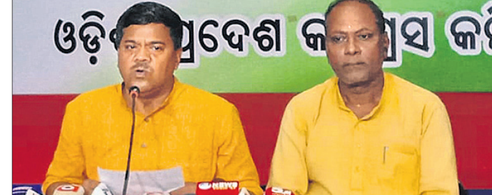
ଖବରଦାତା ସମ୍ମିଳନୀରେ କଂଗ୍ରେସ ନେତୃବୃନ୍ଦ

ରାଜ୍ୟରେ ଆବାସ ଘର ବ୍ୟୟନ ସର୍ବାଧିକ ଶ୍ୱେତପତ୍ର ଜାରି କରିବାକୁ ଦାବି