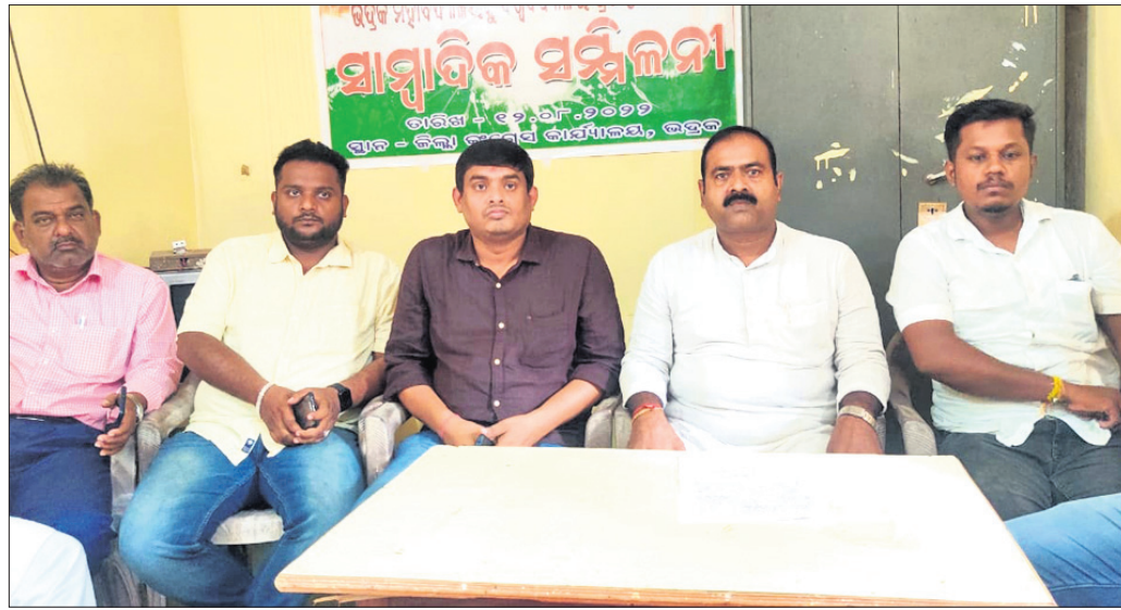
ଖବରଦାତା ସମ୍ମିଳନୀରେ କଂଗ୍ରେସ କର୍ମକର୍ତ୍ତା।

ଭଦ୍ରକ ଜିଲ୍ଲାରେ ସରକାରୀ ମେଡିକାଲ କଲେଜ ଓ ବିଶ୍ୱବିଦ୍ୟାଳୟ ପ୍ରତିଷ୍ଠା ଦାବି ପୂରଣ ନ ହେବା ପର୍ଯ୍ୟନ୍ତ ଲଢ଼େଇ କାରି ରହିବ ବୋଲି ଶୁକ୍ରବାର ଜିଲ୍ଲା କଂଗ୍ରେସ କାର୍ଯ୍ୟାଳୟରେ ଆହୁତ ଖବରଦାତା ସମ୍ମିଳନୀରେ ଦଳ ପକ୍ଷରୁ ଚେତାବନୀ ଦିଆଯାଇଛି।