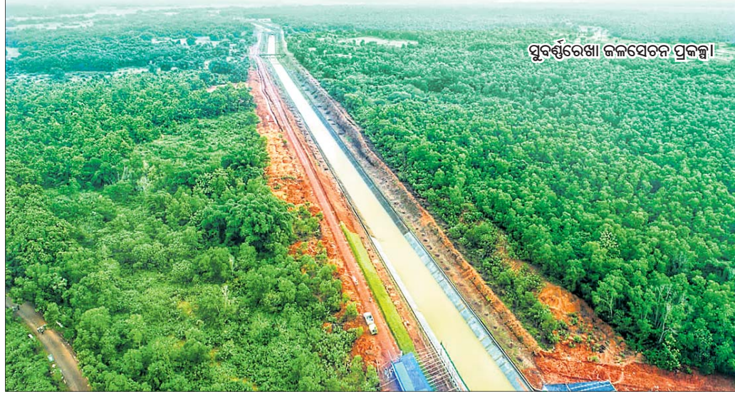
ସୁବର୍ଣ୍ଣରେଖା ଜଳସେଚନ ପ୍ରକଳ୍ପ।