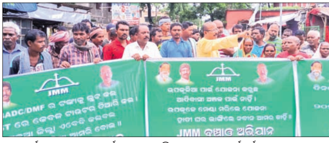
ରୁକ୍ମିଣୀ ପ୍ରତିଷ୍ଠା ଯୋଗାଣ କାର୍ଯ୍ୟକ୍ରମରେ ସାମିଲ ଜେଏମ୍‌ଏମ୍ କର୍ମକର୍ତ୍ତା।