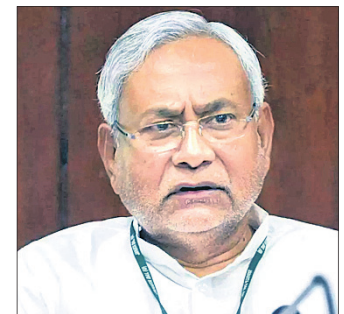
'ହାତ ଯୋଡ଼ି କହୁଛି, ମୋର ପ୍ରଧାନମନ୍ତ୍ରୀ ହେବା ମହତ୍ୱାକାଂକ୍ଷୀ ନାହିଁ। ମୁଁ ସମଗ୍ରଙ୍କ ପାଇଁ କାମ କରିବି। ସବୁ ବିରୋଧୀ ଦଳକୁ ଏକାଠି କରିବା ଲାଗି ଉଦ୍ୟମ କରି ରଖିବି। -ନୀତୀଶ କୁମାର, ବିହାର ମୁଖ୍ୟମନ୍ତ୍ରୀ

ନୂଆଦିଲ୍ଲୀ, ୧୨।୮ ଏନଡିଏରୁ ଗୋଟିଏ ପରେ ଗୋଟିଏ ସହଯୋଗୀ ଦଳ ଉଦ୍ଧରିବାରେ ଲାଗିଛନ୍ତି। ଏହିକ୍ରମରେ ନିକଟରେ ଭାଜପା ସହ ସମ୍ପର୍କ ଛିନ୍ନ କରି ସଂଯୁକ୍ତ ଜନତା ଦଳ ବିହାର ମୁଖ୍ୟମନ୍ତ୍ରୀ ନୀତୀଶ କୁମାର ରାଷ୍ଟ୍ରୀୟ ଜନତା ଦଳ (ଆରଜେଡି) ନେତୃତ୍ୱାଧୀନ ମହାମେଣ୍ଟ ସମର୍ଥନରେ ସରକାର ବଦଳାଇଛନ୍ତି। ନୀତୀଶ ଅଗଷ୍ଟ ୧୦ରେ ଅଷ୍ଟମ ଥର ପାଇଁ ମୁଖ୍ୟମନ୍ତ୍ରୀ ରୂପେ ଶପଥ ନେଇଛନ୍ତି। ନୀତୀଶ ୮-୧୦ ମାସ ପରେ ବର୍ତ୍ତମାନ ଉପମୁଖ୍ୟମନ୍ତ୍ରୀ ତେଜସ୍ୱୀ ଯାଦବଙ୍କୁ ମୁଖ୍ୟମନ୍ତ୍ରୀ ଚୈକିତରେ