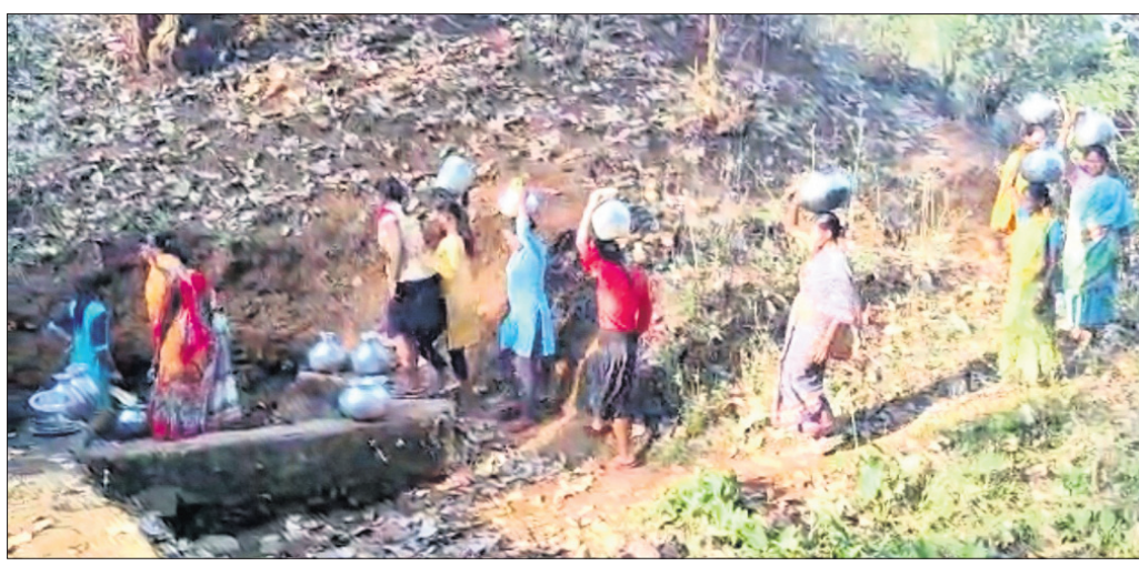
ଲୋକେ ପାହାଡ଼ ଡଳ ଝରଣାରୁ ପାଣି ସଂଗ୍ରହ କରୁଛନ୍ତି ।

ସମସ୍ତଙ୍କୁ କିପରି ବିଶୁଦ୍ଧ ପାନୀୟ ଜଳ ମିଳିବ ସେ ନେଇ ପ୍ରଶ୍ନାସନ ପକ୍ଷରୁ ପଦକ୍ଷେପ ନିଆଯାଉଥିଲେ ହେଁ ଏବେ ମଧ୍ୟ ଆଦିବାସୀ ଅଧିକାଂଶ ପାଣି, ତେଲକୋଇ ଆଦି ବ୍ଲକ୍ ଅଞ୍ଚଳରେ ଅନେକ ଗ୍ରାମ ଓ ବସ୍ତିରେ ଲୋକେ ପାନୀୟ ଜଳକୁ ବସ୍ତିତ ରହିଛନ୍ତି । କୋଟି କୋଟି ଟଙ୍କା ବ୍ୟୟରେ ବିଭିନ୍ନ ପ୍ରକାରର ଜଳ ଯୋଗାଣ ପ୍ରକଳ୍ପ କରିଆରେ ଜଳ ଯୋଗାଣ କରାଯାଇଛି । କିନ୍ତୁ ଏହି ପାହାଡ଼ିଆ ଅଞ୍ଚଳରେ ଲୋକମାନେ ନଦୀ, ଝରଣା, ପାଣି ଚୁଆ ଆଦିକୁ ପାଣି ସଂଗ୍ରହ କରି ଚାଲିଛନ୍ତି । ଅନେକ ଅଞ୍ଚଳରେ ପାନୀୟଜଳ ପାଇଁ ଲୋକଙ୍କୁ ପାହାଡ଼ ଚଢ଼ି ଯିବାକୁ ପଡୁଛି ।