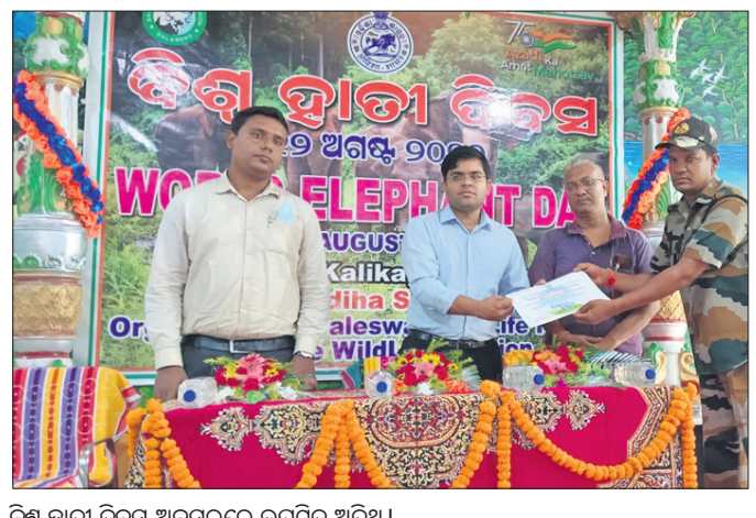
ବିଶ୍ୱ ହାତୀ ଦିବସ ଅବସରରେ ଉପସ୍ଥିତ ଅତିଥି ।

କେନ୍ଦ୍ରରେ ଜିଲ୍ଲା ବାଂଶପାଳ ବ୍ଲକ୍ ପୁଖ୍ୟାଳୟ ଠାରେ ବିଶ୍ୱ ହସ୍ତୀ ଦିବସ ପାଳିତ ହୋଇଯାଇଛି । ଜିଲ୍ଲାରେ ହାତୀ ପାଳିତ ହୋଇଯାଇଛି । ଜିଲ୍ଲାରେ ହାତୀ ମାନଙ୍କ ଚଳଚ୍ଚିତ୍ର ଅନ୍ୟ ଜିଲ୍ଲା ମାନଙ୍କ ଅପେକ୍ଷା ଅଧିକ ରହିଛି । ଫଳରେ ହାତୀ ଓ ମଣିଷ ମଧ୍ୟରେ ଚିତ୍ତତା ବୃଦ୍ଧି ଏଣୁ ଉଭୟ ହାତୀ ଓ ମଣିଷଙ୍କ ସୁରକ୍ଷା ଜରୁରୀ । ଏନେଇ ବନ ବିଭାଗ ପକ୍ଷରୁ ନିଆଯାଇଥିବା ପଦକ୍ଷେପ ବିଷୟରେ ଆଲୋଚନା ହୋଇଥିଲା । କିଛି ବର୍ଷ ହେଲା ଜିଲ୍ଲାରେ ବିଭିନ୍ନ କାରଣରୁ ବହୁ