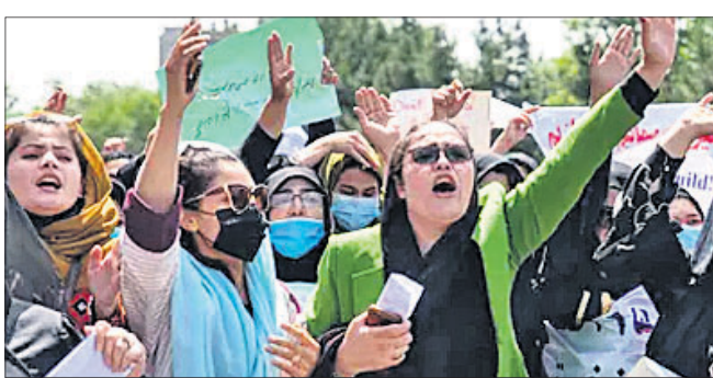
ବିକ୍ଷୋଭକାରୀଙ୍କୁ ଘରଢାକିବାକୁ ଫାଙ୍କା ଚୁଲିଚାଳନା