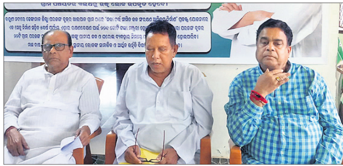
ଡେକାନାଲରେ ଆୟୋଜିତ ଖବରଦାତା ସମ୍ମିଳନୀରେ ମନ୍ତ୍ରୀ ଏବଂ ବିଧାୟକ ।