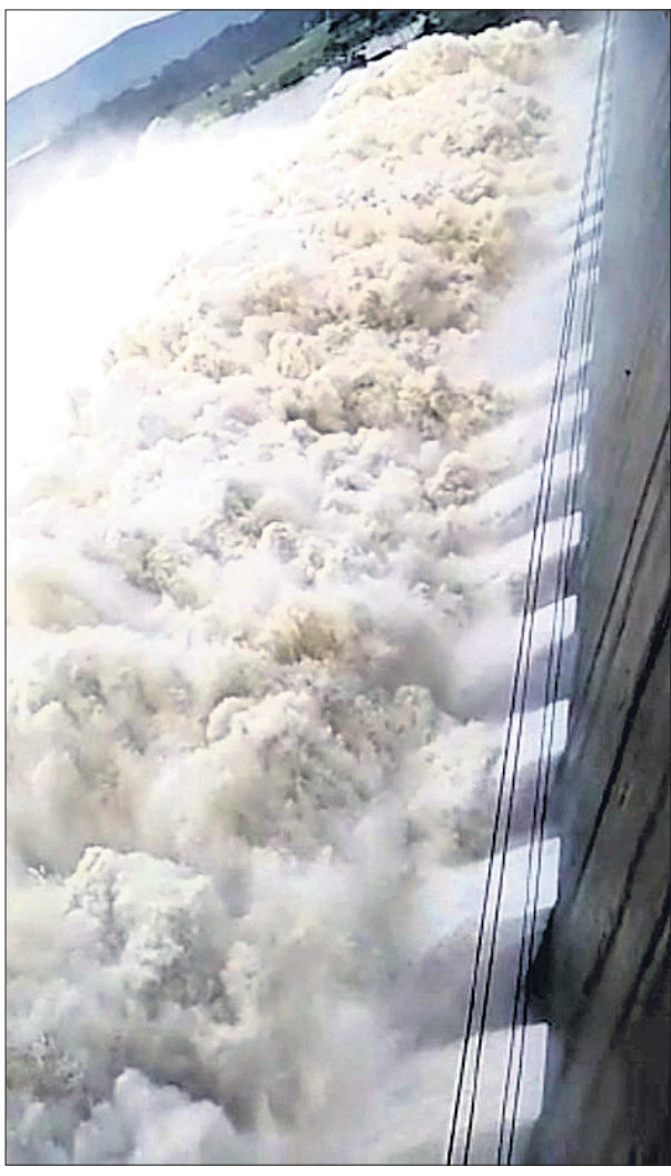
ହୀରାକୁଦ ଜଳଭଣ୍ଡାର ଗେଟ୍ ଦେଇ ବନ୍ୟାଜଳ ନିଷ୍କାସନ ହେଉଛି ।