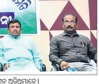
କାର୍ଯ୍ୟକ୍ରମରେ ମଞ୍ଚସ୍ଥାନ ଅତିଥିମାନେ ।