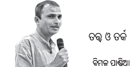
ତତ୍ତ୍ୱ ଓ ଚର୍ଚ୍ଚା