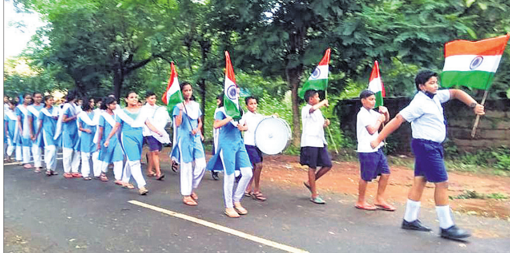
ଆୟୋଜିତ ଶୋଭାଯାତ୍ରାରେ ଷଡ଼ଙ୍ଗୀ ନୋଡାଲ ଉଚ୍ଚ ପ୍ରାଥମିକ ବିଦ୍ୟାଳୟର ଛାତ୍ରଛାତ୍ରୀମାନେ ।

ଡେକାନାଲ ଅଧିକାରୀ, ୧୩୮୮ ଡେକାନାଲ ଜିଲା ଗଂଠିଆ ବ୍ଲକ୍ ଷଡ଼ଙ୍ଗୀ ନୋଡାଲ ଉଚ୍ଚ ପ୍ରାଥମିକ ବିଦ୍ୟାଳୟରେ ଶନିବାର ଆଜ୍ଞାଦା କା ଅମୃତ ମହୋତ୍ସବ ପାଳିତ ହୋଇଯାଇଛି । ଏହି ଅବସରରେ ସ୍କୁଲ ପରିସରରେ ଥିବା ମହାତ୍ମା ଗାନ୍ଧୀ, ଗୋପବନ୍ଧୁ ଏବଂ ଶିହୀଦ ବୁଦ୍ଧିଜୀବୀଙ୍କ ବରାଳକ୍ ପ୍ରତିମୂର୍ତ୍ତିରେ ପୁଷ୍ପମାଲ୍ୟ ଅର୍ପଣ କରାଯାଇଥିଲା ।