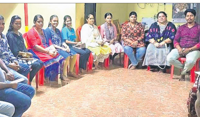
ମୋ ଡେକାନାଲ ଡିଜିଟାଲ ମିଡିଆ ପକ୍ଷରୁ ଅନୁଷ୍ଠିତ ପ୍ରସ୍ତୁତି ବୈଠକ ।

ଡେକାନାଲ ଅଧିକାରୀ, ୧୩୮୮ କରାଯାଇଥିଲା । ଆସନ୍ତା ୨୫ ତାରିଖରେ ‘ମୋ ଡେକାନାଲ’ର ୪ର୍ଥ ପ୍ରତିଷ୍ଠା ଦିବସ ଉପଲକ୍ଷେ ସ୍ଵତନ୍ତ୍ର ଆଲୋଚନାଚକ୍ର ଅନୁଷ୍ଠିତ ହେବ । ୨୭, ୨୭ ଓ ୨୮ ତାରିଖରେ ଜିଲ୍ଲାସ୍ତରୀୟ ପ୍ରତିଯୋଗିତା ‘ମୋ ପ୍ରତିଭା, ମୋ ପରିଚୟ’ ଆୟୋଜନ କରାଯିବ । ଏଥିସହ ସାଂସ୍କୃତିକ କାର୍ଯ୍ୟକ୍ରମ ଅନୁଷ୍ଠିତ ହେବ । ଉତ୍ସାହୀନୀ ଦିବସରେ ପୁରୁଣା ଜିଲା ପରିଷଦ ହଲରେ କୃତା ଛାତ୍ରଛାତ୍ରୀଙ୍କୁ ପୁରସ୍କୃତ କରାଯିବ । ବିଭିନ୍ନ କ୍ଷେତ୍ରରେ ପାରଦର୍ଶିତା ହାସଲ କରିଥିବା ବ୍ୟକ୍ତି ସମ୍ମାନିତ ହେବେ । ଏଥିପୂର୍ବରୁ ବ୍ଲକ୍ସ୍ତରରେ ଡିଡ଼ାକନ,