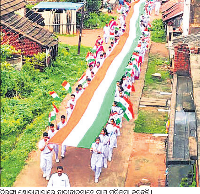
ତ୍ରିରଙ୍ଗା ଶୋଭାଯାତ୍ରାରେ ଛାତ୍ରାଛାତ୍ରୀମାନେ ଗ୍ରାମ ପରିକ୍ରମା କରୁଛନ୍ତି ।