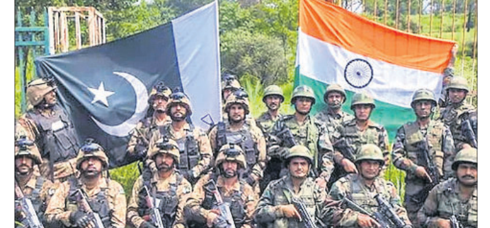
ଆତଙ୍କବାଦ ନିରୋଧୀ ସଂଗଠନ (ଆର୍‌ଏସ୍‌ଏସ୍)ରେ ଭାରତ ଅଧକ୍ଷତା କରୁଥିବା ଏହା ସମରାଜ୍ୟାସର