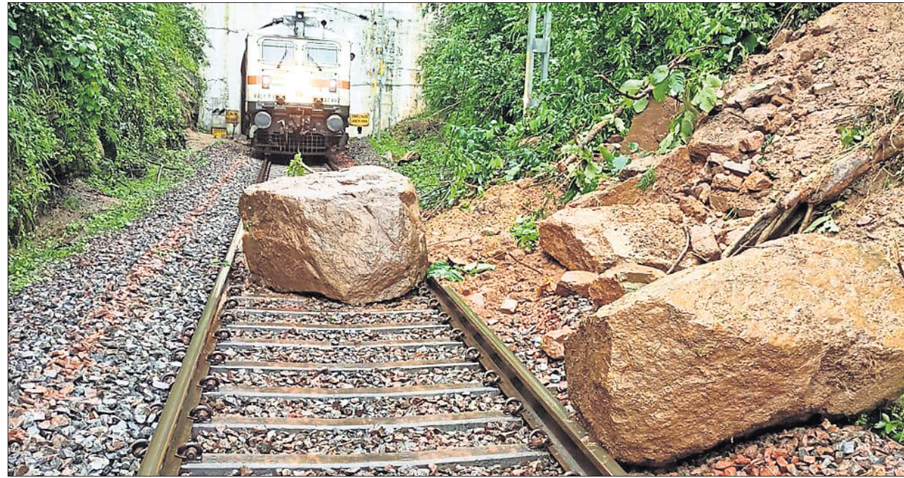
ରାୟଗଡ଼ା ଜିଲ୍ଲା ଶିକରପାଲ-ଭାଲୁମାଧ୍ୟା ରାସ୍ତାରେ ରବିବାର ପାହାଡ଼ରୁ ପଥର ଖସି ରେଳ ଧାରଣାରେ ପଡ଼ିବାରୁ ସମଲେଖଣୀ ଏକ୍ସପ୍ରେସ୍ ଅଟକି ରହିଛି ।