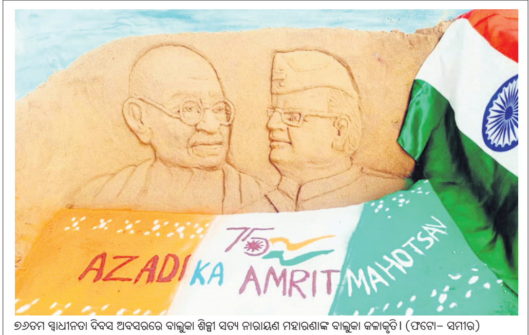
୭୬୦୮ ସ୍ଵାଧୀନତା ଦିବସ ଅବସରରେ ବାଲୁକା ଶିଳ୍ପା ସତ୍ୟ ନାରାୟଣ ମହାରଣାଙ୍କ ବାଲୁକା କଳାକୃତି ।