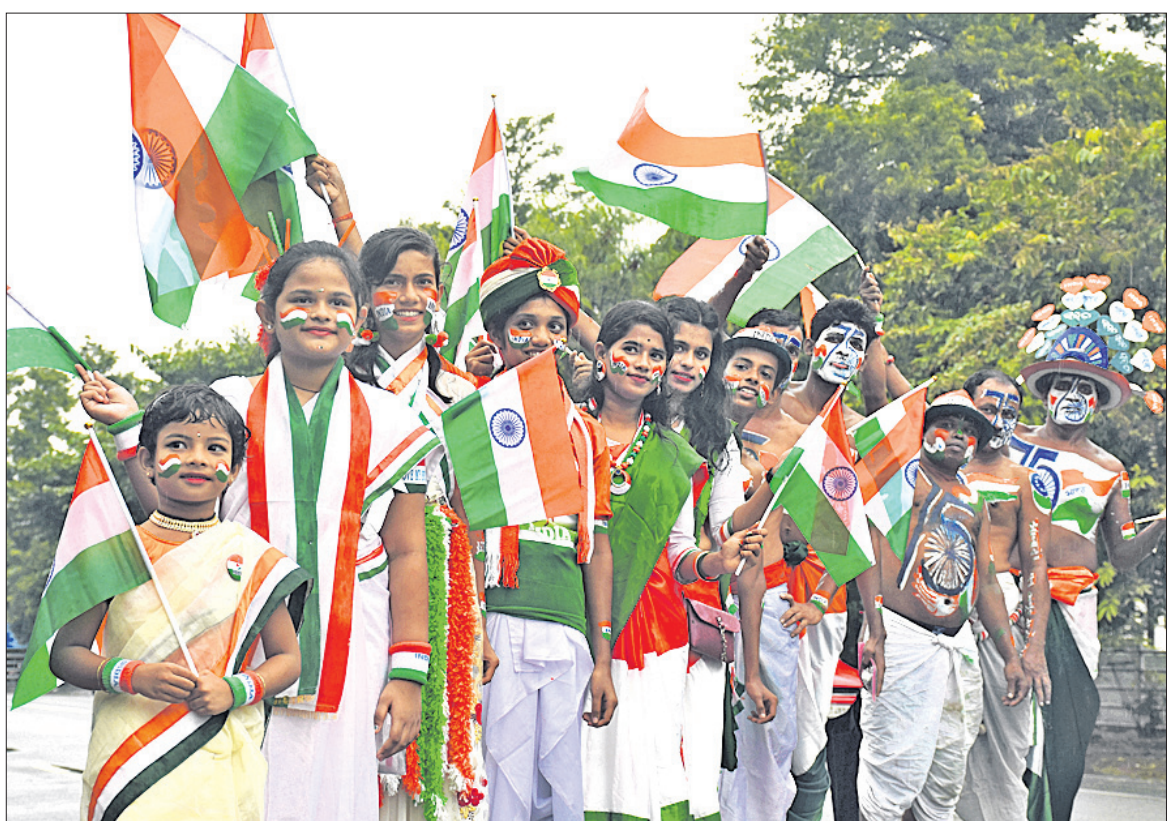
୭୭ତମ ସ୍ୱାଧୀନତା ଦିବସ ପାଳନର ଅନ୍ୟତମ ପୂର୍ବରୁ ରବିବାର ଭୁବନେଶ୍ୱର ଲୋକ୍ଷର ପିଏମ୍‌ଜିରେ ବନ୍ଦେ ମାତରମ୍ ପଢ଼ିବା ପରେ ପଞ୍ଚାଙ୍ଗ ନାଟକ 'ମେରି ଜାନ୍ ହିନ୍ଦୁସ୍ତାନ'ରେ କଳାକାରମାନେ ବେଶାମୃତୋଧିକ ବାଣୀ ଦେଖିଛନ୍ତି।