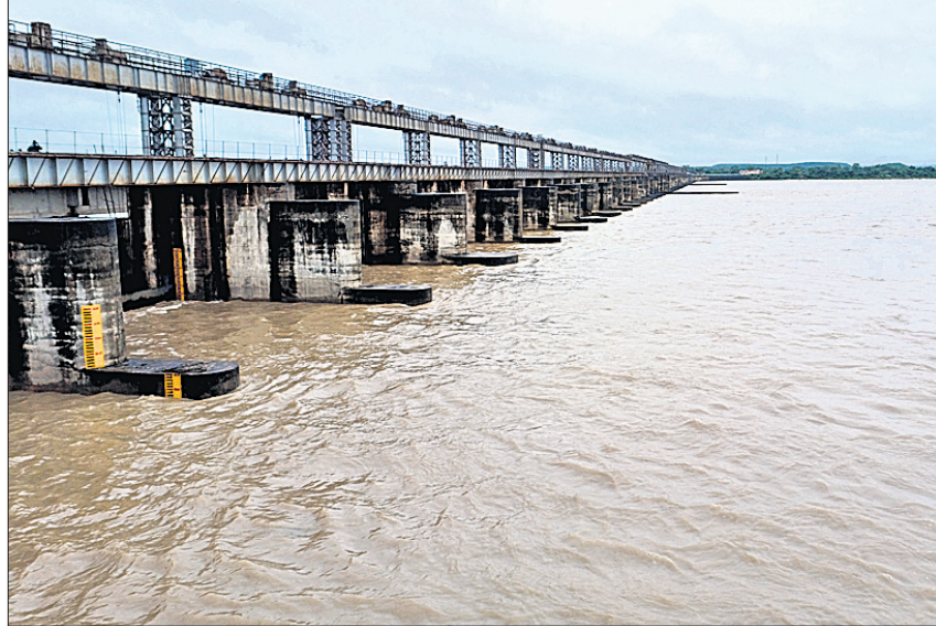
କଟକ ନରାଜ ଆନିକଟଠାରେ ରବିବାର ମହାନଦୀରେ ପ୍ରବାହିତ ବନ୍ୟାଜଳ ।

ଭୁବନେଶ୍ୱର, ୧୫।୮ (ବୁଧବେଳା) ବଙ୍ଗୋପସାଗରରେ ସୃଷ୍ଟି ହୋଇଥିବା ଚଳିତ ମାସର ବୃତ୍ତାନ୍ତ ଲଘୁତାପ ରବିବାର ସକାଳ ସାଢ଼େ ୮ଟାରେ ଉତ୍ତର ଓଡ଼ିଶା ଉପକୂଳ ଏବଂ ଉତ୍ତର ପଶ୍ଚିମ ସମୁଦ୍ରରେ ଅବତୀରଣ ପରିଣତ ହୋଇଛି। ଫଳରେ ରାଜ୍ୟରେ ଜାରି ରହିଥିବା ବର୍ଷା ପରିମାଣ ବଢ଼ିଛି। ଶନିବାର ରାତିରୁ ରବିବାର ସକାଳ ପର୍ଯ୍ୟନ୍ତ ବିଭିନ୍ନ ସ୍ଥାନରେ ପ୍ରବଳ ଶୁଖିଲା ଓ କିଛି ସ୍ଥାନରେ ପ୍ରବଳ ବର୍ଷା ହୋଇଛି। ଏହି ସମୟରେ ଜଗତସିଂହପୁର ଜିଲ୍ଲା ଏରସମାରେ ସର୍ବାଧିକ ୨୧୫ମି.ମି. ବର୍ଷା ରେକର୍ଡ କରାଯାଇଛି। ସେପଟେ ଉପରମୁଣ୍ଡରେ ବର୍ଷା ଯୋଗୁ ହାରାହୁଡ଼ ଜଳଭଣ୍ଡାରର ୩୪ ଗେଟ୍