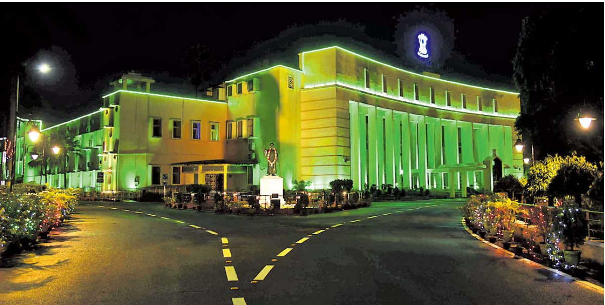
୦୬ ତମ ସ୍ଵାଧୀନତା ଦିବସ ଅବସରରେ ପୂର୍ବରୁ ରବିବାର ଭୁବନେଶ୍ଵରସ୍ଥିତ ରାଜ୍ୟ ବିଧାନସଭାକୁ ରଞ୍ଜିତ ଆଲୋକମାଳରେ ସଜାଯାଇଛି ।