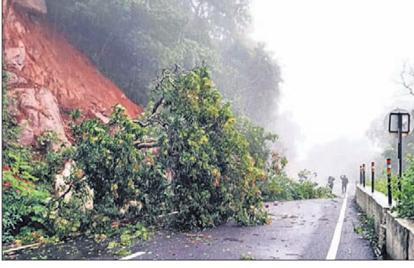
କଳିଙ୍ଗା ଘାଟିରେ ପଥର ଖସିଲା, ମାଟି ଧରିବା ସହ ଗଛ ଉପୁଡ଼ିଛି ।

ଦିନ ପୂର୍ବେ ତାଙ୍କର ମୃତ୍ୟୁ ଘଟିଥିଲା । ଖବର ପାଇ ପାତ୍ରପୁରର ମେଡିକାଲ ଚିକିତ୍ସା ଗ୍ରାମରେ ପହଞ୍ଚି ଚିକିତ୍ସା ଆରମ୍ଭ କରିଥିଲେ । ଆକ୍ରାନ୍ତ ତିନି ଜଣ ମହିଳାଙ୍କୁ ଅଧିକା ଚିକିତ୍ସା ପାଇଁ ବ୍ରହ୍ମପୁର ବଡ଼ ଡାକ୍ତରଖାନାକୁ ସ୍ଥାନାନ୍ତର କରାଯାଇଛି । ସ୍ୱାସ୍ଥ୍ୟ ବିଭାଗ ପକ୍ଷରୁ ଗ୍ରାମବାସୀଙ୍କ ବିଭିନ୍ନ ପରୀକ୍ଷା କରାଯିବା ସହ ତେଜୁ ସଚେତନତା ନେଇ ଆଲୋଚନା ହୋଇଛି ।