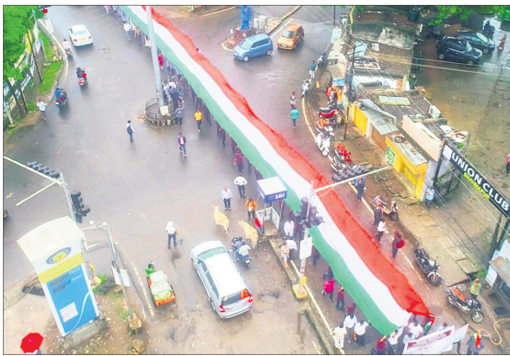
ତ୍ରିରଙ୍ଗା ଧରି ଶୋଭାଯାତ୍ରାରେ ଯାଉଛନ୍ତି ।