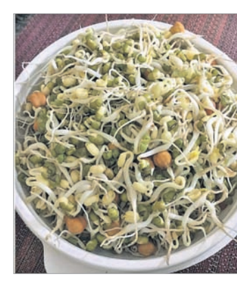
ରୋଗ ପ୍ରତିରୋଧକ ଶକ୍ତି ବୃଦ୍ଧି କରିଥାଏ। ଫଳରେ ଅନେକ ପ୍ରକାର ରୋଗର ଆଶଙ୍କା ଅନେକାଂଶରେ କମ୍

ଭିଟାମିନ୍ ଆମ ସ୍ୱାସ୍ଥ୍ୟ ପାଇଁ କେତେକ ଲାଭପ୍ରଦ ତାହା କହିବା ଅନାବଶ୍ୟକ। ଏହାର ପରିମାଣ ଶରୀରରେ ଅସନ୍ତୁଳିତ ରହିଲେ ତାହା ବିଭିନ୍ନ ପ୍ରକାର ରୋଗକୁ ପରୋକ୍ଷରେ ଆମନ୍ତ୍ରଣ କରିଥାଏ। ତେଣୁ ଆମକୁ ସବୁବେଳେ ଭିଟାମିନ୍‌ମୂଳକ ଖାଦ୍ୟ ଖାଇବାକୁ ପଡ଼ିଥାଏ। ଏହି ଭିଟାମିନ୍‌ଗୁଡ଼ିକ ମଧ୍ୟରୁ ‘ଭିଟାମିନ୍-ଇ’ ଅନ୍ୟତମ। ଗଜାମୁଗ, ଗଜାବୁଟ, ସୂର୍ଯ୍ୟମୁଖା, ତେଲ, ପାକଙ୍ଗ ଶାଗ, ତିନାବାଦାମ ଆଦିରେ ଭିଟାମିନ୍-ଇ ପ୍ରଚୁର ମାତ୍ରାରେ ଭରି ରହିଛି। ଏହାର ସବୁଠାରୁ ଉପକାରୀ ଗୁଣ ହେଲା, ଏପରି ଖାଦ୍ୟ ନିୟମିତ ଖାଇଲେ ତାହା ଆମ ଶରୀରରେ