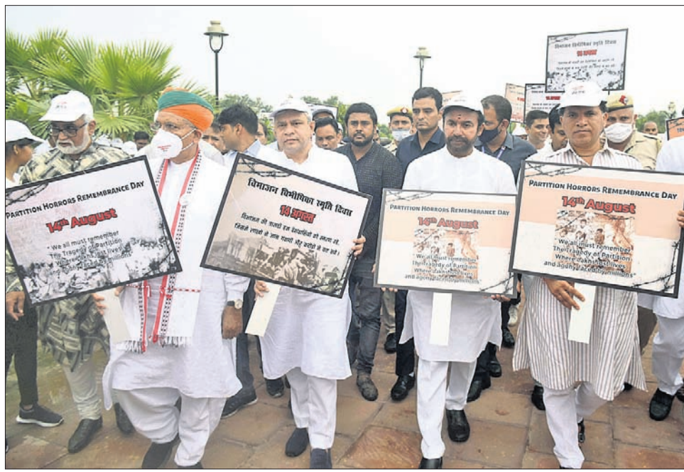
୧୯୪୭ ମସିହା ଦେଶ ବିଭାଜନ ବେଳେ ଦୁର୍ଦ୍ଦଶା ଭୋଗିଥିବା ଏବଂ ପ୍ରାଣତ୍ୟାଗ କରିଥିବା ବ୍ୟକ୍ତିମାନଙ୍କ ସ୍ମୃତିରେ କେନ୍ଦ୍ର ମନ୍ତ୍ରୀ ଅଶ୍ୱିନୀ ବୈଷ୍ଣବ, ଡି. କିଶନ ରେଡ୍ଡୀ, ଅର୍ଜୁନ ରାମ ମେଘାପ୍ପାଳ ଓ ଅନ୍ୟମାନେ ୧୭ତମ ସ୍ୱାଧୀନତା ଦିବସ ପାଳନର ଅବ୍ୟବହୃତ ପୂର୍ବରୁ ରବିବାର ନୂଆଦିଲ୍ଲୀରେ ନୀରବ ଶୋଭାଯାତ୍ରା କରୁଛନ୍ତି।

ଶିନ୍ଦେ କ୍ୟାବିନେଟରେ ବିଭାଗ ବନ୍ଧନ ଦୁଇଜଣିଆ କ୍ୟାବିନେଟରେ ଆଉ ୧୮ ଜଣ ମନ୍ତ୍ରୀଙ୍କୁ ସାମିଲ କରିଥିଲେ। ଅନ୍ୟମାନଙ୍କ ମଧ୍ୟରେ ଭାଇପା ମନ୍ତ୍ରୀ ରାଧାକୃଷ୍ଣ ଜିଝେ ପାଟିଲଙ୍କୁ ରାଜସ୍ୱ, ସୁଧାର ପୂର୍ଣ୍ଣାଙ୍ଗଣ ଉପକ୍ରମ, ବୈଷୟିକ ଶିକ୍ଷା ଓ ସଂସଦୀୟ ବ୍ୟାପାର ବିଭାଗ ଦିଆଯାଇଛି। ସେହିପରି ଶିନ୍ଦେ କ୍ୟାମିନିଷ୍ଟ୍ରୀ ଦାପକ କେଶରକରଙ୍କୁ ସ୍ୱଳ୍ପ ଶିକ୍ଷା ଏବଂ ଅବସ୍ଥା ସମାବେଶକୁ କୃଷି ବିଭାଗ ଦାୟିତ୍ୱ ମିଳିଛି।