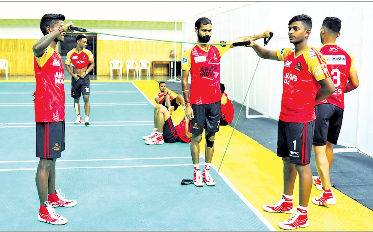
ଅଭ୍ୟାସ ଅବସରରେ ଓଡ଼ିଶା ଜଗରନଟ୍ଟ ଦଳର ଖେଳାଳି।

ଭୁବନେଶ୍ୱର, ୧୪୮୮ (କ୍ରୀଡ଼ା ପ୍ରତିନିଧି) ଅଲଟିମେଟ ଖୋ ଖୋ ଲିଗର ସର୍ବପ୍ରଥମ ସଂସ୍କରଣ ରବିବାର ପୁଣେର ମହାଲକ୍ଷ୍ମୀସ୍ଥିତ ଶ୍ରୀ ଶିବ ଛତ୍ରପତି ସ୍ପୋର୍ଟ୍ସ କମ୍ପ୍ଲେକ୍ସର ବ୍ୟାଡ୍ମିଣ୍ଟନ ହଲରେ ଆରମ୍ଭ ହୋଇଛି। ଲିଗରେ ମୋଟ ୬ଟି ଦଳ ଅଂଶଗ୍ରହଣ କରୁଛନ୍ତି। ଏହା ମଧ୍ୟରେ ଓଡ଼ିଶା ଭିକିଟ ପ୍ରାଞ୍ଚଳିକ ଓଡ଼ିଶା ଜଗରନଟ୍ଟ ଅନ୍ୟତମ। ପୂର୍ବରୁ ରାଜ୍ୟ ସ୍ତରୀୟ ଲିଗ ହଳରେ କଳିଙ୍ଗ ଲାଡ୍ସ ଏବଂ ପୁରୀରେ ଓଡ଼ିଶା