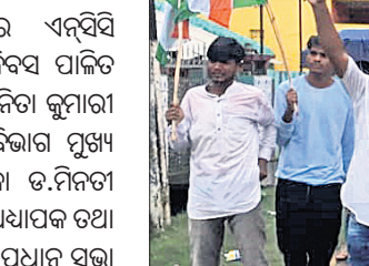
କଂଗ୍ରେସ କର୍ମକର୍ତ୍ତାମାନେ ପଦଯାତ୍ରାରେ ଯାଉଛନ୍ତି ।

ପୁଲବାଣୀ ଅଫିସ, ୧୪୮୮: ଦେଶରେ ସ୍ଵାଧୀନତା ପ୍ରାପ୍ତିର ୭୫ ବର୍ଷ ପୂର୍ତ୍ତି ପାଳନ କରାଯାଇଛି । ରବିବାର କନ୍ଧମାଳ ଜିଲା କଂଗ୍ରେସ ପକ୍ଷରୁ ଡାକ ଓ ବଳିଦାନର ୭୫ ବର୍ଷ ଅବସରରେ ପୁଲବାଣୀରେ ସ୍ଵାଧୀନତା ଗୌରବ ଯାତ୍ରା ଅନୁଷ୍ଠିତ ହୋଇଯାଇଛି । ଦେଶର ଯୁବ ନେତୃତ୍ଵ ତଥା ଛାତ୍ରଛାତ୍ରୀମାନେ ଦେଶ ପାଇଁ ବଳିଦାନ ଦେଇଥିବା ସେହି ମହାନ ପୁରୁଷଙ୍କ ବିଷୟରେ ଜାଣିବା ନିହାତି ଆବଶ୍ୟକ ବୋଲି କଂଗ୍ରେସ ପକ୍ଷରୁ କୁହାଯାଇଛି । ଏହି ଯାତ୍ରା ଘ୍ଲାନୀୟ ମାଦିକୃତ୍ୟା