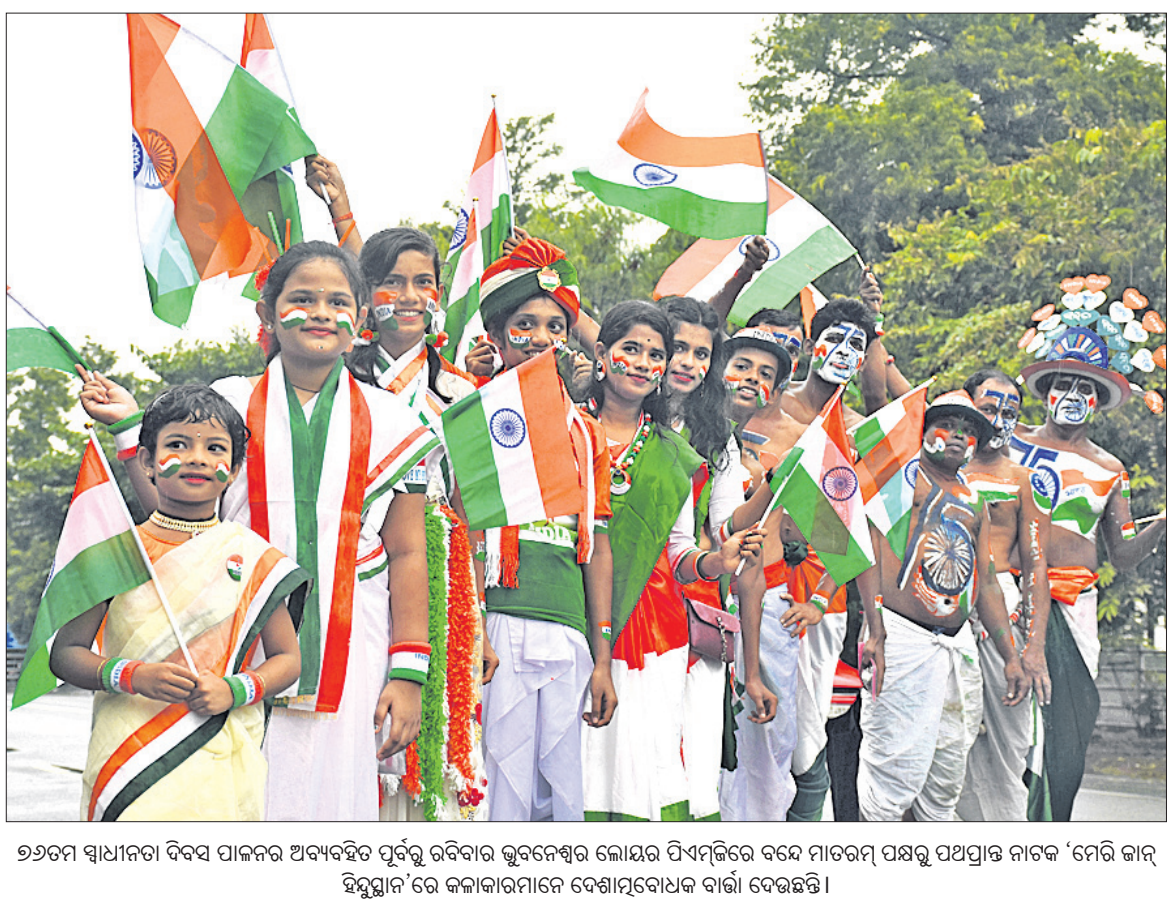
୭୭ତମ ସ୍ୱାଧୀନତା ଦିବସ ପାଳନର ଅନ୍ୟତମ ପୂର୍ବରୁ ରବିବାର ଭୁବନେଶ୍ୱର ଲୋକ୍ଷର ପିଏମ୍‌ସିରେ ବନ୍ଦେ ମାତରମ୍ ପଢ଼ିବା ପରେ ପିଏମ୍‌ସି ନାଟକ 'ମେରି ଜାନ୍ ହିନ୍ଦୁସ୍ତାନ'ରେ କଳାକାରମାନେ ବେଶାମୃତୋଧିକ ବାଣୀ ଦେଖିଛନ୍ତି।

ରବିବାର ରାତି ୯ଟା ପୂର୍ବା (+ ଅଧ୍ୟାୟରେ କରୋନା ଆକ୍ରମଣ ମୃତ୍ୟୁ) ତଥ୍ୟ: https://www.worldometers.info/coronavirus/ ଏବଂ ଓଡ଼ିଶା ସରକାର