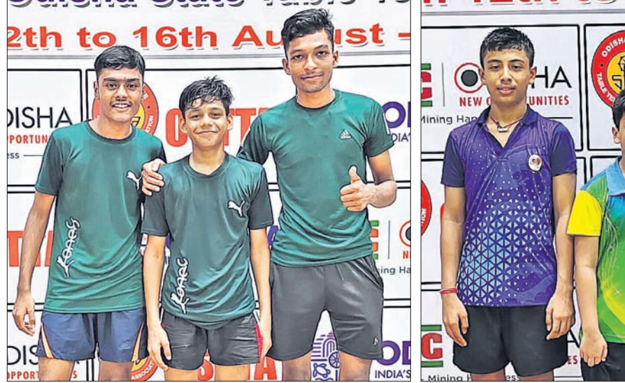
କଟକର ଜବାହରଲାଲ ନେହେରୁ ଇନ୍ଦ୍ରପାଟଣା ସ୍ଥଳରେ ଅନୁଷ୍ଠିତ ଆନ୍ତଃ-ସ୍କୁଲ୍ ଚେମ୍ପିୟନ ପ୍ରତିଯୋଗିତାରେ ଚାମ୍ପିୟନ ବିନିୟର ବାଳକ ଦଳ ।