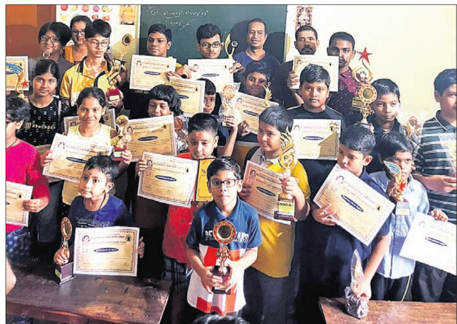
କୃତୀ ଖେଳାଳିମାନେ ଅତିଥିଙ୍କୁ ରାଜସାରେ ।

ଭୁବନେଶ୍ୱର, ୧୪।୮ (ବ୍ରାହ୍ମା ପ୍ରତିନିଧି) ଓଡ଼ିଶା ରାଜ୍ୟ ଚେସ୍ ଆସୋସିଏସନ (ଓଏସଏସଏ) ଆନୁକୂଲ୍ୟରେ ଚଳିଥିବା ରୋଡ୍ସ୍ ଚେସ୍ ପାଇଁ ଚାମ୍ପିୟନ ଶିଳ୍ପୀମାନେ ଅତିଥିଙ୍କୁ ରାଜସାରେ ।