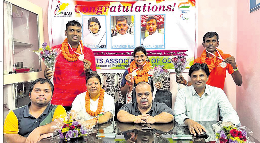
ରାଜ୍ୟଗୋଷ୍ଠୀ ପାରା ଫେନ୍ସିଂ ଚାମ୍ପିୟନଶିପ୍ରେ ପଦକ ବିଜେତା ଓଡ଼ିଶା ଖେଳାଳିମାନେ ସୋମବାର ସମର୍ଥନ ହେବା ଅବସରରେ ପାରା ସୋର୍ଟ୍ ଆସୋସିଏସନ ଅଫ୍ ଓଡ଼ିଶା କର୍ମକର୍ତ୍ତାଙ୍କ ସହ ।