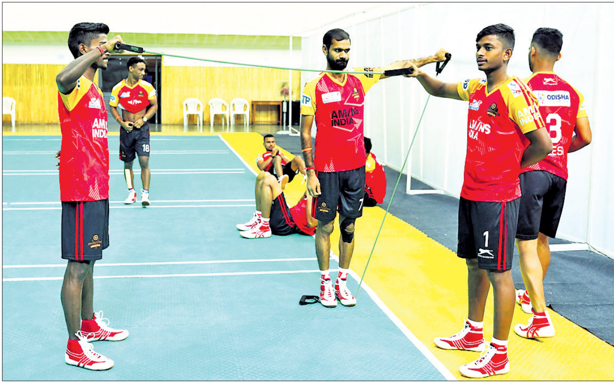
ଅଭ୍ୟାସ ଅବସରରେ ଓଡ଼ିଶା ଜଗରନଟ୍ଟ ଦଳର ଖେଳାଳି।

ଅଲଟିମେଟ ଖୋ ଖୋ ଲିଗର ସର୍ବପ୍ରଥମ ସଂସ୍କରଣ ରବିବାର ପୁଣେର ମହାଲକ୍ଷ୍ମୀସ୍ଥିତ ଶ୍ରୀ ଶିବ ଛତ୍ରପତି ସ୍ପୋର୍ଟ୍ସ କମ୍ପ୍ଲେକ୍ସର ବ୍ୟାଡ୍ମିଣ୍ଟନ ହଲରେ ଆରମ୍ଭ ହୋଇଛି। ଲିଗରେ ମୋଟ ୬ଟି ଦଳ ଅଂଶଗ୍ରହଣ କରୁଛନ୍ତି। ଏହା ମଧ୍ୟରେ ଓଡ଼ିଶା ଭିକିଟ ପ୍ରାଞ୍ଚଳିକ ଓଡ଼ିଶା ଜଗରନଟ୍ଟ ଅନ୍ୟତମ। ପୂର୍ବରୁ ରାଜ୍ୟ ସ୍ତରୀୟ ଲିଗ ହଳରେ କଳିଙ୍ଗ ଲାଡ୍ସ ଏବଂ ପୁରୀରେ ଓଡ଼ିଶା