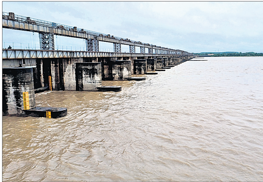
କଟକ ନରାଜ ଆନିକଟଠାରେ ରବିବାର ମହାନଦୀରେ ପ୍ରବାହିତ ବନ୍ୟାଜଳ ।

ଭୁବନେଶ୍ୱର, ୧୪।୮ (ବୁଧବେଳା) ବଙ୍ଗୋପସାଗରରେ ସୃଷ୍ଟି ହୋଇଥିବା ଚଳିତ ମାସର ବୃତ୍ତାନ୍ତ ଲଘୁତାପ ରବିବାର ସକାଳ ସାଢ଼େ ୮ଟାରେ ଭରଣ ଓଡ଼ିଶା ଉପକୂଳ ଏବଂ ଭରଣ ପଶ୍ଚିମ ସମୁଦ୍ରରେ ଅବସାତରେ ପରିଣତ ହୋଇଛି। ଫଳରେ ରାଜ୍ୟରେ କାନ୍ଧି ରହିଥିବା ବର୍ଷା ପରିମାଣ ବଢ଼ିଛି। ଶନିବାର ରାତିରୁ ରବିବାର ସକାଳ ପର୍ଯ୍ୟନ୍ତ ବିଭିନ୍ନ ସ୍ଥାନରେ ପ୍ରବଳ ଶୁଅ ଓ କିଛି ସ୍ଥାନରେ ପ୍ରବଳ ବର୍ଷା ହୋଇଛି। ଏହି ସମୟରେ ଜଗତସିଂହପୁର ଜିଲ୍ଲା ଏରସମାରେ ସର୍ବାଧିକ ୨୧୫ମି.ମି. ବର୍ଷା ରେକର୍ଡ କରାଯାଇଛି। ସେପଟେ ଉପରମୁଣ୍ଡରେ ବର୍ଷା ଯୋଗୁ ହାରାକୁଦ ଜଳଭଣ୍ଡାରର ୩୪ ଗେଟ