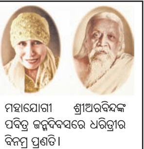
ମହାତ୍ମା ଗାନ୍ଧୀଙ୍କ ପବିତ୍ର ଜନ୍ମଦିନରେ ଧରତ୍ରୀର ବିନମ୍ର ପ୍ରଣତି।