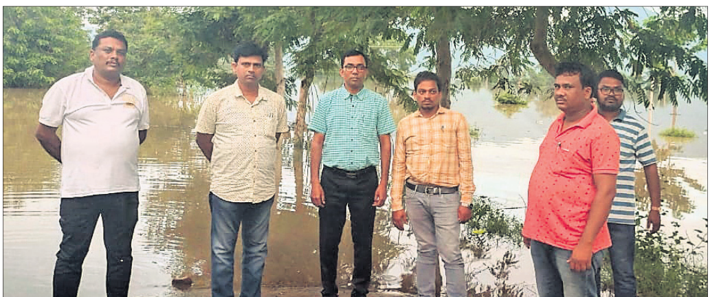
ଆଠମଲ୍ଲିକ ନୂତନ ଏକ ବନ୍ୟା ପ୍ରଭାବିତ ଅଞ୍ଚଳକୁ ଯାଇଥିବା ପ୍ରଶାସନିକ ଅଧିକାରୀମାନେ।