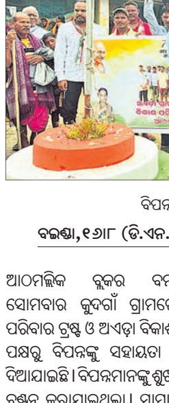
ବିପନ୍ନଙ୍କୁ ରିଲିଫ ପ୍ରଦାନ କରାଯାଇଛି।

ବଜ୍ରା, ୧୬୮ (ଡି.ଏନ.ଏ.) : ଅନୁଗୋଳ ନୂତନ ବନ୍ୟାଞ୍ଚଳରେ ସୋମବାର କୁରୁଗାଁ ଗ୍ରାମରେ ସକ୍ଷମ ପରିବାର ଗ୍ରହଣ ଓ ଅନ୍ତତା ବିକାଶ ପରିଷଦ ପକ୍ଷରୁ ବିପନ୍ନଙ୍କୁ ସହାୟତା ଯୋଗାଇ ଦିଆଯାଇଛି। ବିପନ୍ନମାନଙ୍କୁ ଶୁଖିଲା ଖାଦ୍ୟ ବଣ୍ଟନ କରାଯାଇଥିଲା। ସାମାଜିକ କର୍ମୀ