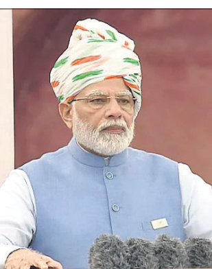
ଲାଲକିଲାରେ ପ୍ରଧାନମନ୍ତ୍ରୀ ନରେନ୍ଦ୍ର ମୋଦି।

କରିବାକୁ ହେଲେ ଆମକୁ ଦାସତ୍ଵ ମନୋଭାବ ଛାଡ଼ିବାକୁ ହେବ। ଶକ୍ତି କ୍ଷେତ୍ରରେ ଆମକୁ ଆର୍ଥିକ ସ୍ଵାଧୀନତା ପ୍ରଦାନ କରିବାକୁ ହେବ।