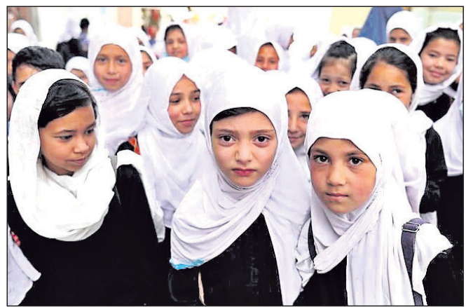
କାବୁଲର ଏକ ପ୍ରାଥମିକ ସ୍କୁଲରେ ଆଫଗାନ ଛାତ୍ରୀ।