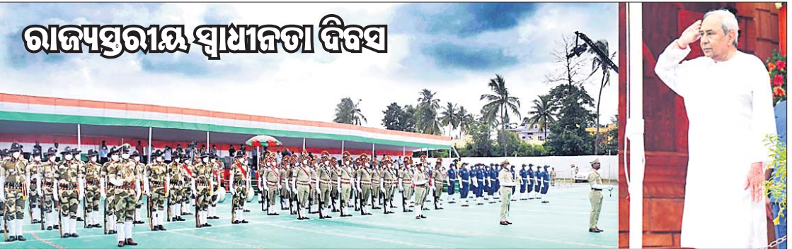
ଭୁବନେଶ୍ୱର ଯୁନିଟ୍-୩ରୁ ପ୍ରଦର୍ଶନୀ ପଡ଼ିଆରେ ସୋମବାର ଆୟୋଜିତ ୭୭ତମ ସ୍ୱାଧୀନତା ଦିବସ କାର୍ଯ୍ୟକ୍ରମରେ ପୃଷ୍ଠାମନ୍ତ୍ର ନବୀନ ପଟ୍ଟନାୟକ ପରେ ଅଭିଭାବନ ଗ୍ରହଣ କରୁଛନ୍ତି।

ଭୁବନେଶ୍ୱର, ୧୬ (ଭୁବନେଶ୍ୱର) ଗତ ୭୫ବର୍ଷରେ ଆମ ଦେଶ ଅନେକ ସଫଳତା ହାସଲ କରିଛି। କୃଷି, ଶିକ୍ଷା, ସ୍ୱାସ୍ଥ୍ୟ, ବିଜ୍ଞାନ ଓ କାର୍ଯ୍ୟକ୍ରମ, ଶିଳ୍ପ, ଗବେଷଣା ଆଦି ବିଭିନ୍ନ କ୍ଷେତ୍ରରେ ଭାରତ ଆଜି ଆଖୁଆ ଦେଶ ସହ ପ୍ରତିଯୋଗିତା କରିପାରୁଛି। ଓଡ଼ିଶା ମଧ୍ୟ ଦେଶର ବିକାଶ ସହିତ ଡାକ ଦେଇ ଆଗେଇ ଚାଲିଛି। ୭୫ ବର୍ଷରେ ଓଡ଼ିଶା ଅନେକ ସଫଳତା ହାସଲ କରି ଦେଶକୁ ରାସ୍ତା ଦେଖାଇଛି ବୋଲି ପୃଷ୍ଠାମନ୍ତ୍ର ନବୀନ ପଟ୍ଟନାୟକ କହିଛନ୍ତି। ସୋମବାର ଭୁବନେଶ୍ୱର ଯୁନିଟ୍-୩ରୁ ପ୍ରଦର୍ଶନୀ ପଡ଼ିଆରେ ୭୭ତମ ରାଜ୍ୟସ୍ତରୀୟ ସ୍ୱାଧୀନତା ଦିବସ ପାଳିତ ହୋଇଯାଇଛି। ଏଥିରେ ପୃଷ୍ଠାମନ୍ତ୍ର ନୂଆ ଅତିଥି