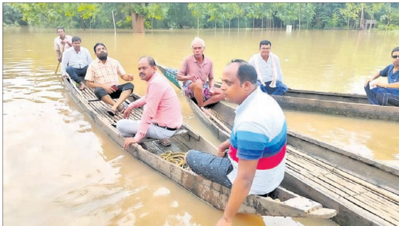
ପ୍ରଶାସନିକ ଅଧିକାରୀମାନେ ଚିକରପଡ଼ା ବନ୍ୟା ଅଞ୍ଚଳକୁ ଯାଉଛନ୍ତି।