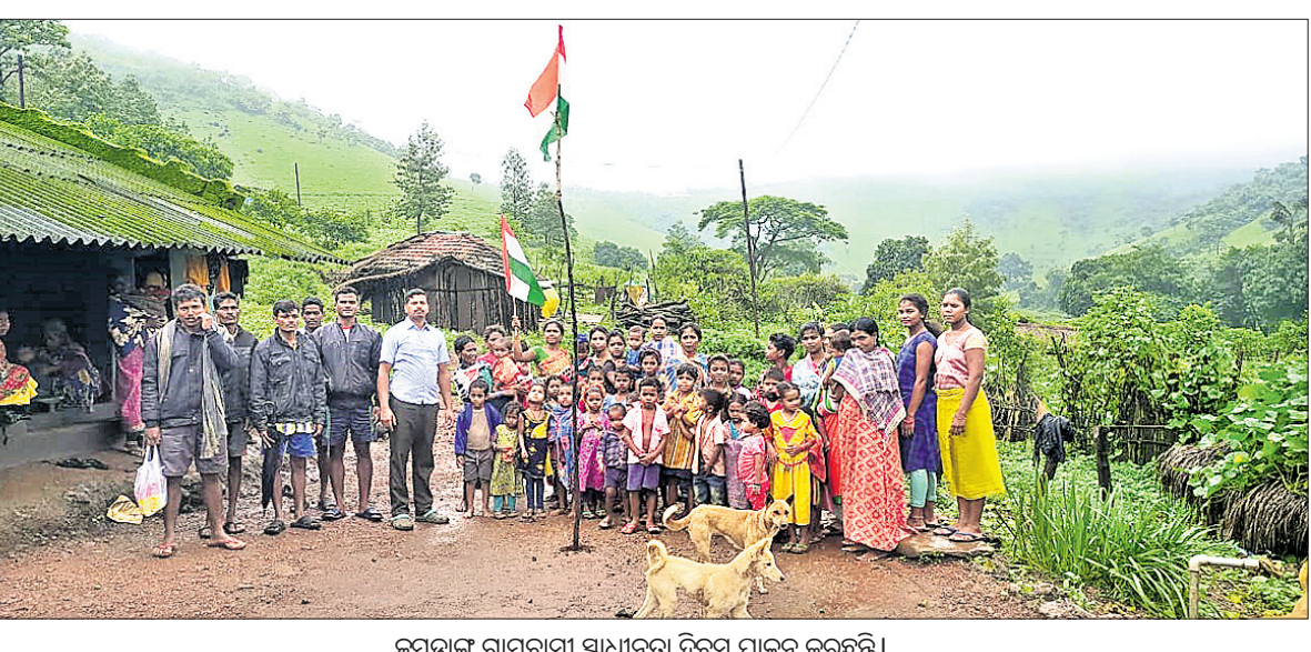
କୁମ୍ଭଡ଼ା ଗ୍ରାମବାସୀ ସାଧାରଣ ଦିବସ ପାଳନ କରୁଛନ୍ତି ।

ନାମକୁ ହେବାକୁ ଚାକୁ ବିଚାର ବିଭାଗୀୟ ହାଜତକୁ ପଠାଇ ଦିଆଯାଇଛି । ସୂଚନା ଅନୁଯାୟୀ, ସୋମବାର ରାତିରେ ଧାମରା ବନ୍ଦରକୁ ଏକ ଟ୍ରକ୍ରେ ଅଷ୍ଟ୍ରେଲିଆ ହାର୍ଡକୋକ୍ ଭର୍ତ୍ତି କରାଯାଇ ଯାକଥିଲା ଏବଂ ଅନ୍ୟ ଅଞ୍ଚଳକୁ ଚାଲାଣ ହେଉଥିବା ଏସ୍ପିଏସ୍ ସୂଚନା ପାଇଥିଲା । ଏକ ବୋଲେରୋରେ ମଙ୍ଗଳ ରହି ଉକ୍ତ ଟ୍ରକ୍ ଚାଳକ କେତେଜଣ ନେରଥିଲେ । ଏସ୍ପିଏସ୍ ଓ ଘୂର୍ଣ୍ଣନାକୁ ଏସ୍ପିଏସ୍ ଭଦ୍ରକ ଗ୍ରାମାଞ୍ଚଳ ଥାନା ପୋଲିସ୍‌କୁ ହସ୍ତାନ୍ତର କରିଥିଲା । ଏନେଇ ସ୍ଥାନୀୟ ପୋଲିସ୍ ପକ୍ଷରୁ ଏକ ନିମ୍ନ (ନଂ. ୪୨୭/୨୨) ରୁଜୁ କରାଯାଇ ଅଭିଯୁକ୍ତଙ୍କୁ କୋର୍ଟ ଚାଲାଣ କରାଯାଇଥିଲା । ଜାମିନ ସ୍ଥାନୀୟ ପୋଲିସର ଏକ ମିଳିତ ଟିମ୍ ଚରମା ନିକଟରେ ଚଢ଼ାଉ କରି ଟ୍ରକ୍ ଧରିଥିଲା । ହେଲେ ବୋଲେରୋରେ ଥିବା ମଙ୍ଗଳ ଗାଡ଼ି ଛାଡ଼ି ଦେଇ ଫଳାଉଥିଲେ । ସେମାନଙ୍କୁ ଧରିବାକୁ ପ୍ରୟାସ କରି ରହିଥିବା ପୋଲିସ୍ ପକ୍ଷରୁ ଜୁହାଯାଇଛି ।