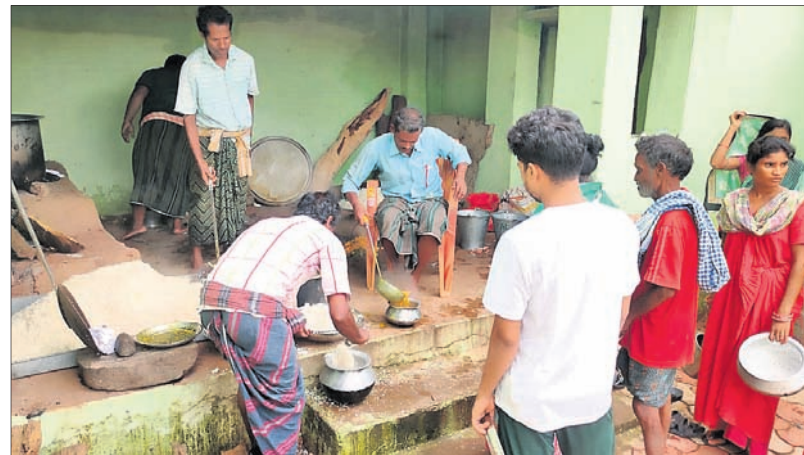
ବନ୍ୟା ପାଡ଼ିତକୁ ପ୍ରଶାସନ ପକ୍ଷରୁ ରକ୍ଷା ଖାଦ୍ୟ ପ୍ରଦାନ କରାଯାଇଛି।