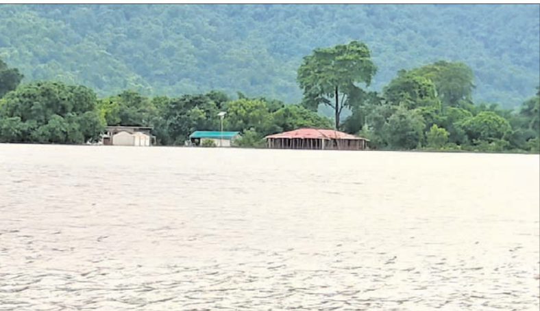
ଅନୁଗୋଳ ନଳ ଚିକରପଡ଼ା ପର୍ଯ୍ୟଟନ ସ୍ଥାନ ବନ୍ୟା ଜଳରେ ବୁଡି ଯାଇଛି।