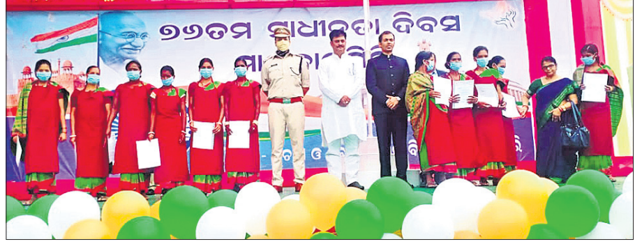
ଚୋଷେୟା ଭାବେ ନିୟୁତ୍ତି ପାଇଥିବା ୧୧ ମହିଳା ମାଓବାଦୀ ।