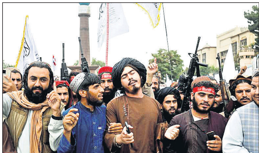
କାବୁଲ ଦଖଲର ପ୍ରଥମ ବର୍ଷ ପୂର୍ବ ପାଳନ କରୁଥିବା ତାଲିବାନ ଲଢୁଆ।