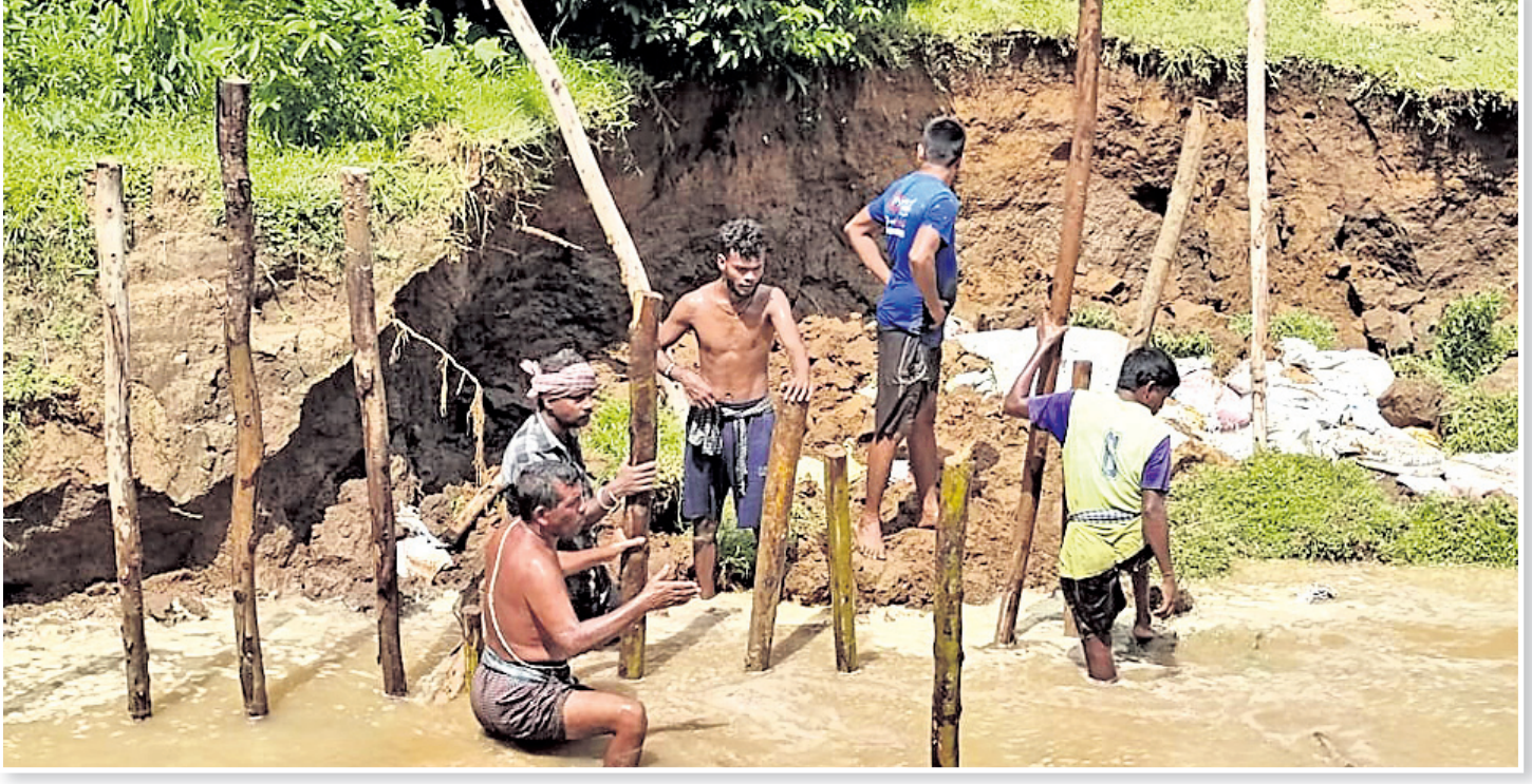
କେନ୍ଦ୍ରାପଡ଼ା ଜିଲା ଗରବପୁର ବ୍ଲକ୍ ଭବନାଠାରେ ଚିତ୍ରୋତ୍ପଳା ନଦୀରେ ସୃଷ୍ଟି ଘାଟକୁ ବାଉଁଶ ଓ ବାଲିବସ୍ତା ପକାଇ ରୋକାଯାଉଛି।