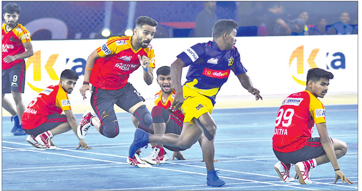
ଓଡ଼ିଶା ଜଗରନସ୍ତୁ ଓ ଚେନ୍ନାଇ କୁଇନ୍ସ ଗର୍ବ ମଧ୍ୟରେ ଅନୁଷ୍ଠିତ ମ୍ୟାଚ୍