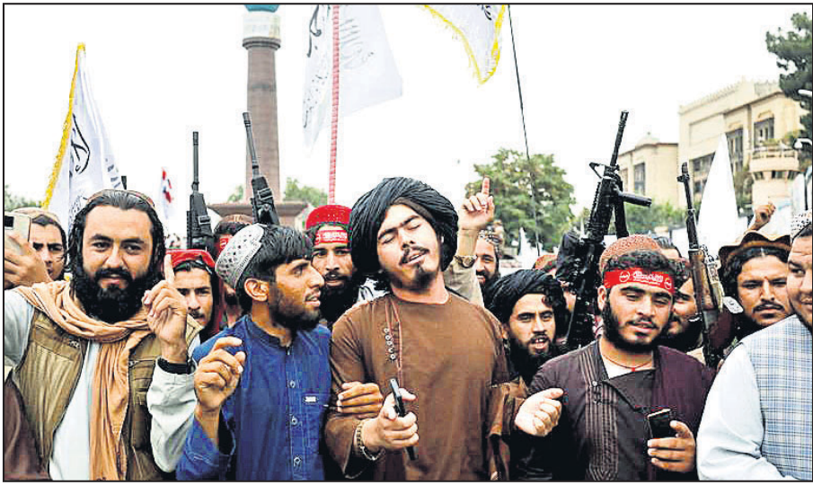
କାବୁଲ ଦଖଲର ପ୍ରଥମ ବର୍ଷ ପୂର୍ତ୍ତ ପାଳନ କରୁଥିବା ତାଲିବାନ୍ ଲଢୁଆ ।

କାବୁଲ, ୧୬। ବର୍ଷକ ତଳେ ଆଫଗାନିସ୍ତାନର ଦୁର୍ଦ୍ଦଶ ଆତଙ୍କବାଦୀ ସଙ୍ଗଠନ ତାଲିବାନ୍ କାବୁଲ ଦଖଲ କରିଥିଲା ।