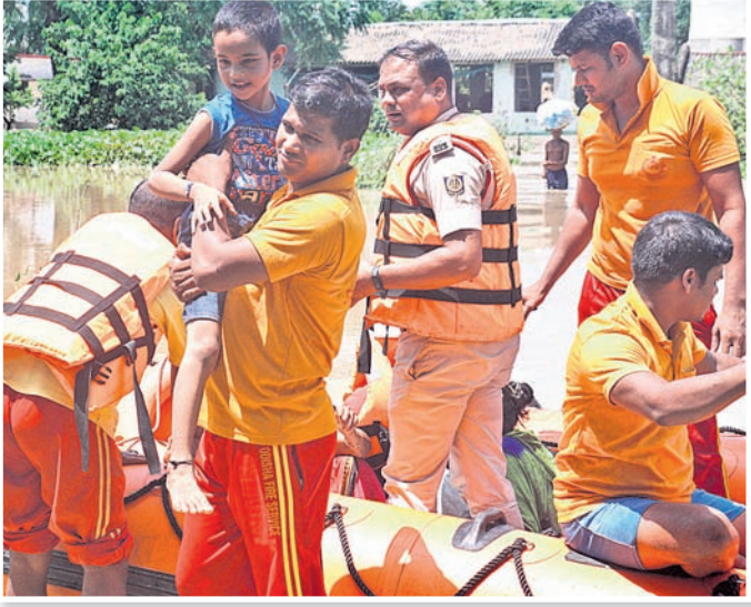
କଟକ ଗତିରାଉତ ପାରଖାଠାରେ ବନ୍ୟାଜଳରେ ଫସିଥିବା ଲୋକଙ୍କୁ ଉଦ୍ଧାର କରାଯାଉଛି।

ଉଦ୍ଧାର କରିଥିଲେ। ପରେ ମଙ୍ଗଳବାର ସେହିପରି ସ୍ଥାନୀୟ ଲୋକମାନେ ପାଣିରେ ସମ୍ପୂର୍ଣ୍ଣ ବୁଡ଼ିଯାଇଥିବା କାରକୁ ରାସ୍ତା ଉପରକୁ ଆଣିଥିଲେ। ସେହିପରି ଭାରତ ଗଡ଼ାଠାରେ ୫୫୫ ଉଚ୍ଚ ବନ୍ୟାଜଳ ପ୍ରବାହିତ ଯୋଗୁ ଯୋଗବାର ସନ୍ଧ୍ୟାରୁ ଆଠଗଡ଼ କଟକ ଯାତାୟତ ବନ୍ଦ ହୋଇଯାଇଛି। ବଡ଼ମ୍ବା ଗଣାମେଳା ରିଜିଷ୍ଟରେ ବଡ଼ମ୍ବା ଯୋଗୁ ବାଙ୍ଗେରିସିଂଜା ଜଳବନ୍ଦୀ ହୋଇ ରହିଛି। ବଡ଼ମ୍ବା ଅଧିଷ୍ଠାତ୍ରୀ ଦେବୀ ଭକ୍ତାରିକା ମନ୍ଦିର ବିକସିତ ରାତିରେ ଅନୁଗୋଳ ଅଭିମୁଖେ ଯାଉଥିବା ଏକ କାର ଭାସି ଯାଇଥିଲା। ଦୀର୍ଘ ୪ଘଣ୍ଟା ପରେ ସ୍ଥାନୀୟ ଲୋକଙ୍କ ସହାୟତାରେ କାରରେ ଥିବା ୪ଜଣଙ୍କୁ ବନ୍ଦୀକାରୀ କର୍ମଚାରୀମାନେ