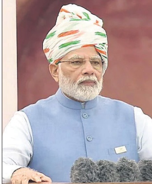
ଲାଲକିଲାର ପ୍ରଧାନମନ୍ତ୍ରୀ ନରେନ୍ଦ୍ର ମୋଦି ।

କରିବାକୁ ହେଲେ ଆମକୁ ଦାସ୍ୟ ମନୋଭାବ ଛାଡ଼ିବାକୁ ହେବ । ଶକ୍ତି କ୍ଷେତ୍ରରେ ଆମକୁ ଆର୍ଥିକତା ହେବାକୁ ପଡ଼ିବ । ନବପ୍ରବର୍ତ୍ତନର ଆବଶ୍ୟକତା ଉପରେ ଗୁରୁତ୍ଵ ଦେଇ ପ୍ରଧାନମନ୍ତ୍ରୀ ଜୟ ଯବାନ, ଜୟ କିଷାନ ପ୍ରହ ଜୟ ଅନୁସନ୍ଧାନ ଯୋଡ଼ିଛନ୍ତି ।