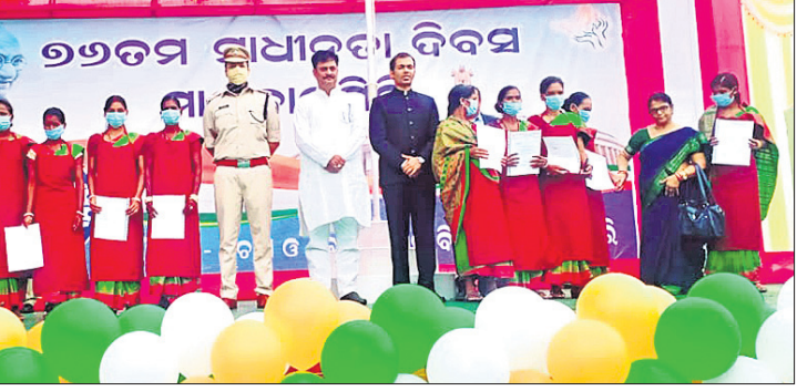
ରୋଷେୟା ଭାବେ ନିର୍ମୁକ୍ତି ପାଇଥିବା ୧୧ ମହିଳା ମାଓବାଦୀ।