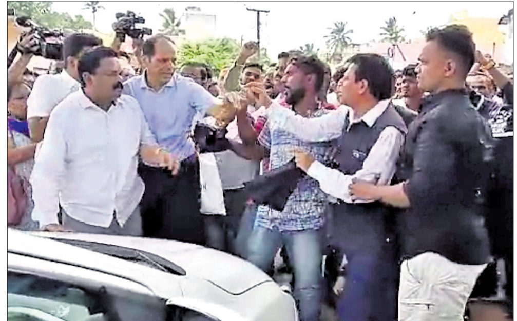
ବିଧାୟକ ଓ ବିଜେଡି କର୍ମୀ ମଧ୍ୟରେ ଠେଲା ପେଲା ।

କେତେକ ବିଜେଡି କର୍ମୀ ବିଧାୟକଙ୍କୁ ବିସଫଳତା ସମ୍ପର୍କରେ ଯୋଗଦେଇ ପତାକା କଳା ପତାକା ଦେଖାଇଥିଲେ । 'ଗୋ ବ୍ୟାକ୍' ନାରାବାଜିକରିରାସ୍ତ୍ର ଅବରୋଧ କରିଥିଲେ । ପୋଲିସ ପହଞ୍ଚି ପରିସ୍ଥିତିକୁ ନିୟନ୍ତ୍ରଣ କରିବା ପରେ ବିଧାୟକ ଗୋଳାବନ୍ଧ ଗସ୍ତରେ ଯାଇ ସ୍ୱାଧୀନତା ଦିବସ ପାଳନରେ ଯୋଗଦେଇ ପତାକା ଉତ୍ତୋଳନ କରିଥିଲେ । କାର୍ଯ୍ୟକ୍ରମରେ ବିଧାୟକ ବିଧାୟକ କହିଥିଲେ, ଏହି ପବିତ୍ର ଦିବସରେ କଳା ପତାକା ଦେଖାଇବା କେତେବୃତ୍ତ ଯଥାର୍ଥ, ଭଗବାନ ତାଙ୍କୁ ସମ୍ବୁଦ୍ଧି ଦିଅନ୍ତୁ । ଅବସରପ୍ରାପ୍ତ କର୍ମଚାରୀଙ୍କ ନିମନ୍ତେ କୋଠର ନିର୍ମାଣ ପାଇଁ ୫ଲକ୍ଷ ଟଙ୍କା ଅନୁଦାନ ଘୋଷଣା କରିଥିଲେ । ଏଥିନିମନ୍ତେ ଜିଲ୍ଲା ପ୍ରଶାସନ ଓ ବ୍ଲକ ପ୍ରଶାସନ ସହଯୋଗ କରିବାକୁ ନିବେଦନ କରିଥିଲେ ।