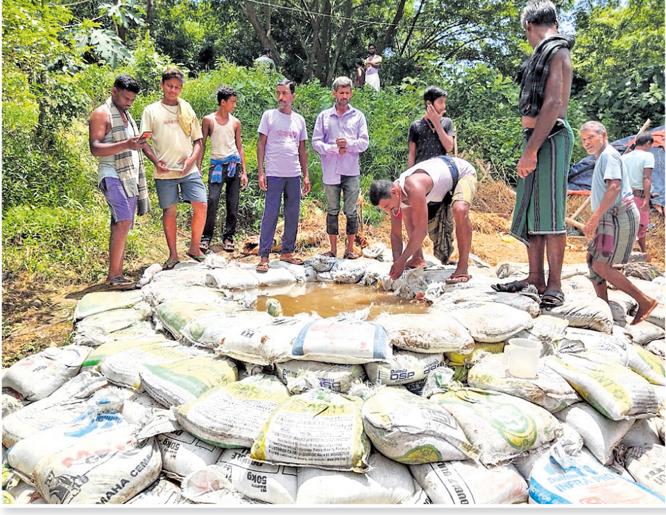
କଟକ ଜିଲା ତିରିଆଠାରେ ମହାନଦୀର ଦୁର୍ବଳ ବନ୍ଧରେ ବାଲିବସ୍ତା ପକାଯାଇଛି।