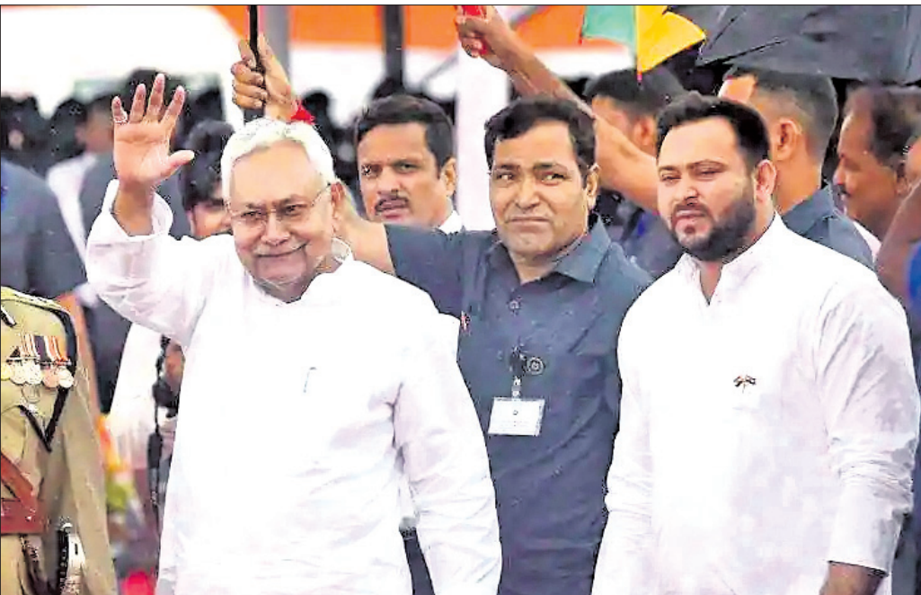
ମନ୍ତ୍ରୀମଣ୍ଡଳ ସମ୍ପ୍ରଦାୟ ପୂର୍ବରୁ ମଙ୍ଗଳବାର ପାଟଣାରେ ପୁଣ୍ୟମନ୍ତ୍ରୀ ନାଟ୍ୟ କୁମାର ଓ ଉପପୁଣ୍ୟମନ୍ତ୍ରୀ ତେଜସ୍ୱୀ ଯାଦବ ।