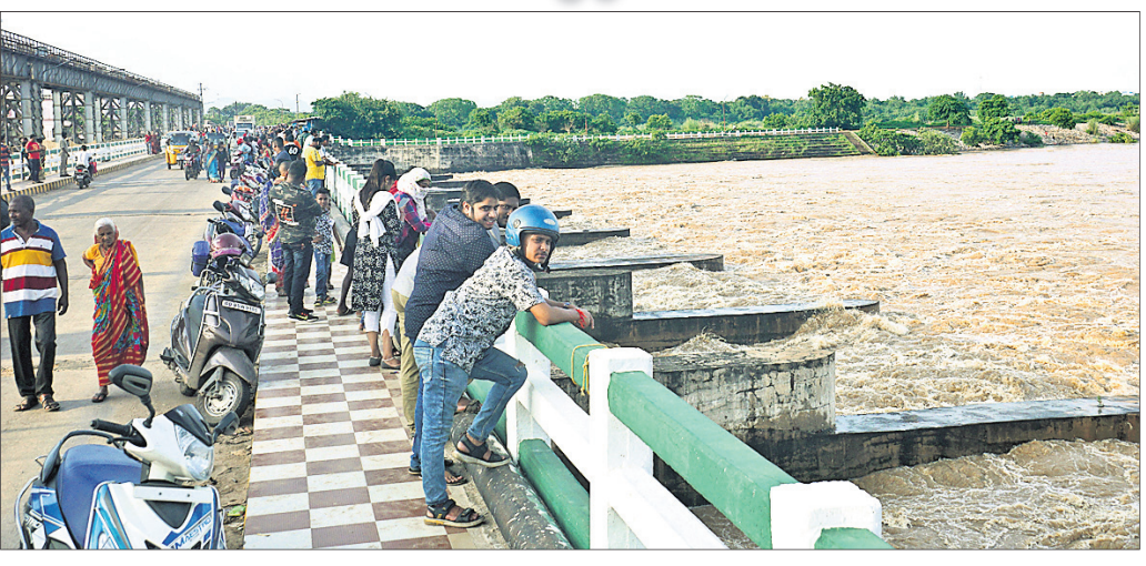
ମୁଣ୍ଡଳୀଠାରେ ବିପଦ ସଙ୍କେତ ଉପରେ ଜଳ ପ୍ରବାହିତ ହେଉଥିବା ବେଳେ ଲୋକମାନେ ଦେଖୁଛନ୍ତି।

ଲମ୍ବୁରାପ ଜନିତ ବର୍ଷା ଓ ହାରାକୃତ ଜଳ ଭଣ୍ଡାରର ୩୪ଟି ଗେଟ ଦେଇ ଜଳ ନିଷ୍କାସନ ପରେ ତଳମୁଣ୍ଡଳୀରେ ବନ୍ୟାସ୍ଥିତି ଦେଖାଦେଇଛି। ମଙ୍ଗଳବାର ମଧ୍ୟାହ୍ନକୁ ମୁଣ୍ଡଳୀଠାରେ ୧୨ ଲକ୍ଷ କ୍ୟୁସେକ ବନ୍ୟାଜଳ ପ୍ରବାହିତ ହେଉଛି। ମୁଣ୍ଡଳୀ ଠାରେ ବିପଦ ସଙ୍କେତ ୯୭.୨୫ ଫୁଟ ରହିଥିବାବେଳେ ଏଠାରେ ୯୭.୮୦ ଫୁଟରେ ଜଳ ପ୍ରବାହିତ ହେଉଛି। ଯୋଗବାର ମଧ୍ୟ ରାତିରେ ଏହା ୧୧ ଲକ୍ଷ କ୍ୟୁସେକ ଥିଲା। ମୁଣ୍ଡଳୀ ବ୍ୟାରେଜକୁ ନିଷ୍କାସିତ ପାଣିକୁ ମହାନଦୀର ଯୋଡ଼ା ବ୍ୟାରେଜ ଓ କାଠଯୋଡ଼ି ନଦୀର ନରାଜ ବ୍ୟାରେଜ ଦେଇ ନିଷ୍କାସନ କରାଯାଉଛି। ନରାଜ ବ୍ୟାରେଜ ଦେଇ ୫ଲକ୍ଷ ୯୨ହଜାର ୪୨୨ କ୍ୟୁସେକ ଜଳ ନିଷ୍କାସିତ ହେଉଥିବାବେଳେ ଯୋଡ଼ା ବ୍ୟାରେଜ ଦେଇ ୫ ଲକ୍ଷ ୭୩ ହଜାର ୩୩୩ କ୍ୟୁସେକ ଜଳ ନିଷ୍କାସିତ ହେଉଛି। ଅପରପକ୍ଷରେ ବନ୍ୟାଜଳ ପ୍ରବାହକୁ ଦେଖି ହାରାକୃତ ଜଳଭଣ୍ଡାରର ଖୋଲାଯାଇଥିବା ୩୪ ଗେଟ ମଧ୍ୟରୁ ଯୋଗବାର ୮ଟି ଗେଟ ବନ୍ଦ କରାଯାଇଥିଲା। ହେଲେ ମଙ୍ଗଳବାର ହାରାକୃତ ତ୍ୟାମ୍ବରେ ଜଳସ୍ତର ୬୨୨ ଫୁଟ ଉପରେ ରହିଥିବାରୁ ରାତି ୮ଟାରେ ୪୦ଟି ଗେଟ ଦେଇ ଜଳ ପ୍ରବାହିତ ହେଉଛି। ଏହି ଜଳ ନରାଜ ମଧ୍ୟ ଦେଇ ଗୁରୁବାର ସକାଳେ ପ୍ରବାହିତ ହେବ। ମଙ୍ଗଳବାର ମହାନଦୀରେ ୧୨ଲକ୍ଷ କ୍ୟୁସେକ ଜଳ ପ୍ରବାହିତ କରି ରହିଥିବାରୁ ଏହାର ଅବବାହିକାରେ ଥିବା କଟକ