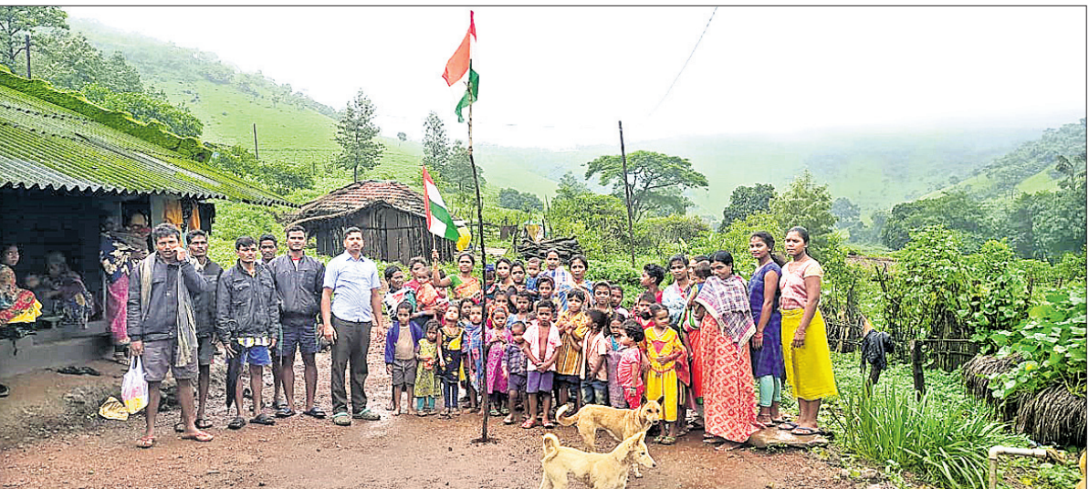
କୁମାରୀ ଗ୍ରାମବାସୀ ସ୍ଵାଧୀନତା ଦିବସ ପାଳନ କରୁଛନ୍ତି।

ନାମାଞ୍ଚଳ ହେବାରୁ ଟାକ୍ସା ବିଚାର ବିଭାଗରୁ ହାତବନ୍ଧୁ ପଠାଇ ଦିଆଯାଇଛି। ପୁରନା ଅନୁପାଳ, ସୋମବାର ରାତିରେ ଧାମରା ବନ୍ଦରକୁ ଏକ ଟ୍ରକ୍ରେ ଅଷ୍ଟ୍ରେଲିଆ ହାର୍ଡକୋକ୍ ଭର୍ତ୍ତି କରାଯାଇ ଯାକପୁର ଏବଂ ଅନ୍ୟ ଅଞ୍ଚଳକୁ ଚାଲାଣ ହେଉଥିବା ଏସ୍‌ଟିଏସ୍ ଟିମ୍ ଗିରଫ କରିଥିଲା। ଏକ ବୋଲେରୋରେ ଖଣ୍ଡିଗ ରହି ଉଚ୍ଚ ଟ୍ରକ୍ କୁ ବାଟ କଢ଼େଇ ନେଇଥିଲେ। ଏସ୍‌ଟିଏସ୍ ଓ ପୂର୍ଣ୍ଣାମାଙ୍କୁ ଏସ୍‌ଟିଏସ୍ ଭଦ୍ରକ ଗ୍ରାମାଞ୍ଚଳ ଥାନା ପୋଲିସ୍‌କୁ ହସ୍ତାନ୍ତର କରିଥିଲା। ଏନେଇ ସ୍ଥାନୀୟ ପୋଲିସ୍ ପକ୍ଷରୁ ଏକ ଟ୍ରକ୍ (ନଂ. ୪୨୬/୨୨) ରୁକୁ ନାମାଞ୍ଚଳ ଅଭିଯୁକ୍ତଙ୍କୁ ଗିରଫ କରାଯାଇଛି। ଜାମିନ ପୋଲିସ୍ ପକ୍ଷରୁ ଜୁହାଯାଇଛି।