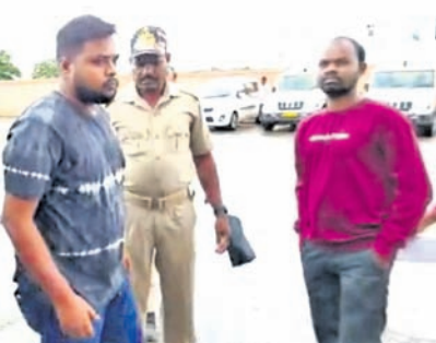
ଗିରଫ ୩ ଅଭିଯୁକ୍ତ।