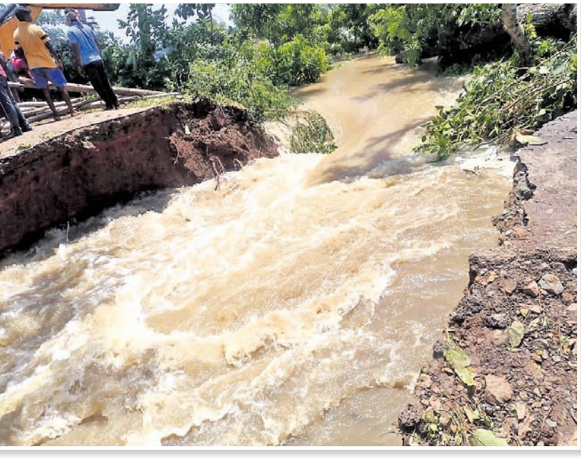
ପୁରୀ ଜିଲା କଣାସଠାରେ ସୃଷ୍ଟି ହୋଇଥିବା ଘାଟ।