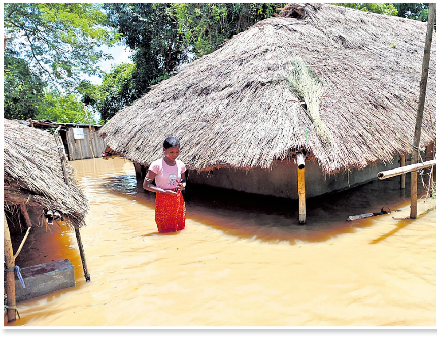
କଟକ ଜିଲା ଭାଡ଼ିପୁରା ନର୍ସରି ପାର୍ମ ପରିସରରେ ବନ୍ୟାଜଳ।