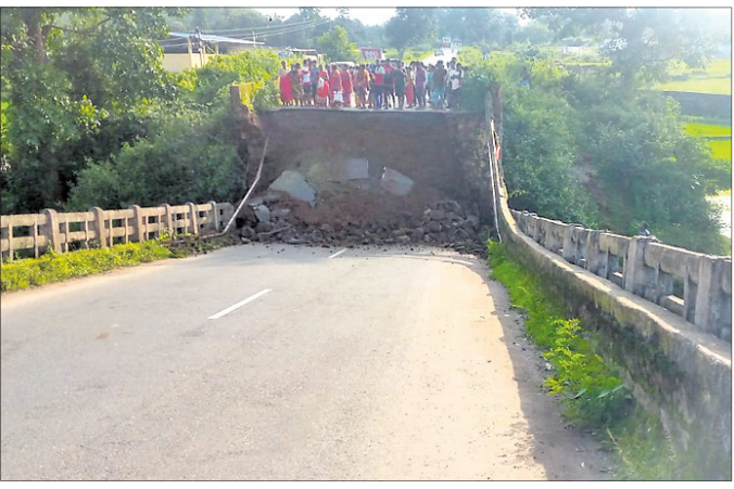
ଭୁଣ୍ଡୁଡ଼ିଯିଥିବା ବଙ୍ଗଳାଗୁଡ଼ା ପୋଲ।