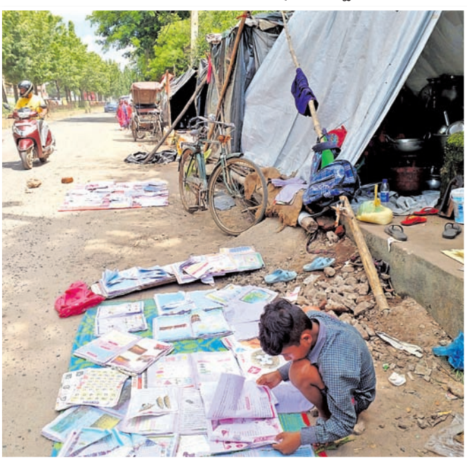
କଟକ ଖାନନଗର ଅଞ୍ଚଳରେ ବନ୍ୟାଜଳରେ ଭିଜିଯାଇଥିବା ବନ୍ଦୀଖାତ୍ୟକୁ କଣେ ଶିଶୁ ଖବର ଶୁଣାଉଛନ୍ତି।