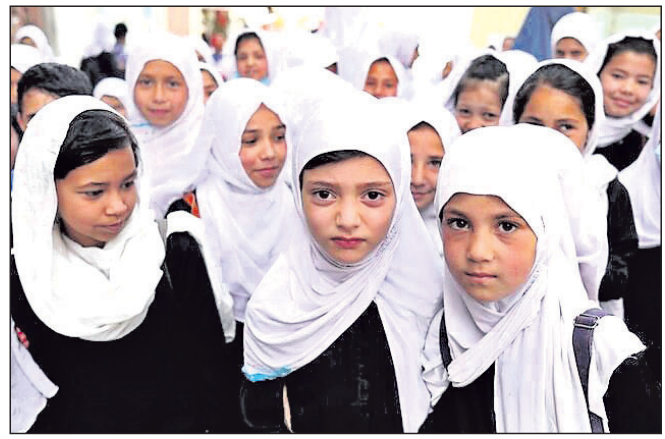
କାବୁଲର ଏକ ପ୍ରାଥମିକ ସ୍କୁଲରେ ଆଫଗାନ ଛାତ୍ରୀ ।

କାବୁଲ, ୧୬। ବର୍ଷକ ତଳେ ଆଫଗାନିସ୍ତାନର ଦୁର୍ଦ୍ଦଶ ଆତଙ୍କବାଦୀ ସଙ୍ଗଠନ ତାଲିବାନ୍ କାବୁଲ ଦଖଲ କରିଥିଲା ।