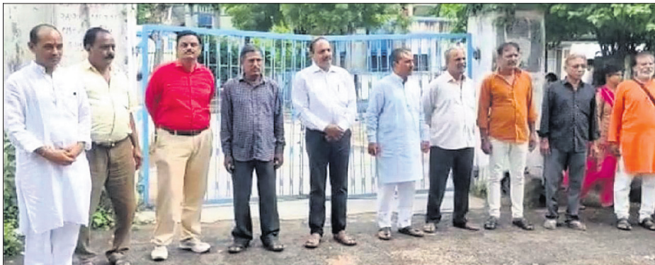
ଗୁଜରାଟ ସରକାରଙ୍କ ଦ୍ଵାରା ଜେଲରୁ ଛାଡ଼ି ପାଇଥିବା ବଳାକାରୀମାନେ।