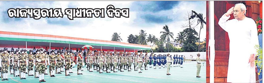
ଭୁବନେଶ୍ୱର ଯୁନିଟ୍-୩ରୁ ପ୍ରଦର୍ଶନୀ ପଡ଼ିଆରେ ସୋମବାର ଆୟୋଜିତ ୭୭ତମ ସ୍ୱାଧୀନତା ଦିବସ କାର୍ଯ୍ୟକ୍ରମରେ ମୁଖ୍ୟମନ୍ତ୍ରୀ ନବୀନ ପଟ୍ଟନାୟକ ପରେ ଅଭିଭାବନ ଗ୍ରହଣ କରୁଛନ୍ତି।