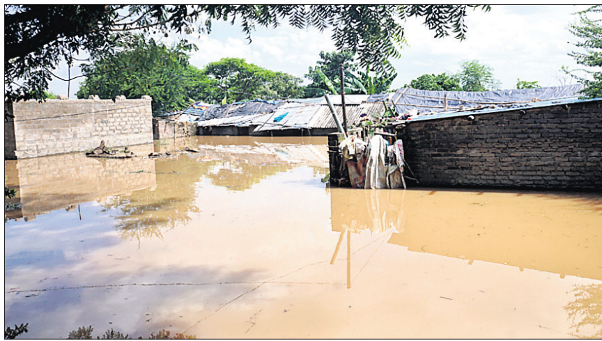
ଖାନ୍ନଗର କାଠଯୋଡି ନଦୀ ପାର୍ଶ୍ୱରୁ ଘରେ ପଶିଥିବା ବନ୍ୟାଜଳ ।