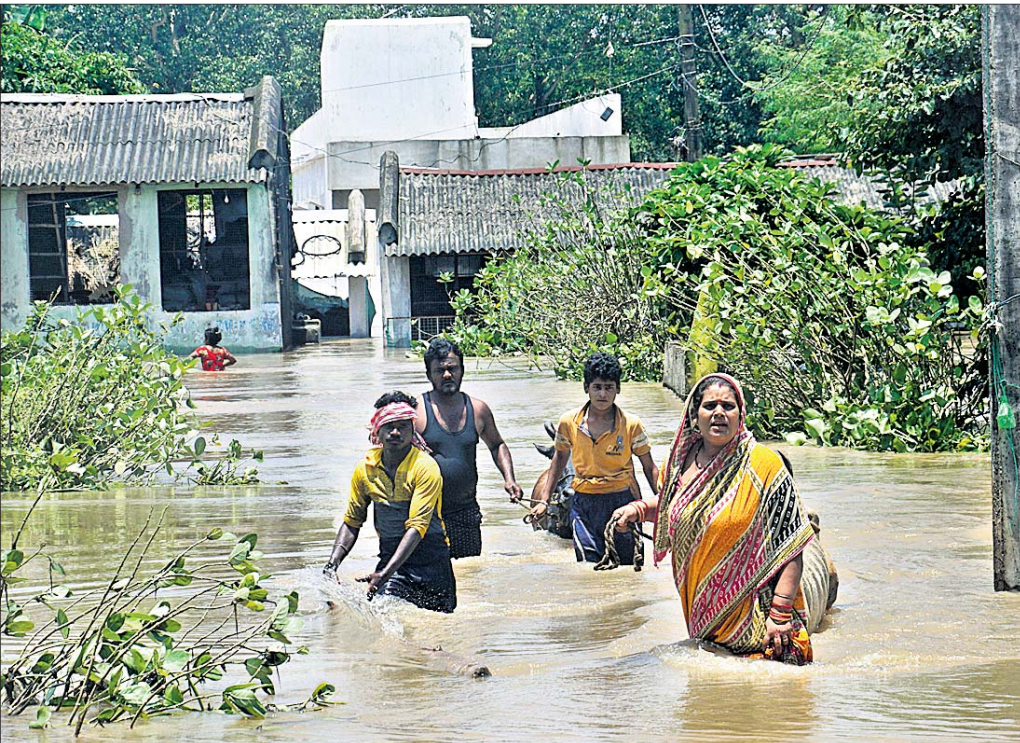
ମହାନଦୀ ବନ୍ୟାଜଳ ଘେରରେ ରହିଥିବା କଟକ ଗତିରାଉତପାଟଣା ଅଞ୍ଚଳ

ଭୁବନେଶ୍ୱର, ୧୬୮ (ବୁଧବେଳା) ■ ବହୁ ଗ୍ରାମ ଜଳବନ୍ଧା, ଚାଷକର୍ମୀ ଜଳମଗ୍ନ ■ ୩ ଜିଲ୍ଲାର ପ୍ରଭାବିତ ଅଞ୍ଚଳ ଷ୍ଟିଲ୍ ୨ ଦିନ ଛୁଟି ■ ୧୮ରେ ଆଉ ଏକ ଲଘୁଗାପ ■ ହାରାକୃତର ୪୦ ଗେଟ୍ ଖୋଲିଲା ■ ଆହୁରି ଭୟଙ୍କର ହେବ ମହାନଦୀ ବନ୍ୟା ହେଉଛି। ଦୟା ଓ ରାଜୁଆ ନଦୀର ମଧ୍ୟବର୍ତ୍ତୀ ଅଞ୍ଚଳ ଦୋଳଦା, ଗଡ଼ବଳଭଦ୍ରପୁର, ବଡ଼ାସ ପଞ୍ଚାୟତର ଧାନ କ୍ଷତି ବୁଡ଼ିଯାଇଛି। ଜଗତସିଂହପୁର ଜିଲ୍ଲା କୁଜଙ୍ଗ ବ୍ଲକର ବଡ଼ବାଲିକଣିଠାରେ ମହାନଦୀରେ ୧୦୦୦ଟି ଘାଇ ହୋଇଛି। ଜିଲ୍ଲାବାସୀ ପଞ୍ଚାୟତର ତେକୁଳିଆଖମାର ଓ ସାହାରାଡିଆରେ ମଧ୍ୟ ଘାଇ ସୃଷ୍ଟି ହୋଇଛି। ବନ୍ୟା ଯୋଗୁଁ ବିଭିନ୍ନ ଗ୍ରାମ ଓ ଚାଷ କ୍ଷତି ଜଳମଗ୍ନ ହୋଇଛି। ଜିଲ୍ଲାର ୮୦୯ ଗ୍ରାମର ପ୍ରାୟ ୫ ହଜାର ଲୋକ ପ୍ରଭାବିତ ହୋଇଥିବା ଜିଲ୍ଲା ପ୍ରଶାସନ ପକ୍ଷରୁ ସୂଚନା ଦିଆଯାଇଛି। ଅନ୍ୟପକ୍ଷରେ ହାରାକୃତ ତ୍ୟାମର ଆଉ ୧୪ଟି ଗେଟ୍ ଖୋଲାହେବା ପରେ ପରିସ୍ଥିତି ଆହୁରି ସଜ୍ଜିନ ହୋଇ ପଡ଼ିଛି। ସୋମବାର ୨୬ଟି ଗେଟ୍ ଦେଇ ବନ୍ୟାଜଳ ନିଷ୍ଠାସନ ହେଉଥିବା ବେଳେ ମଙ୍ଗଳବାର ପୁଷ୍ପା-୪