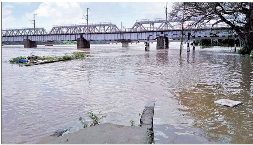
କଟକ ଶିଖରପୁର ରେଳଠେଟ୍ରିକ୍ ବାଲପାୟ ରାସ୍ତାରେ ପ୍ରବାହିତ ବନ୍ୟାଜଳ ।