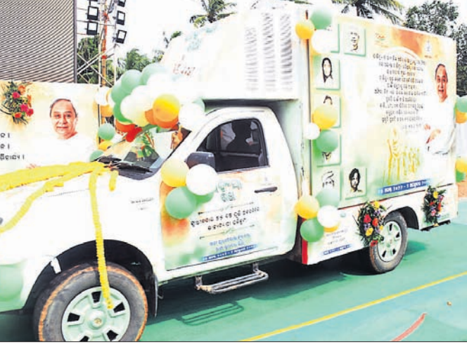
ଭୁବନେଶ୍ୱର ପ୍ରଦର୍ଶନୀ ପଡ଼ିଆରେ ଅହିଂସା ରଥ ଗାଡ଼ିର ଶୁଭାରମ୍ଭ ହୋଇଛି।