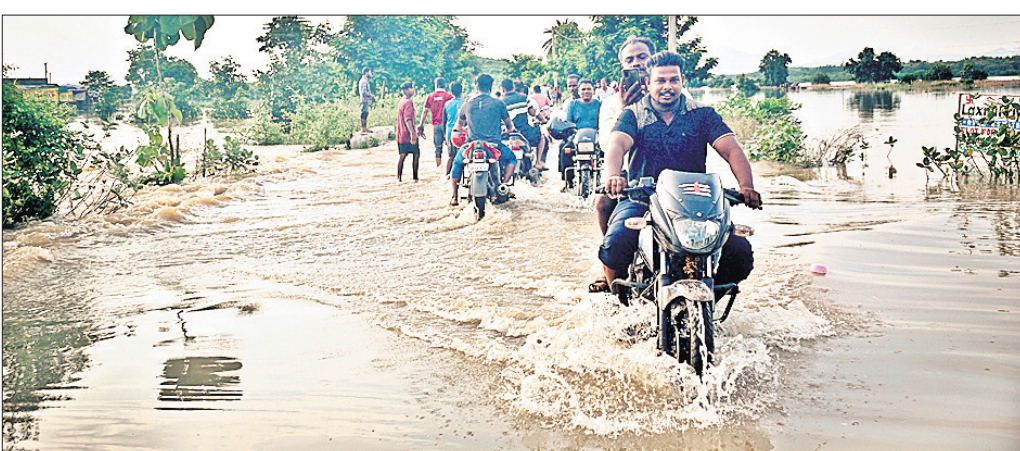
ନୂଆପାଟଣାରୁ ଧବଳେଶ୍ୱର ଯିବା ମୁଖ୍ୟ ରାସ୍ତାରେ ବନ୍ୟାପାଣିର ସୁଅ ।