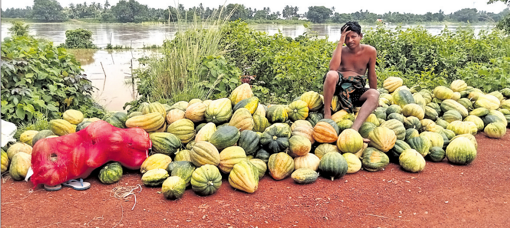
ବନ୍ୟା ଜଳରେ କଖାଳୁ ଫସଲ ନଷ୍ଟ ହୋଇ ଚାଷୀ ମୁଣ୍ଡରେ ହାତ ଦେଇ ବସିଛନ୍ତି।