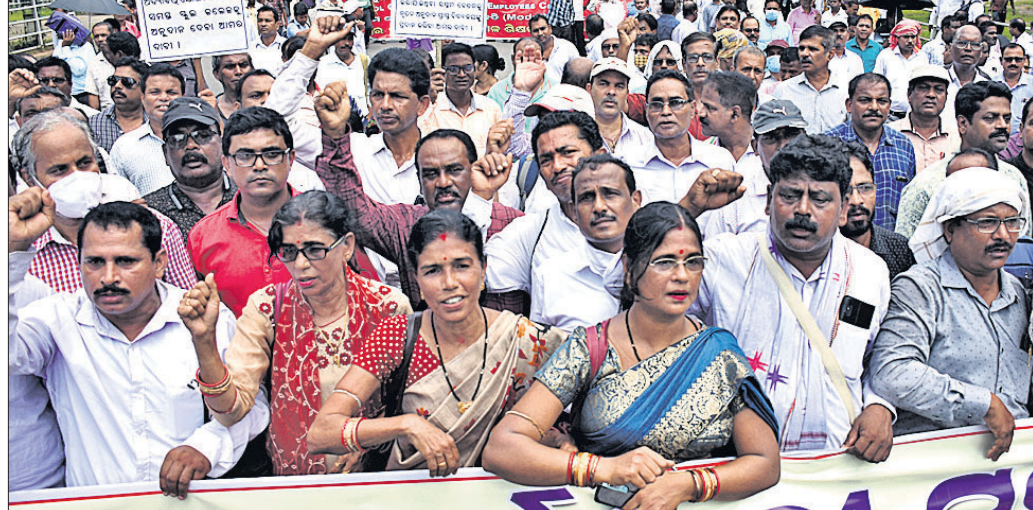
ଲୋଘର ପିଏମ୍‌ଜିଠାରେ ଓଡ଼ିଶା ସ୍କୁଲ କଲେଜ ଶିକ୍ଷକ କର୍ମଚାରୀ ସମନ୍ୱୟ ସମିତି ପକ୍ଷରୁ ବିକ୍ଷୋଭ ପ୍ରଦର୍ଶନ।

ପ୍ରାଥମିକ ଶିକ୍ଷକ ଫେଡେରେଶନ୍, ମହାସଂଘ, ଗଣ ଶିକ୍ଷକ ମଙ୍ଗଳବାର ଓଡ଼ିଶା ସ୍କୁଲ କଲେଜ ଶିକ୍ଷକ କର୍ମଚାରୀ ସମନ୍ୱୟ ସମିତି ଆନୁଷ୍ଠାନିକରେ ରାଜ୍ୟର ସମସ୍ତ ଶିକ୍ଷକ ସଙ୍ଗଠନମାନେ ଏକତ୍ର ହୋଇଥିଲେ। ମୁଖ୍ୟତଃ ୩ଟି ଦାବିକୁ ନେଇ ଲୋଘର ପିଏମ୍‌ଜିଠାରେ ସମାବେଶ ଓ ବିକ୍ଷୋଭ ପ୍ରଦର୍ଶନ ସ ପ୍ରତିବାଦ ସଭା କରିଥିଲେ। ଏହି ସଭାରେ ଓଡ଼ିଶା ମାଧ୍ୟମିକ ସ୍କୁଲ ଶିକ୍ଷକ ସଂଘ (ଓଷ୍ଟି), ନିଷ୍ଠୁଳ ଉତ୍କଳ ନିମ୍ନ ମାଧ୍ୟମିକ ଶିକ୍ଷକ ସଂଘ (ଓଲ୍‌ସ୍ଟି), ପ୍ରାଥମିକ ଶିକ୍ଷକ ସଂଘ, ଗଣ ଶିକ୍ଷକ ମଙ୍ଗଳବାର ଓଡ଼ିଶା ସ୍କୁଲ କଲେଜ ଶିକ୍ଷକ କର୍ମଚାରୀ ସମନ୍ୱୟ ସମିତି ଆନୁଷ୍ଠାନିକରେ ରାଜ୍ୟର ସମସ୍ତ ଶିକ୍ଷକ ସଙ୍ଗଠନମାନେ ଏକତ୍ର ହୋଇଥିଲେ। ମୁଖ୍ୟତଃ ୩ଟି ଦାବିକୁ ନେଇ ଲୋଘର ପିଏମ୍‌ଜିଠାରେ ସମାବେଶ ଓ ବିକ୍ଷୋଭ ପ୍ରଦର୍ଶନ ସ ପ୍ରତିବାଦ ସଭା କରିଥିଲେ। ଏହି ସଭାରେ ଓଡ଼ିଶା ମାଧ୍ୟମିକ ସ୍କୁଲ ଶିକ୍ଷକ ସଂଘ (ଓଷ୍ଟି), ନିଷ୍ଠୁଳ ଉତ୍କଳ ନିମ୍ନ ମାଧ୍ୟମିକ ଶିକ୍ଷକ ସଂଘ (ଓଲ୍‌ସ୍ଟି),