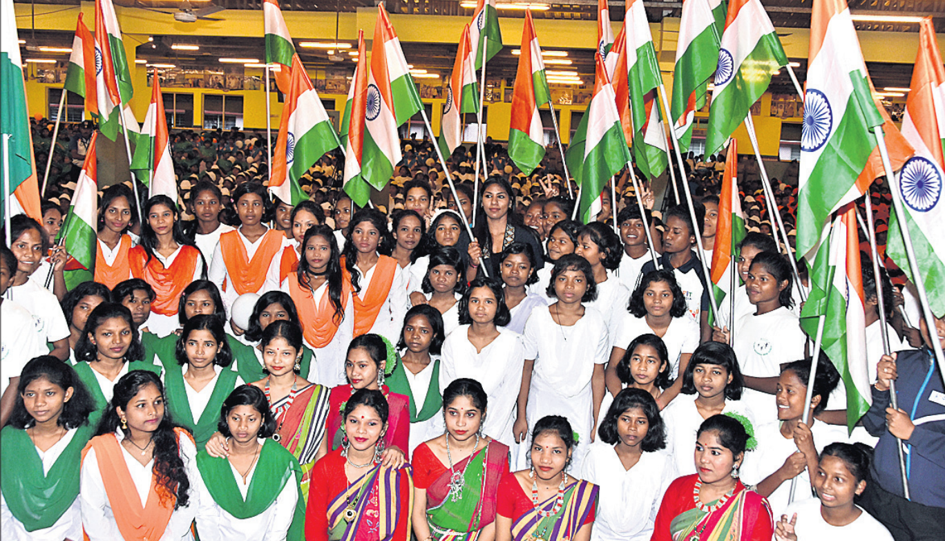
ସ୍ୱାଧୀନତା ଦିବସ ପୂର୍ତ୍ତି ଅବସରରେ ଦେଶବାସୀ ପାଳିତ ହେଉଥିବା ଅନୁତମ ମହୋତ୍ସବ ଉପଲକ୍ଷେ ରବିବାର ଭୁବନେଶ୍ୱରସ୍ଥିତ ଜନଜାତି ଶିକ୍ଷାନୁଷ୍ଠାନ କିମ୍ବ ପରିସରରେ ୩୦୫ଜଣ ଛାତ୍ରାଛାତ୍ରୀ ତ୍ରିରଙ୍ଗା ଉଡ଼ାଇ ଅନୁତମ ମହୋତ୍ସବ ପାଳନ କରୁଛନ୍ତି।