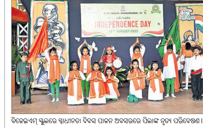
ବିକେଶ୍ୱରୀ ସ୍କୁଲରେ ସ୍ୱାଧୀନତା ଦିବସ ପାଳନ ଅବସରରେ ପିଲାଙ୍କ ନୃତ୍ୟ ପରିବେଷଣ।