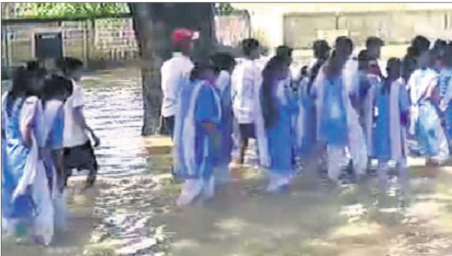
ଛାତ୍ରୀଛାତ୍ର ବନ୍ୟାପାଣିରେ ପଶି ସ୍କୁଲକୁ ଯାଉଛନ୍ତି ।