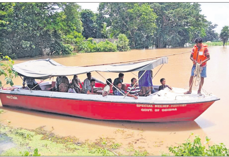
କେନ୍ଦ୍ରାପଡ଼ା ଜିଲ୍ଲା ମାର୍ଗାଦାନ ବ୍ଲକ୍ ଯୋଗାଯୋଗ ନିକଟରୁ ଲୋକଙ୍କୁ ଉଦ୍ଧାର କରାଯାଉଛି ।