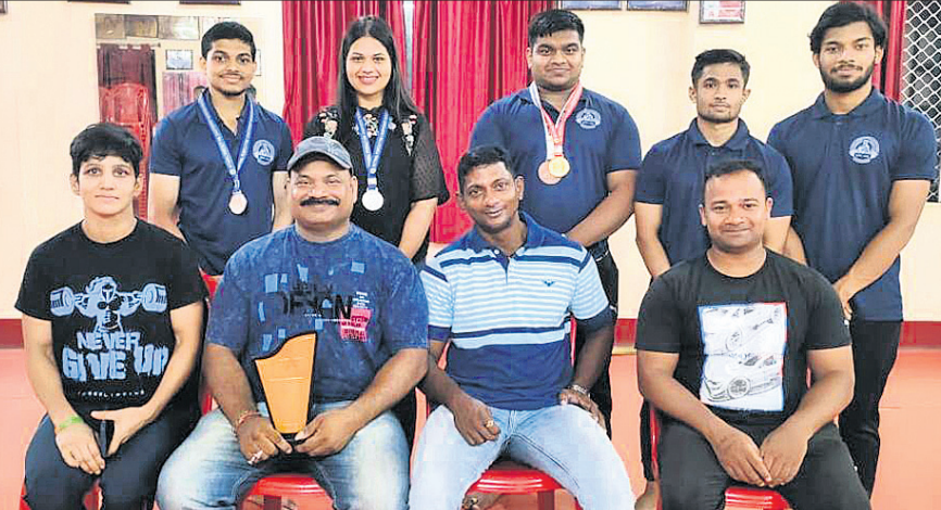
ଜାତୀୟ ଶକ୍ତିଭୋଜନରେ ସଫଳତା ଅର୍ଜନ କରିଥିବା ଓଡ଼ିଶା ଦଳ।

ନୂଆଦିଲ୍ଲୀ, ୧୭୮୮ (ପି.ଟି.) ହକି ଇଣ୍ଡିଆ ପକ୍ଷରୁ ଆସନ୍ତା ୯ ଅଲ୍ଟ୍ରାବର ସୁଦ୍ଧା ଏହାର ନିର୍ବାଚନ ପ୍ରକ୍ରିୟା ସମ୍ପୂର୍ଣ୍ଣ କରାଯିବ। ରୂପବାର କମିଟି ଅଫ୍ ଆଡମିନିଷ୍ଟ୍ରେସନ୍ (ସିଓଏ) ପକ୍ଷରୁ ଅନ୍ତର୍ଜାତୀୟ ହକି ଫେଡେରେଶନ (ଏଫଆଇଏବ୍) ନିକଟରେ ନୂତନ ସଭ୍ୟାଧୀନ ପ୍ରଥମ ଅନୁଷ୍ଠାନ ଉଦ୍ଘାଟନ କରାଯିବା ପରେ ଏହା ସ୍ପଷ୍ଟ ହୋଇଛି। ଏହା ପରେ ଉଭୟ ଏଫଆଇଏବ୍ ଏବଂ ସିଓଏ ପକ୍ଷରୁ ଏକ ମିଳିତ ବିବୃତ୍ତି ଜାରି କରାଯାଇଛି। ଆସନ୍ତା ୧୦ ଦିନ ମଧ୍ୟରେ ସିଓଏ ପକ୍ଷରୁ ସମ୍ପୂର୍ଣ୍ଣ ସଭ୍ୟାଧୀନ ଲାଭସାଧନେ ଶୀଘ୍ର ଏଫଆଇଏବ୍ ପକ୍ଷ କାର୍ଯ୍ୟାଳୟରେ ଦାଖଲ କରିବା ନେଇ ମଧ୍ୟ ପ୍ରତିଶ୍ରୁତି ପ୍ରଦାନ କରାଯାଇଛି। ଦିଲ୍ଲୀ ହାଇକୋର୍ଟଙ୍କ ନିର୍ଦ୍ଦେଶ ଅନୁସାରେ ହକି ଇଣ୍ଡିଆର ସଂଶୋଧିତ ସଭ୍ୟାଧୀନ ଉଭୟ ଏଫଆଇଏବ୍ ଏବଂ ସିଓଏ ନିକଟରେ ଦାଖଲ କରାଯାଇଥିଲା। ଏହା ସହିତ ଉଭୟ ପକ୍ଷରୁ ସହମତି କ୍ରମେ ଅଲ୍ଟ୍ରାବର ୯ ଚାରିଖ ସୁଦ୍ଧା ନିର୍ବାଚନ ପ୍ରକ୍ରିୟା ସମ୍ପୂର୍ଣ୍ଣ କରିବାକୁ ଯୋଷଣା କରାଯାଇଥିଲା। ଏଫଆଇଏବ୍ ପକ୍ଷରୁ ଜଣାପଡିଥିବା ପ୍ରତିନିଧି ଦଳ ଦିଲ୍ଲୀ ଗ୍ରୁପ୍ କରିବା ସହିତ ହକି ଇଣ୍ଡିଆ ଓ ସିଓଏ ସହିତ ଆଲୋଚନା କରିଥିଲେ। ତେବେ ହକି ଇଣ୍ଡିଆ ପାଇଁ ଖୁସି ଖବର ଏହା କି, ଏଫଆଇଏବ୍ କୋର୍ଟରୁ ତୃତୀୟ ପକ୍ଷ ଭାବରେ ବିଚାର କରୁନାହିଁ। ଏହା ସହିତ ଭୁବନେଶ୍ୱର ଏବଂ ରାଉରକେଲାରେ ହେବାକୁ ଥିବା ବିଶ୍ୱକପ୍ ମାତ୍ର କିଛି ମାସ ବାକି ରହିଥିବା ବେଳେ ଏହା ପ୍ରଭାବିତ