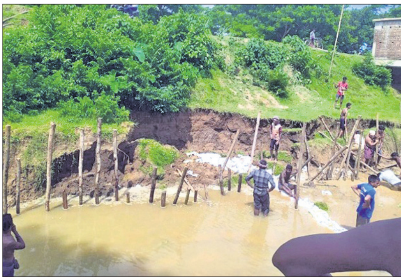
ଗରଦପୁର ବ୍ଲକ୍ ବଟିରା ଗ୍ରାମ ନିକଟରେ ପାଇକା ନଦୀ ବନ୍ଧରେ ହୋଇଥିବା ଘଳିଆ ମରାମତି କରାଯାଉଛି ।