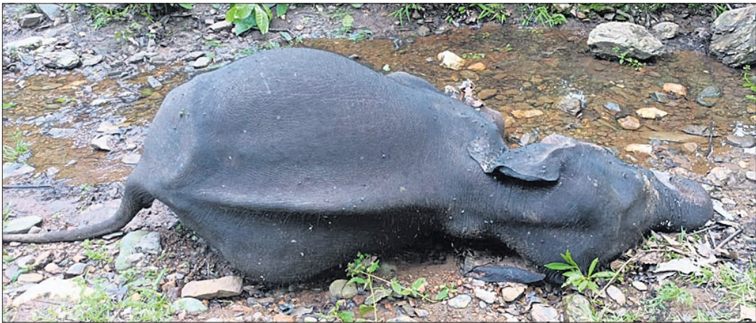
ହାତୀର ମୁତଦେହ ।

ବଣାଇ, ୧୭।୮(ସ.ପ୍ର.) ସୁନ୍ଦରଗଡ଼ ଜିଲ୍ଲା ବଣାଇ ବନଖଣ୍ଡ ତାମଡା ରେଞ୍ଜ କୁସୁମଡ଼ିହି ସେକ୍ସନର