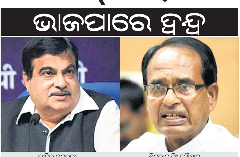
ନୀତିନ ଗଡ଼ଜାରୀ ଶିବରାଜ ସିଂ ଚୌହାନ

ଉପମୁଖ୍ୟମନ୍ତ୍ରୀ ଦେବେନ୍ଦ୍ର ଫଡ଼ନବିସ ଏବଂ କେନ୍ଦ୍ର ପରିବେଶ, ଜଳାଳ ଓ ଜଳବାୟୁ ପରିବର୍ତ୍ତନ ସମ୍ପର୍କୀୟ ଯାବତଙ୍କୁ ଏଥିରେ ନୂଆକରି ସାମିଲ କରାଯାଇଛି। ସଡ଼କ ପରିବହନ ଓ ଜାହାଜ ଚଳାଚଳ ମନ୍ତ୍ରୀ ଗଡ଼ଜାରୀଙ୍କ ସହ ଶିବରାଜଙ୍କୁ ବାହାର କରାଯିବା ପରେ ଉଭୟେ ସିଇସି ସଦସ୍ୟତା ମଧ୍ୟ ହରାଇଛନ୍ତି। ସଂସଦୀୟ ବୋର୍ଡର ଅନ୍ୟ ସଦସ୍ୟ ପ୍ରଧାନମନ୍ତ୍ରୀ ନରେନ୍ଦ୍ର ମୋଦି, ଶ୍ରୀରାମ ମନ୍ତ୍ରୀ ଅମିତ ଶାହା ଏବଂ ଭାଜପା ରାଷ୍ଟ୍ରପତି ଅଧ୍ୟକ୍ଷ ଜେ.ପି. ନକ୍ସା ସ୍ୱତନ୍ତ୍ର ସିଇସିରେ ସାମିଲ ହୋଇଥିବାବେଳେ ଅତିରିକ୍ତ ଭାବେ ଆଉ କେତେଜଣଙ୍କୁ ଏଥିରେ ମିଶାଯାଇଛି। ଅନ୍ୟ ନୂଆ ସଦସ୍ୟମାନେ ହେଲେ କେ. ଲକ୍ଷ୍ମଣ,